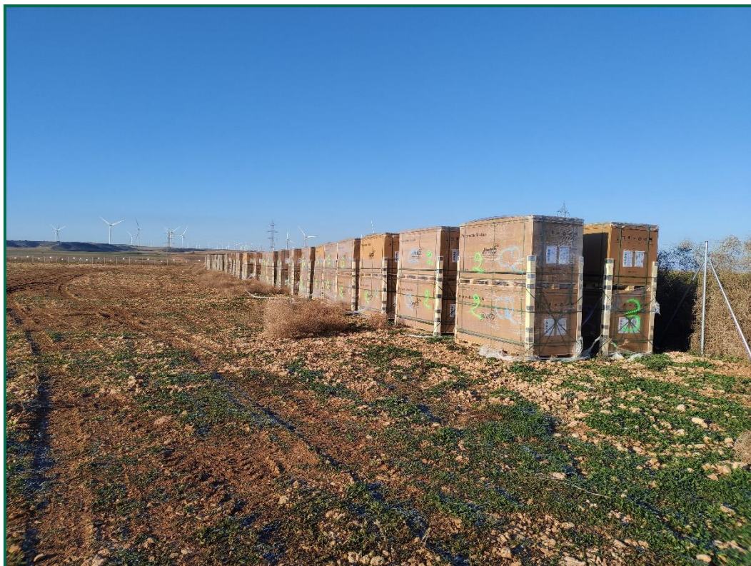
Fotografía 13. Recepción de materiales.