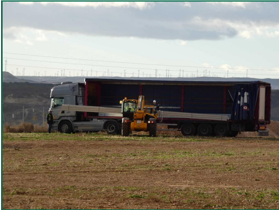
Fotografía 1. Transporte de materiales.