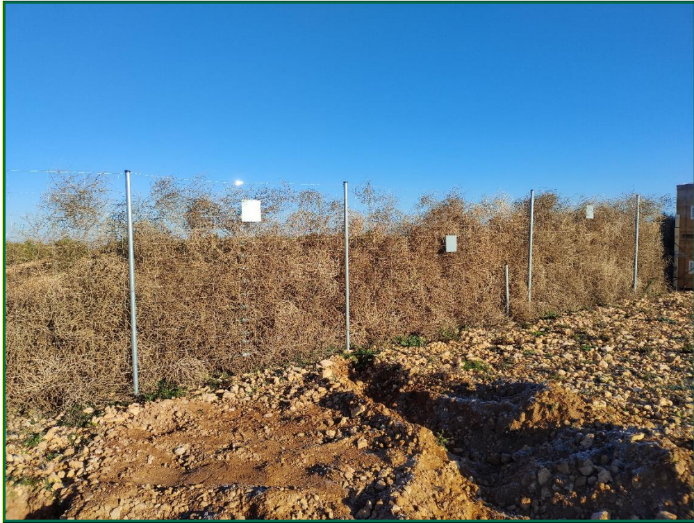
Fotografía 6. Vallado perimetral y placas anticollisión.