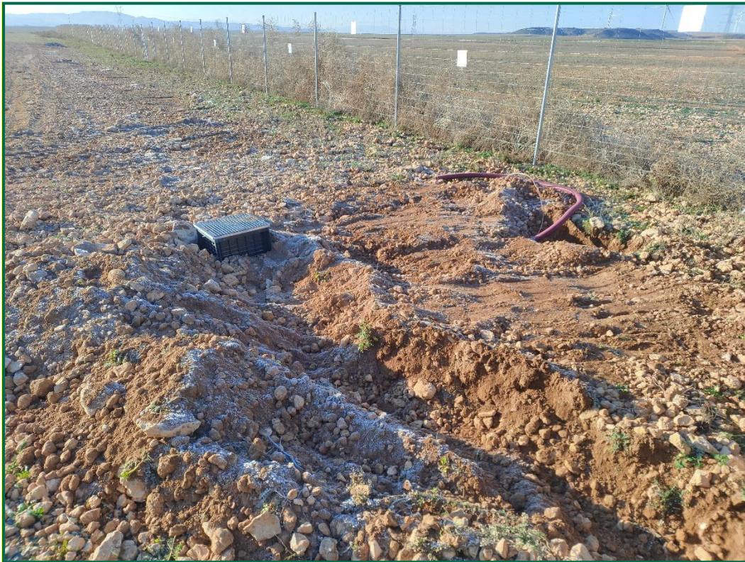
Fotografía 3. Tapado de zanjas.

Por el momento la tierra vegetal extraída ha sido escasa debido a que no ha sido necesario nivelar todo el terreno, únicamente algunas zonas y con un espesor limitado, y esta se ha ido extendiendo sobre el terreno. La tierra extraída para la construcción de balsas de limpieza se ha acopiado en caballones al igual que la tierra retirada para realizar zanjas. En las zonas donde se van a realizar plantaciones para crear una patalla vegetal no se ha realizado ningún movimiento de tierra, conservando la capa de tierra vegetal presente.