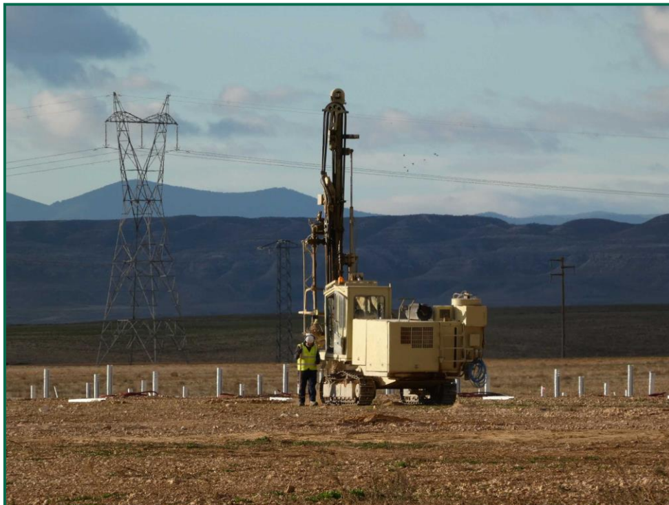
Fotografía 2. Maquinas hincando los postes verticales.