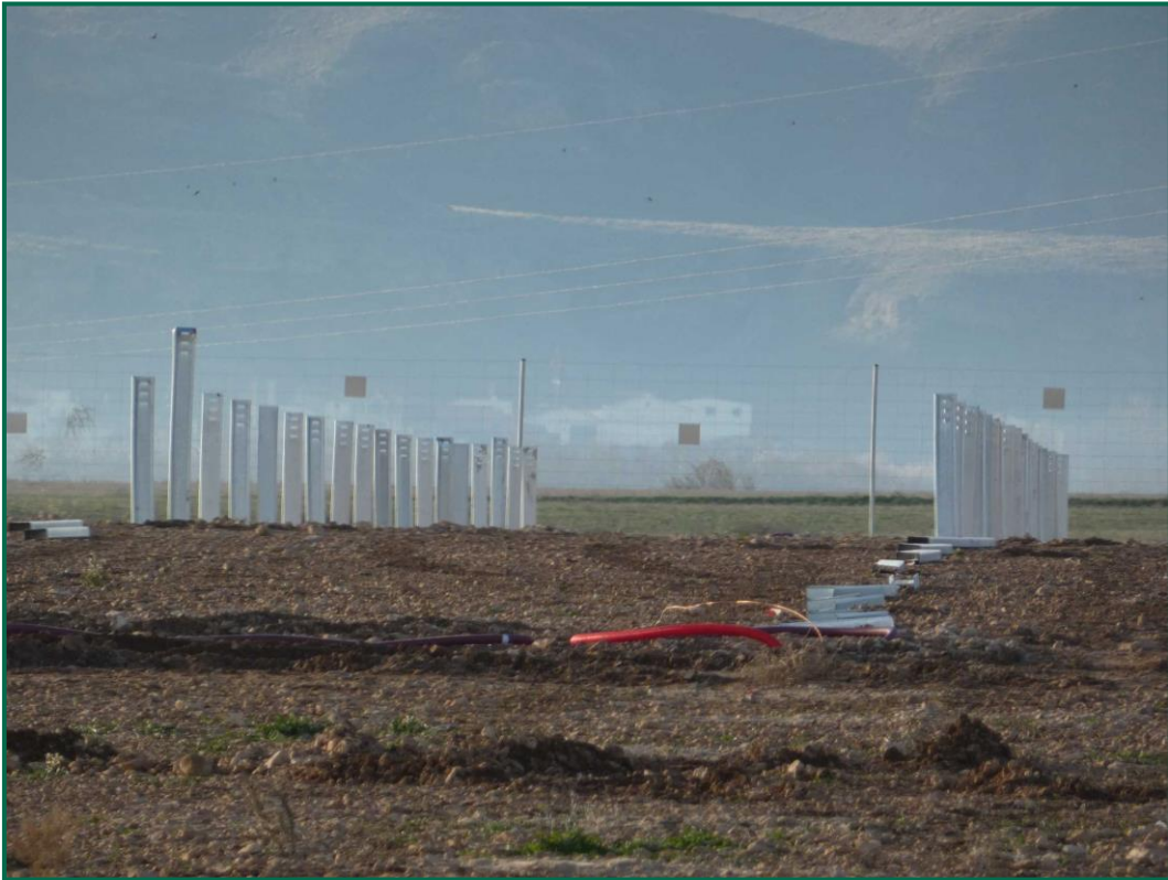
Fotografía 4. Postes verticales para las placas fotovoltaicas.