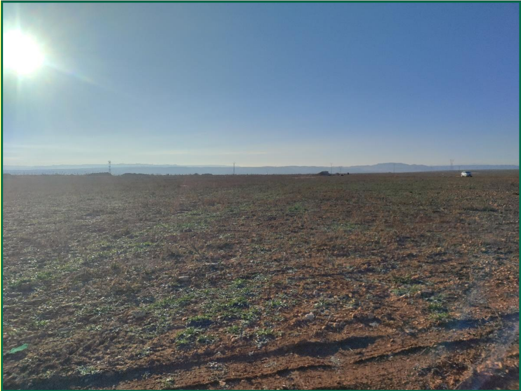
Fotografía 5. Superficie de la planta.