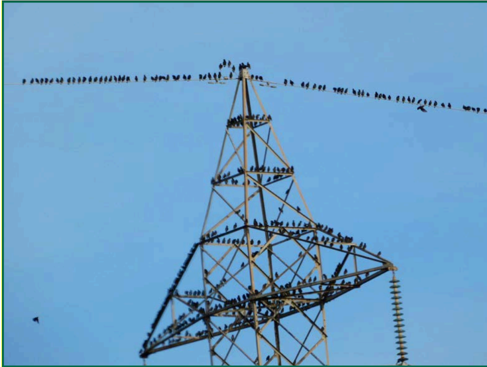
Fotografía 9. Estornino negro ( Sturnus unicolor ).