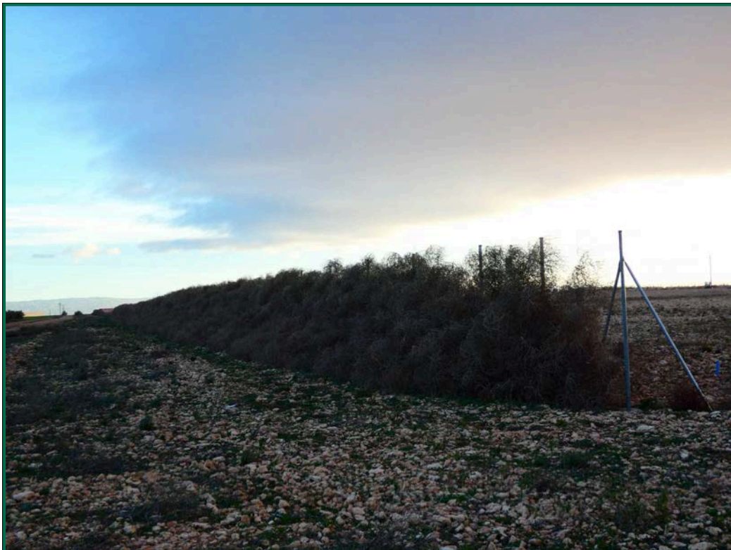
Fotografía 4. Franja vegetal.

Durante las visitas a obra se comprueba que la ocupación de zonas de vegetación se limita a lo aprobado en el proyecto. Se verifica también que la maquinaria circula únicamente por los viales habilitados para tal fin. Desde el inicio de las obras se ha planificado la ejecución de una franja vegetal de 8 m de anchura en torno al futuro vallado perimetral.