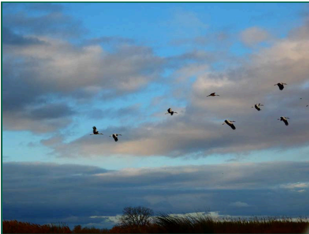
Fotografía 10. Cigüeña blanca ( Ciconia ciconia ).