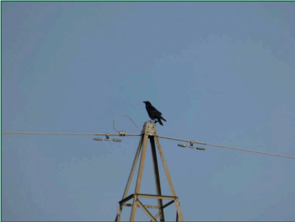
Fotografía 7. Cuervo grande ( Corvus corax ).