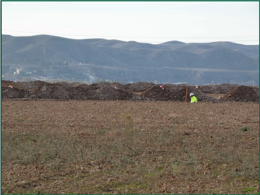
Fotografía 2. Acopios de tierra.