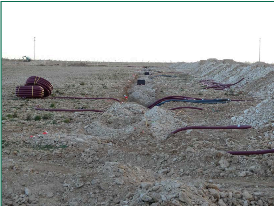
Fotografía 3. Zanjas y colocación de cableado.