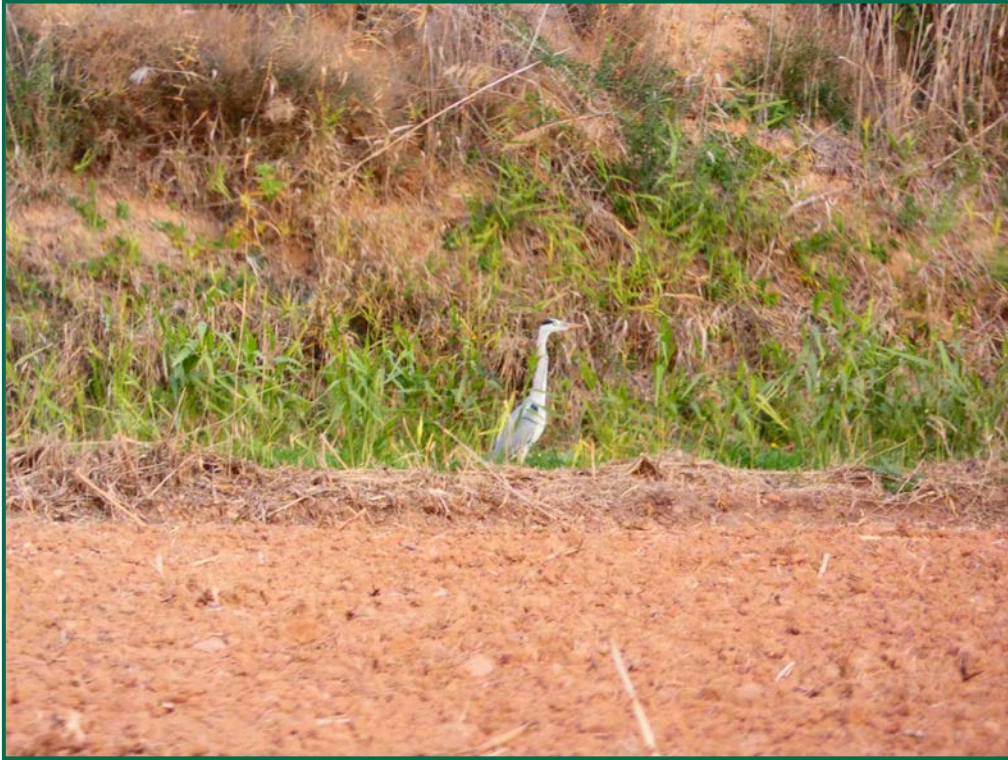
Fotografía 11. Garza real ( Ardea cinerea ).