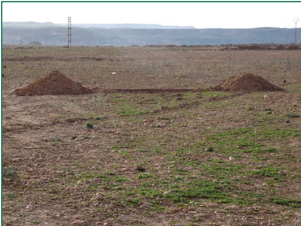
Fotografía 13. Balsa de limpieza.

Se están utilizando grupos electrógenos y se han instalado envases de combustible. Además, se han colocado bandejas de contención debajo de ellos para evitar derrames por pérdidas accidentales sobre el terreno.