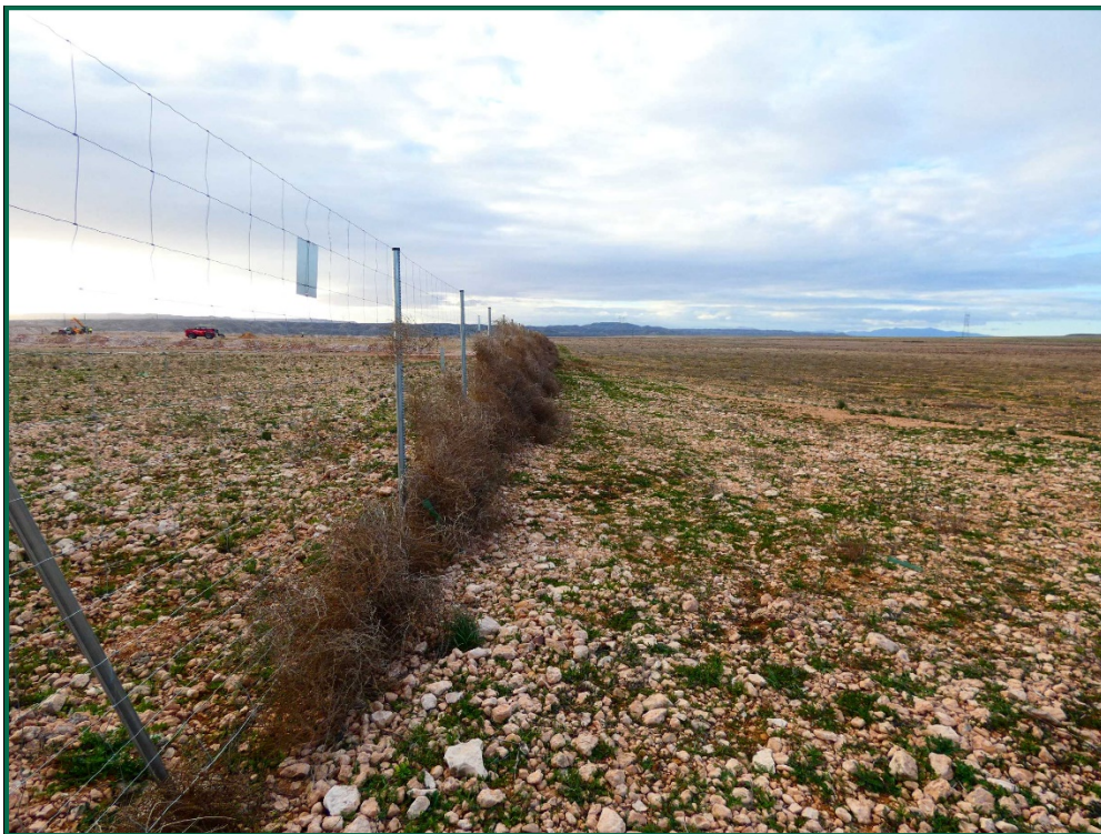
Fotografía 5. Vallado perimetral y placa anticolidión.

El vallado perimetral se ha instalado utilizando malla cinégetica y dejando un espacio de al menos 20 cm desde el suelo. Además se ha dejado un espacio en el vallado para fauna de mayor tamaño. Por otro lado, se han instalado las placas anticolidión a diferentes alturas sobre la malla.