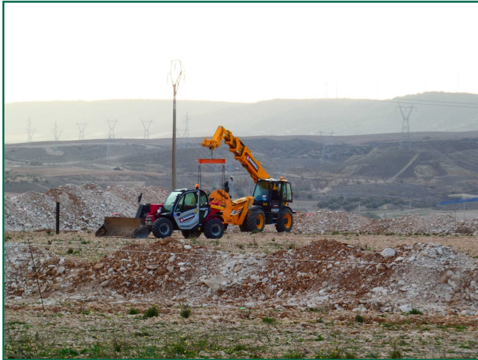
Fotografía 1. Maquinaria de construcción.