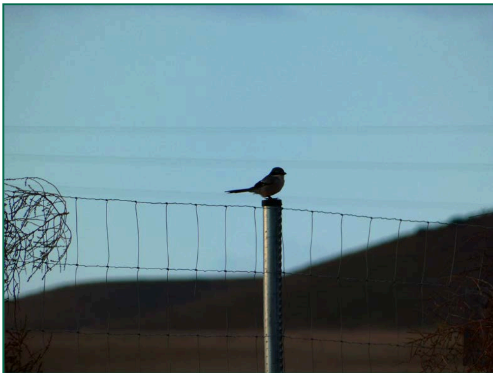
Fotografía 8. Alcaudón real ( Lanius meridionalis ).