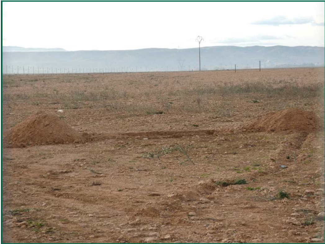
Fotografía 18. Balsa de limpieza.