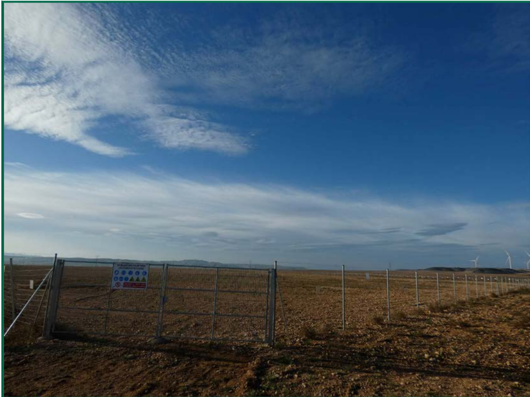
Fotografía 2. Superficie de la planta.