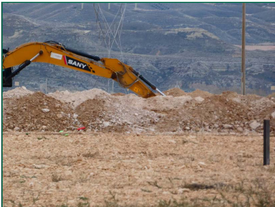
Fotografía 3. Acopios de tierra.