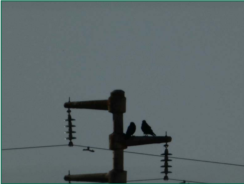
Fotografía 11. Cuervo grande ( Corvus corax ).