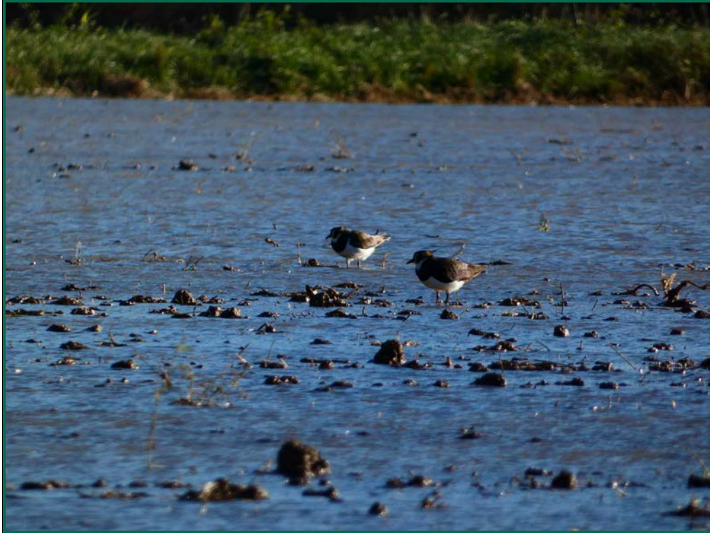
Fotografía 15. Avefría europea ( Vanellus vanellus ).