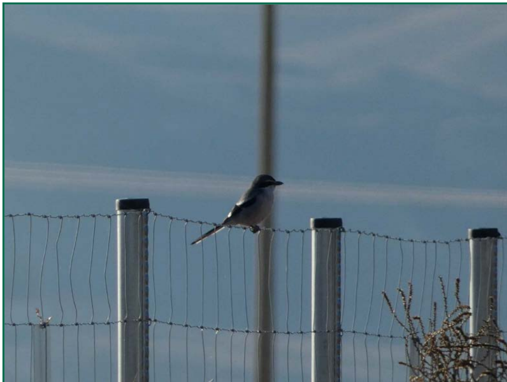
Fotografía 12. Alcaudón real ( Lanius meridionalis ).