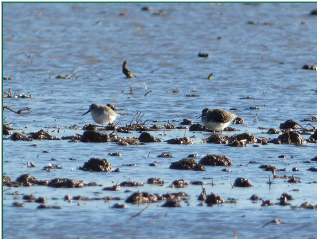
Fotografía 14. Andarrios grande ( Tringa achropus ).