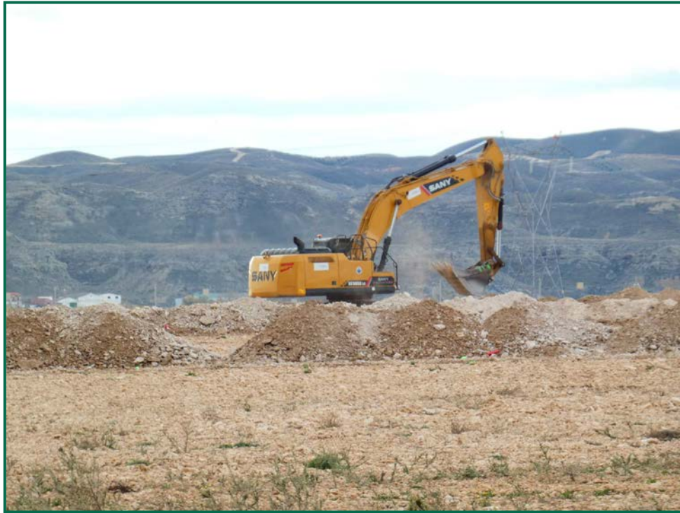
Fotografía 1. Maquinaria de construcción.