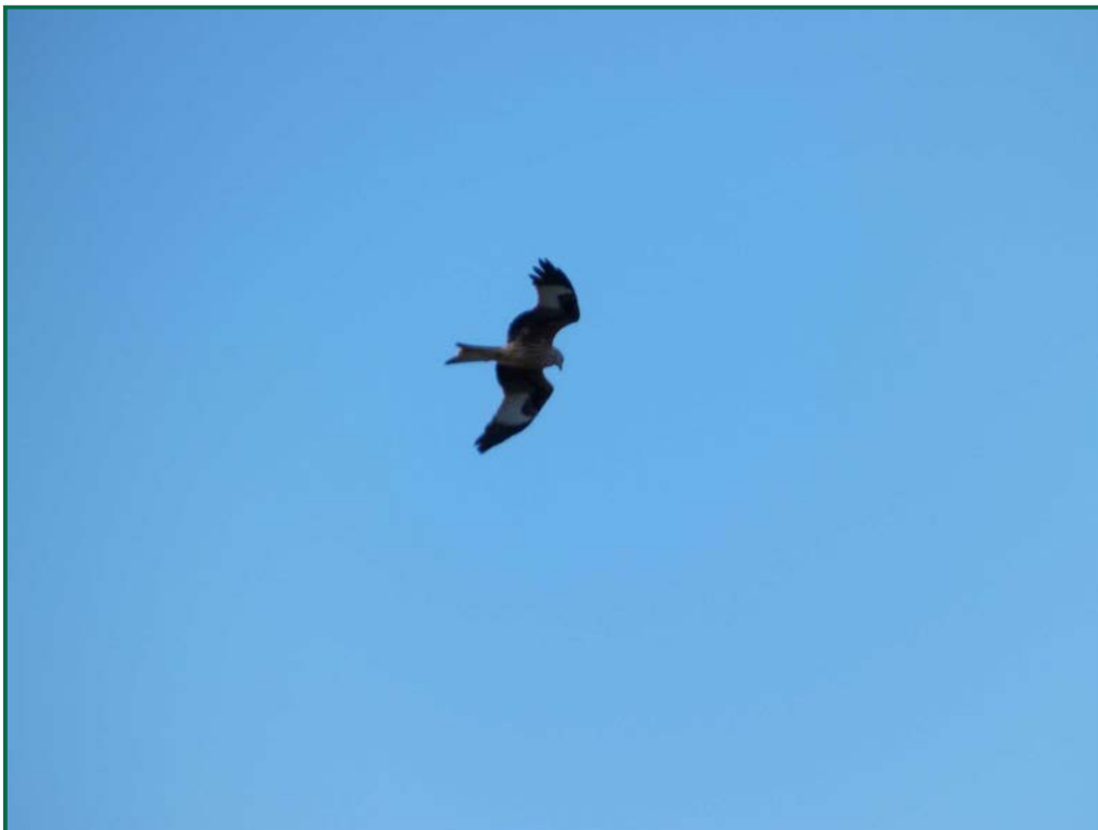
Fotografía 10. Milano real ( Milvus milvus ).