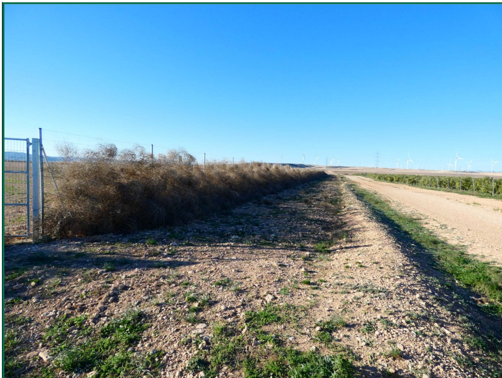
Fotografía 4. Franja vegetal.

Durante las visitas a obra se comprueba que la ocupación de zonas de vegetación se limita a lo aprobado en el proyecto. Se verifica también que la maquinaria circula únicamente por los viales habilitados para tal fin. Desde el inicio de las obras se ha planificado la ejecución de una franja vegetal de 8 m de anchura en torno al futuro vallado perimetral.