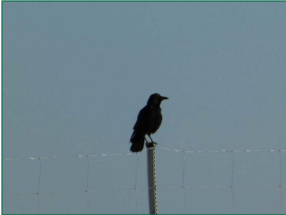
Fotografía 9. Corneja negra ( Corvus corone ).