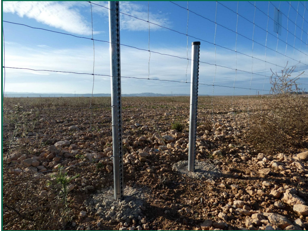
Fotografía 6. Espaciado cinegético.

Se ha realizado seguimiento de avifauna durante el proceso de la obra en el mes de septiembre, y se han avistado las siguientes especies: Cernícalo vulgar ( Falco tinnunculus ), corneja negra ( Corvus corone ), busardo ratonero ( Buteo buteo ), milano real ( Milvus milvus ), cuervo grande ( Corvus corax ), aguilucho lagunero ( Circus aeruginosus ), andarríos grande ( Tringa ochropus ), avefría europea ( Vanellus vanellus ), garza real ( Ardea cinerea ), garceta grande ( Ardea alba ) y otras especies de menor tamaño como son el alcaudón real ( Lanius meridionalis ), collalba gris ( Oenanthe oenanthe ) y estornino negro ( Sturnus unicolor ).