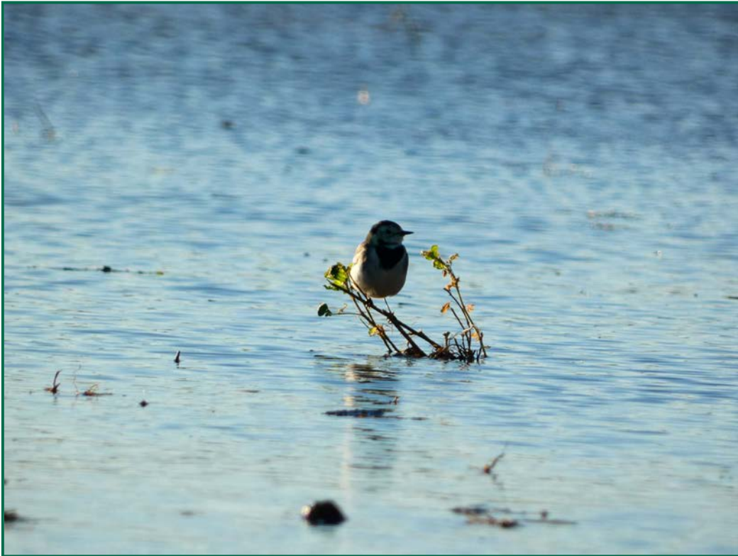
Fotografía 7. Collalba gris ( Oenanthe oenanthe ).