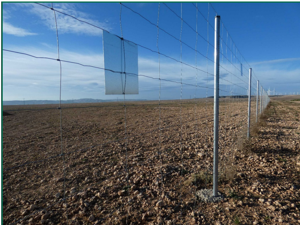
Fotografía 5. Vallado perimetral y placa anticolidión.

El vallado perimetral se ha instalado utilizando malla cinégetica y dejando un espacio de al menos 20 cm desde el suelo. Además se ha dejado un espacio en el vallado para fauna de mayor tamaño. Por otro lado, se han instalado las placas anticolidión a diferentes alturas sobre la malla.