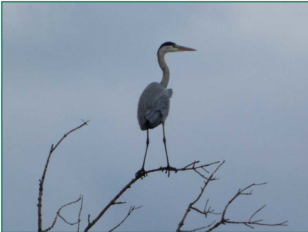
Fotografía 16. Garza real ( Ardea cinerea ).