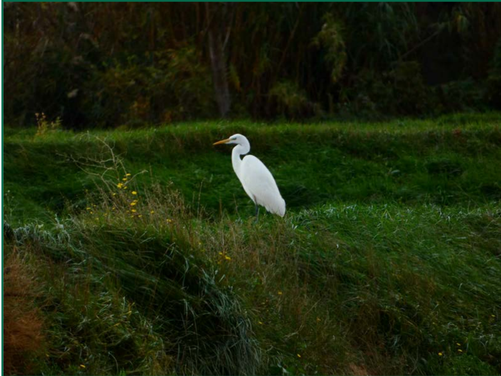
Fotografía 17. Garceta grande ( Ardea alba ).