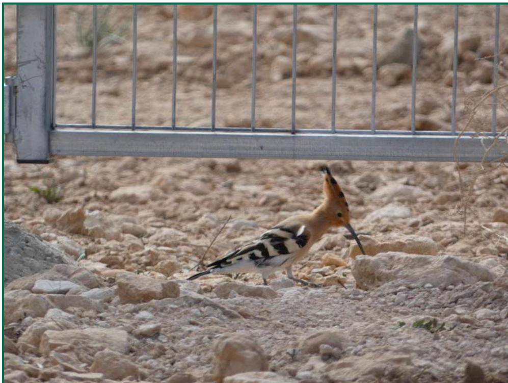
Fotografía 11. Abubilla común ( Upupa epops ).