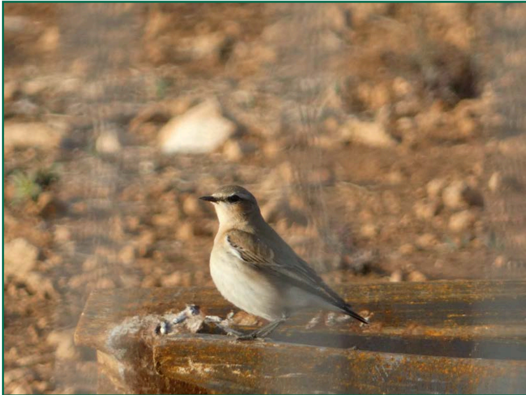
Fotografía 6. Collalba gris ( Oenanthe oenanthe ).