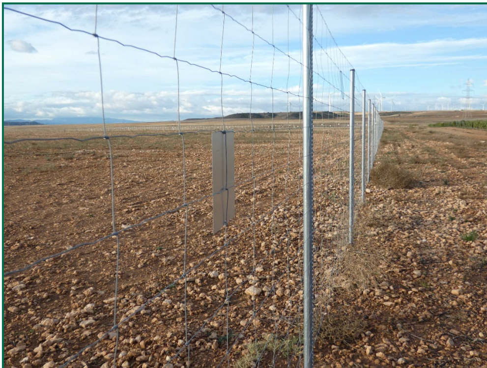
Fotografía 4. Vallado perimetral y placa anticolidión.

El vallado perimetral se ha instalado utilizando malla cingética y dejando un espacio de al menos 20 cm desde el suelo. Además se ha dejado un espacio en el vallado para fauna de mayor tamaño. Por otro lado, se han instalado las placas anticolidión a diferentes alturas sobre la malla.