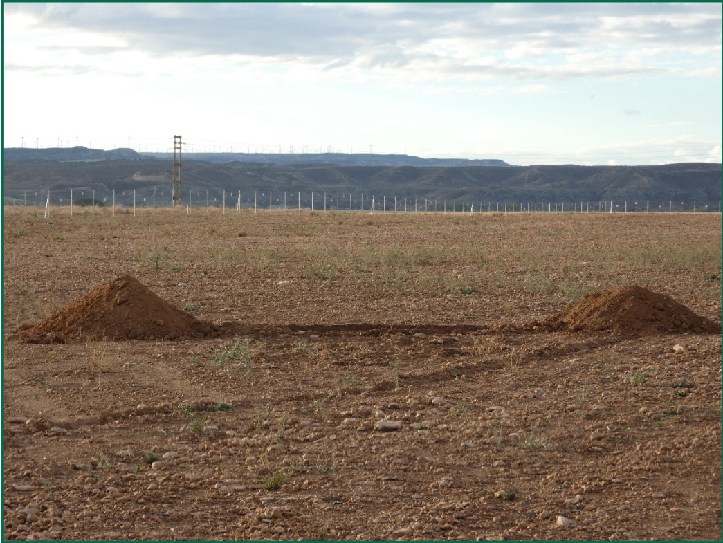
Fotografía 13. Balsa de limpieza.