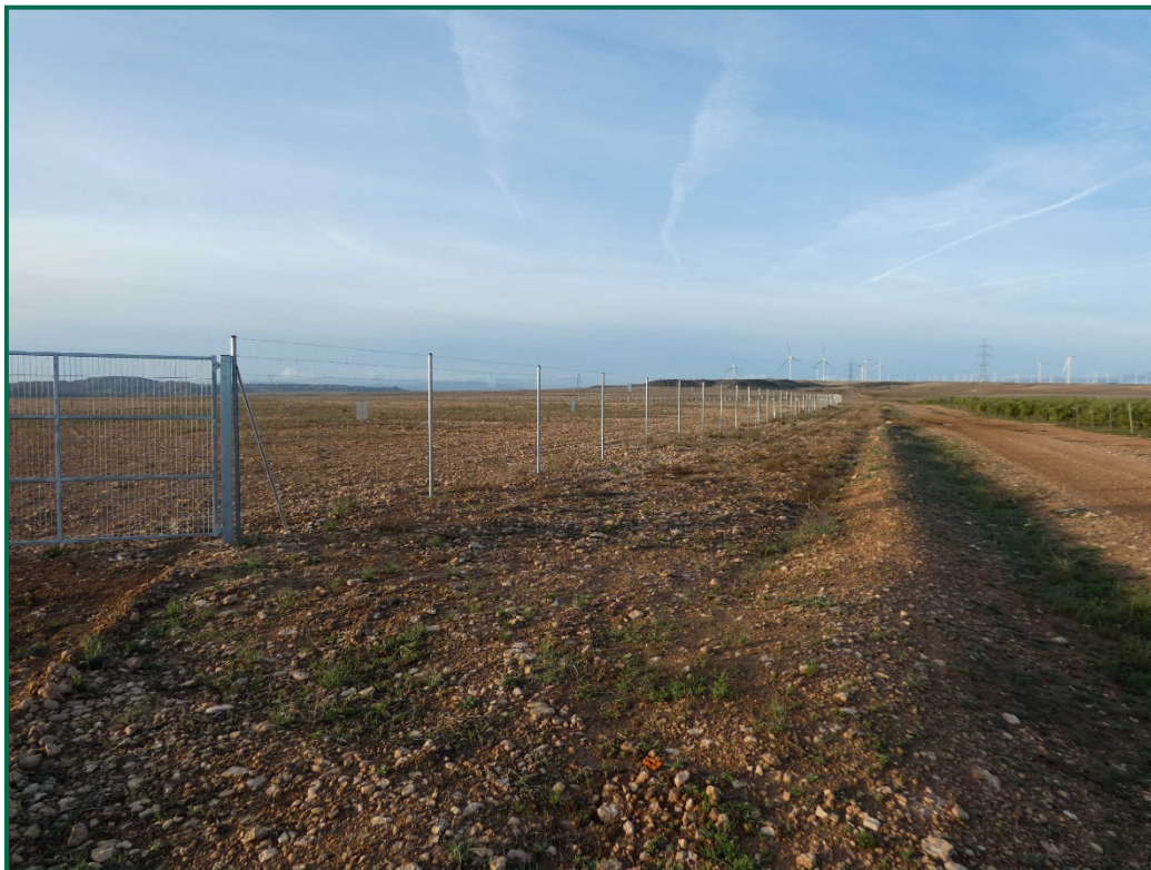
Fotografía 3. Franja vegetal.

Durante las visitas a obra se comprueba que la ocupación de zonas de vegetación se limita a lo aprobado en el proyecto. Se verifica también que la maquinaria circula únicamente por los viales habilitados para tal fin. Desde el inicio de las obras se ha planificado la ejecución de una franja vegetal de 8 m de anchura en torno al futuro vallado perimetral.