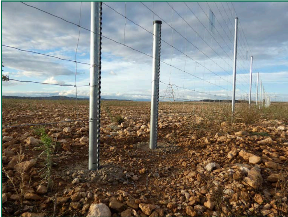
Fotografía 5. Espaciado cinegético.

Se ha realizado seguimiento de avifauna durante el proceso de la obra en el mes de septiembre, y se han avistado las siguientes especies: Cernícalo vulgar ( Falco tinnunculus ) posado sobre el vallado y en un poste eléctrico, corneja negra ( Corvus corone ) posada sobre el vallado perimetral, busardo ratonero ( Buteo buteo ) sobrevolando la obra, milano real ( Milvus milvus ) ciclando por los alrededores, abubilla común ( Upupa epops ) alimentándose sobre la superficie y otras especies de menor tamaño posadas sobre el vallado como son la cogujada montesina ( Galerida teklae ) y collalba gris ( Oenanthe oenanthe ).