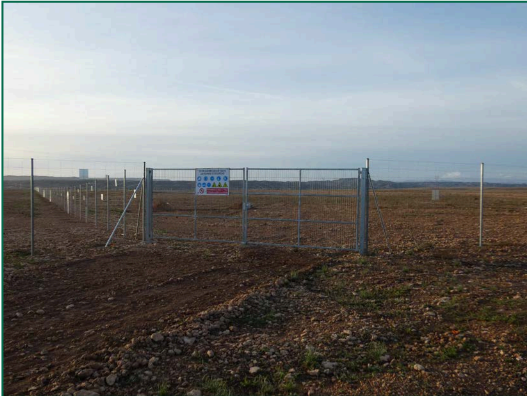
Fotografía 1. Superficie de la planta.