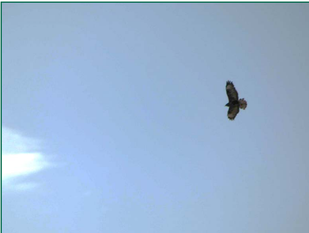
Fotografía 9. Busardo ratonero ( Buteo buteo ).