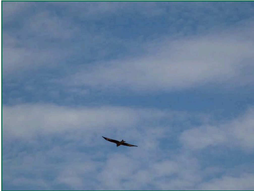
Fotografía 10. Milano real ( Milvus milvus ).