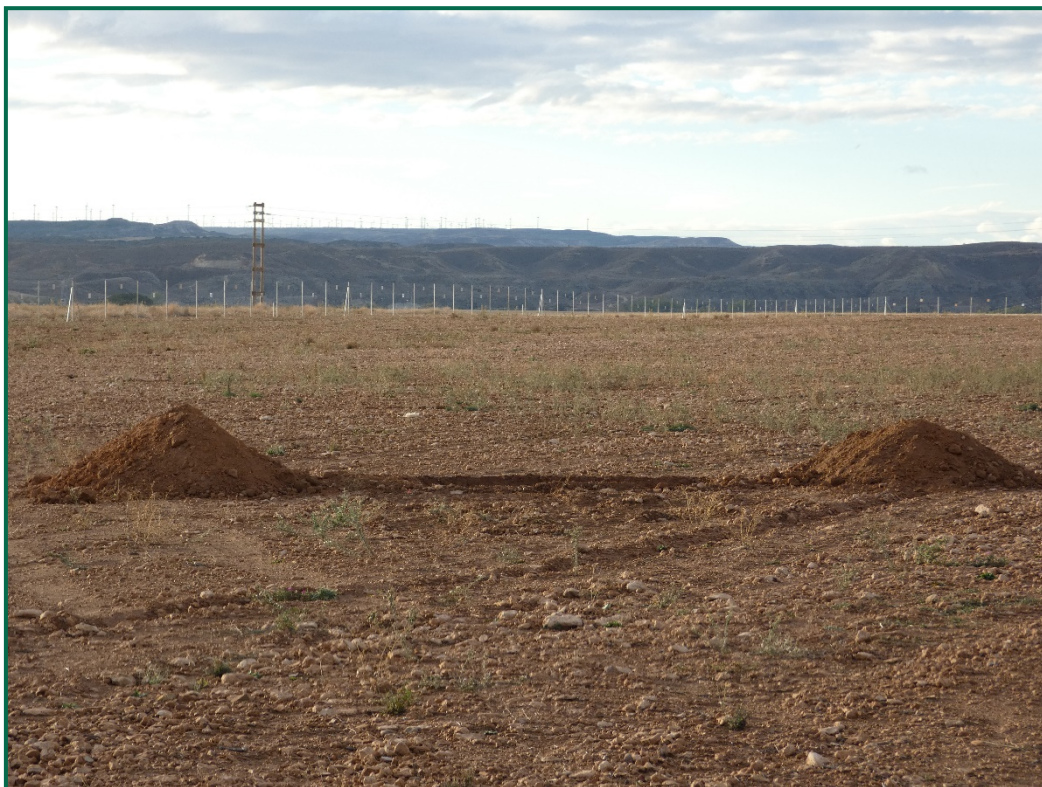
Fotografía 2. Acopios de tierra.