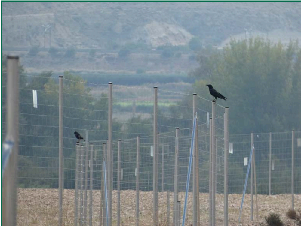
Fotografía 8. Corneja negra ( Corvus corone ).