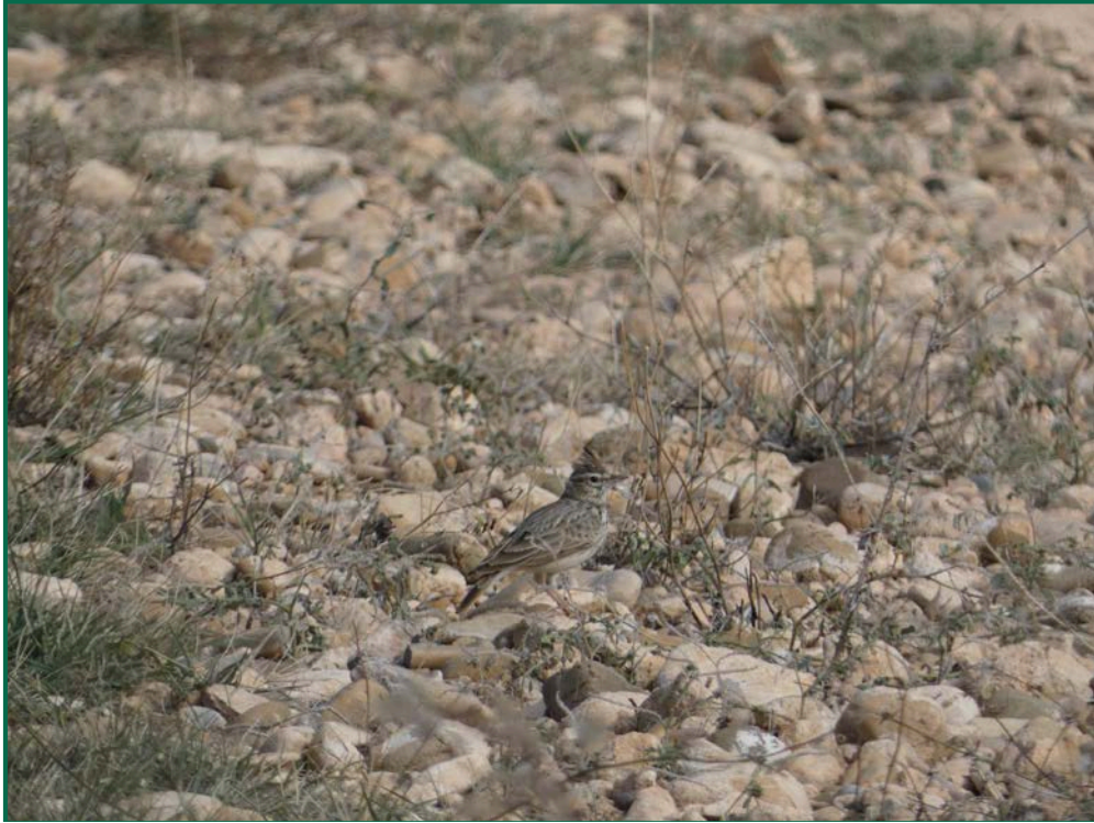
Fotografía 12. Cogujada montesina ( Galerida teklae ).