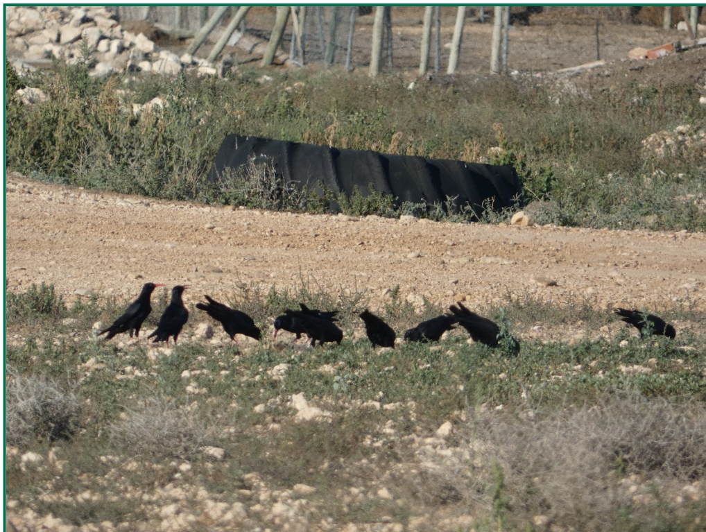
Fotografía 5. Chova piquirroja ( Pyrrhonorax pyrrhonorax ).