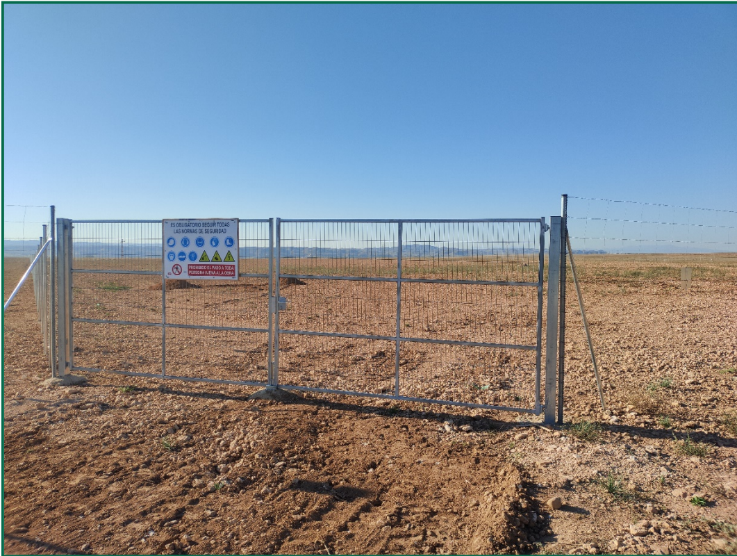
Fotografía 1. Superficie de la planta.