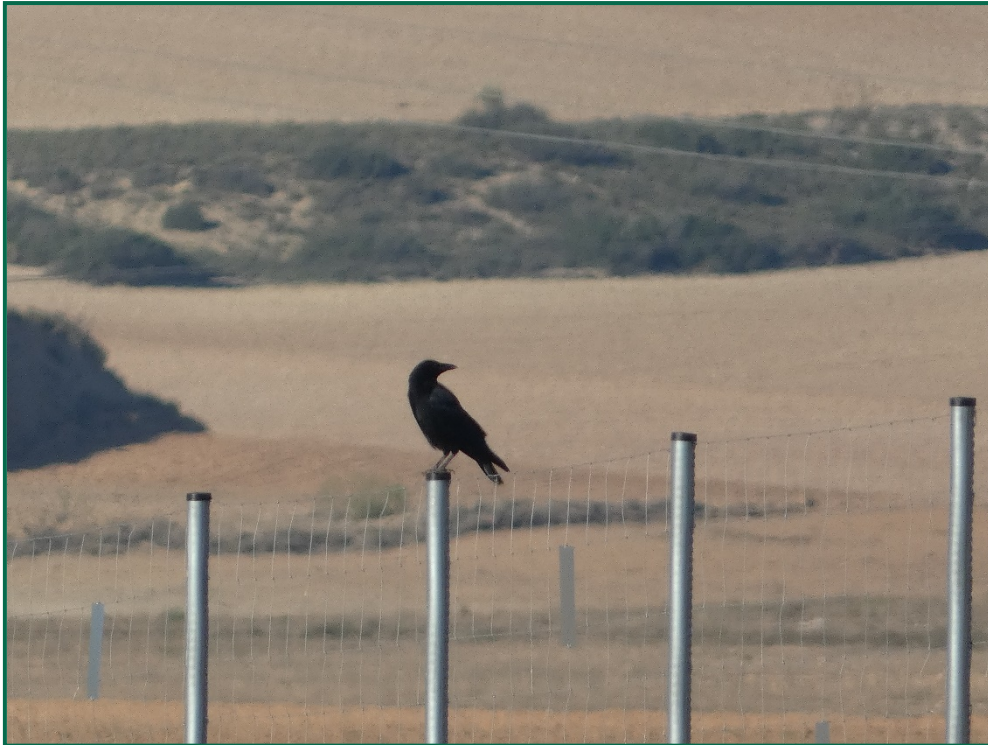
Fotografía 6. Corneja negra ( Corvus corone ).