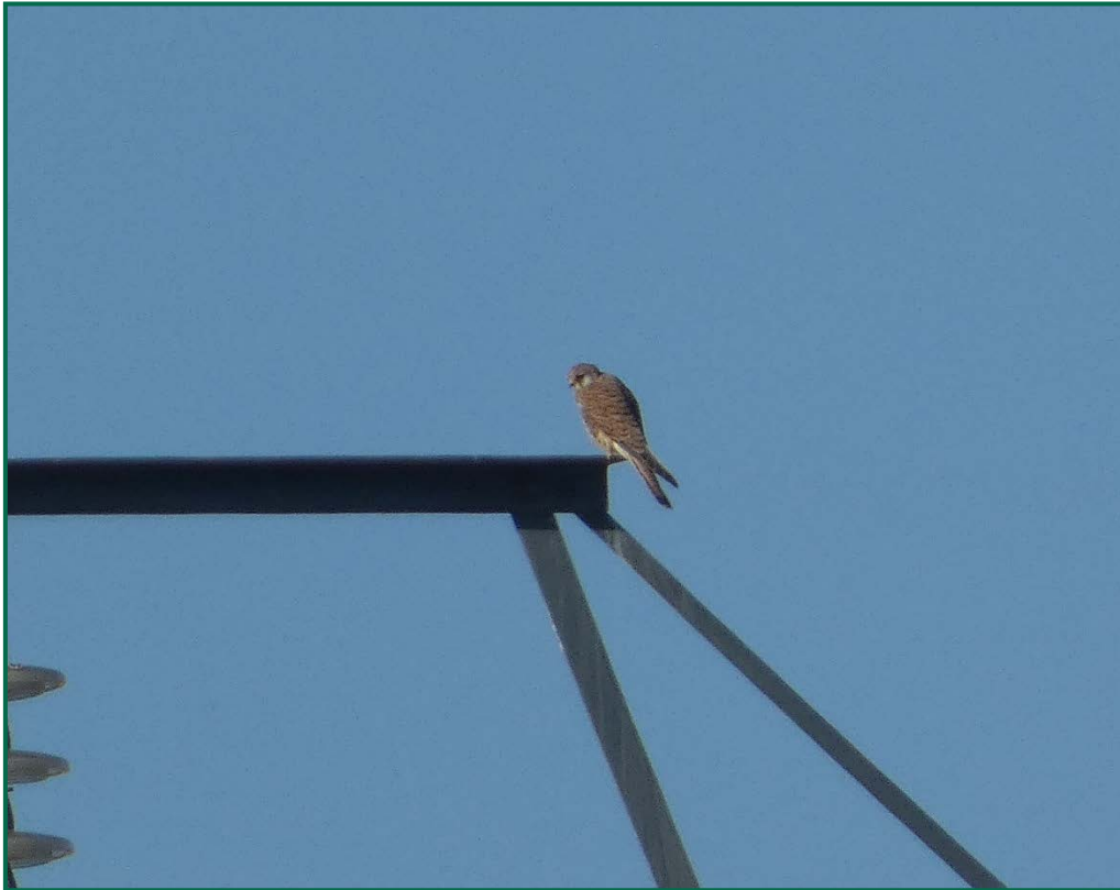
Fotografía 4. Cernícalo vulgar ( Falco tinnunculus ).