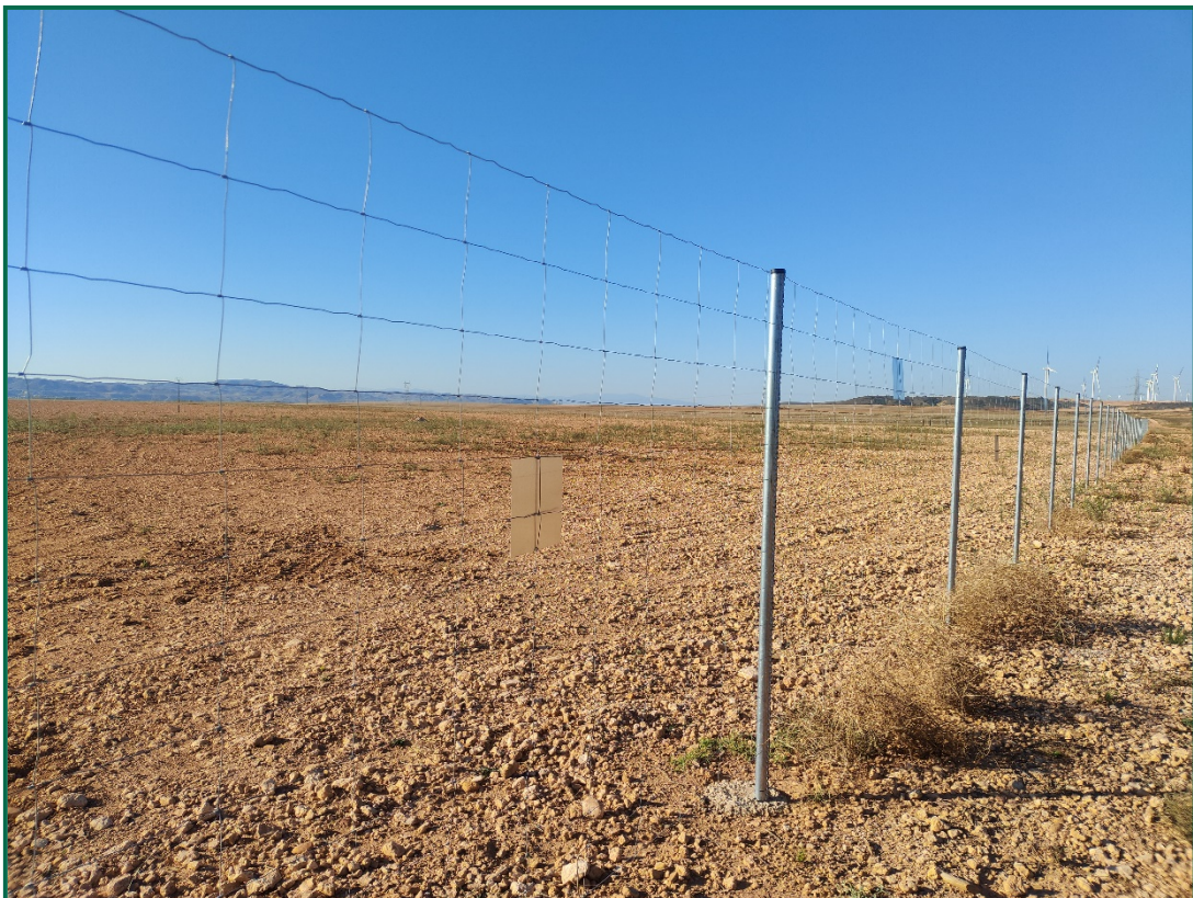
Fotografía 2. Vallado perimetral y placas anticolidión.

El vallado perimetral se ha instalado utilizando malla cinégetica y dejando un espacio de al menos 20 cm desde el suelo. Además se ha dejado un espacio en el vallado para fauna de mayor tamaño. Por otro lado, se han instalado las placas anticolidión a diferentes alturas sobre la malla.