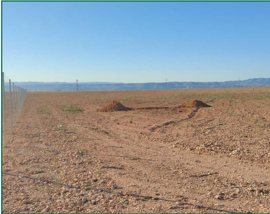
Fotografía 7. Balsa de limpieza.