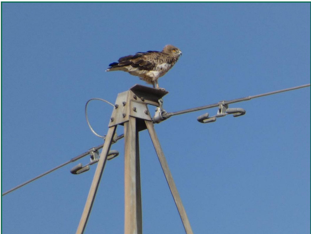
Fotografía 6. Culebrera europea ( Circaetus gallicus ).