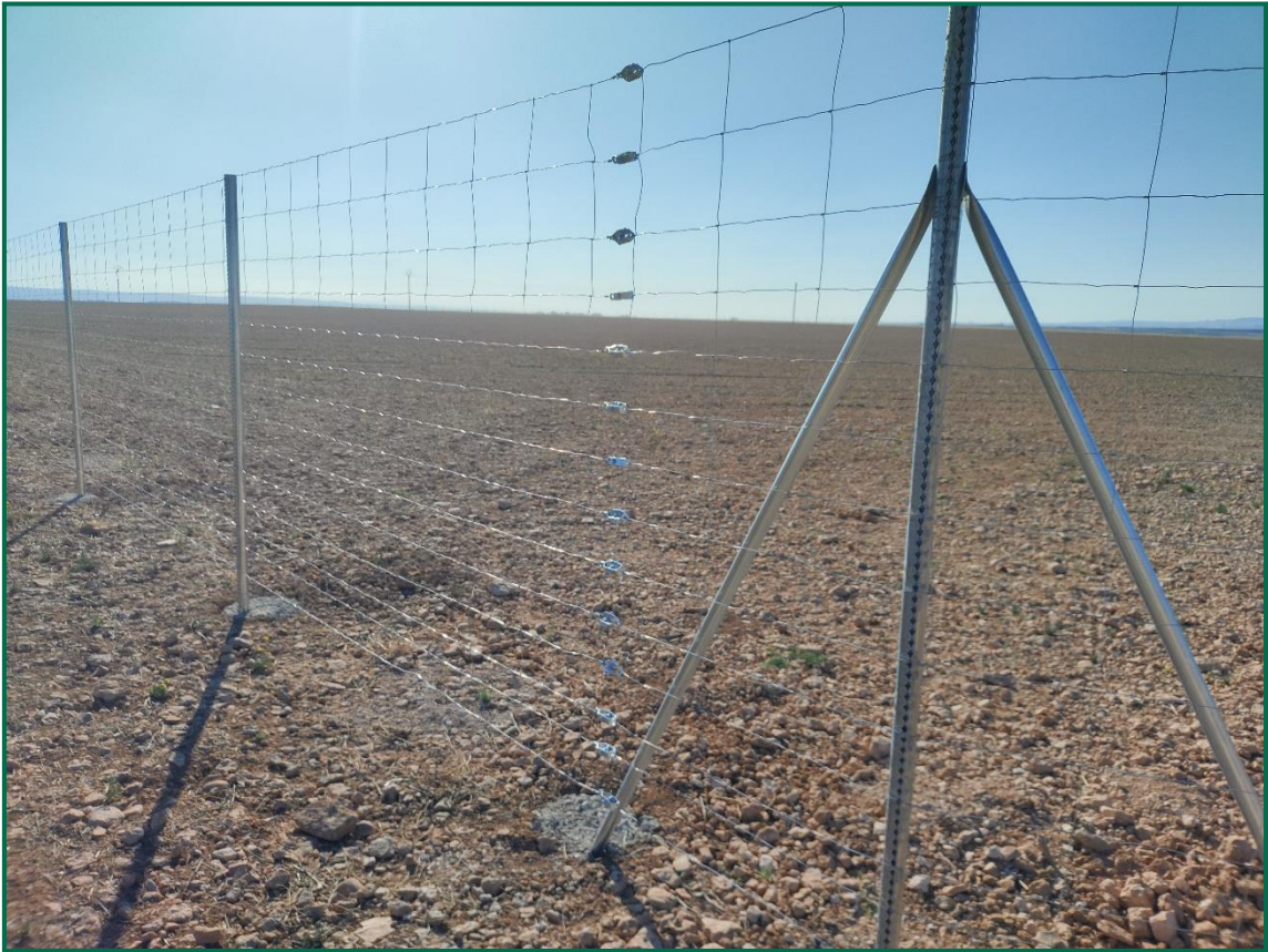
Fotografía 4. Espaciado cinegético.

Las placas anticolisión, que se intalarán a diferentes alturas, todavía no han sido colocadas.