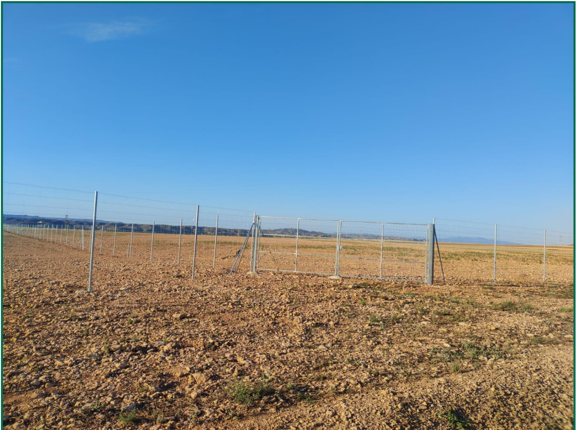
Fotografía 3. Vallado perimetral.

El vallado perimetral se ha instalado utilizando malla cinégetica y dejando un espacio de al menos 20 cm desde el suelo.