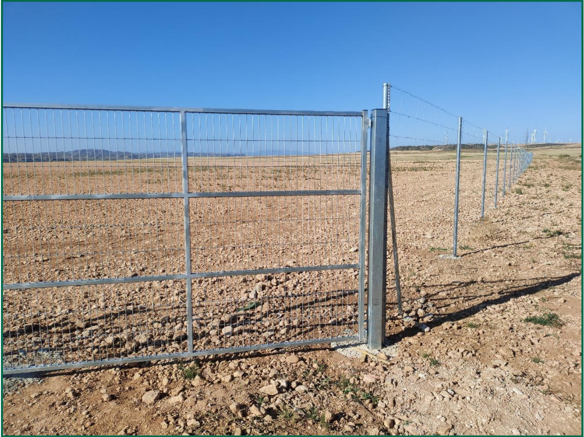
Fotografía 2. Superficie de la planta.