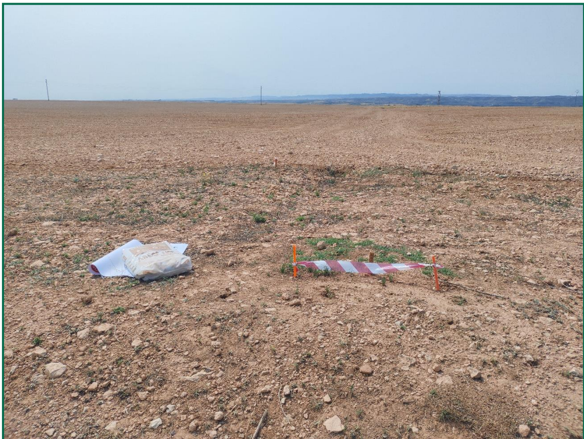
Fotografía 1. Jalonamiento y realización de hoyos.

No se realiza el balizamiento de todo el perímetro de la obra ya que se generaría una gran cantidad de residuos de malla de obra o cinta que tiende a romperse y dispersarse por toda la zona. Sí se realiza un jalonamiento del perímetro mediante banderines. La Dirección Ambiental realiza un control visual continuado para comprobar que no se sobrepasan los límites de la zona de ocupación.