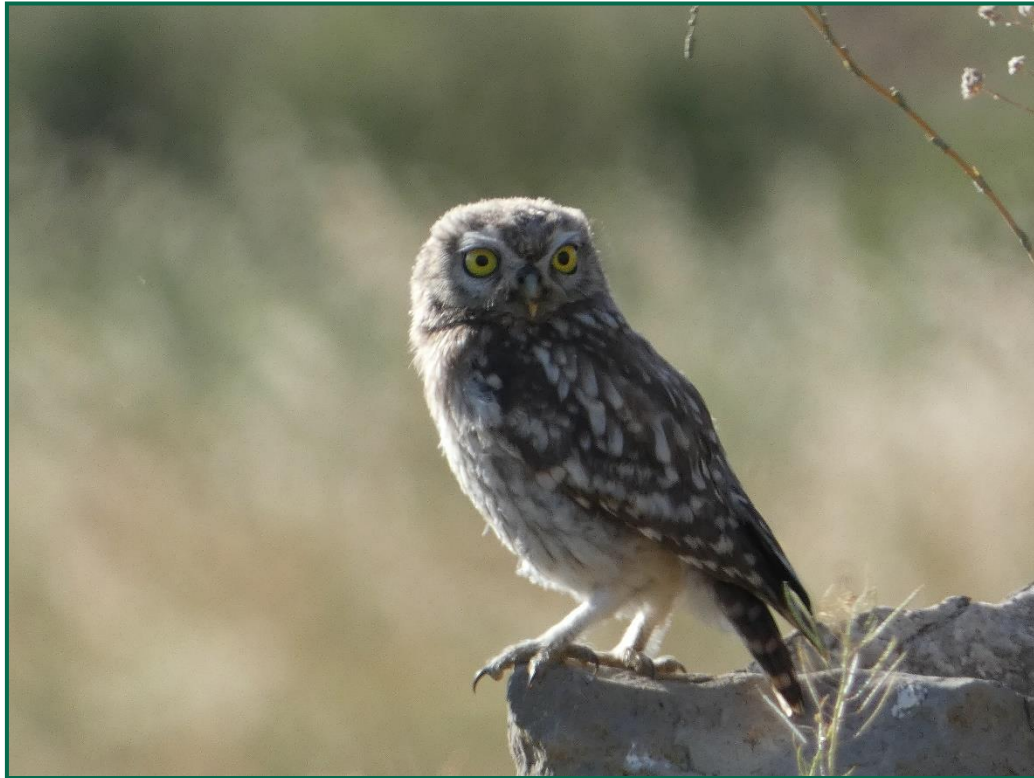
Fotografía 9. Mochuelo europeo ( Athene noctua ).