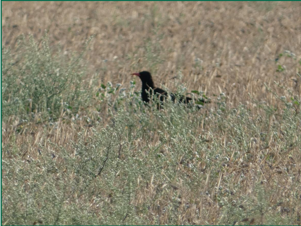
Fotografía 7. Chova piquirroja ( Pyrrhocorax pyrrhocorax ).