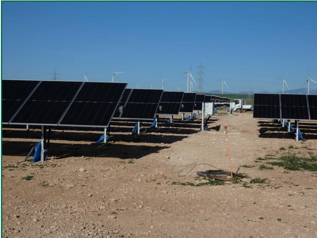
Fotografía 3. Placas fotovoltaicas.