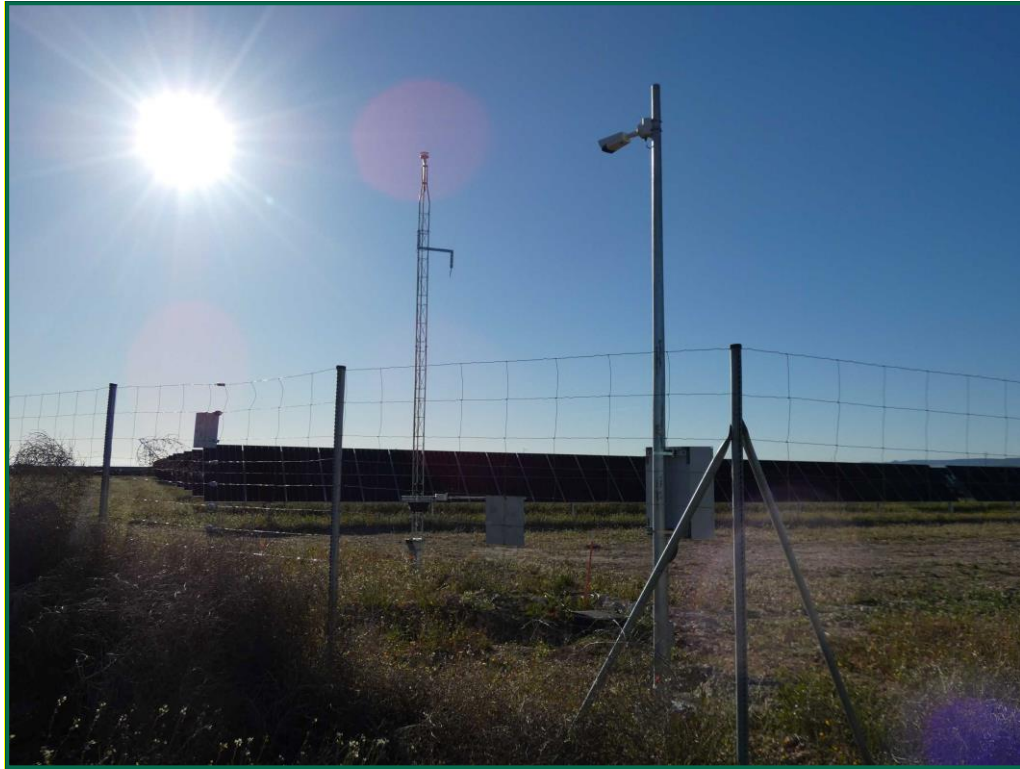
Fotografía 1. Cámara de vigilancia y estructura de parámetros ambientales.