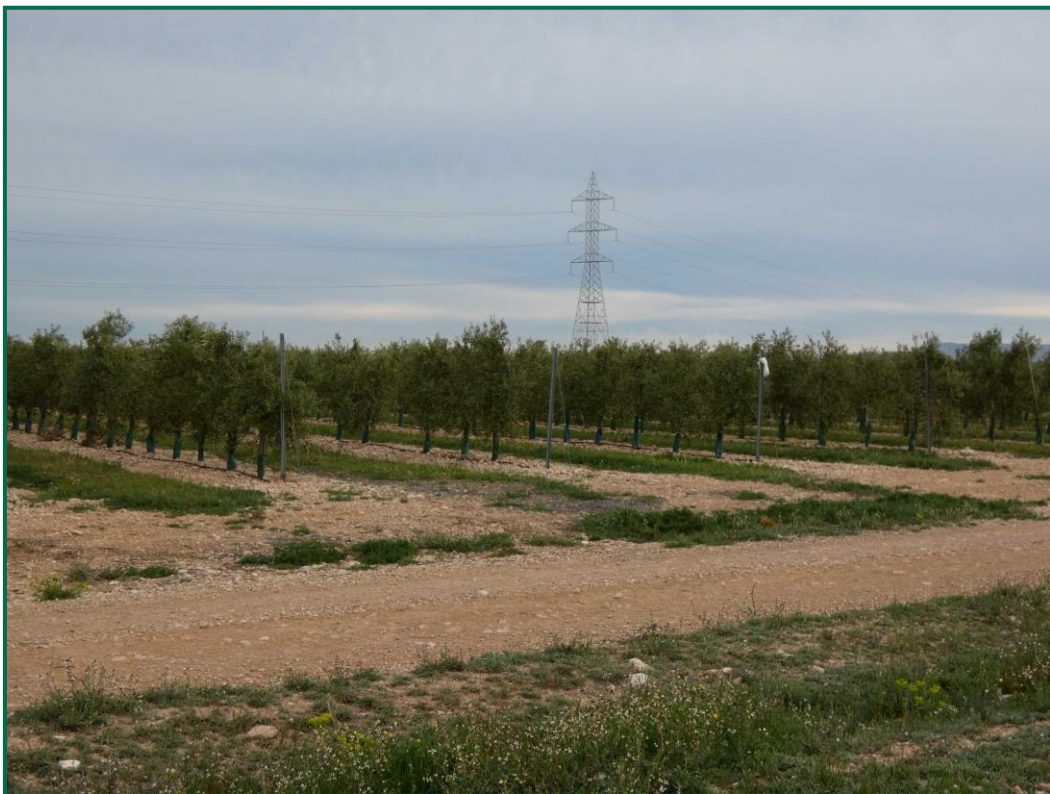
Fotografía 7. Cultivos próximos a la planta.