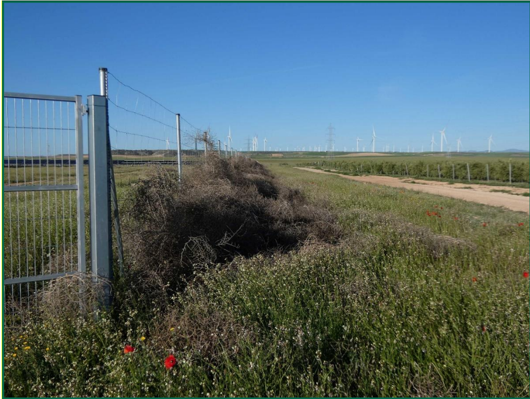
Fotografía 4. Franja vegetal y plantas rodadoras acumuladas sobre el vallado.