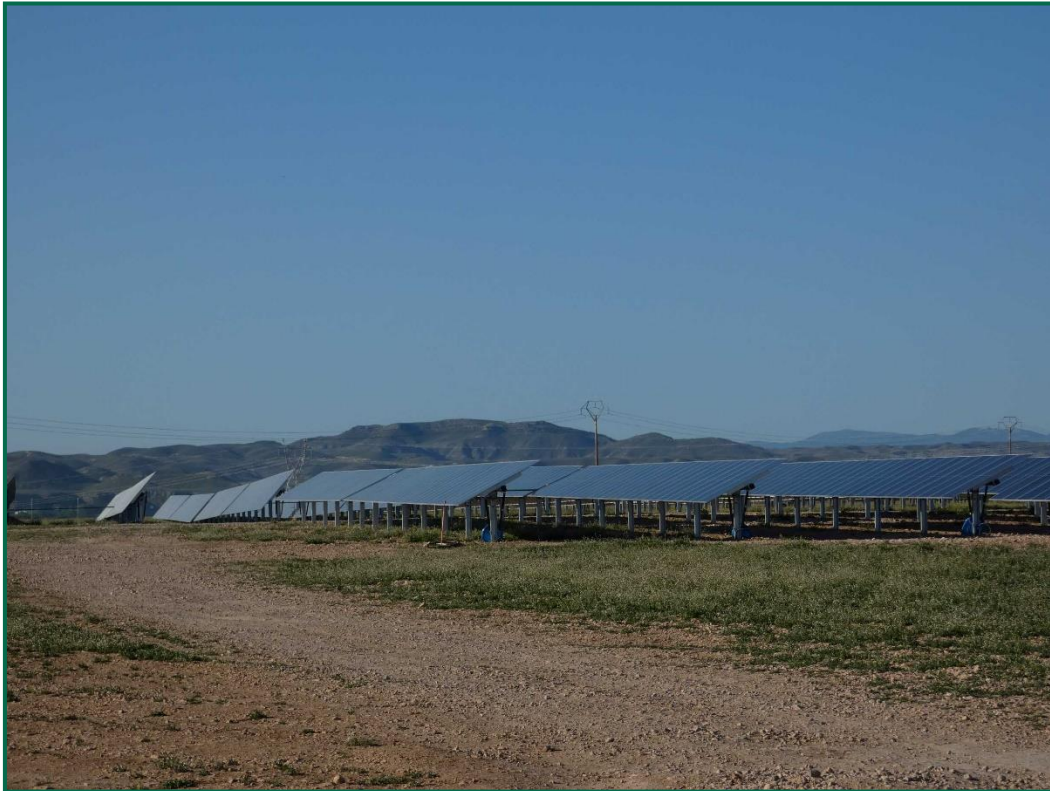
Fotografía 6. Superficie de la planta.