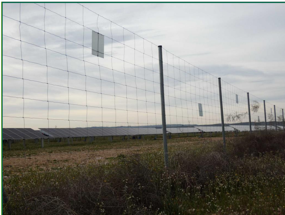
Fotografía 8. Vallado perimetral y placas anticolidión.