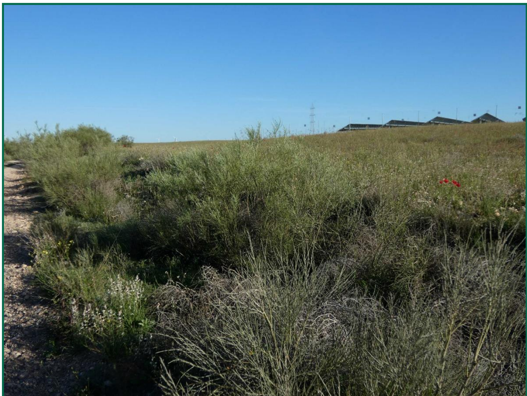
Fotografía 5. Vegetación natural.