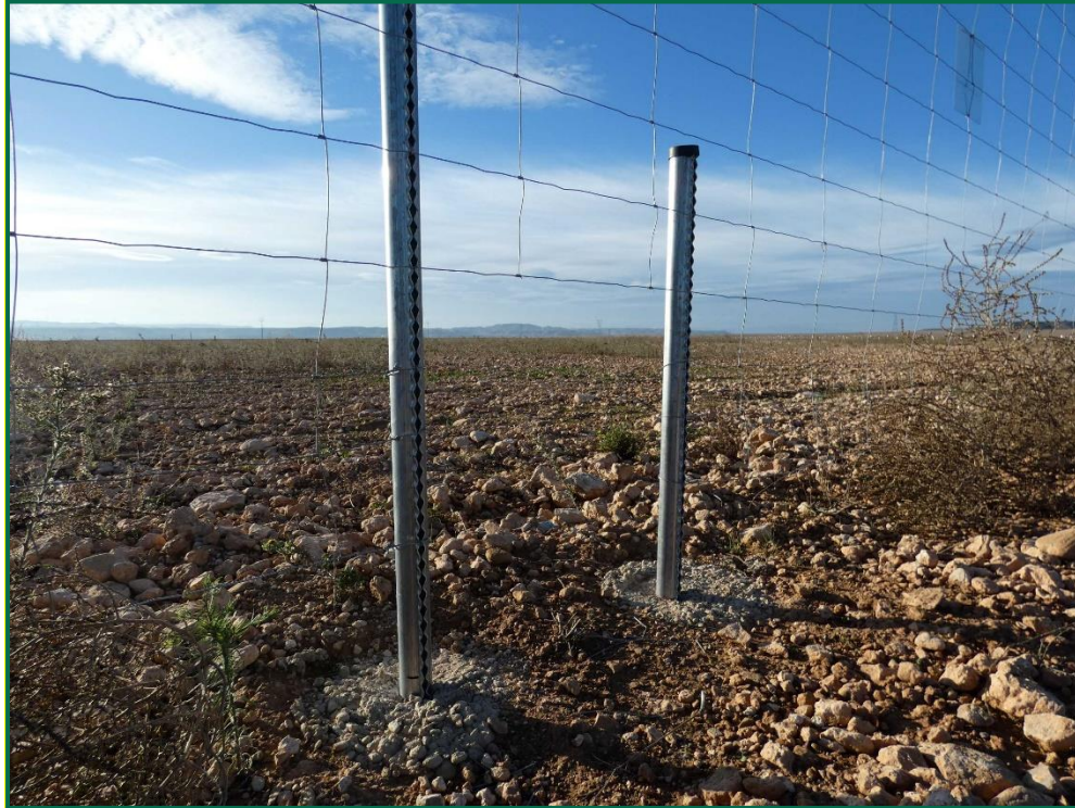
Fotografía 10. Espaciado cinemático.

Se ha realizado seguimiento de avifauna durante el proceso de la obra en el mes de septiembre, y se han avistado las siguientes especies: cuervo grande ( Corvus corax ), corneja negra ( Corvus corone ) y chova piquirroja ( Pyrhocorax pyrrhocorax ). Además de otras especies de menor embergadura como pueden ser calandria común ( Melanocorypha calandra ), cogujada montesina ( Galerida teklae ), alcaudón real ( Lanius meridionalis ), estornino negro ( Sturnus unicolor ) o pardillo común ( Linaria cannabina ).