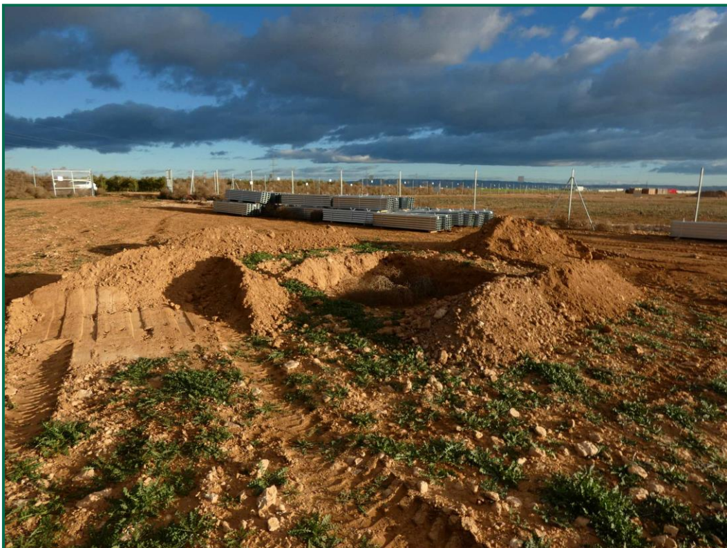
Fotografía 11. Balsa de limpieza.

Se están utilizando grupos electrógenos y se han instalado envases de combustible. Además, se han colocado bandejas de contención debajo de ellos para evitar derrames por pérdidas accidentales sobre el terreno.