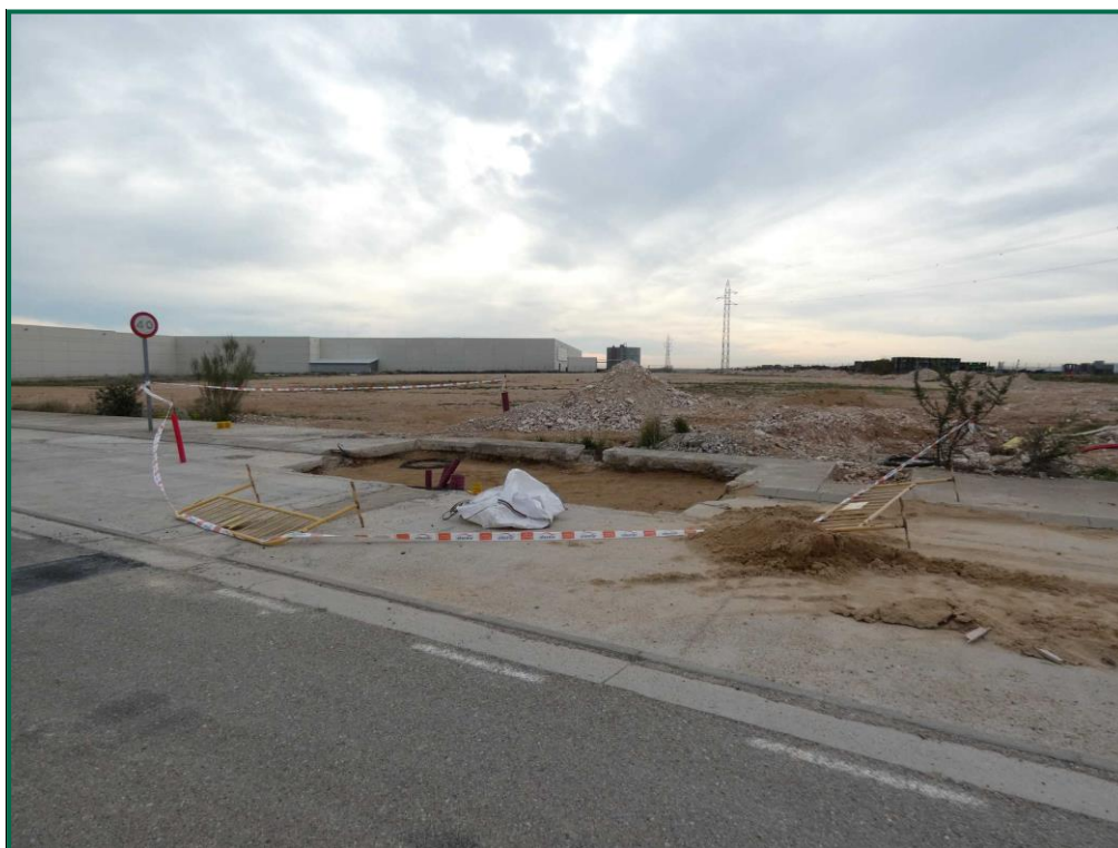
Fotografía 12. Balizamiento de la zanja.