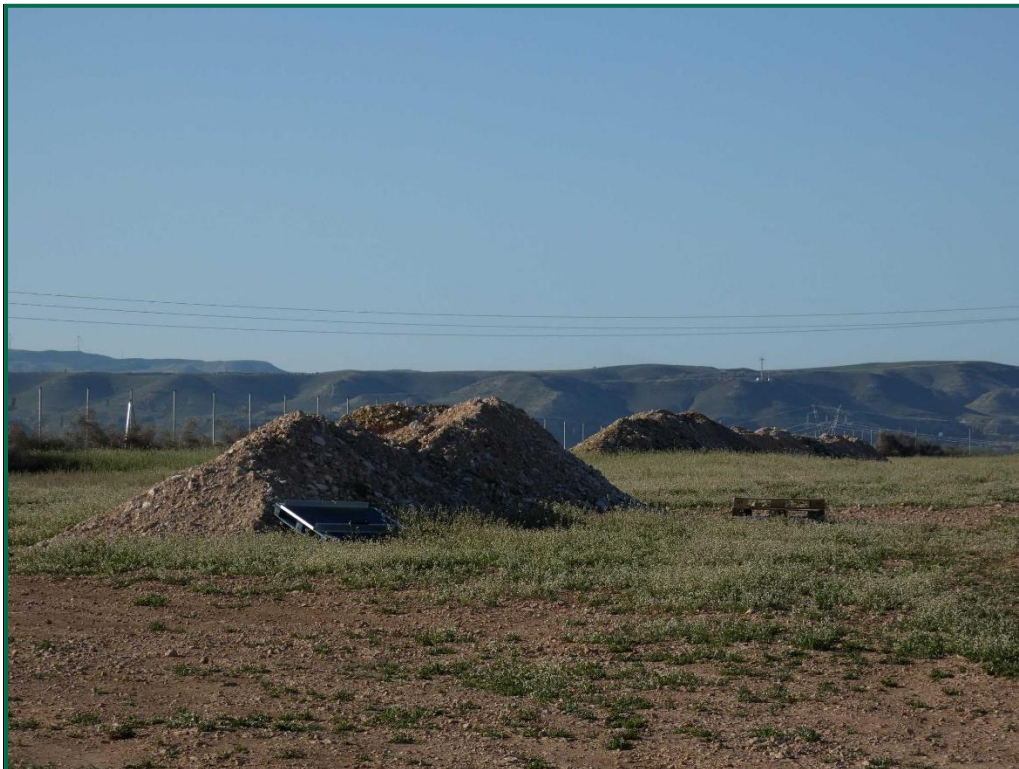
Fotografía 2. Acopios de tierra.