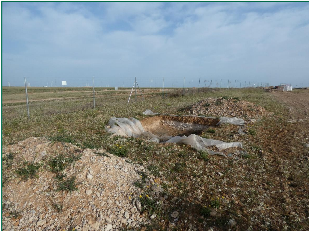
Fotografía 8. Balsa de limpieza.