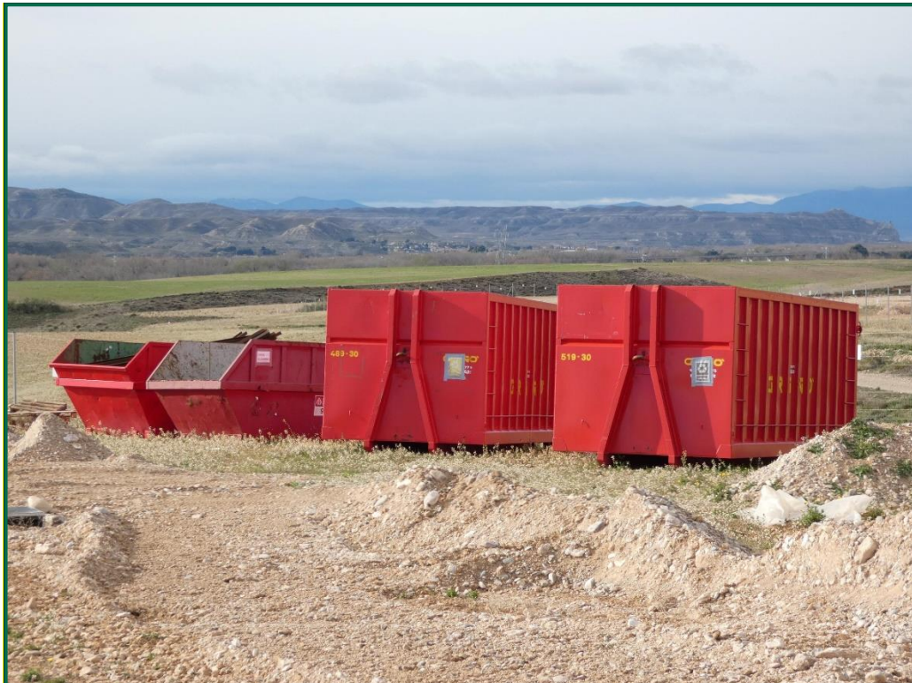
Fotografía 7. Contenedores de residuos.

Se están utilizando grupos electrógenos y se han instalado envases de combustible. Además, se han colocado bandejas de contención debajo de ellos para evitar derrames por pérdidas accidentales sobre el terreno.