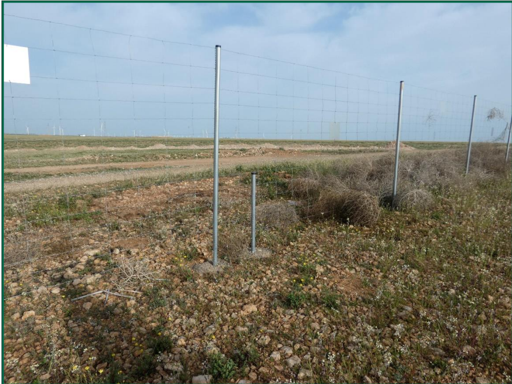
Fotografía 6. Espaciado cinegético.

Se ha realizado seguimiento de avifauna durante el proceso de la obra en el mes de septiembre, y se han avistado las siguientes especies: milano negro ( Milvus migrans ), cuervo grande ( Corvus corax ), corneja negra ( Corvus corone ) y chova piquirroja ( Pyrhacorax pyrrhacorax ). Además de otras especies de menor embergadura como pueden ser calandria común ( Melanocorypha calandra ), cogujada montesina ( Galerida teklae ), alcaudón real ( Lanius meridionalis ), estornino negro ( Sturnus unicolor ) o pardillo común ( Linaria cannabina ).