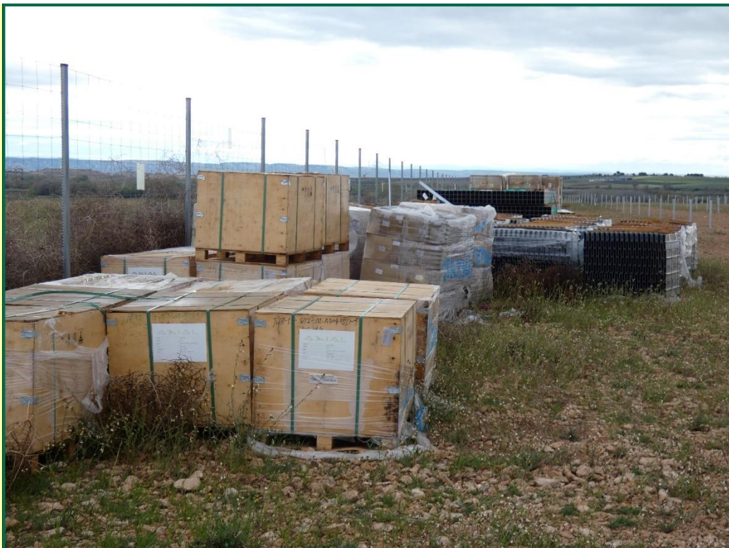
Fotografía 9. Materiales de construcción.