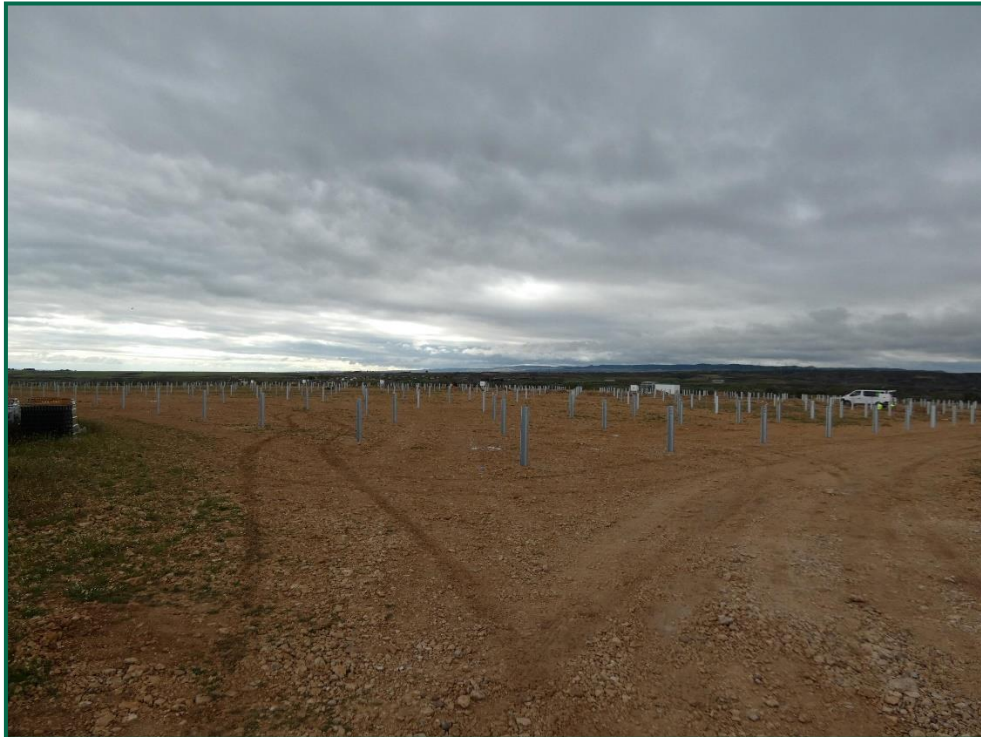
Fotografía 2. Superficie de la obra.