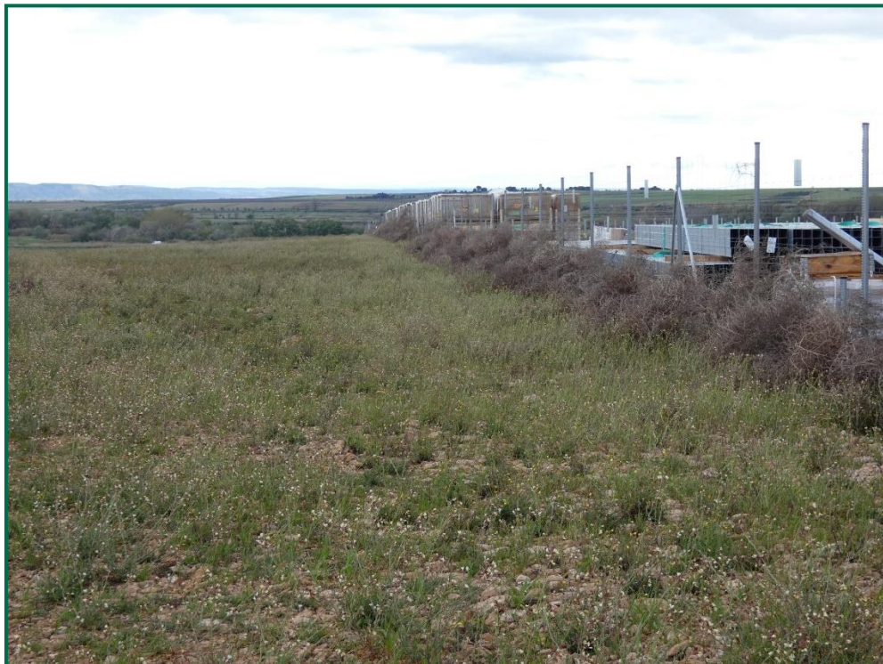
Fotografía 4. Franja vegetal y plantas rodadoras sobre el vallado.

Durante las visitas a obra se comprueba que la ocupación de zonas de vegetación se limita a lo aprobado en el proyecto. Se verifica también que la maquinaria circula únicamente por los viales habilitados para tal fin. Desde el inicio de las obras se ha planificado la ejecución de una franja vegetal de 8 m de anchura en torno al vallado perimetral.