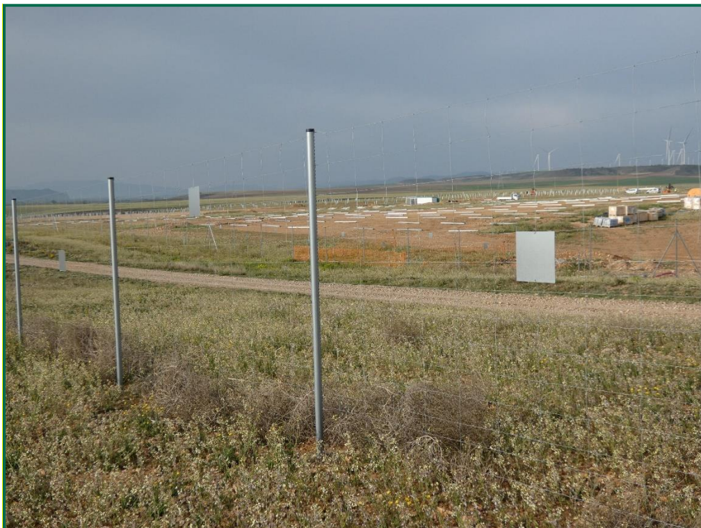
Fotografía 5. Vallado perimetral y placa anticolidión.

El vallado perimetral se ha instalado utilizando malla cinagética y dejando un espacio de al menos 20 cm desde el suelo. Además se ha dejado un espacio en el vallado para fauna de mayor tamaño. Por otro lado, se han instalado las placas anticolidión a diferentes alturas sobre la malla.