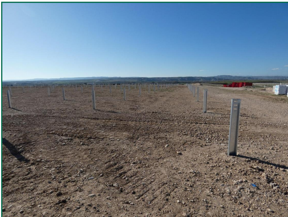
Fotografía 3. Postes verticales colocados.