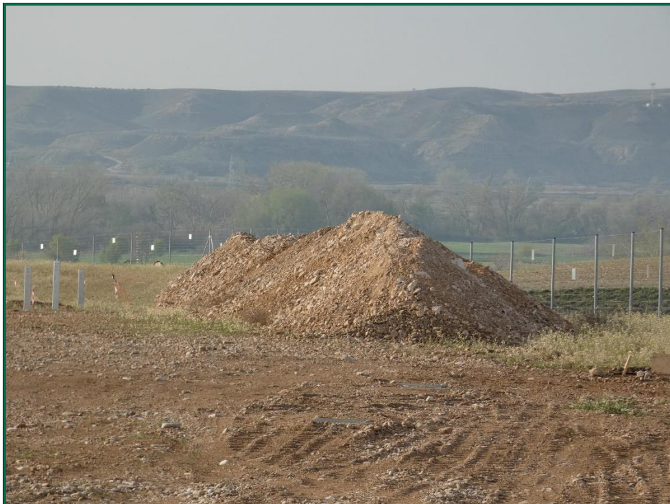
Fotografía 1. Acopios de tierra.

Por el momento la tierra vegetal extraída ha sido escasa debido a que no ha sido necesario nivelar todo el terreno, únicamente algunas zonas y con un espesor limitado, y esta se ha ido extendiendo sobre el terreno. La tierra extraída para la construcción de balsas de limpieza se ha acopiado en caballones al igual que la tierra retirada para realizar zanjas. En las zonas donde se van a realizar plantaciones para crear una patalla vegetal no se ha realizado ningún movimiento de tierra, conservando la capa de tierra vegetal presente.