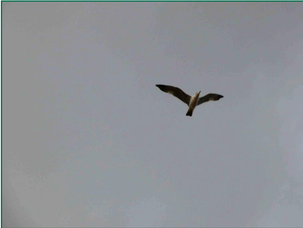
Fotografía 11. Gaviota patiamarilla ( Larus michaellis ).