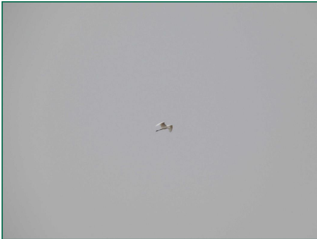
Fotografía 10. Garceta grande ( Ardea alba ).