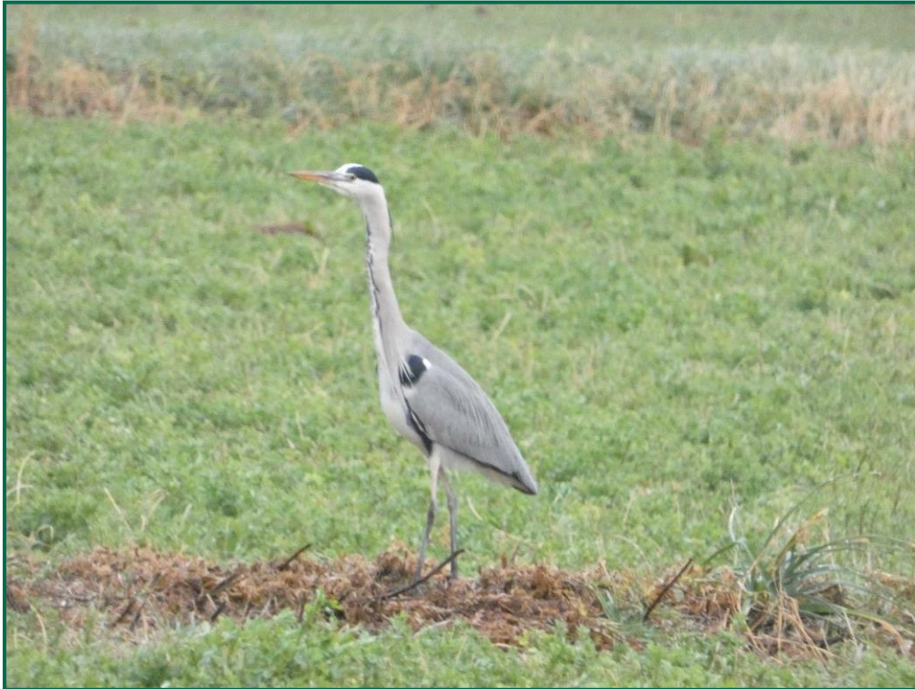
Fotografía 8. Garza real ( Ardea cinerea ).

Se ha realizado seguimiento de avifauna durante el proceso de la obra en el mes de septiembre, y se han avistado las siguientes especies: busardo ratonero ( Buteo buteo ), milano real ( Milvus milvus ), cuervo grande ( Corvus corax ), garza real ( Ardea cinerea ), garceta grande ( Ardea alba ) y gaviota patiamarilla ( Larus michaellis ).