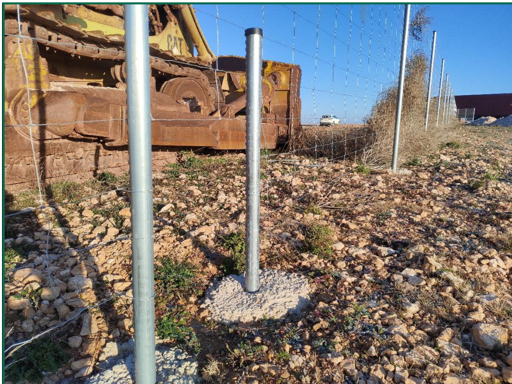
Fotografía 7. Espaciado cinético.