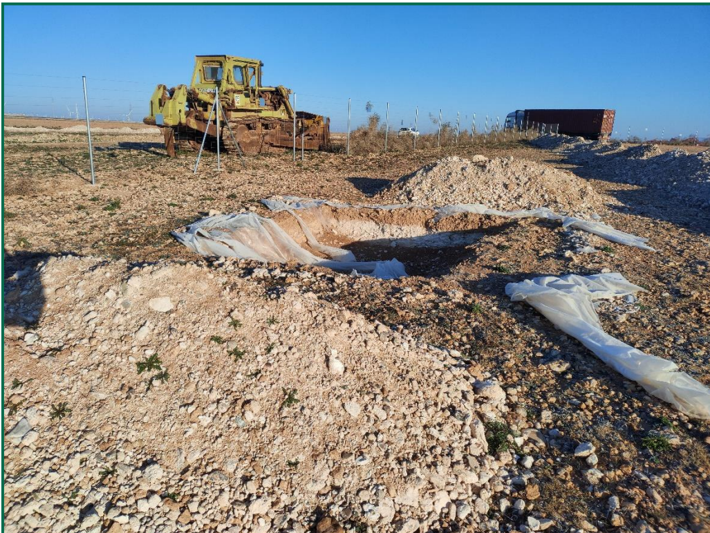
Fotografía 13. Balsa de limpieza.