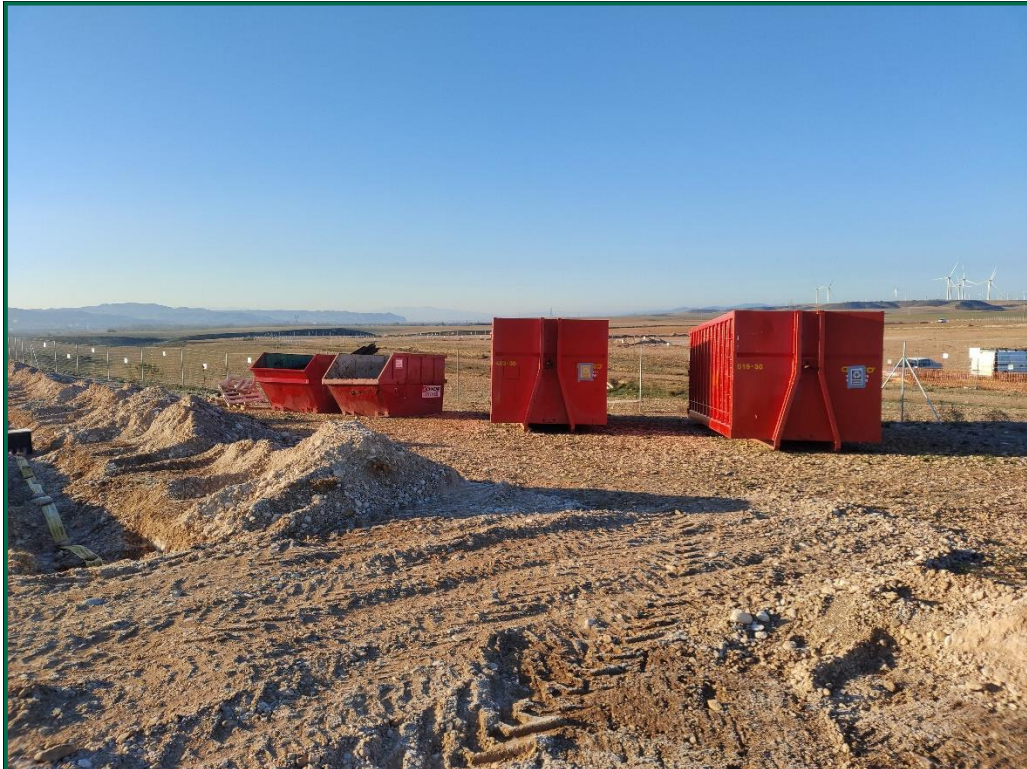
Fotografía 12. Contenedores de residuos.