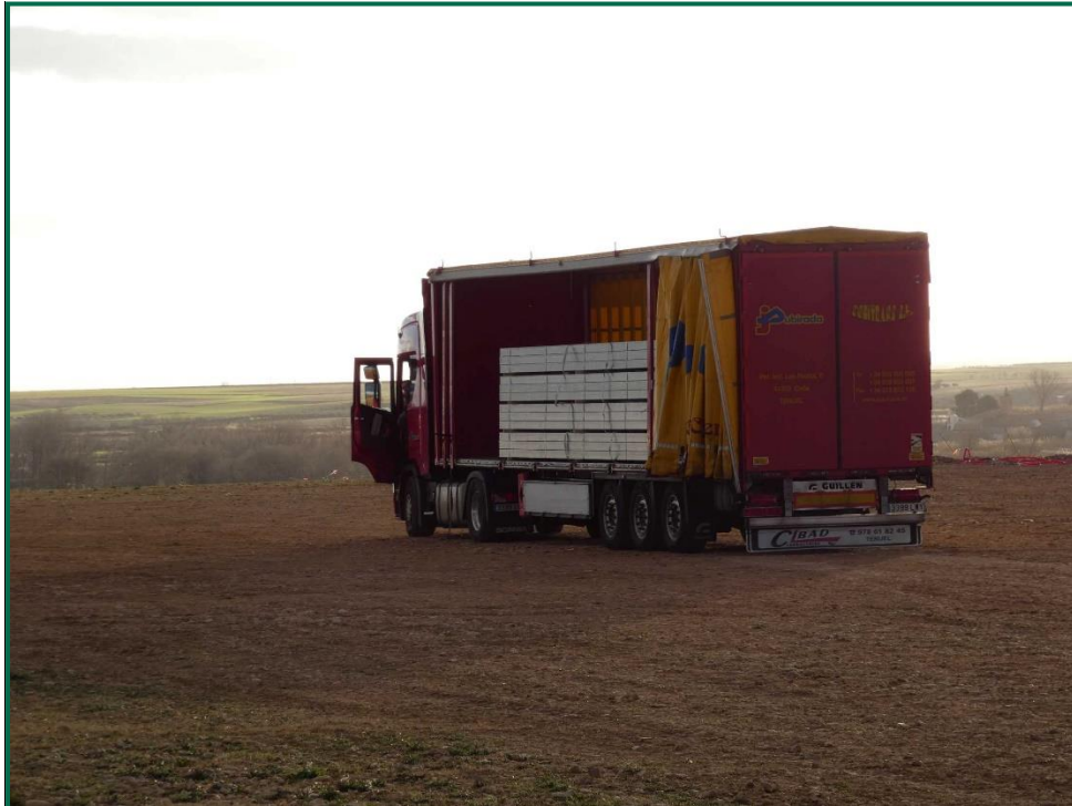
Fotografía 3. Recepción de materiales.