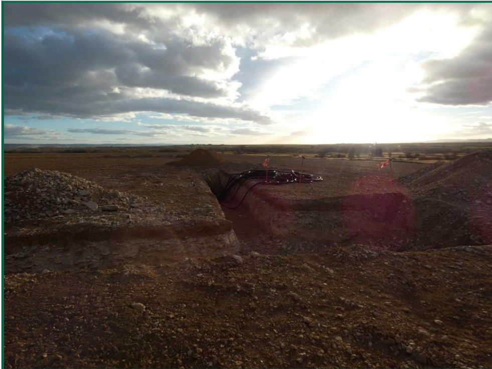
Fotografía 4. Zanjas y acopios de tierra.