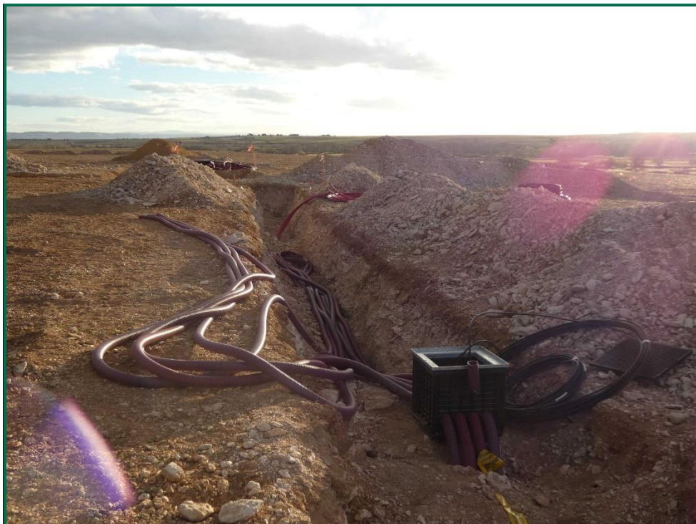
Fotografía 5. Colocación del cableado.