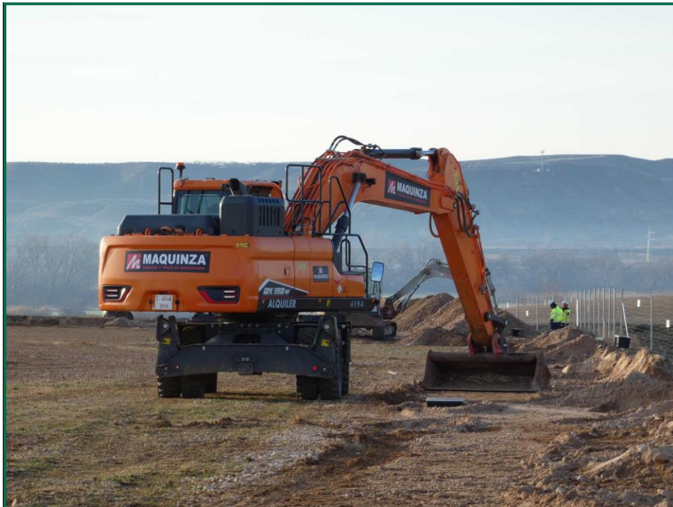
Fotografía 2. Escavadora tapando zanjas.

Durante las visitas a obra no se constata afección por emisión de polvo significativa durante los trabajos. Se prevé humedecer los caminos cuando las circunstancias lo requieran con la presencia de una cuba esparciendo agua por el terreno.