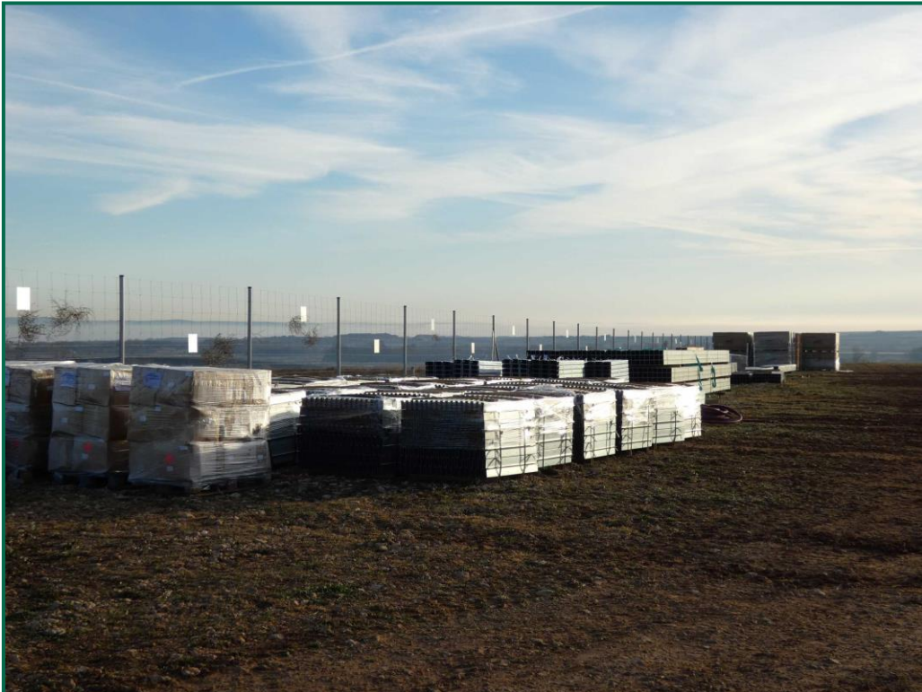
Fotografía 14. Recepción de materiales.