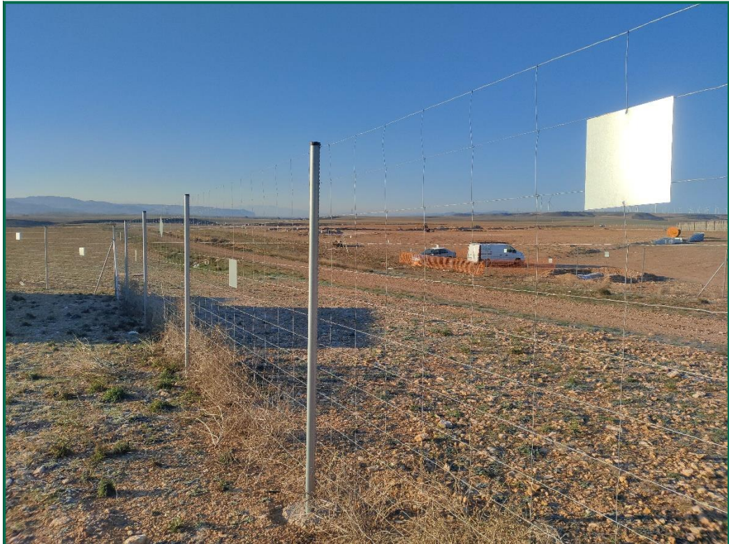
Fotografía 6. Vallado perimetral y placa anticolisión.