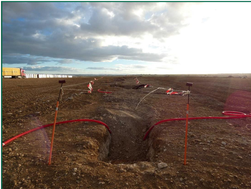
Fotografía 1. Jalonamiento de la obra.

No se realiza el balizamiento de todo el perímetro de la obra ya que se generaría una gran cantidad de residuos de malla de obra o cinta que tiende a romperse y dispersarse por toda la zona. Sí se realiza un jalonamiento del perímetro mediante banderines. La Dirección Ambiental realiza un control visual continuado para comprobar que no se sobrepasan los límites de la zona de ocupación.