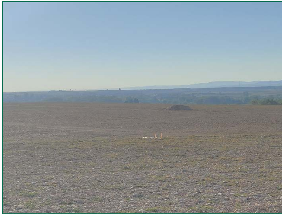
Fotografía 1. Jalonamiento.

No se realiza el balizamiento de todo el perímetro de la obra ya que se generaría una gran cantidad de residuos de malla de obra o cinta que tiende a romperse y dispersarse por toda la zona. Sí se realiza un jalonamiento del perímetro mediante banderines. La Dirección Ambiental realiza un control visual continuado para comprobar que no se sobrepasan los límites de la zona de ocupación.