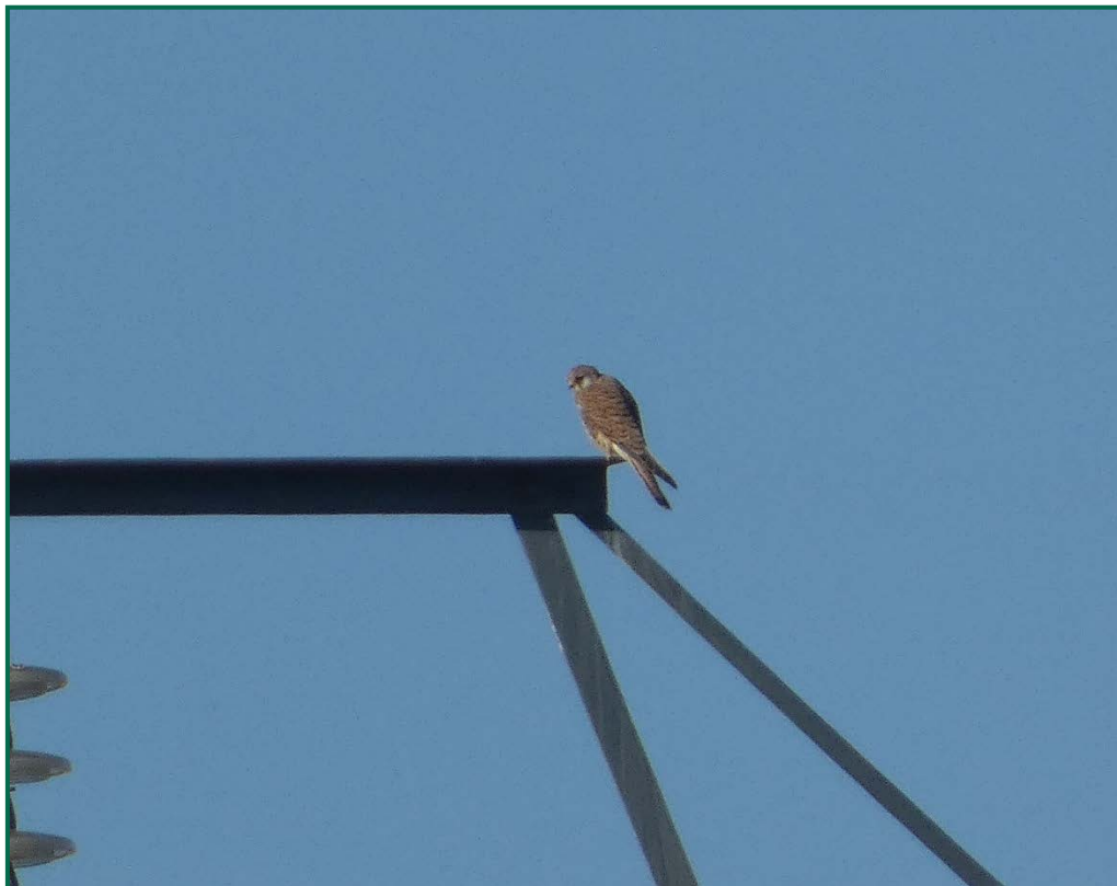
Fotografía 6. Cernícalo vulgar ( Falco tinnunculus ).