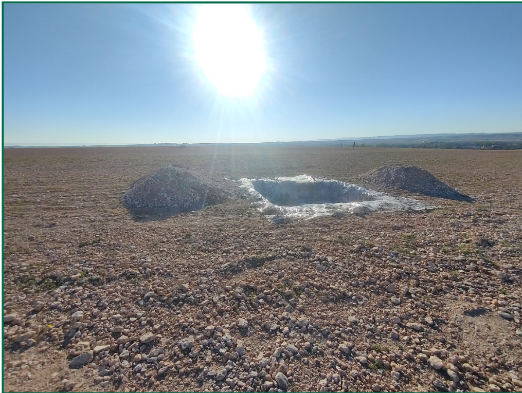
Fotografía 9. Balsa de limpieza.

Todavía no se han utilizado grupos electrógenos ni se han instalado envases de combustible, cuando se comiencen a utilizar se colocarán bandejas de contención debajo de ellos para evitar derrames por pérdidas accidentales sobre el terreno.