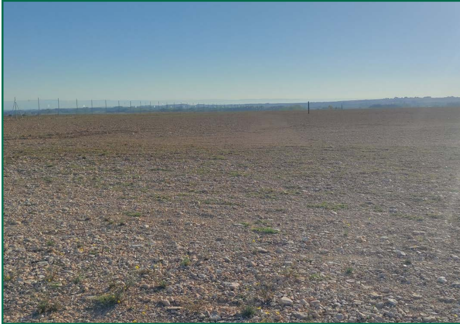
Fotografía 2. Superficie de la planta.