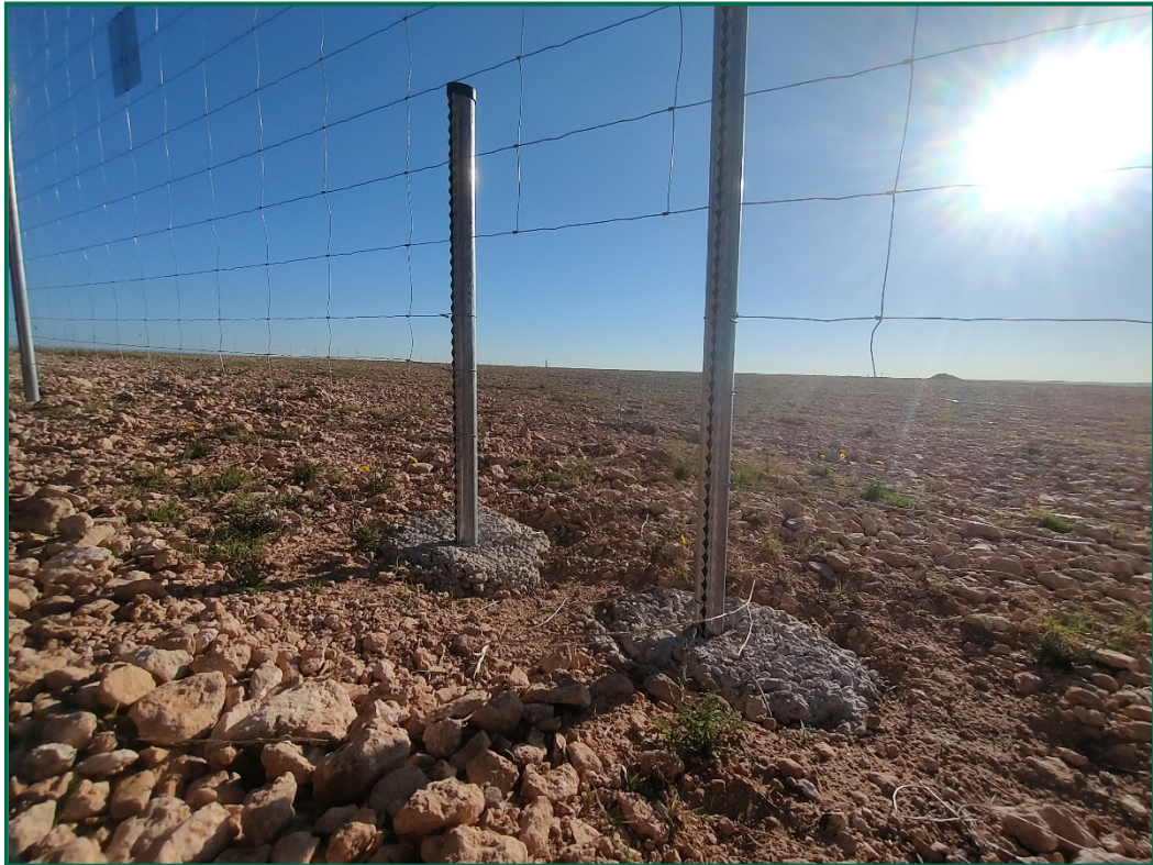
Fotografía 4. Espaciado cinegético.

Se ha realizado seguimiento de avifauna durante el proceso de la obra en el mes de septiembre, y se han avistado las siguientes especies: Cernícalo vulgar ( Falco tinnunculus ) posado sobre el vallado y en un poste eléctrico, chova piquirroja ( Pyrhacorax pyrrhacorax ) en bandos alimentándose sobre campos de cultivos anexos a la obra, corneja negra ( Corvus corone ) y otras especies de menor tamaño posadas sobre el vallado como son la cogujada montesina ( Galerida teklae ) y collalba gris ( Oenanthe oenanthe ).