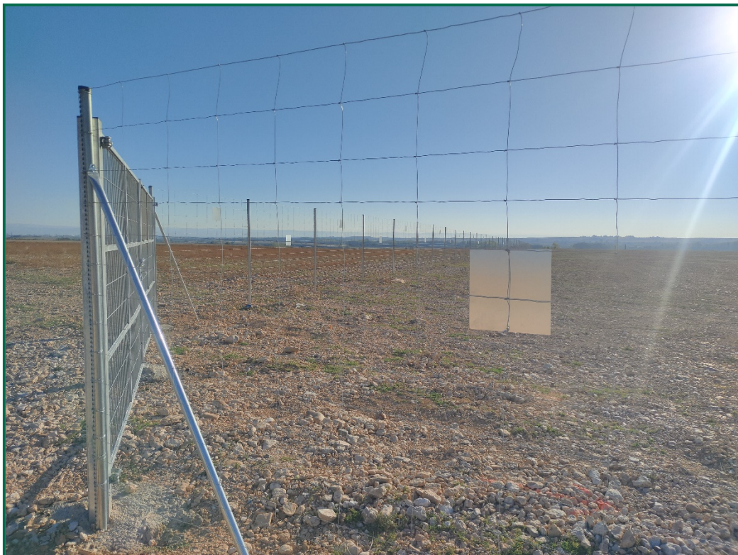
Fotografía 3. Vallado perimetral y placas anticolidión.

El vallado perimetral se ha instalado utilizando malla cinégetica y dejando un espacio de al menos 20 cm desde el suelo. Además se ha dejado un espacio en el vallado para fauna de mayor tamaño. Por otro lado, se han instalado las placas anticolidión a diferentes alturas sobre la malla.