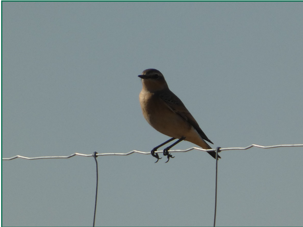
Fotografía 5. Collalba gris ( Oenanthe oenanthe ).