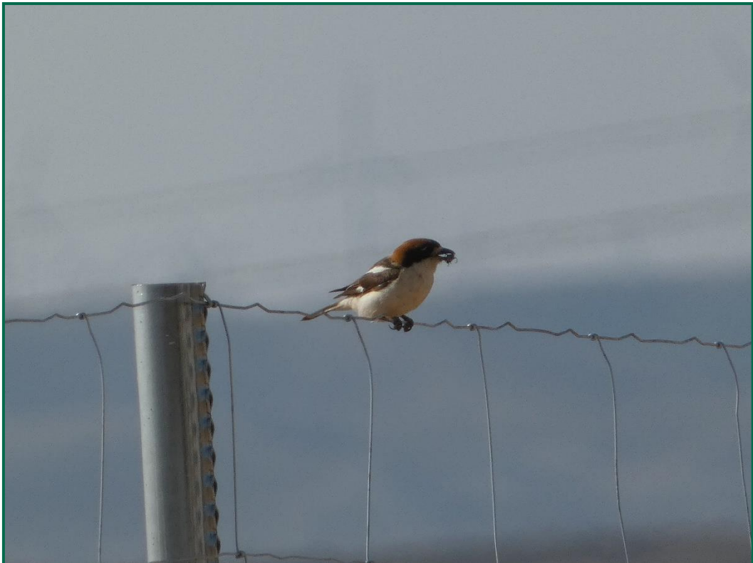
Fotografía 6. Alcaudón común ( Lanius senator ).

Se ha realizado seguimiento de avifauna durante el proceso de la obra en el mes de julio, y se han avistado las siguientes especies: Culebrera europea ( Circaetus gallicus ) posada sobre un poste eléctrico cercano, cernícalo vulgar ( Falco tinnunculus ) posado también cercano a la obra, chova piquirroja ( Pyrrhocorax pyrrhocorax ) en bandos alimentandose sobre capos de cultivos anexos a la obra, alcaraván común ( Burhinus oedicnemus ), mochuelo europeo ( Athene noctua ) y otra especie característica como es el alcaudón común ( Lanius senator ) alimentándose de un insecto sobre el vallado perimetral colocado.