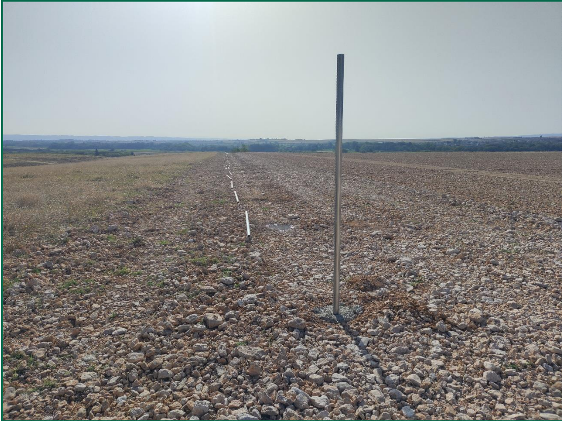
Fotografía 3. Franja vegetal.