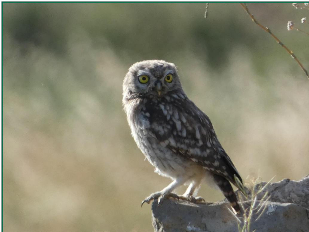
Fotografía 10. Mochuelo europeo ( Athene noctua ).