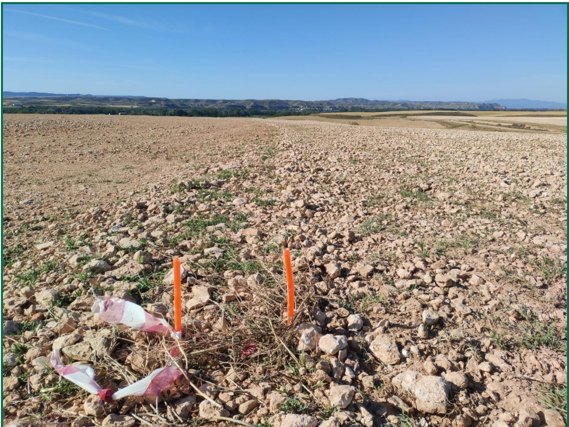
Fotografía 1. Jalonamiento.

No se realiza el balizamiento de todo el perímetro de la obra ya que se generaría una gran cantidad de residuos de malla de obra o cinta que tiende a romperse y dispersarse por toda la zona. Sí se realiza un jalonamiento del perímetro mediante banderines. La Dirección Ambiental realiza un control visual continuado para comprobar que no se sobrepasan los límites de la zona de ocupación.