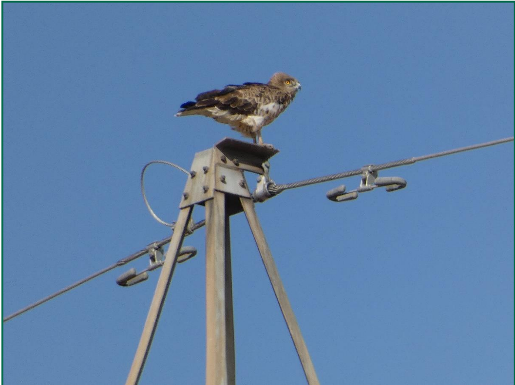
Fotografía 7. Culebrera europea ( Circaetus gallicus ).