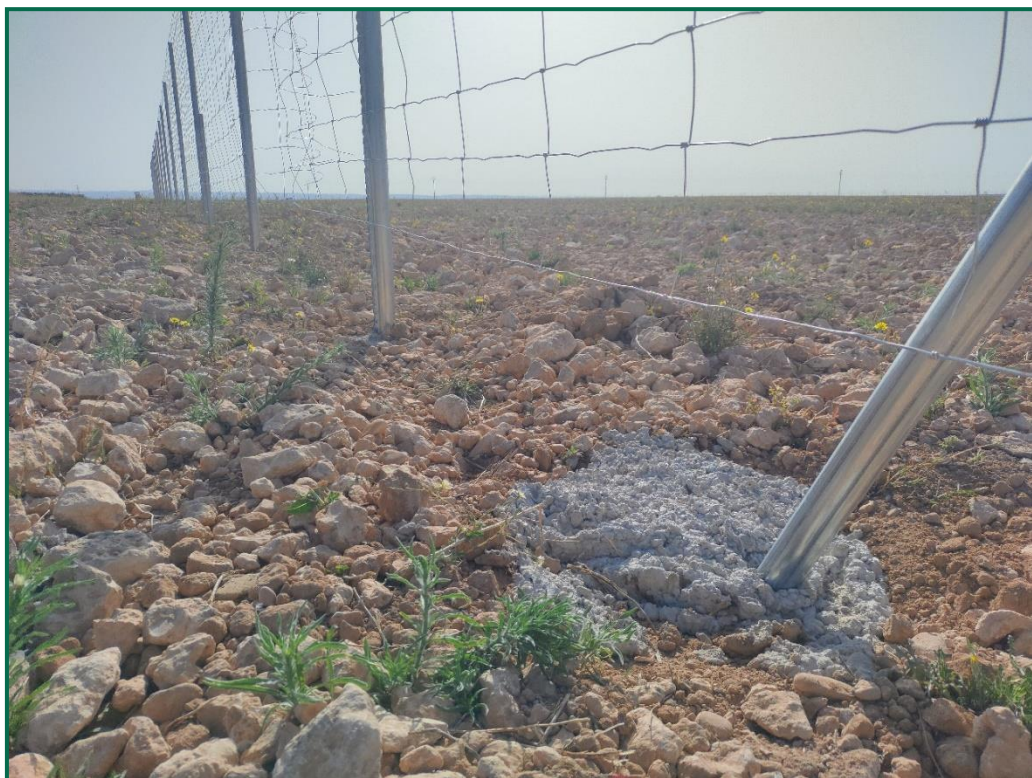
Fotografía 5. Espaciado cinético.