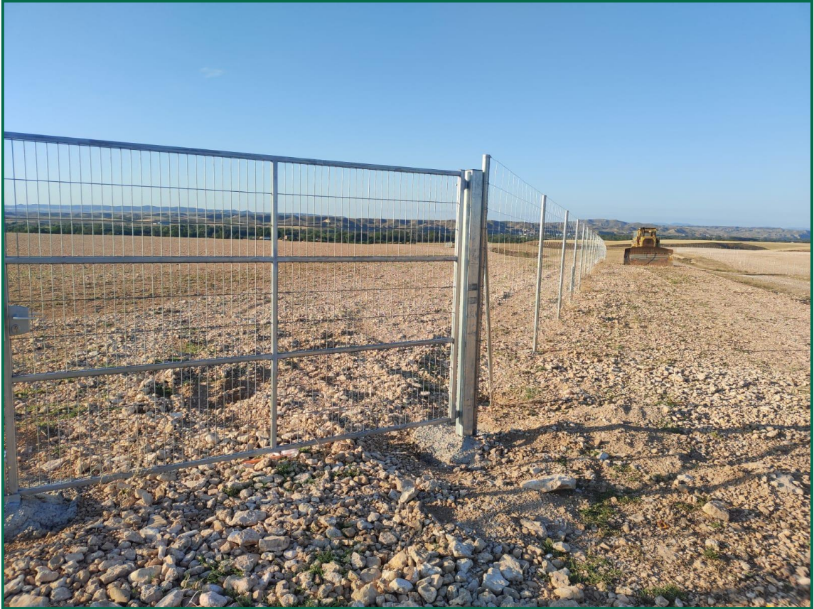
Fotografía 2. Superficie de la planta.