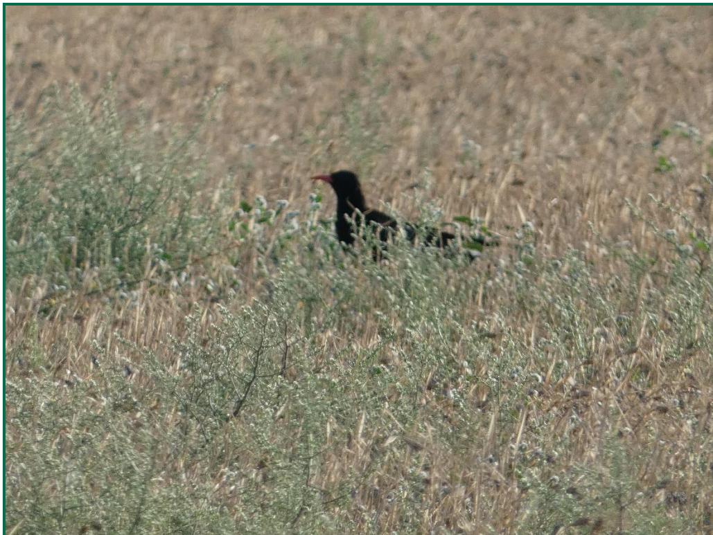
Fotografía 8. Chova piquirroja ( Pyrrhocorax pyrrhocorax ).