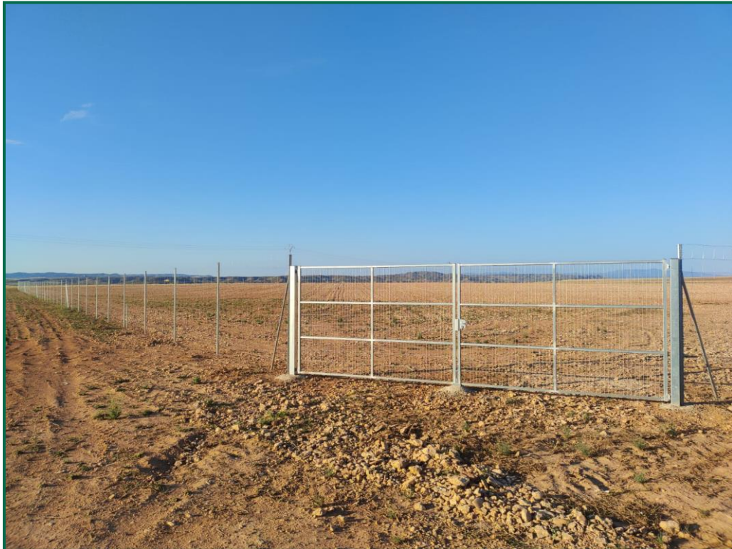
Fotografía 4. Vallado perimetral.