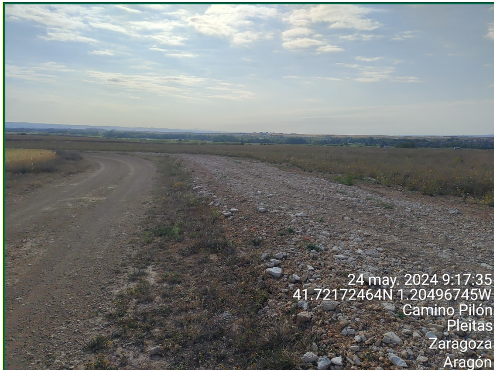
Fotografía 17. Tapado de zanjas