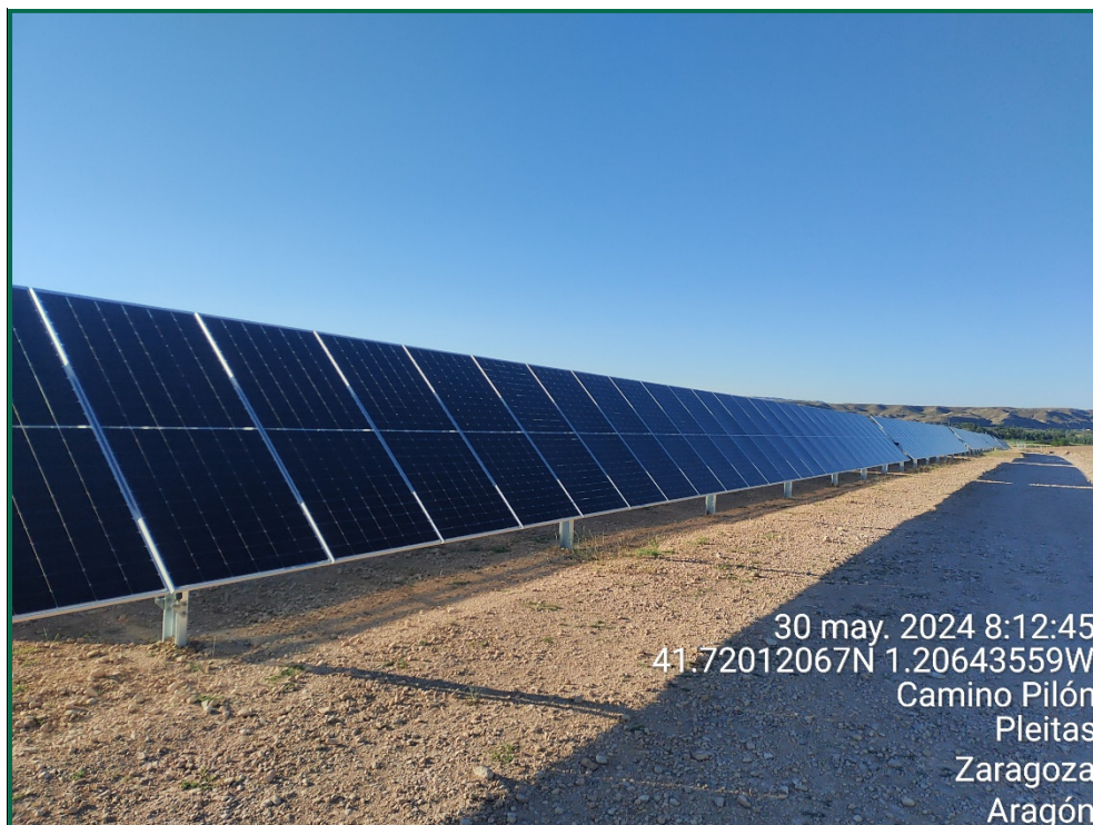
Fotografía 5. Placas fotovoltaicas.