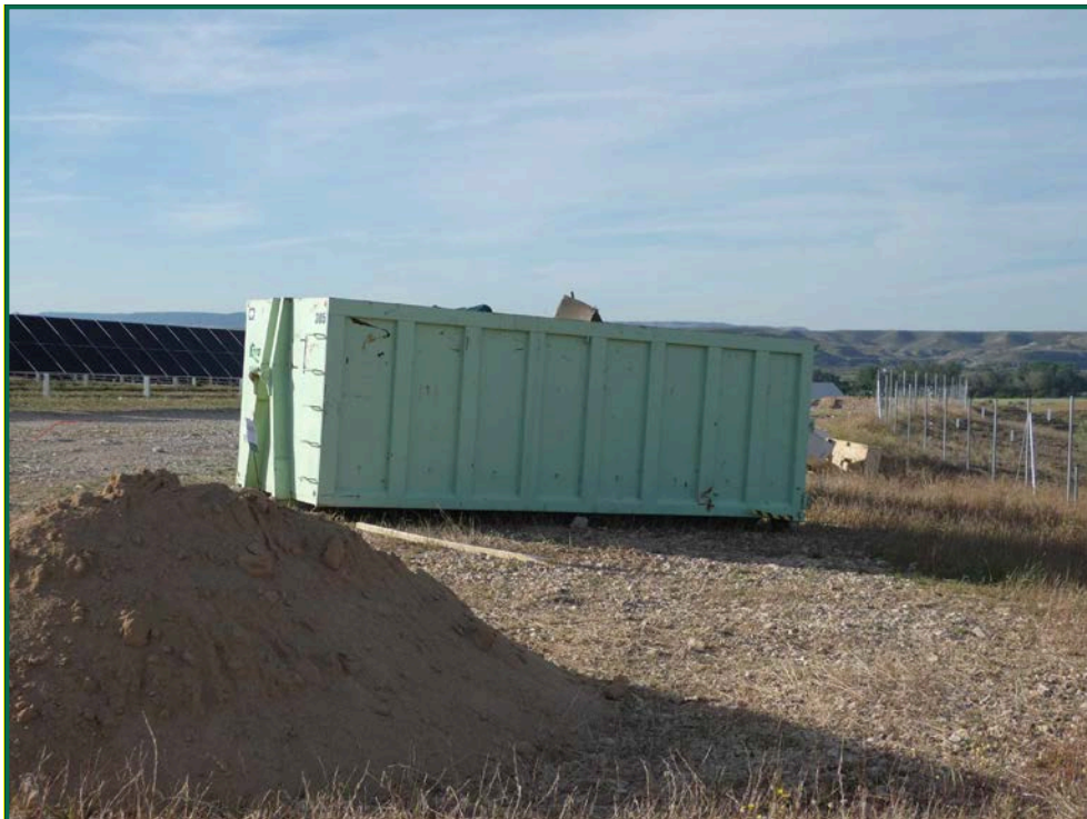
Fotografía 3. Acopios de tierra y contenedor de residuos.

Por el momento la tierra vegetal extraída ha sido escasa debido a que no ha sido necesario nivelar todo el terreno, únicamente algunas zonas y con un espesor limitado, y esta se ha ido extendiendo sobre el terreno. La tierra extraída para la construcción de balsas de limpieza se ha acopiado en caballones al igual que la tierra retirada para realizar zanjas. En las zonas donde se van a realizar plantaciones para crear una patalla vegetal no se ha realizado ningún movimiento de tierra, conservando la capa de tierra vegetal presente.