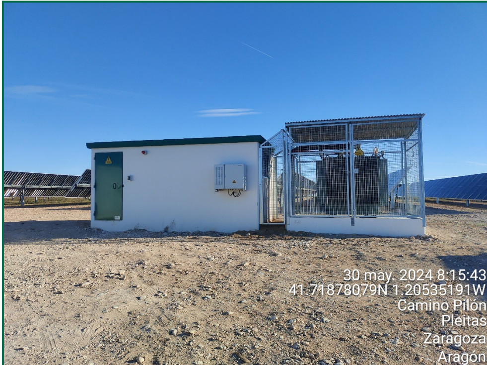
Fotografía 6. Estructura del CT