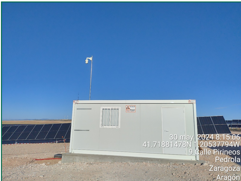
Fotografía 7. Caseta de control.