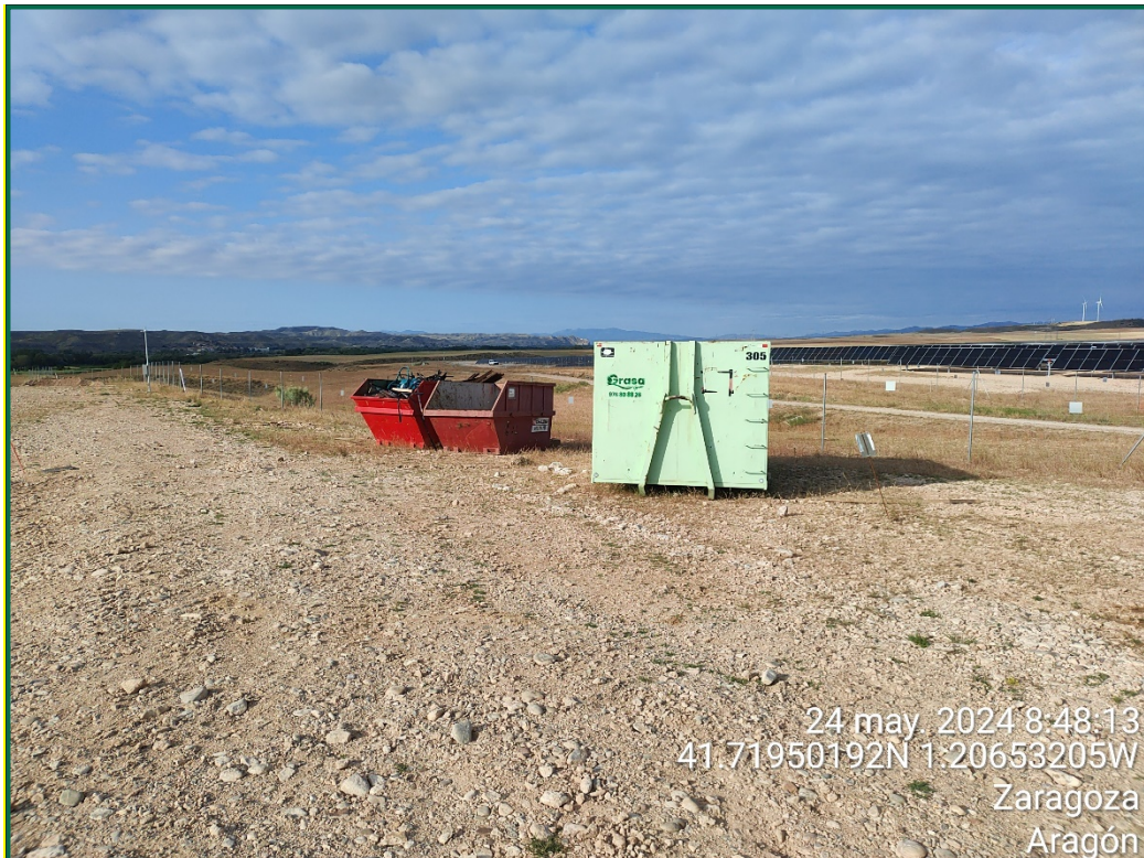
Fotografía 13. Contenedores de residuos.