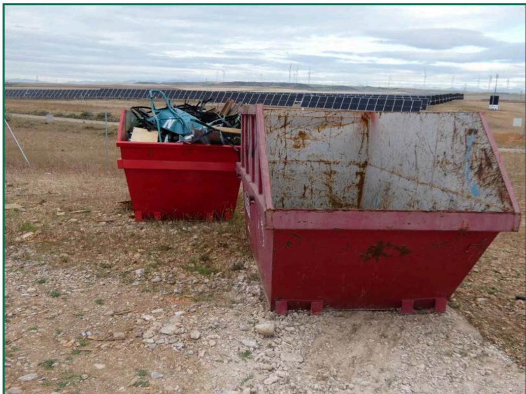
Fotografía 14. Contenedores de residuos.