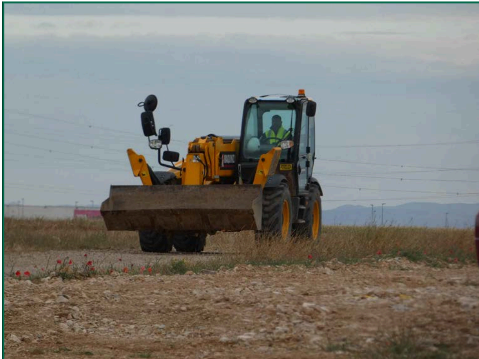
Fotografía 2. Maquinaria de obra.

Durante las visitas a obra no se constata afección por emisión de polvo significativa durante los trabajos. Se prevé humedecer los caminos cuando las circunstancias lo requieran con la presencia de una cuba esparciendo agua por el terreno.