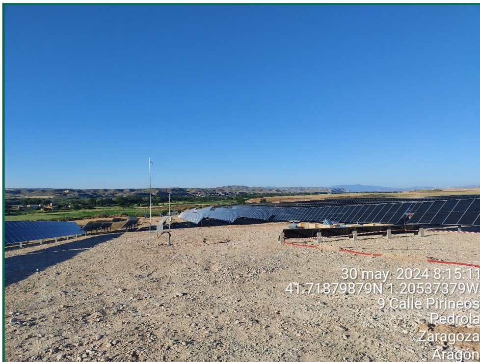
Fotografía 1. Balizado.

No se realiza el balizamiento de todo el perímetro de la obra ya que se generaría una gran cantidad de residuos de malla de obra o cinta que tiende a romperse y dispersarse por toda la zona. Sí se realiza un jalonamiento del perímetro mediante banderines. La Dirección Ambiental realiza un control visual continuado para comprobar que no se sobrepasan los límites de la zona de ocupación.