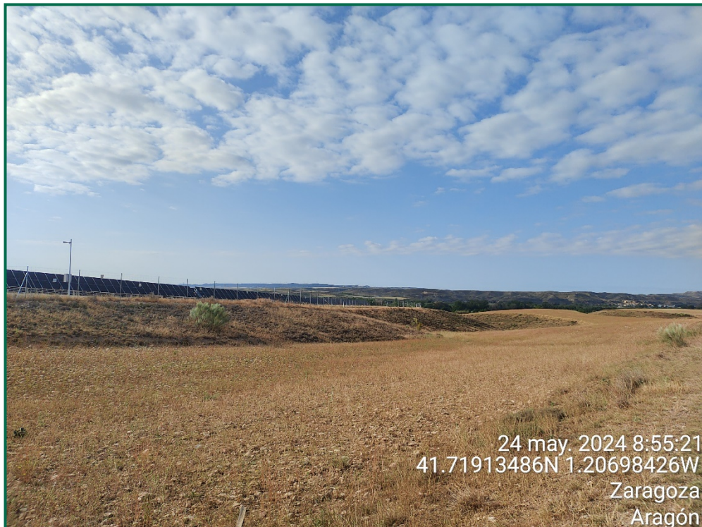
Fotografía 9. Vegetación natural.