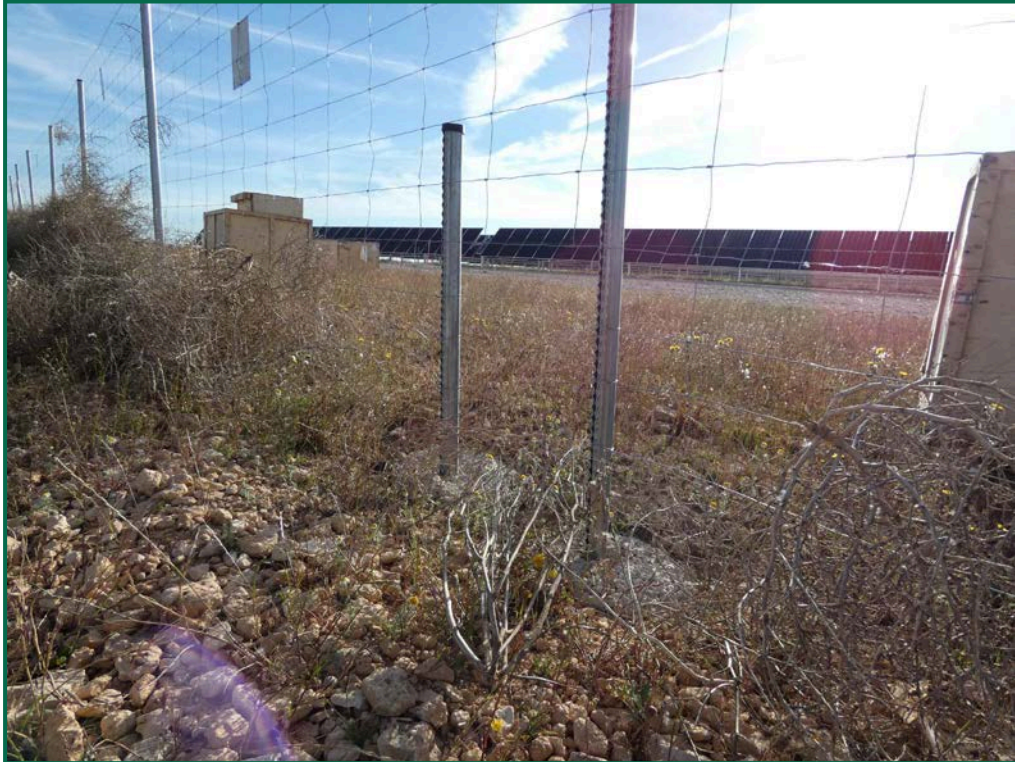
Fotografía 12. Espaciado cinegético.

Se ha realizado seguimiento de avifauna durante el proceso de la obra en el mes de septiembre, y se han avistado las siguientes especies: cuervo grande ( Corvus corax ), corneja negra ( Corvus corone ), milano negro ( Milvus migrans ) y chova piquirroja ( Pyrhocorax pyrrhocorax ). Además de otras especies de menor embergadura como pueden ser calandria común ( Melanocorypha calandra ), cogujada montesina ( Galerida teklae ), alcaudón real ( Lanius meridionalis ), estornino negro ( Sturnus unicolor ) o pardillo común ( Linaria cannabina ).