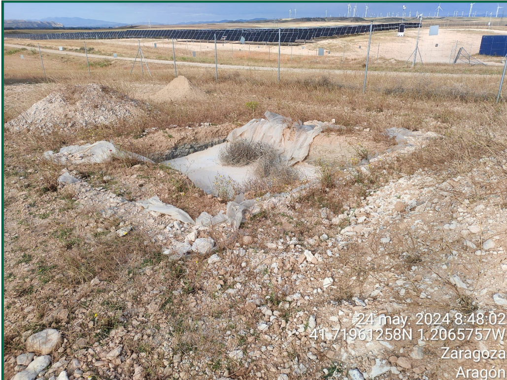
Fotografía 15. Balsa de limpieza.