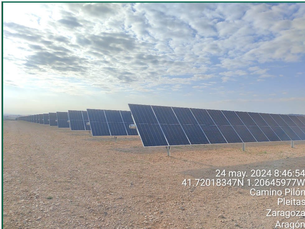
Fotografía 4. Superficie de la obra.