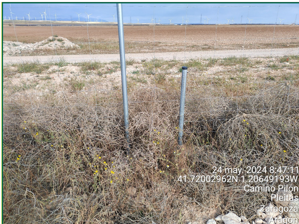
Fotografía 10. Vallado perimetral y placa anticolidión.

24 may. 2024 8:47:11 41.72002962N 1.20649193W Camino Pilón Pleitás Zaragoza Aragón