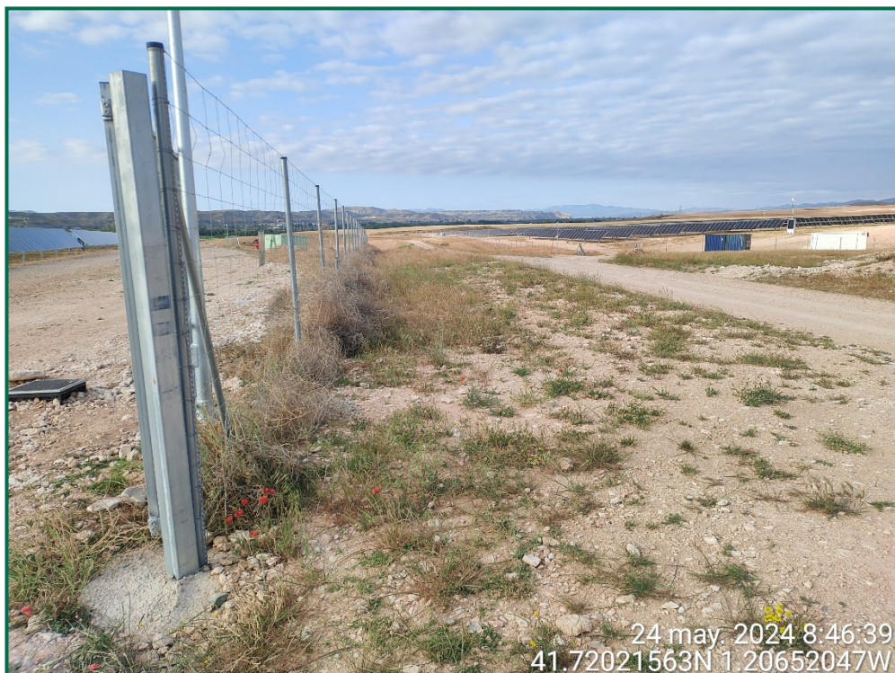
Fotografía 8. Franja vegetal y capitanas sobre el vallado.

Durante las visitas a obra se comprueba que la ocupación de zonas de vegetación se limita a lo aprobado en el proyecto. Se verifica también que la maquinaria circula únicamente por los viales habilitados para tal fin. Desde el inicio de las obras se ha planificado la ejecución de una franja vegetal de 8 m de anchura en torno al vallado perimetral.