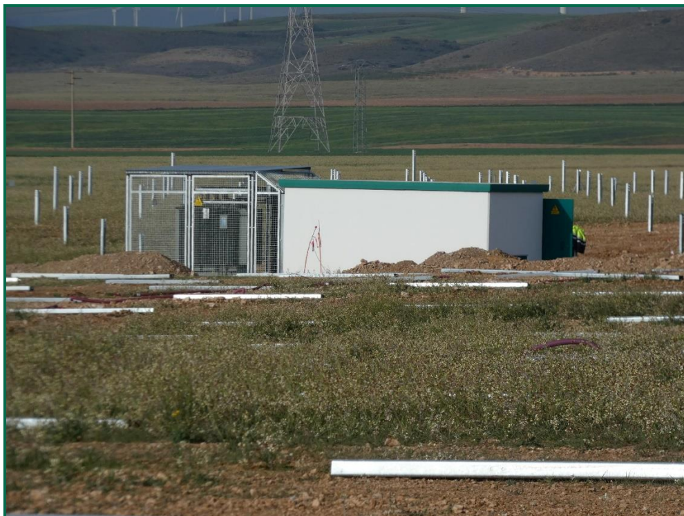
Fotografía 5. Caseta del inversor.