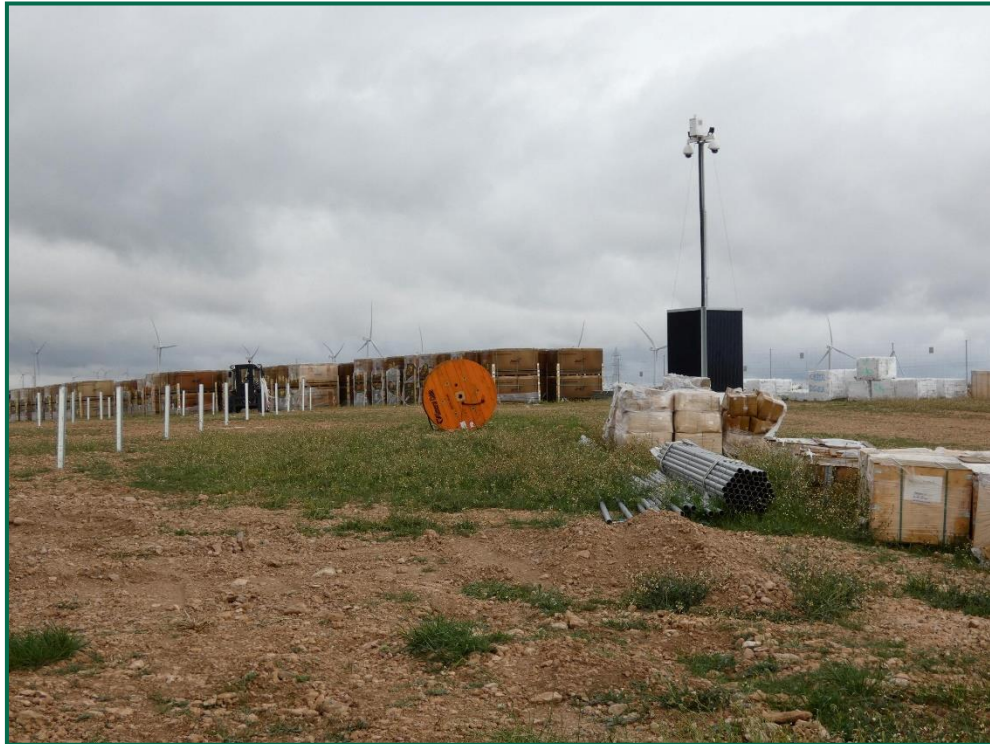
Fotografía 4. Materiales y cámara de vigilancia portatil.