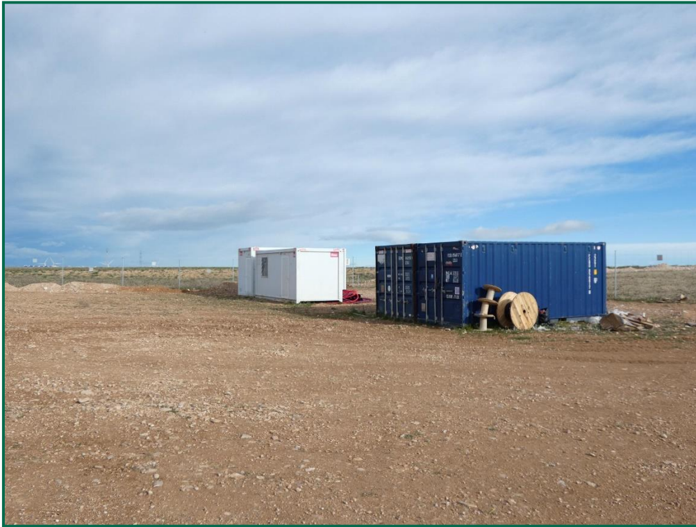
Fotografía 10. Contenedores de gestión y materiales.