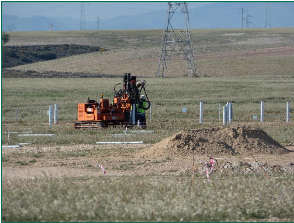
Fotografía 3. Acopios de tierra y máquina hincapostes.

Por el momento la tierra vegetal extraída ha sido escasa debido a que no ha sido necesario nivelar todo el terreno, únicamente algunas zonas y con un espesor limitado, y esta se ha ido extendiendo sobre el terreno. La tierra extraída para la construcción de balsas de limpieza se ha acopiado en caballones al igual que la tierra retirada para realizar zanjas. En las zonas donde se van a realizar plantaciones para crear una patalla vegetal no se ha realizado ningún movimiento de tierra, conservando la capa de tierra vegetal presente.