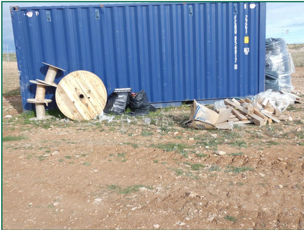
Fotografía 11. Restos de materiales utilizados.