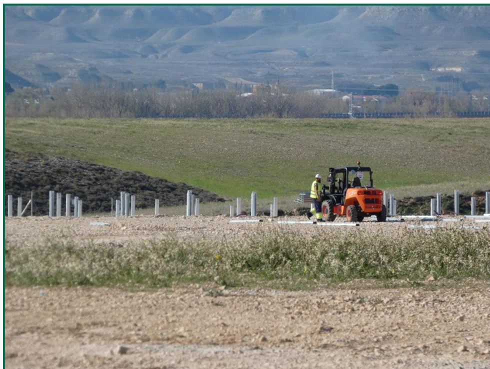
Fotografía 2. Maquinaria de construcción.