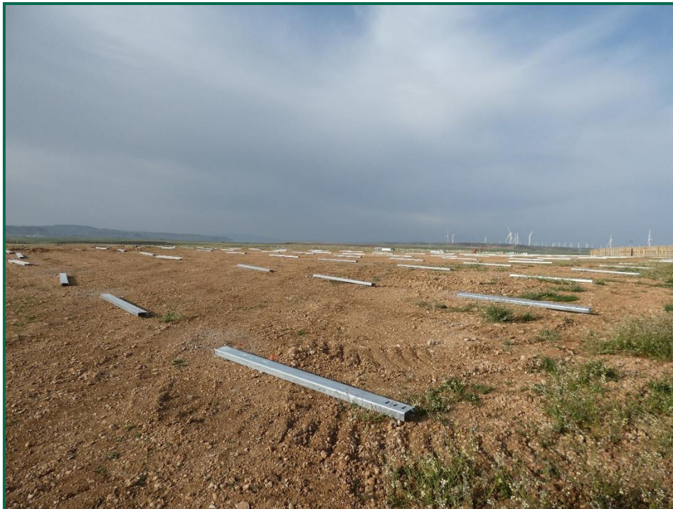
Fotografía 6. Superficie de la obra.

Durante las visitas a obra se comprueba que la ocupación de zonas de vegetación se limita a lo aprobado en el proyecto. Se verifica también que la maquinaria circula únicamente por los viales habilitados para tal fin. Desde el inicio de las obras se ha planificado la ejecución de una franja vegetal de 8 m de anchura en torno al vallado perimetral.