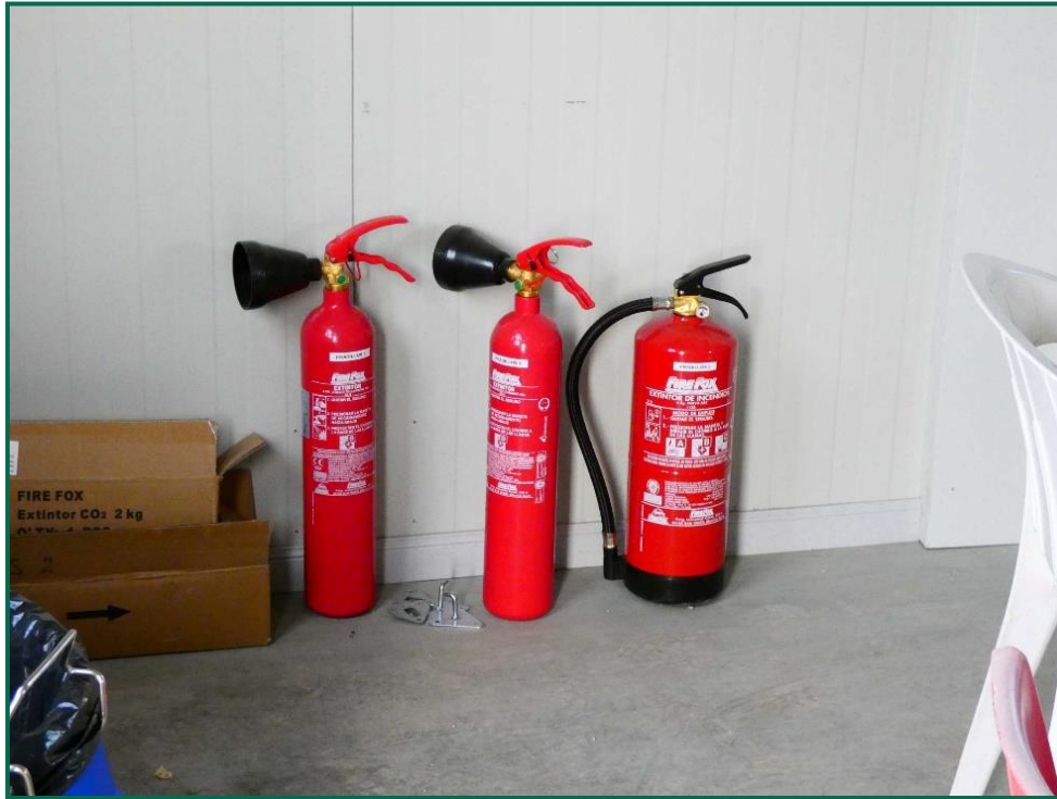
Fotografía 14. Extintores en el contenedor de gestión de la obra.