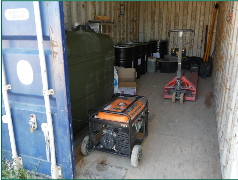
Fotografía 12. Punto limpio de residuos peligrosos y envase de combustible.