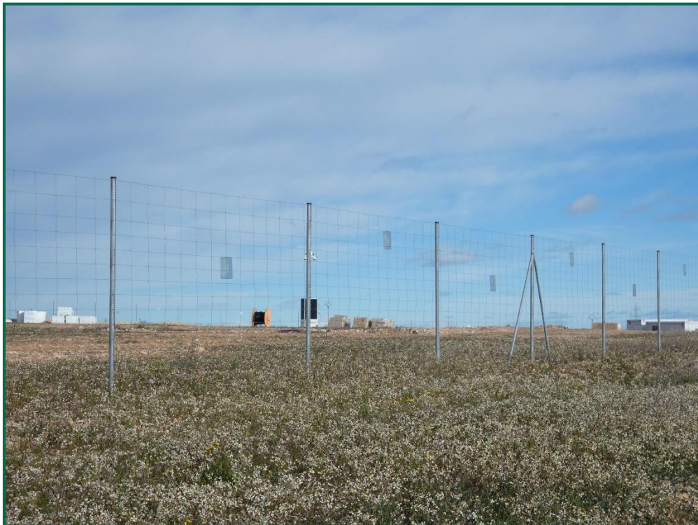
Fotografía 7. Vallado perimetral y placas anticolidión.

El vallado perimetral se ha instalado utilizando malla cinéptica y dejando un espacio de al menos 20 cm desde el suelo. Además se ha dejado un espacio en el vallado para fauna de mayor tamaño. Por otro lado, se han instalado las placas anticolidión a diferentes alturas sobre la malla.