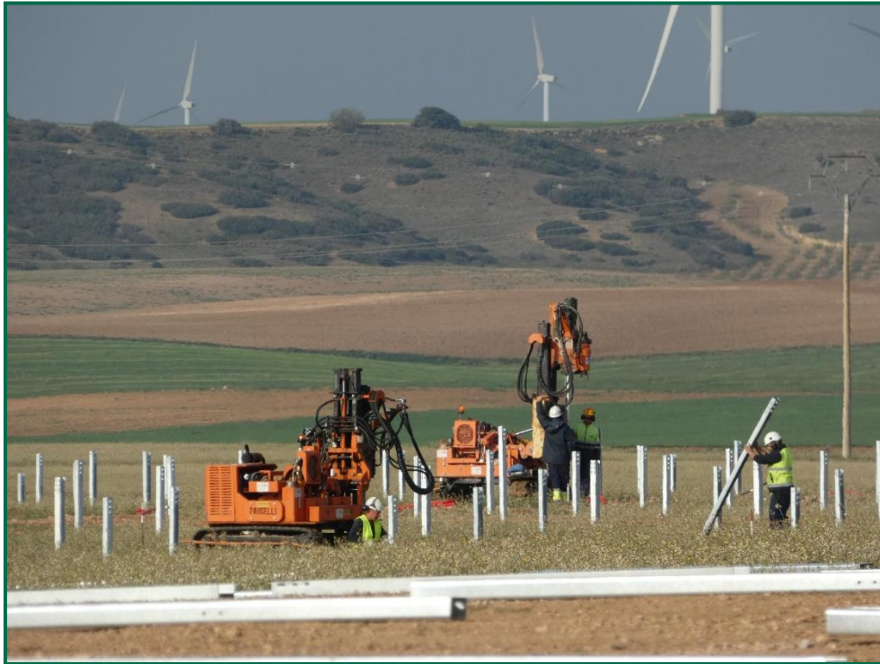
Fotografía 1. Maquinaria hincapostes.