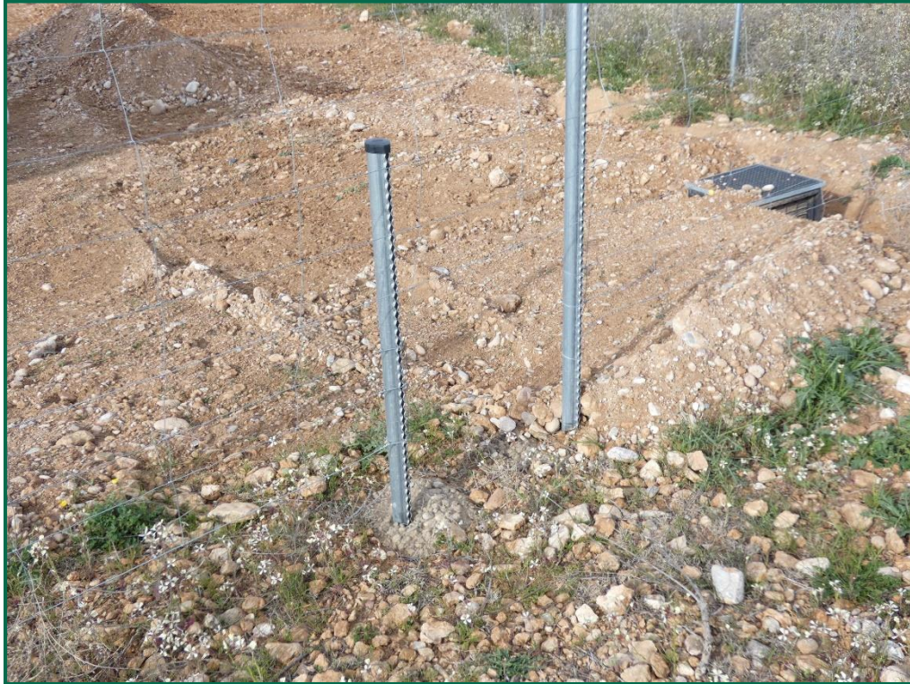
Fotografía 8. Espaciado cinegético.

Se ha realizado seguimiento de avifauna durante el proceso de la obra en el mes de septiembre, y se han avistado las siguientes especies: milano negro ( Milvus migrans ), cuervo grande ( Corvus corax ), corneja negra ( Corvus corone ) y chova piquirroja ( Pyrrhocorax pyrrhocorax ). Además de otras especies de menor embergadura como pueden ser calandria común ( Melanocorypha calandra ), cogujada montesina ( Galerida teklae ), alcaudón real ( Lanius meridionalis ), estornino negro ( Sturnus unicolor ) o pardillo común ( Linaria cannabina ).