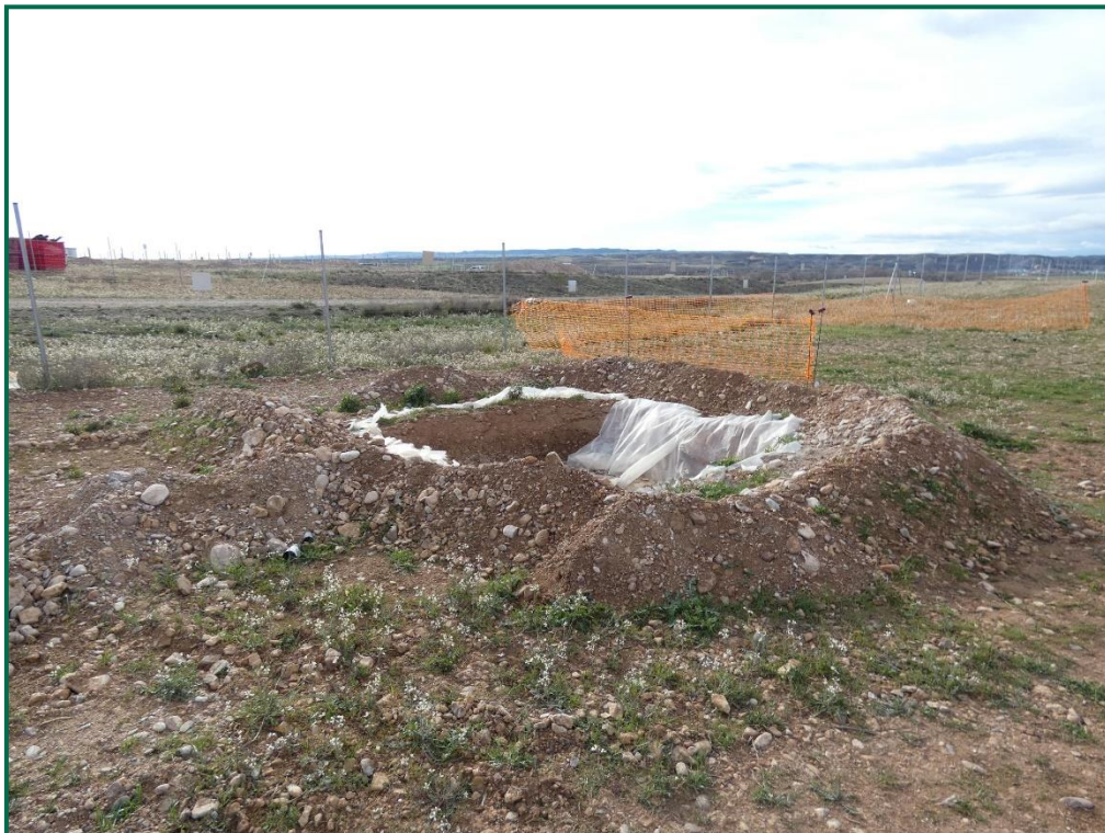
Fotografía 9. Balsa de limpieza.

Se están utilizando grupos electrógenos y se han instalado envases de combustible. Además, se han colocado bandejas de contención debajo de ellos para evitar derrames por pérdidas accidentales sobre el terreno.