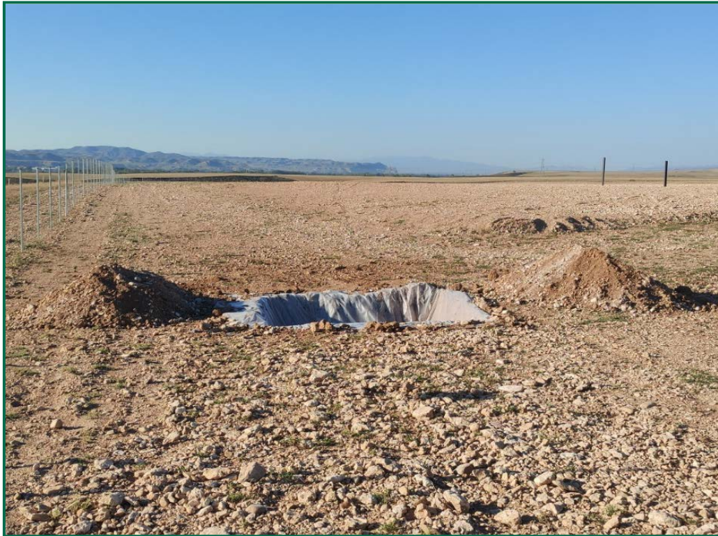
Fotografía 1. Acopios de tierra y balsa.