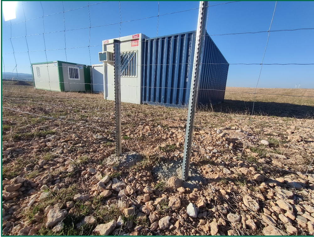
Fotografía 3. Espaciado cinegético.

Se ha realizado seguimiento de avifauna durante el proceso de la obra en el mes de septiembre, y se han avistado las siguientes especies: Cernícalo vulgar ( Falco tinnunculus ) posado sobre el vallado y en un poste eléctrico, chova piquirroja ( Pyrhocorax pyrrhocorax ) en bandos alimentándose sobre campos de cultivos anexos a la obra, corneja negra ( Corvus corone ) y otras especies de menor tamaño posadas sobre el vallado como son la cogujada montesina ( Galerida teklae ) y collalba gris ( Oenanthe oenanthe ).