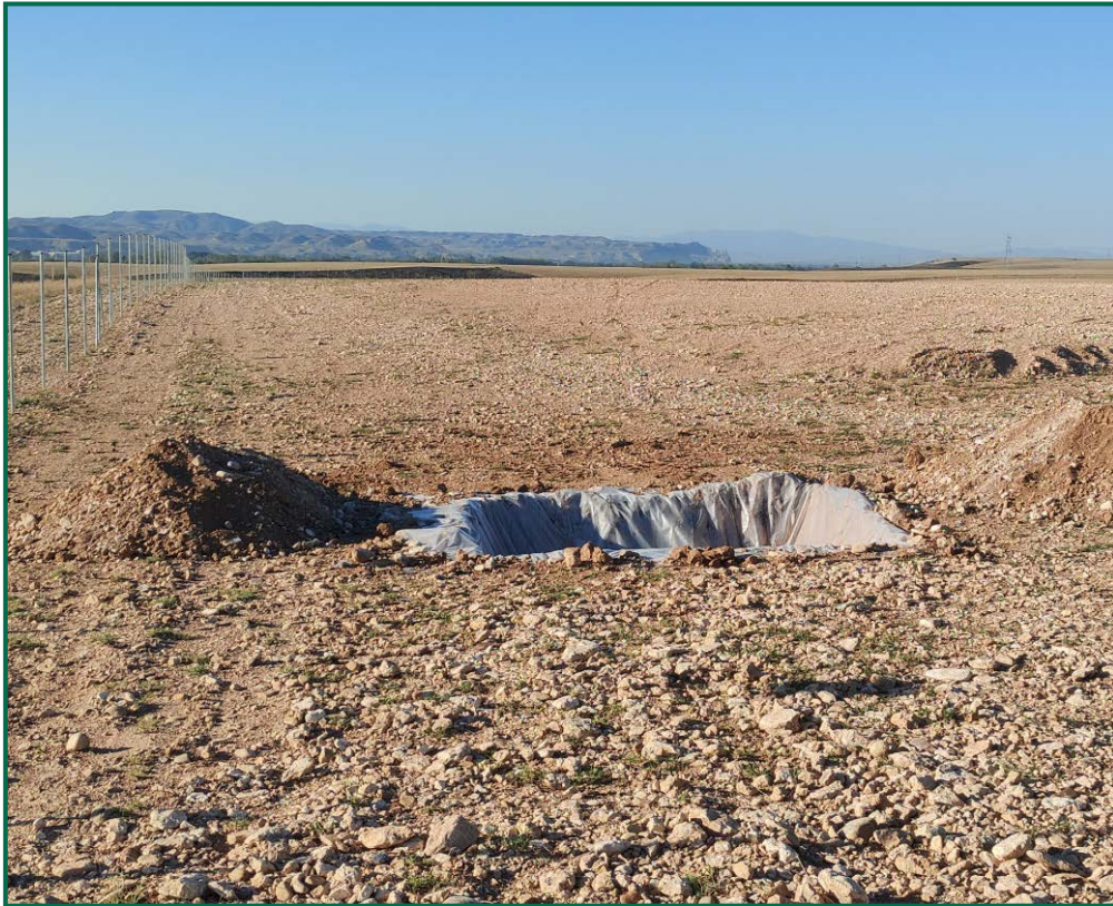
Fotografía 9. Balsa de limpieza.