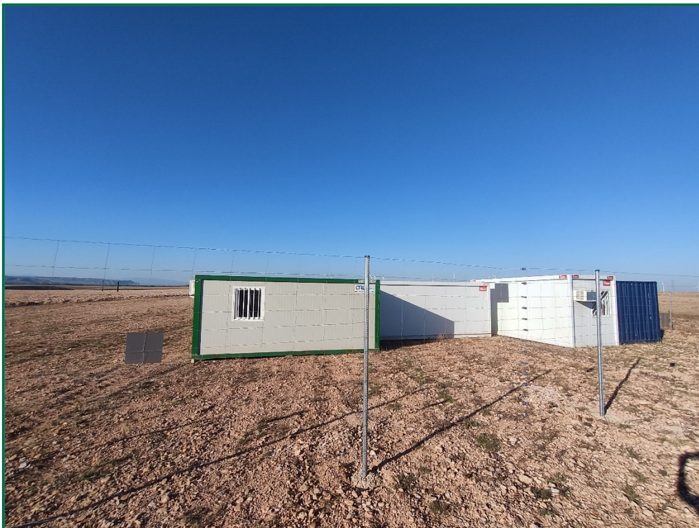
Fotografía 8. Contenedores de residuos.

Todavía no se han utilizado grupos electrógenos ni se han instalado envases de combustible, cuando se comiencen a utilizar se colocarán bandejas de contención debajo de ellos para evitar derrames por pérdidas accidentales sobre el terreno.