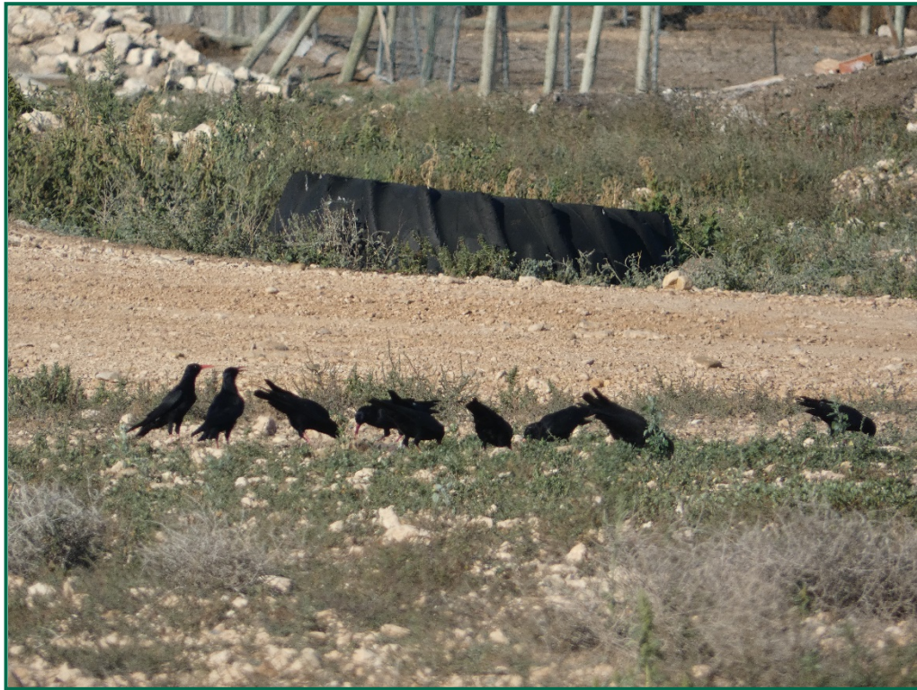
Fotografía 6. Chova piquirroja ( Pyrrhocorax pyrrhocorax ).