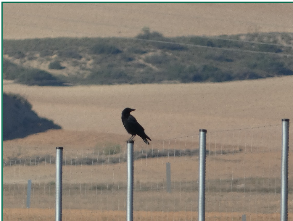
Fotografía 7. Corneja negra ( Corvus corone ).