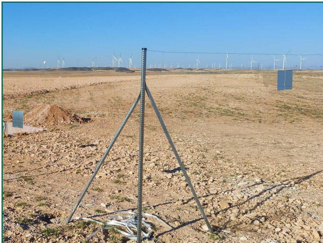
Fotografía 2. Vallado perimetral y placas anticolidión.

El vallado perimetral se ha instalado utilizando malla cinégetica y dejando un espacio de al menos 20 cm desde el suelo. Además se ha dejado un espacio en el vallado para fauna de mayor tamaño. Por otro lado, se han instalado las placas anticolidión a diferentes alturas sobre la malla.