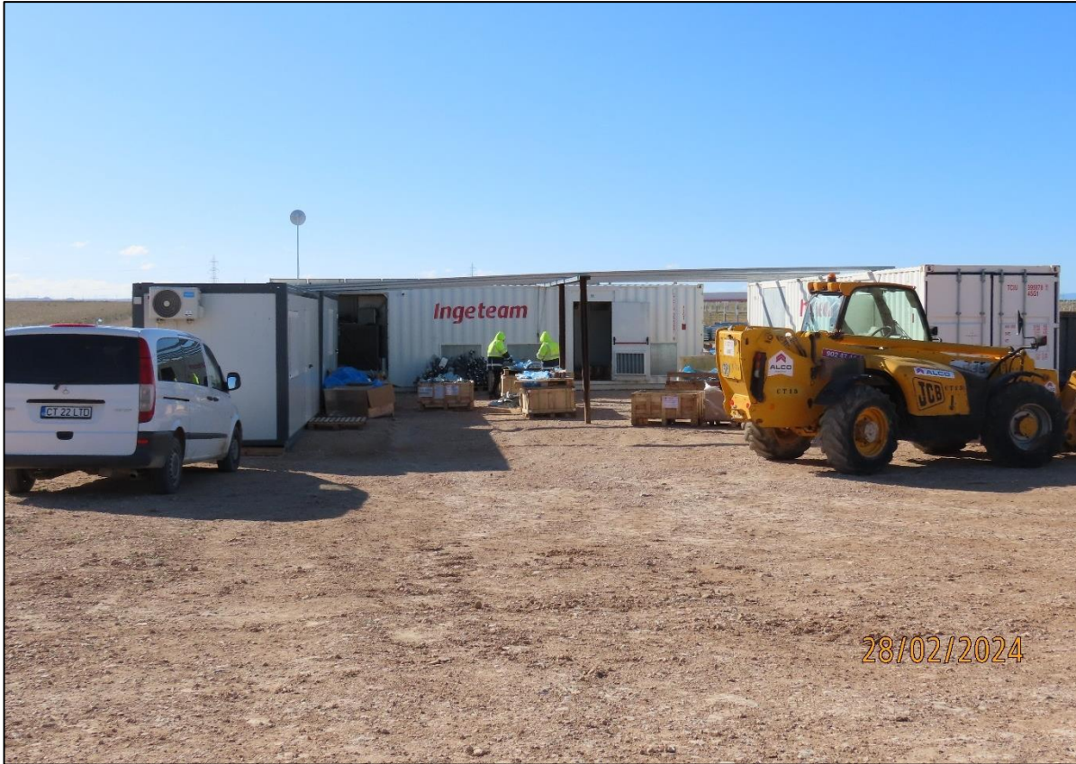
Ilustración 5. Comienzo del montaje de los seguidores.