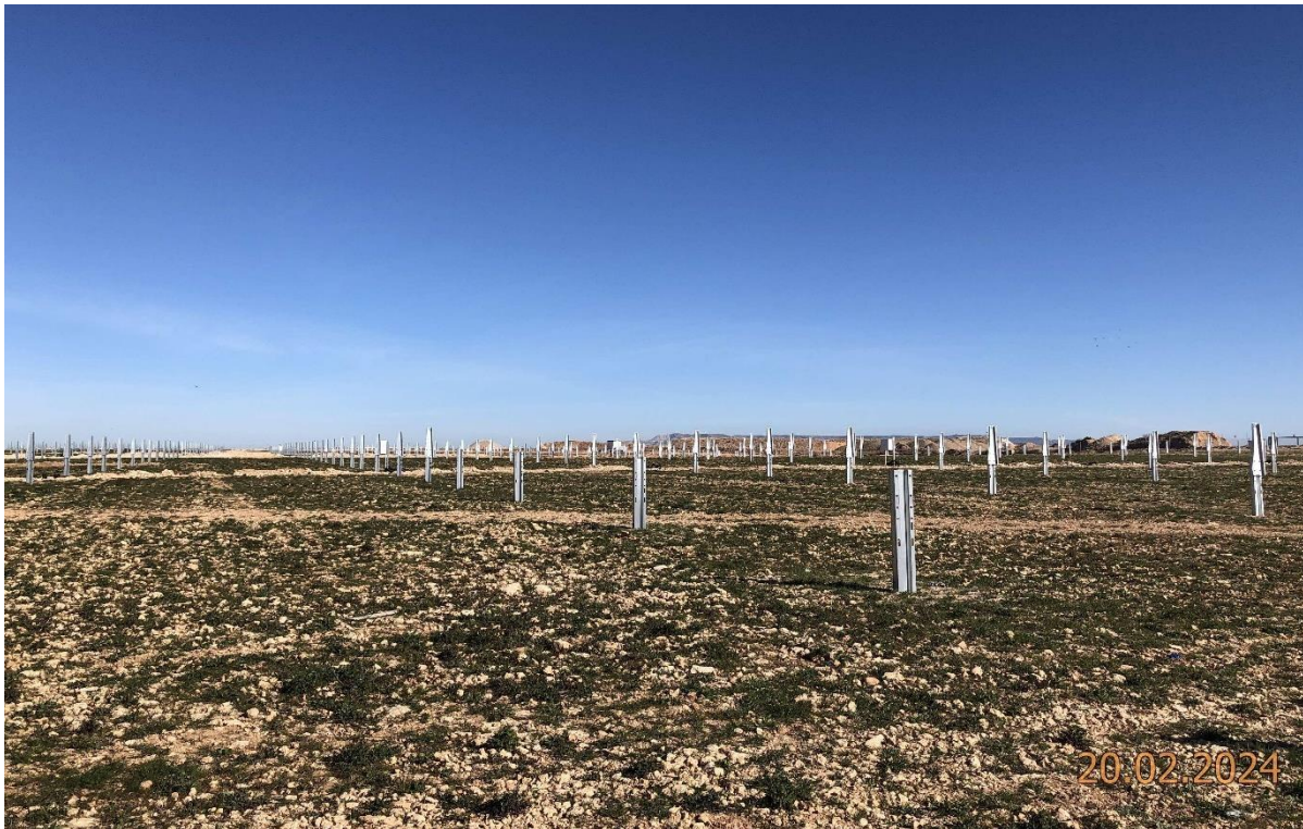
Ilustración 6. Estado actual del parque.