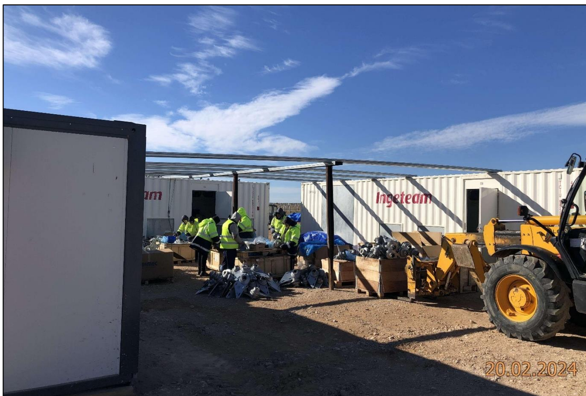
Ilustración 4. Comienzo del montaje de los seguidores.