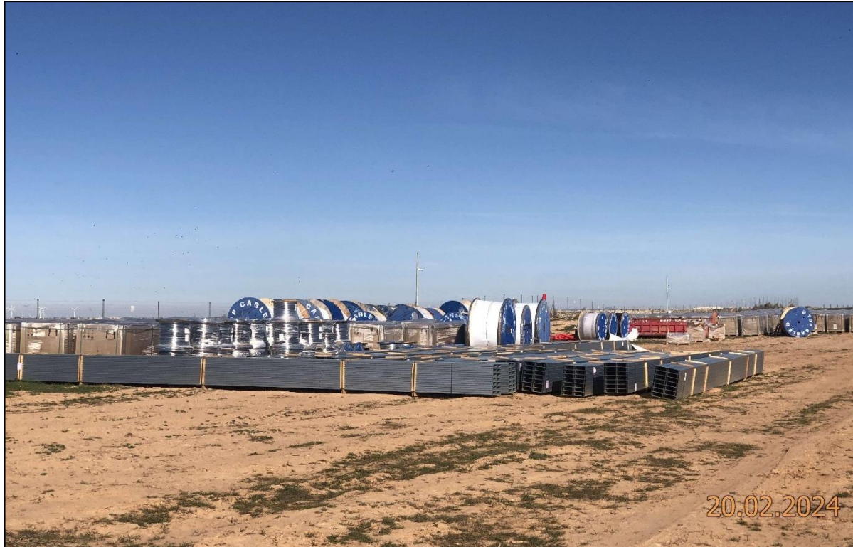
Ilustración 3. Recepción y acopio de materiales de obra.