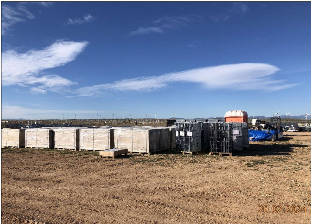
Ilustración 2. Recepción y acopio de materiales de obra.

La tres primeras semanas del mes la obra ha permanecido parada debido a que, tras la finalización del hincado, se ha esperado la llegada del material necesario para proseguir con el montaje de los seguidores. Por lo que, para el presente informe, se ha realizado vigilancia ambiental únicamente en dos visitas.