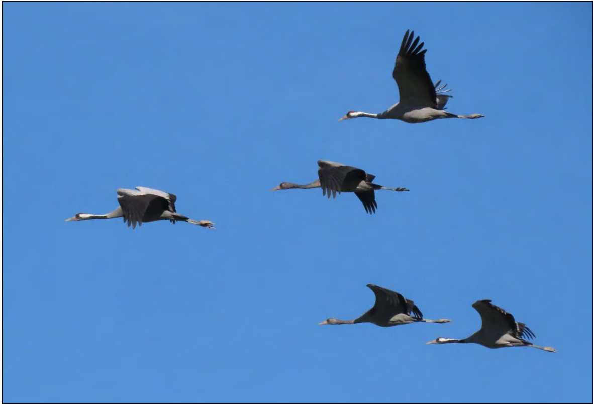
Ilustración 9. Bando de grulla común ( Grus grus ).