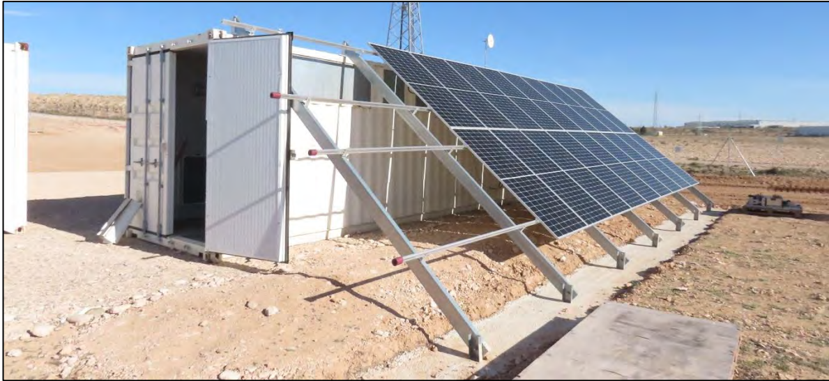
Ilustración 3. Sistema de abastecimiento eléctrico para las casetas de obra.