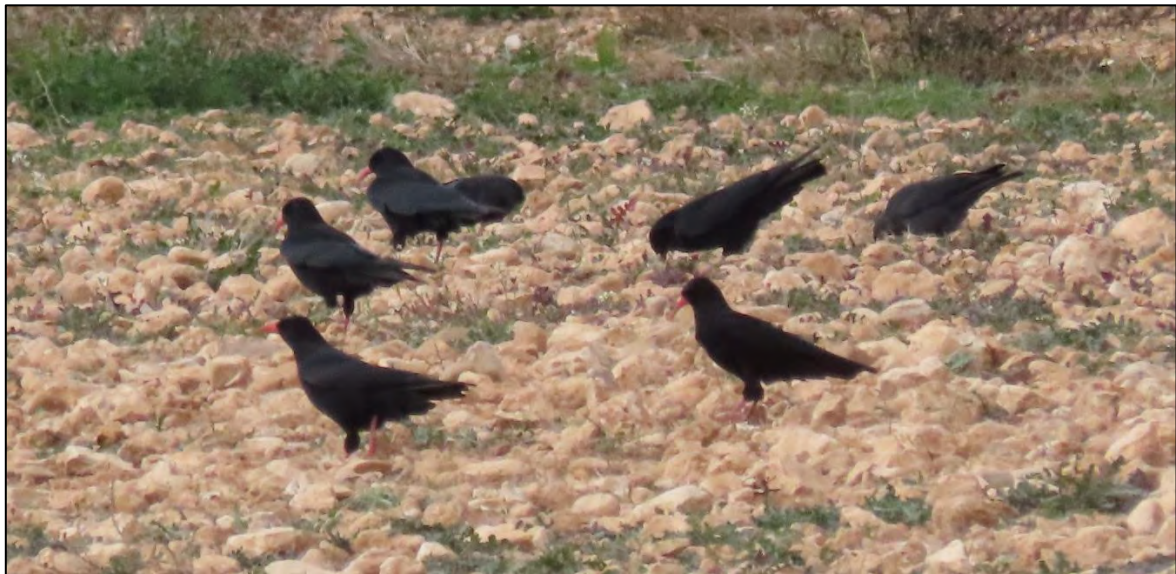
Ilustración 8. Bando de chova piquirroja ( Pyrhacorax pyrhacorax ).

La cartografía que reúne las especies de interés avistadas durante el mes de noviembre en el seguimiento de avifauna en fase de construcción se muestra en el ANEXO 2 .