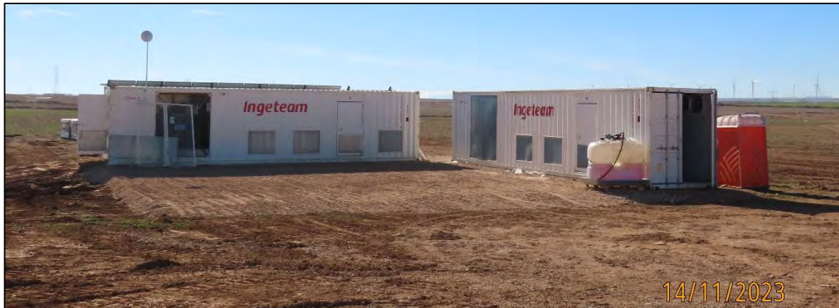
Ilustración 4. Campamento de obra.