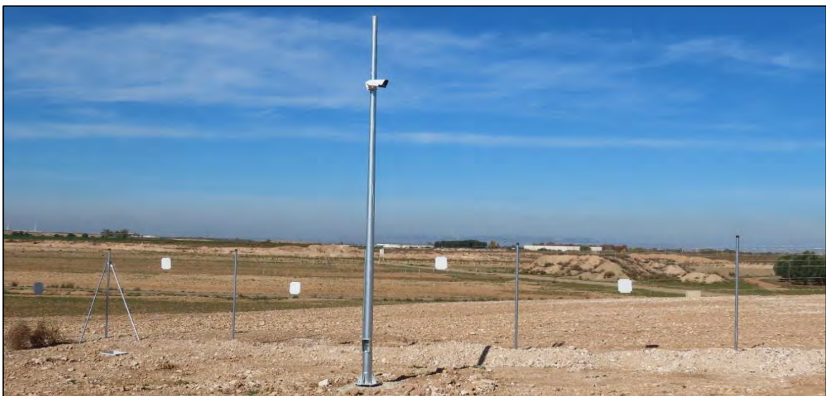
Ilustración 5. Sistema de videovigilancia.