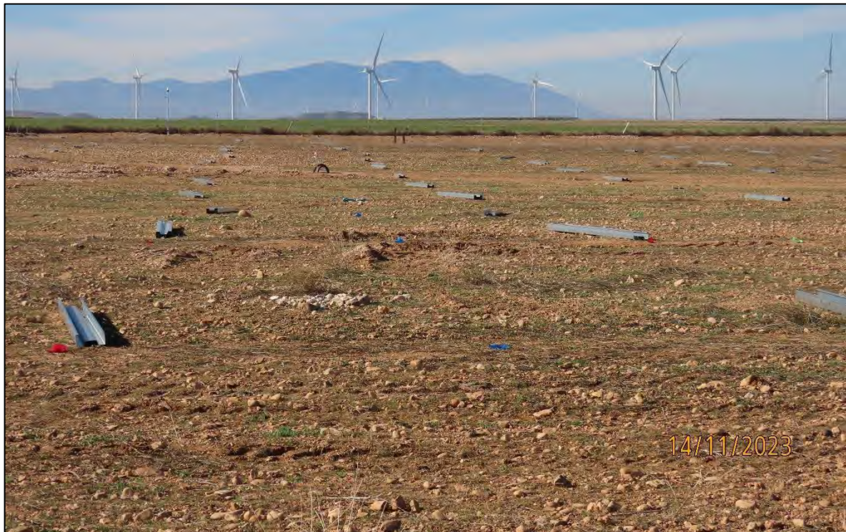
Ilustración 2. Marcado de ubicaciones y disposición de las hincas.

La última semana del mes la obra ha permanecido parada, a la espera de que lleguen las hincadoras y comenzar con los trabajos de hincado. Por lo que la última semana del mes de noviembre no se realiza vigilancia ambiental en fase de explotación.