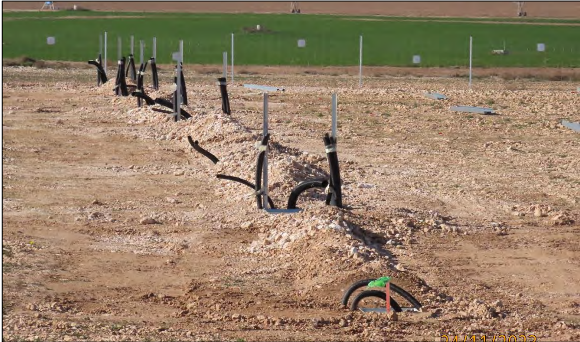
Ilustración 6. Tapado de zanjas.