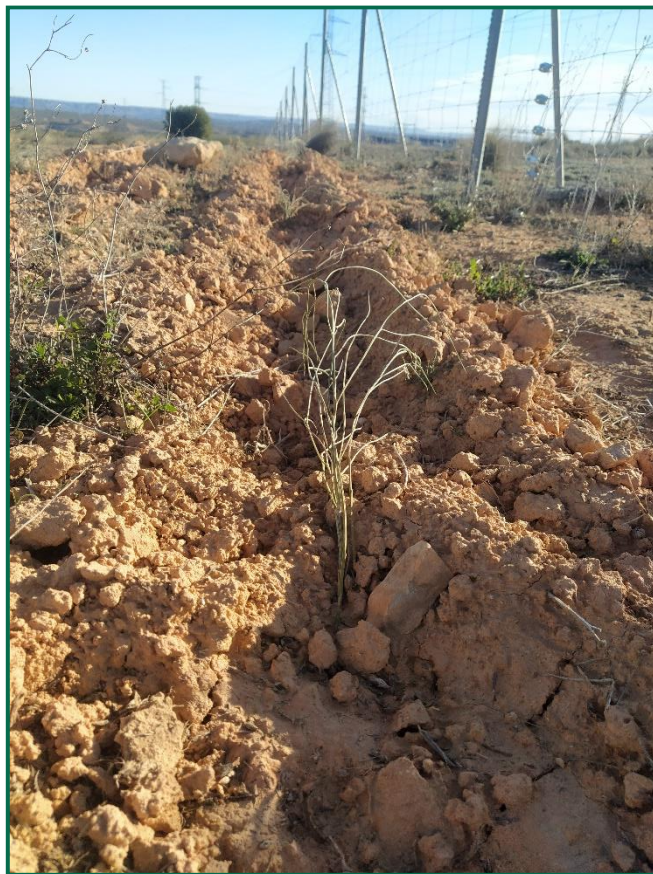
Fotografía 2. Zona revegetada.