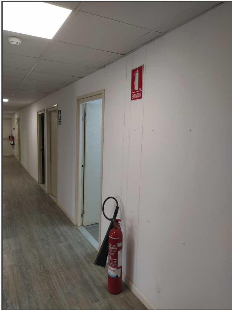
Fotografía 16. Extintores en edificio de control.