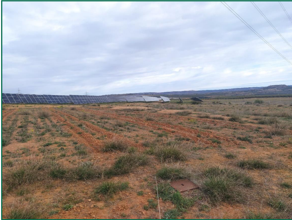
Fotografía 1. Zona revegetada.