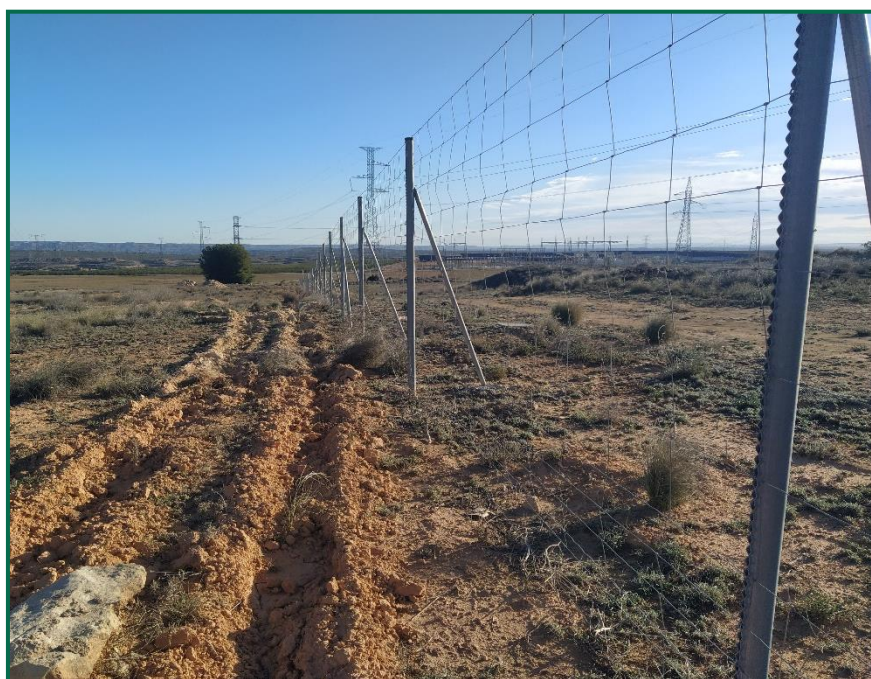
Fotografía 3. Vallado perimetral.

Respecto al vallado perimetral, se ha utilizado en todas las plantas malla cinagética que permite el paso de fauna de pequeño tamaño. Este vallado mide 2 metros de altura total y está formado por una serie de alambres verticales y horizontales, con una separación entre los verticales de 30cm, y entre los horizontales de mínimo 15cm en la línea inferior. Este vallado no presenta elementos cortantes ni punzantes.