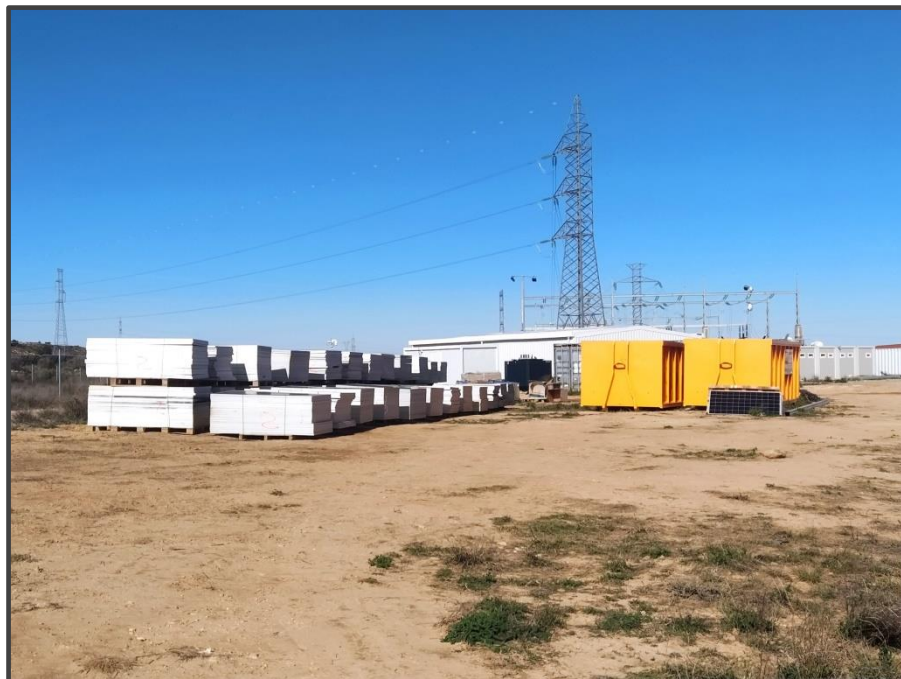
Fotografía 15. Zona de acopio de placas solares deterioradas.