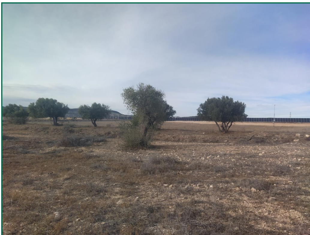
Fotografía 4. Zonas internas con vegetación original.