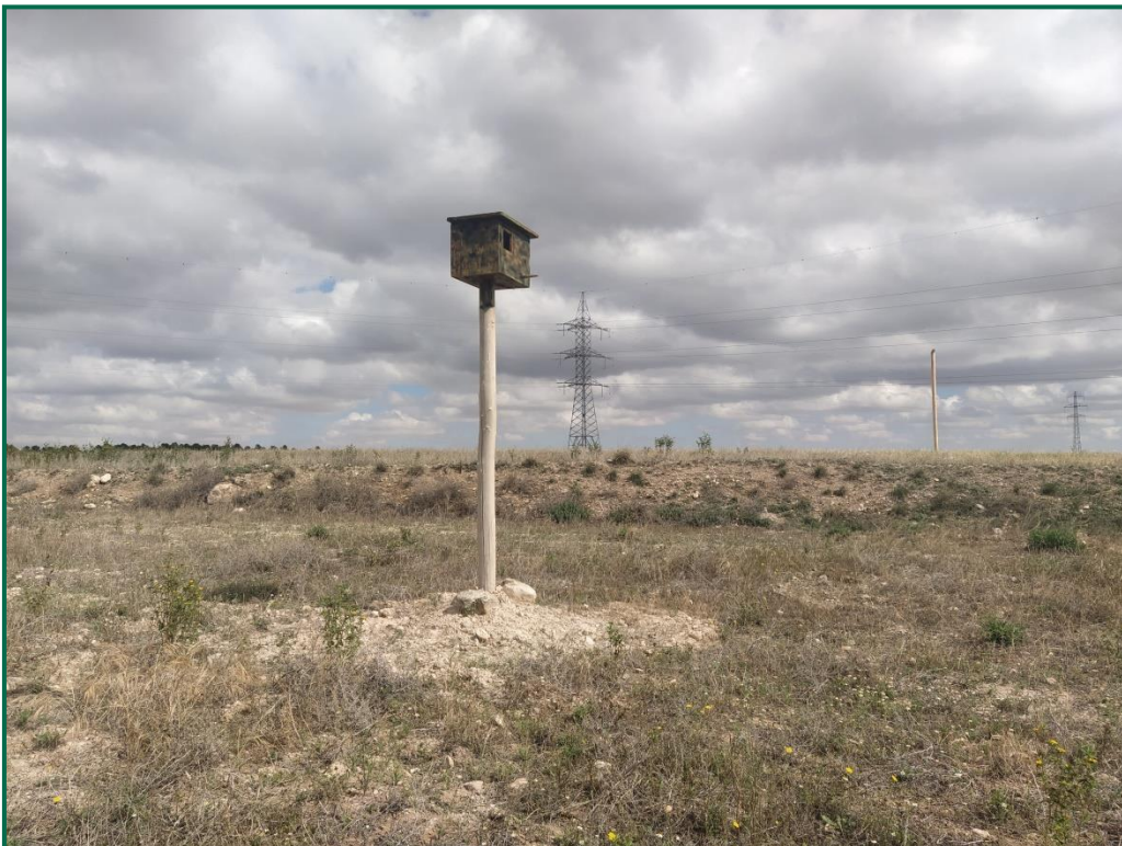
Fotografía 10. Nidal.