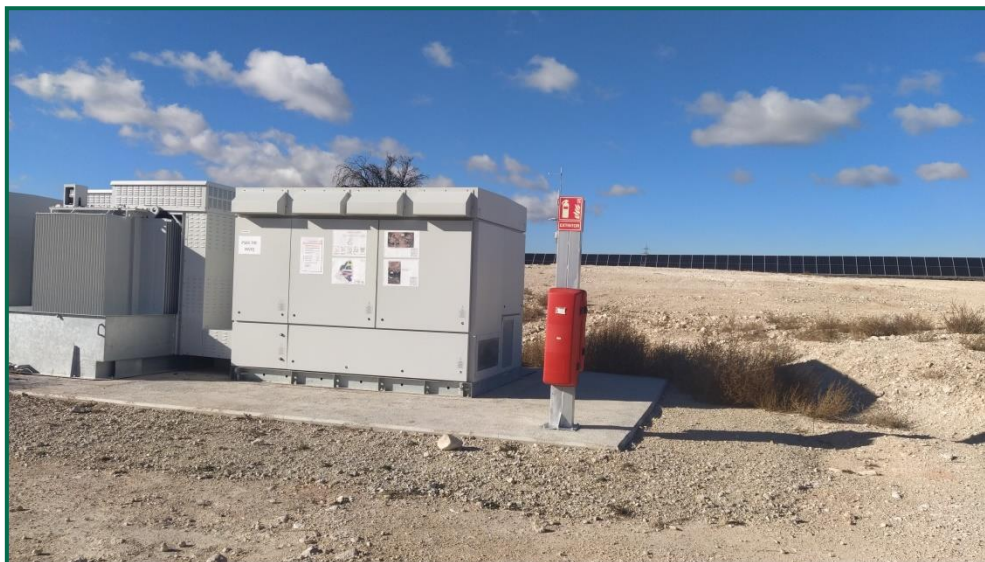
Fotografía 14. Extintor junto a inversores.

Se dispone de extintores en la zona de la subestación y en cada uno de los inversores.