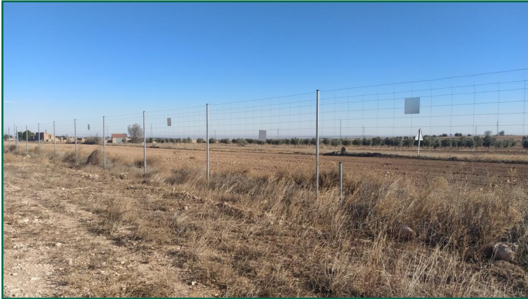
Fotografía 13. Vallado perimetral con placas anticolidión.

Se ha realizado seguimiento de avifauna, anotando los avistamientos durante los recorridos por el entorno de la obra, las especies avistadas este mes han sido principalmente buitres leonados, y cernícalos vulgares en vuelos de prospección.