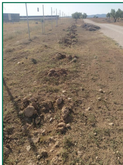
Fotografías 7 y 8 . Plantones.