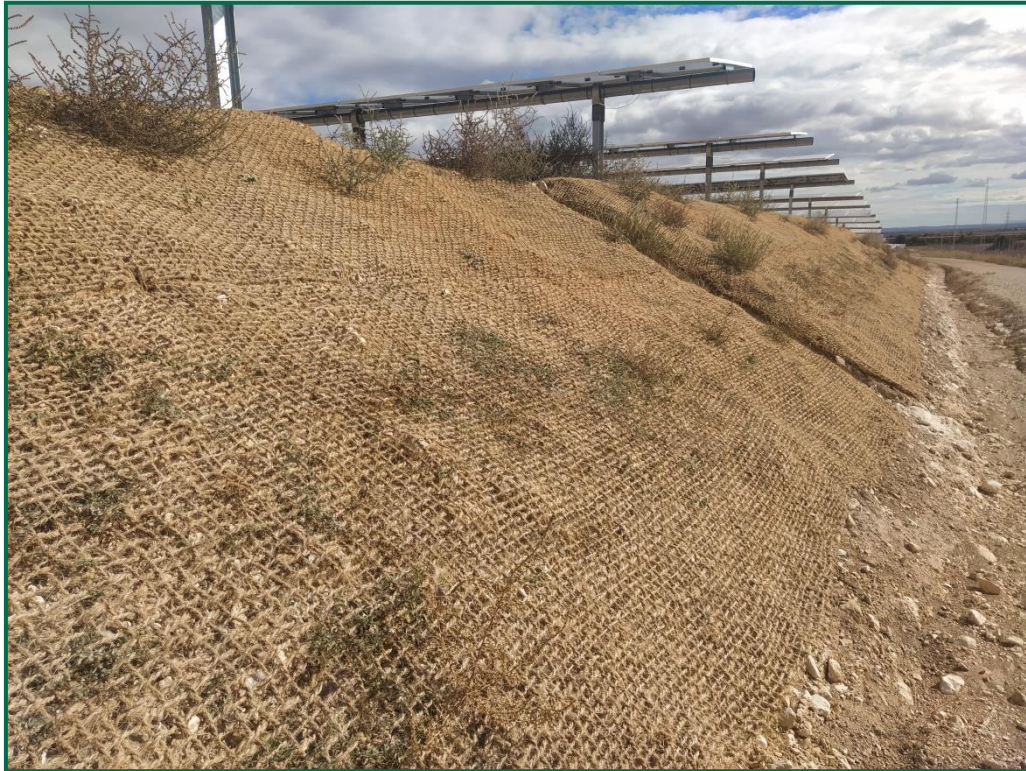
Fotografía 2. Talud con malla de coco.