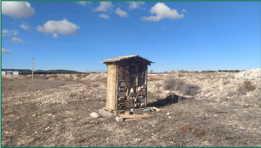
Fotografía 11. Hotel de insectos.