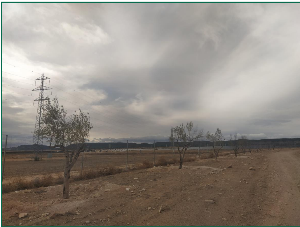
Fotografía 5. Olivos trasplantados.

Ya se han trasplantado olivos extraídos del interior, como se explica en el apartado previo y parte de las plantas previstas en el plan de restauración, en el periodo de otoño-invierno se completará el resto de plantas de la pantalla vegetal prevista.