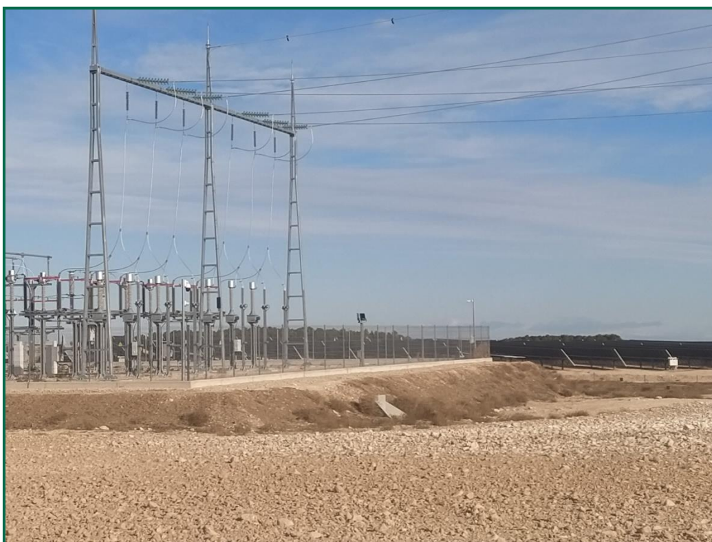
Fotografía 1. Tierra vegetal sobre talud de la SET, ya con algo de vegetación.

Las zonas de acopio compactadas en obra, fueron descompactadas mediante su arado una vez finalizadas las obras.