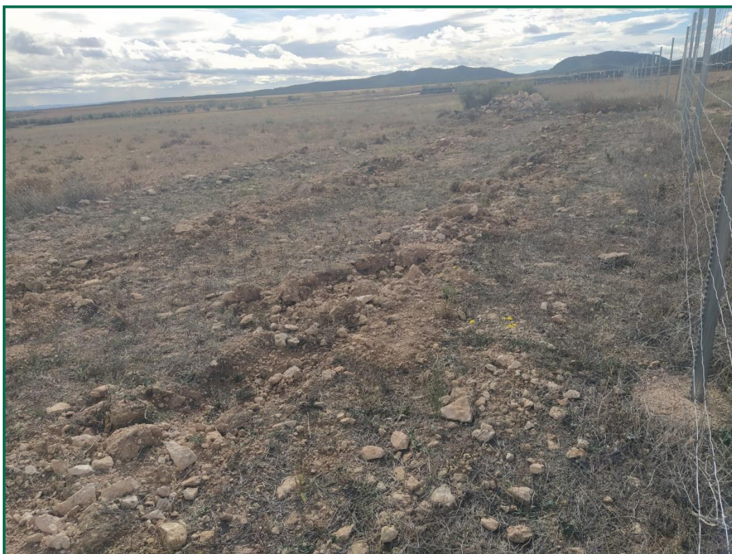
Fotografía 6. Zonas del vallado con plantaciones.