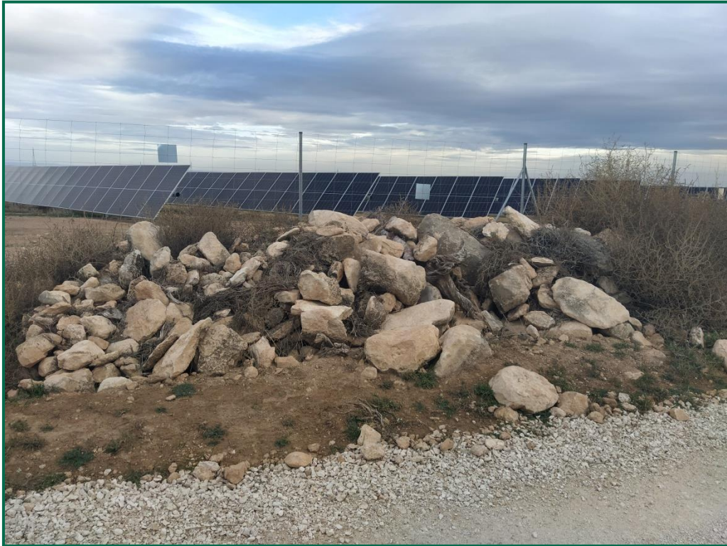
Fotografía 9. Majano para reptiles.