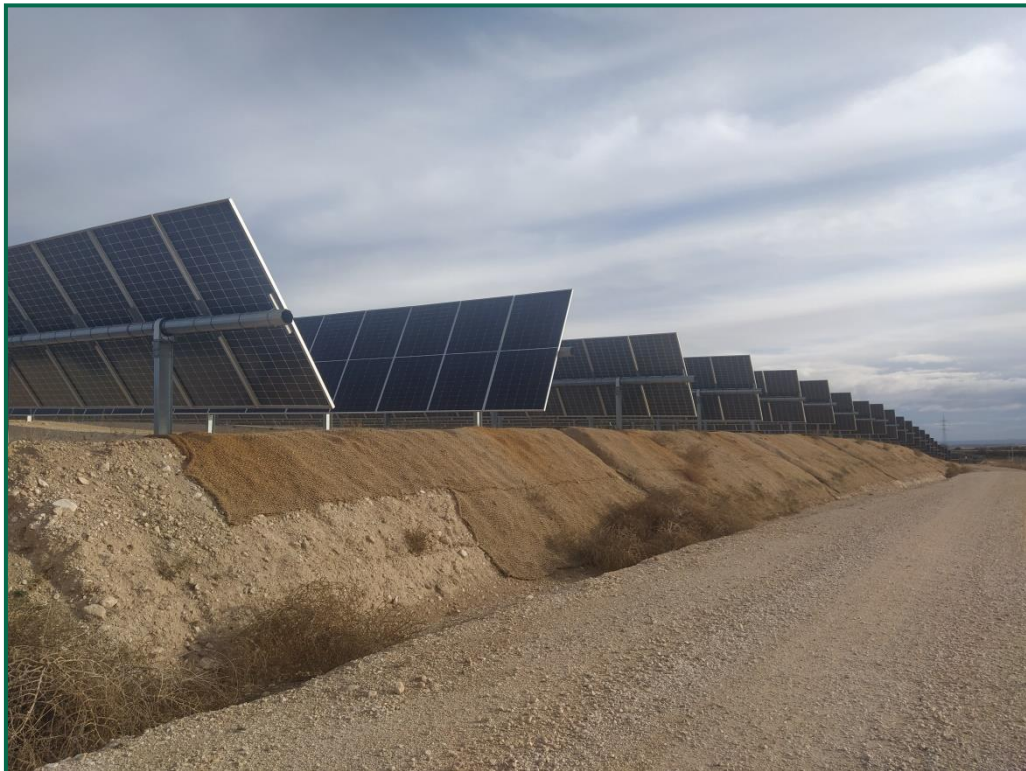
Fotografía 3. Talud con malla de coco.