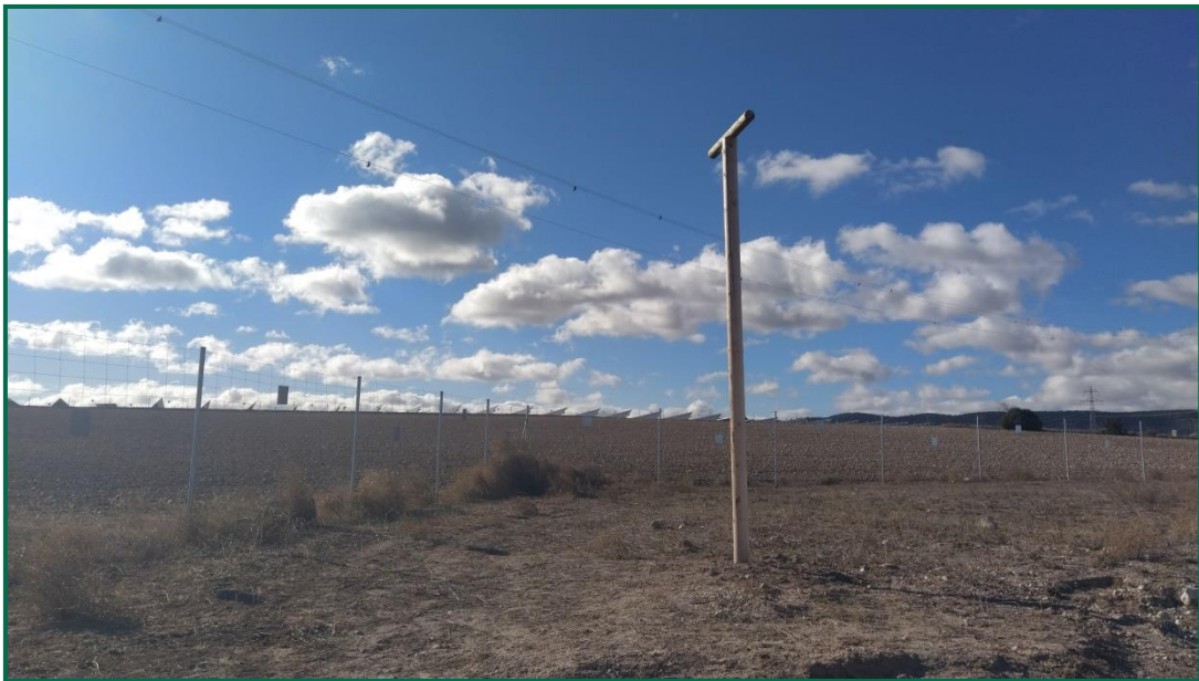
Fotografía 12. Posaderos.