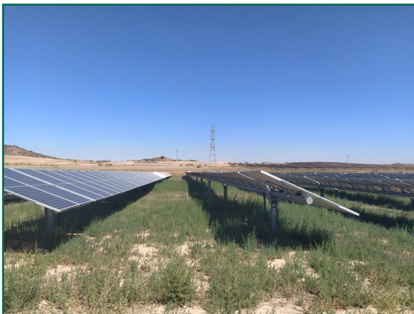
Fotografías 1. Vegetación entre placas actualmente.

Este informe abarca el segundo trimestre en explotación, la vegetación interior está comenzando a brotar después de las obras, no se han realizado podas mecánicas excepto en los 5 metros de perímetro interior, se va a introducir ganado ovino una vez que esta vegetación se desarrolle. No se han utilizado herbicidas.