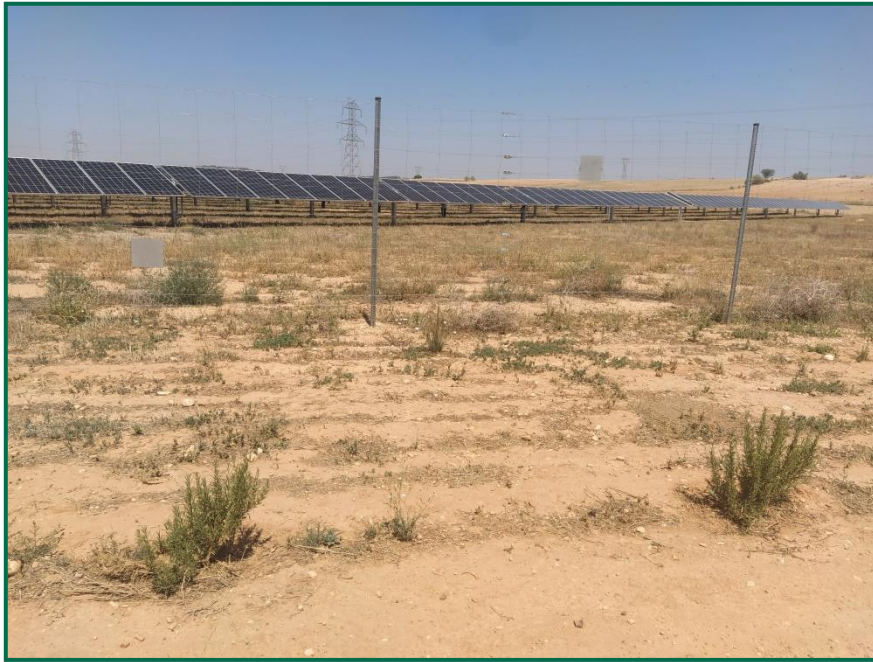
Fotografías 3. Revegetación actualmente