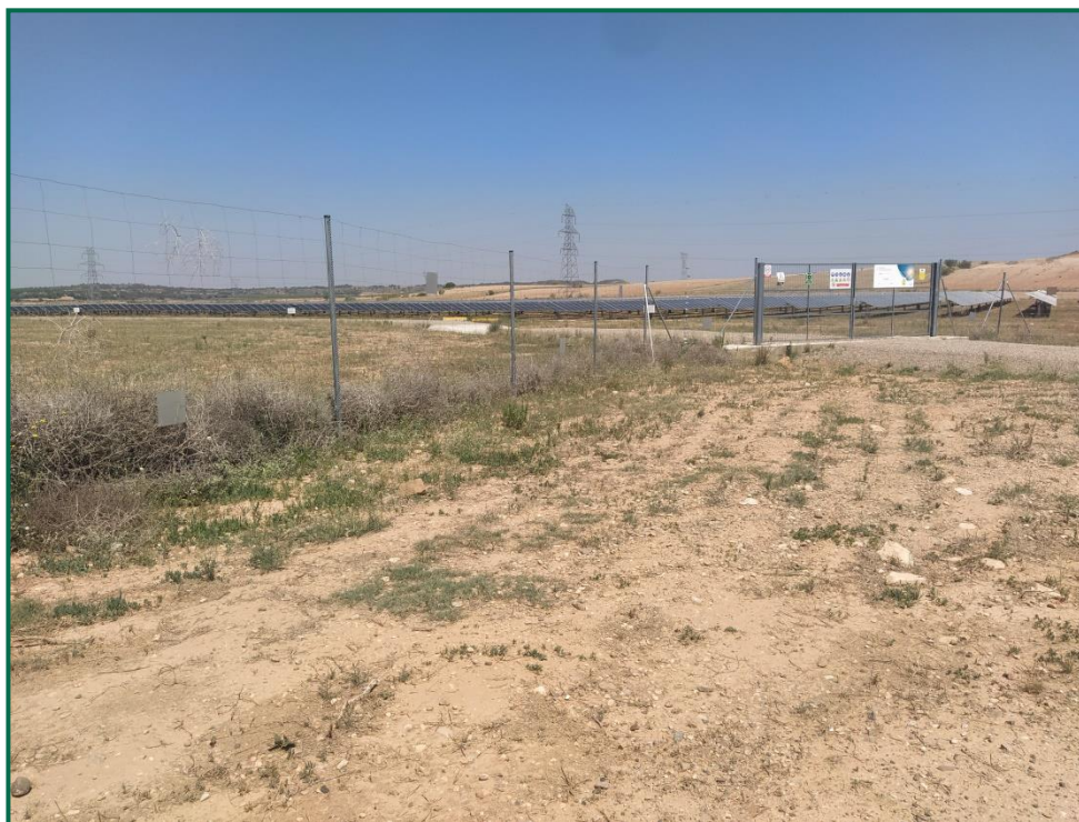
Fotografía 8. Placas anticolidión.

Por otro lado ya se han implantado las medidas definidas en la Declaración de Impacto Ambiental, consistentes en la creación de majanos para reptiles en el perímetro del vallado, y en la colocación de placas anticolidión para aves.