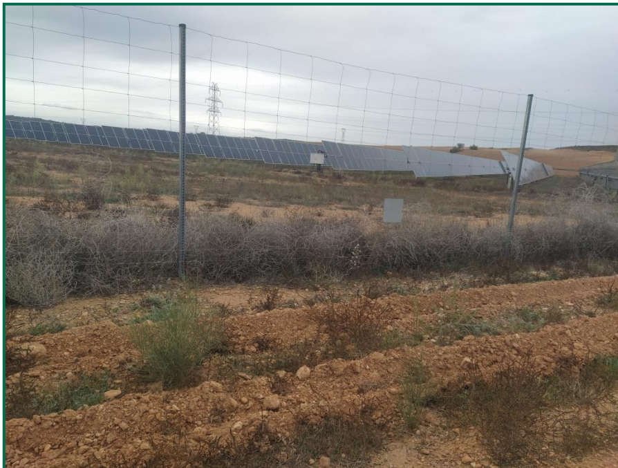
Fotografías 4. Terreno preparado para reposición de marras