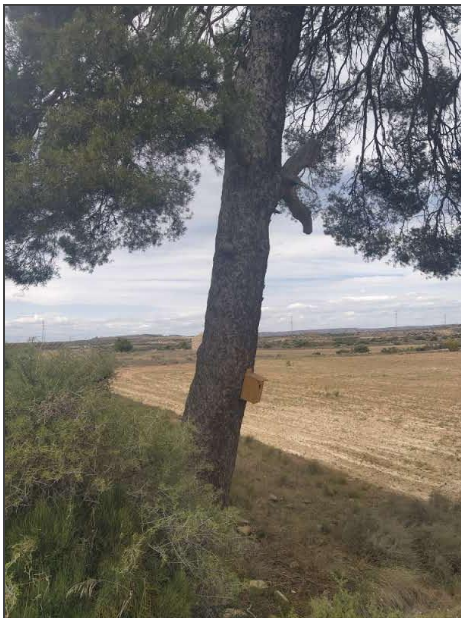
Fotografía 14. Caja para carraca sobre árbol.