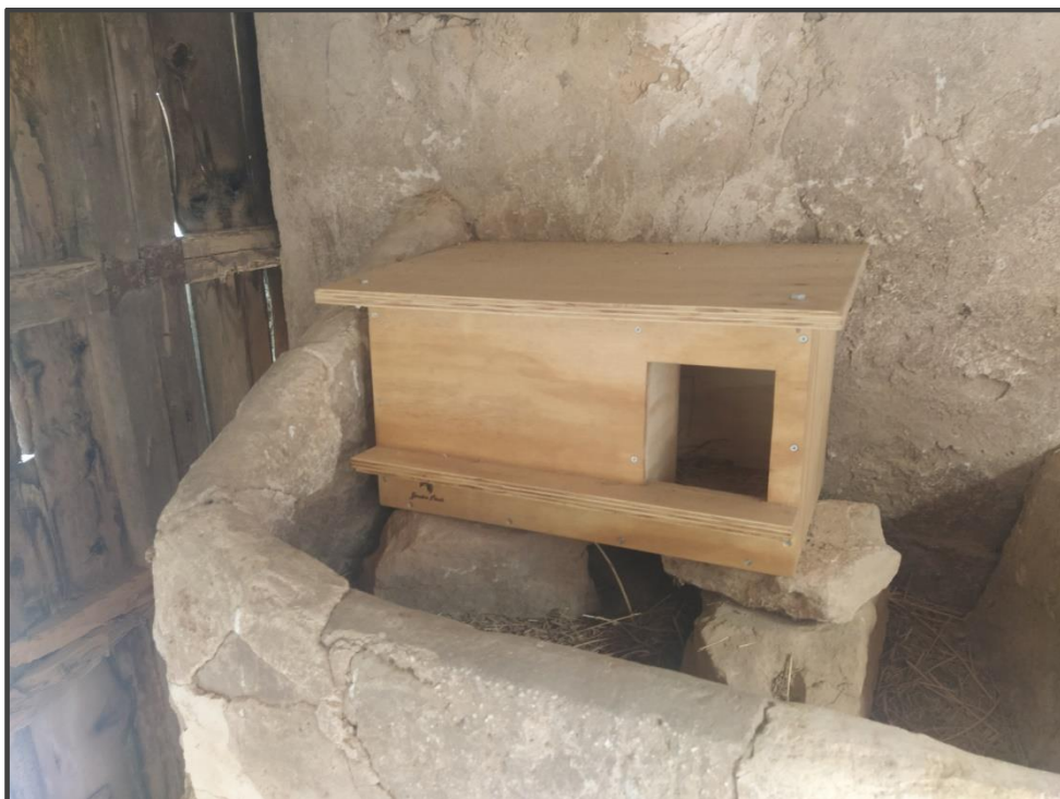
Fotografía 13. Caja para lechuza/rapaz nocturna en el interior de construcción.