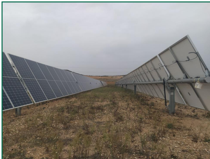
Fotografías 2. Vegetación entre placas actualmente.

Se ha realizado un seguimiento de la evolución de las revegetaciones realizadas durante el primer trimestre de 2022. Las plantaciones realizadas tanto en el vallado perimetral como en zonas interiores en general van desarrollándose, en zonas de paso de ovejas, se puede apreciar una disminución en la densidad de plantas y un crecimiento más limitado de estas, bien por herbivorismo o por el trasiego sobre ellas. Se realizó una limpieza de especies oportunistas de rápido crecimiento que comenzaron a crecer sobre las especies plantadas, ahogándolas y privándolas de luz solar, y también realizó un primer riego en el mes de junio y una reposición de marras de 1000 ejemplares, en septiembre se realizó un nuevo riego de todas las plantas.