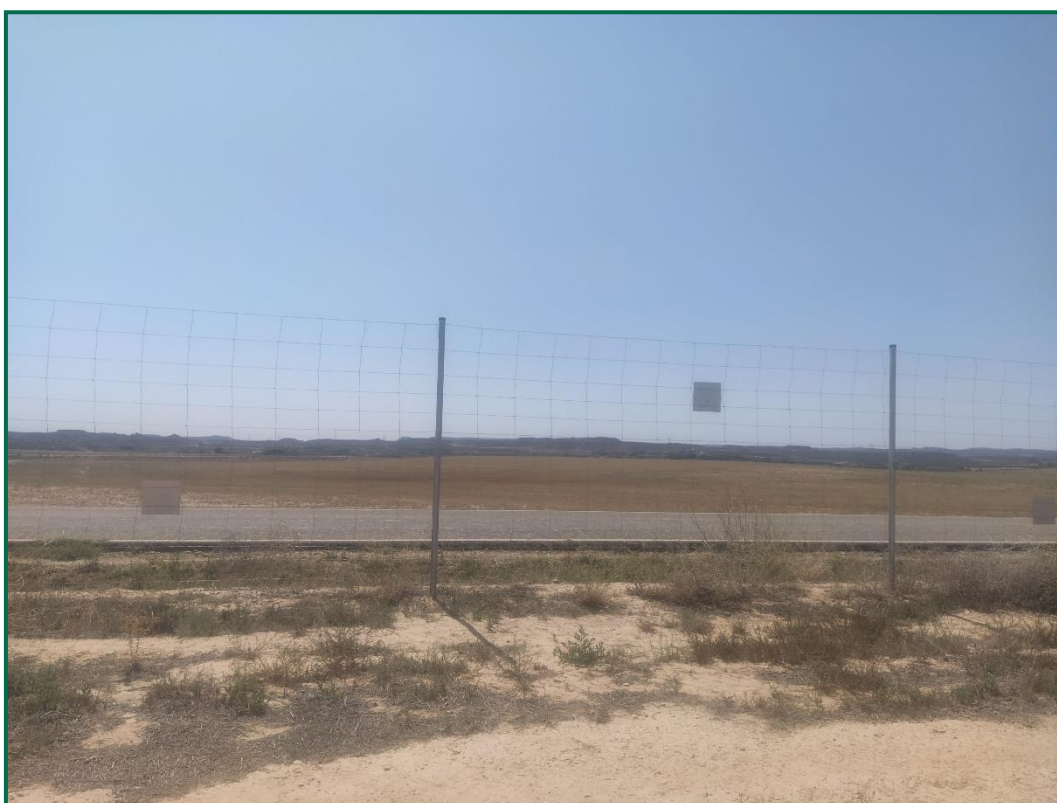
Fotografía 5. Vallado perimetral.

Respecto al vallado perimetral, se ha utilizado malla cinagética que permite el paso de fauna de pequeño tamaño. Este vallado mide 2 metros de altura total y está formado por una serie de alambres verticales y horizontales, con una separación entre los verticales de 30cm, y entre los horizontales de mínimo 15cm en la línea inferior. En la planta fotovoltaica, esta malla está colocada dejando 15 cm libres desde el suelo al primer alambre. Se trata de un vallado con permeabilidad para la fauna y no presenta elementos cortantes ni punzantes, sobre el se han colocado placas anticolidión