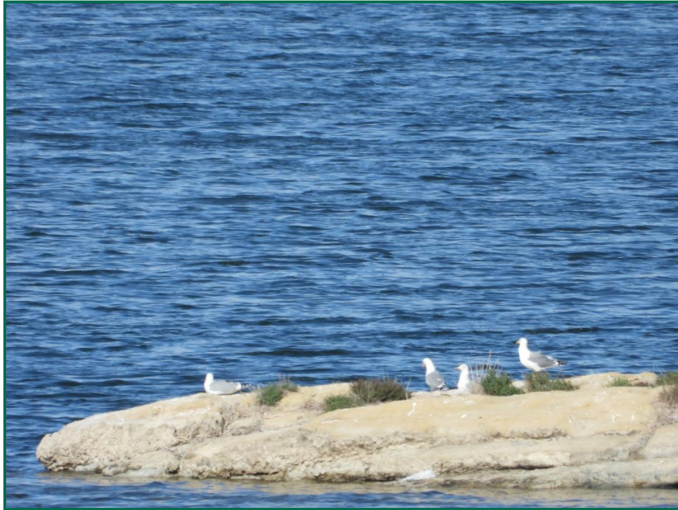
Fotografía 6. Gaviotas patiamarillas en las Saladas.