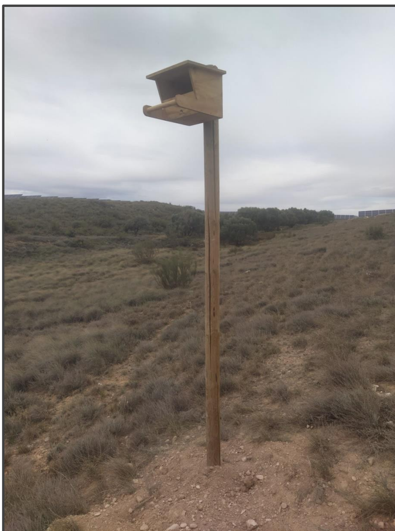
Fotografía 11. Caja para rapaces, sobre poste.

También se ha contado con la colaboración de la Fundación Internacional para la restauración de ecosistemas (FIRE) para la colocación de cajas nido y la renaturalización de diferentes zonas en el interior de las fotovoltaicas, las especies objetivo son lechuza, cernícalo, carraca y quirópteros. En el mes de abril se colocaron estas cajas nido repartidas por los hábitats considerados más adecuados para cada una de ellas, instalando en total de 21 cajas de madera para rapaces, la mayor parte de ellas colocadas en construcciones ya existentes en el interior de las plantas solares, tanto en el exterior como en el interior y 5 de ellas sobre postes de nueva colocación. Estas cajas para rapaces pueden ser utilizadas especialmente por lechuza y por cernícalo vulgar. También se han instalado 9 cajas para quirópteros, adecuadas para albergar colonias y agrupadas en tres zonas con presencia de pinos y 4 cajas para carraca europea, una de ellas sobre árbol y 3 sobre poste.