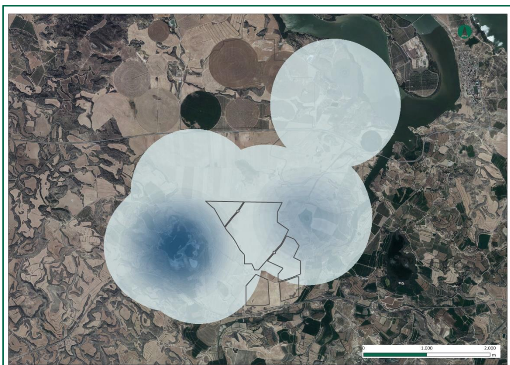
Figura 1. Uso del espacio por aves de mayor envergadura.

Los resultados se pueden ver en las siguientes figuras, en la primera de ellas se observa el uso del espacio de todas aves de gran envergadura, incluyendo aves acuáticas, muy abundantes en la zona debido a la gran cantidad de láminas de agua presentes, y en la segunda se muestran los vuelos detectados por especie. Las rapaces también suelen sobrevolar las láminas de agua, donde tienen mayor disponibilidad de presas potenciales.