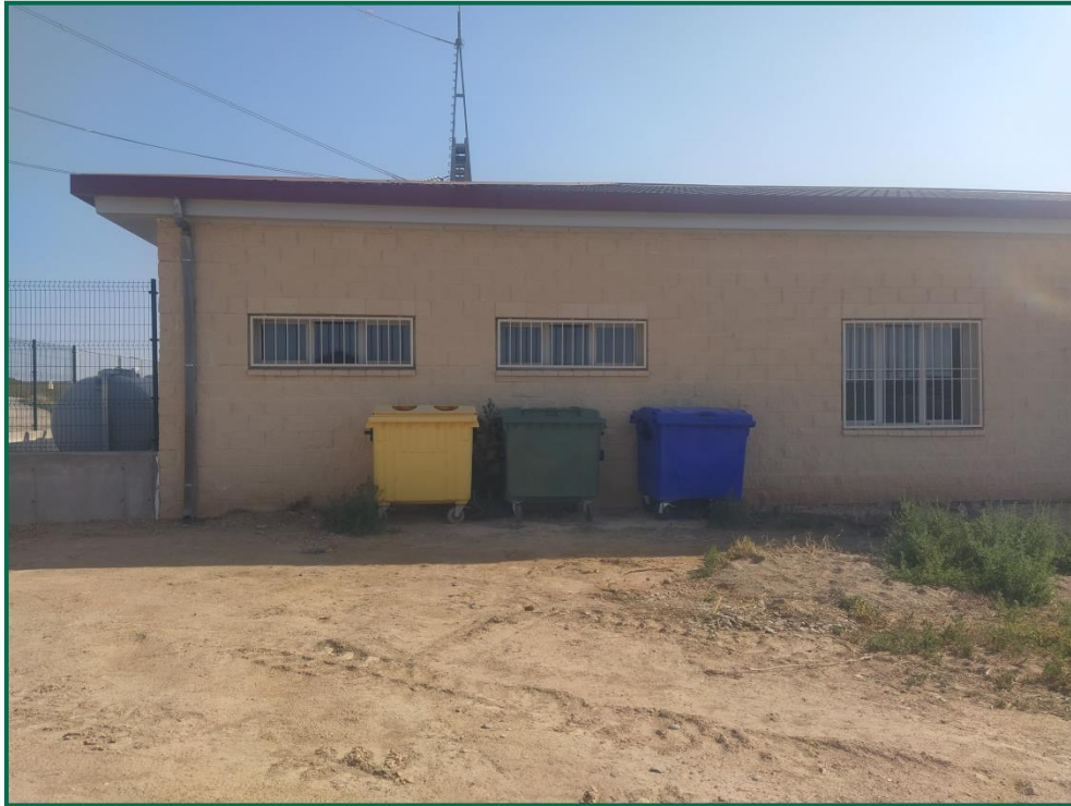
Fotografía 18. Contenedores de residuos no peligrosos en exterior de la subestación.