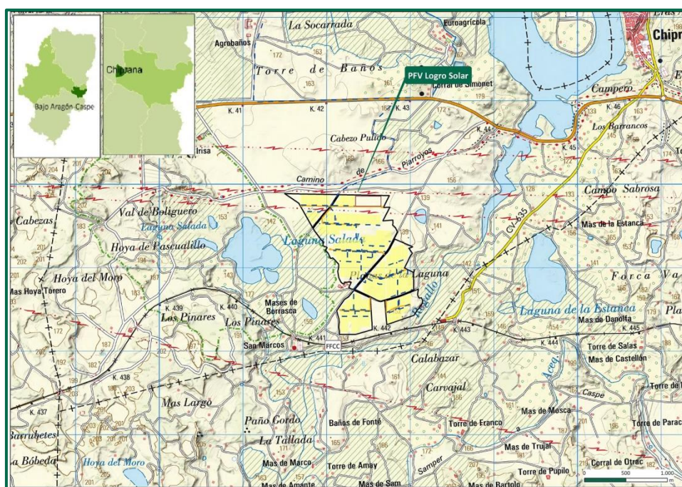
Figura 1. Localización de la PFV.

La totalidad de la planta fotovoltaica está incluida en la hoja escala 1: 50.000 nº 442 "Caspe", del Mapa Topográfico del Instituto Geográfico Nacional, en la cuadrícula UTM 10 x 10, 30TYL36. El acceso a la planta se realiza desde la carretera autonómica A-221, que comunica Escatrón con Caspe, a la altura del P.K. 40+308, utilizando para ello el camino rural denominado "Camino de San Marcos".