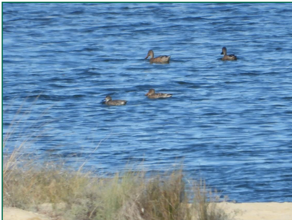
Fotografía 7. Cuchara común en las Saladas.