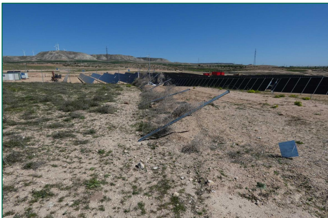
Fotografía 1. Vallado perimetral tumbado por el viento.

El vallado se ha visto afectado en algunas zonas por los episodios de fuertes vientos que se han producido en la zona. Estos vientos han arrastrado plantas rodadoras del entorno, que al encontrar el vallado como obstáculo se han acumulado provocando la rotura de este. Se están reparando las zonas afectadas utilizando postes reforzados de mayor grosor.