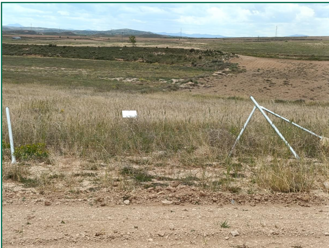
Fotografía 7. Cobertura vegetal colindante a la planta.