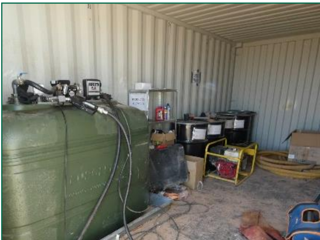
Fotografía 12. Bidón de combustible y punto limpio.