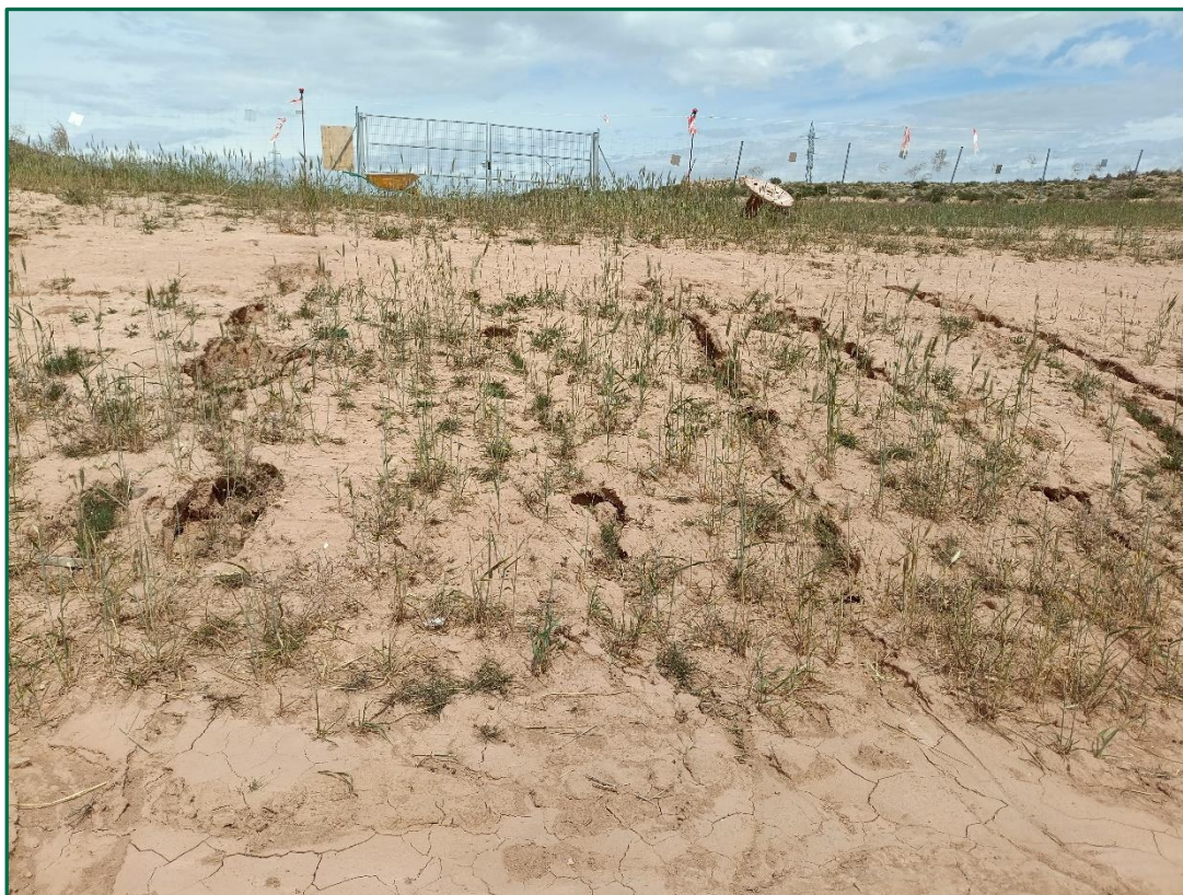
Fotografía 6. Episodios de erosión.