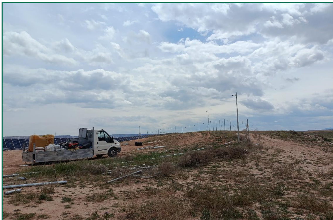
Fotografía 2. Vallado perimentral en proceso de reparación.