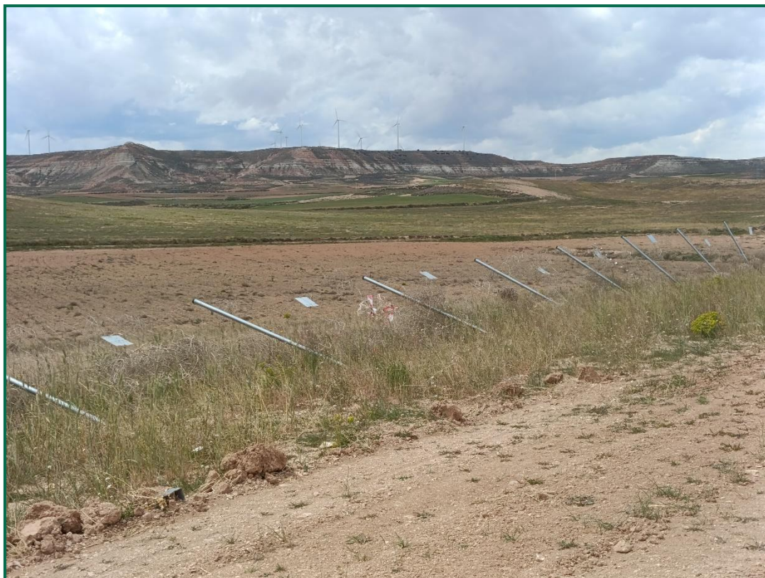
Fotografía 10. Vallado perimetral doblado.

Se ha realizado seguimiento de avifauna, anotando los avistamientos durante por recorridos por el entorno de la obra, hasta el momento se han observado pocos vuelos, las aves avistadas en este mes han sido palomas torcaces ( Columba palumbus ), y busardo ratonero ( Buteo buteo ).