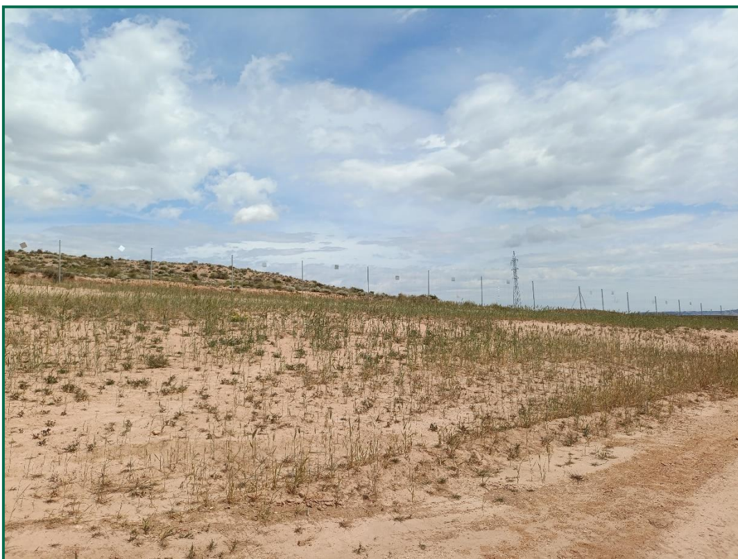
Fotografía 8. Cobertura vegetal en zonas interiores.