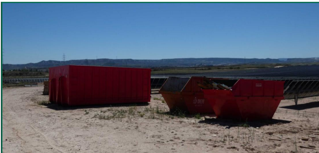
Fotografía 11. Contenedores para inertes.