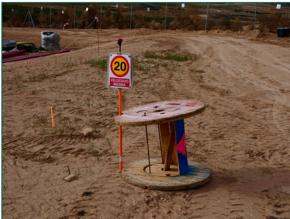
Fotografía 3. Señal de limitación de velocidad.