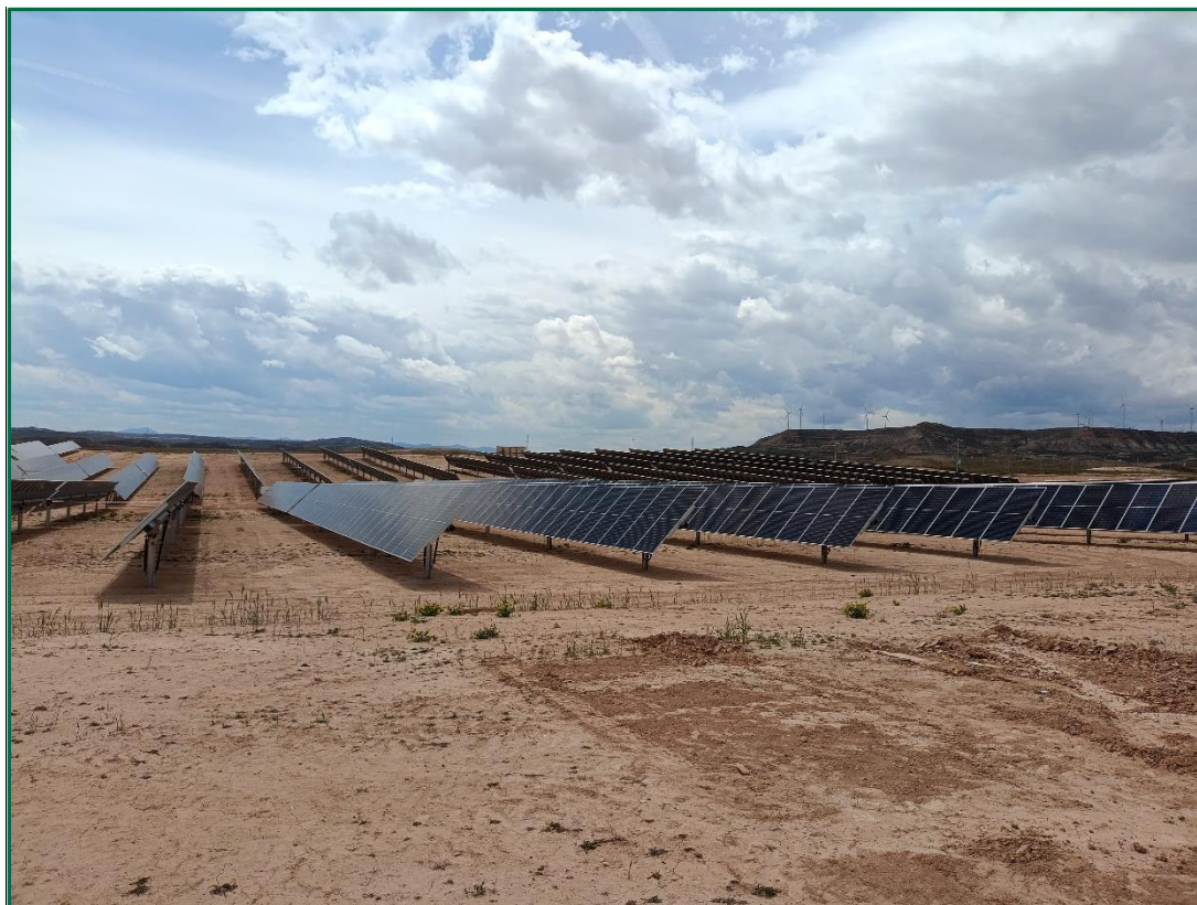
Fotografía 4. Placas ya colocadas