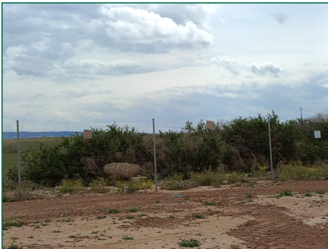
Fotografía 9. Placas anticolidión.

El vallado perimetral ya se ha instalado, utilizando malla cinegética y dejando un espacio de al menos 20 cm desde el suelo, también se han colocado las placas anticolidión, dispuestas una por vano entre postes a diferentes alturas.