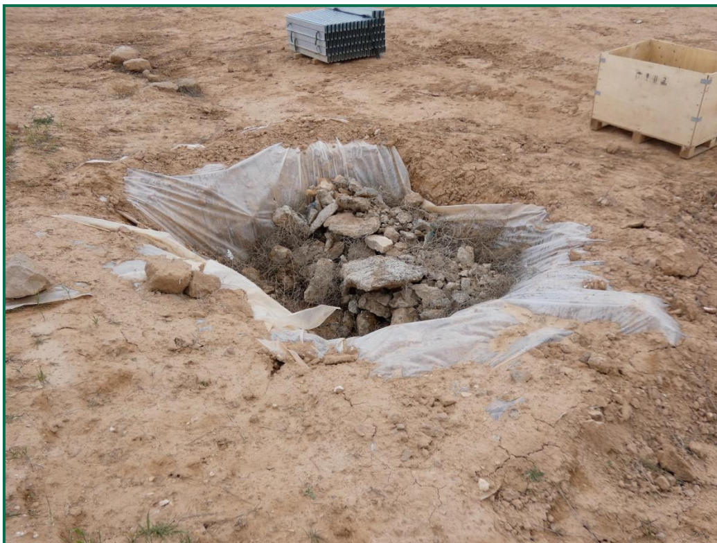
Fotografía 13. Zona de lavado de hormigón.