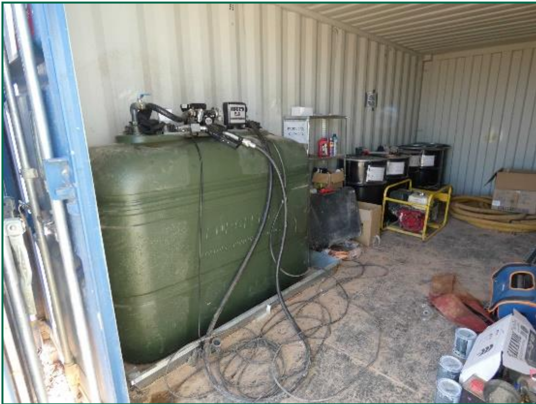
Fotografía 10. Bidón de combustible y punto limpio.