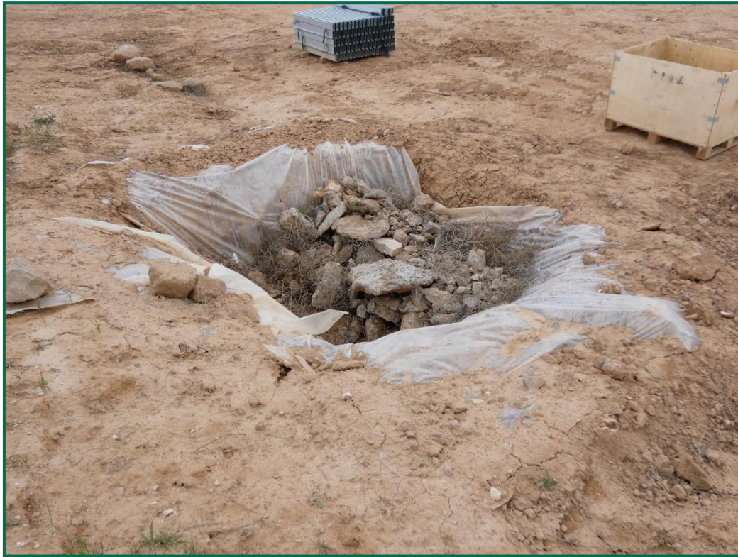
Fotografía 11. Zona de lavado de hormigón.