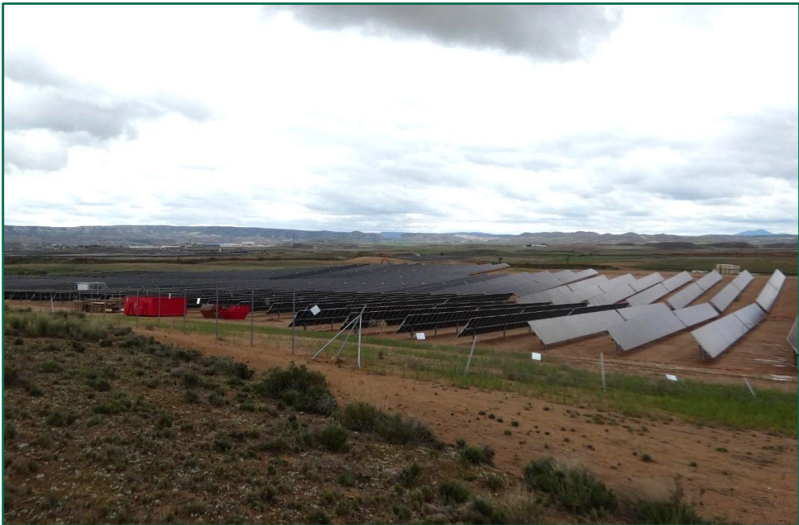
Fotografía 1. Vallado perimetral tumbado por el viento.

No se realiza el balizamiento de todo el perímetro de la obra ya que se generaría una gran cantidad de residuos de malla de obra o cinta que tiende a romperse y dispersarse por toda la zona. Durante la primera semana de obras se instaló el vallado perimetral de forma que los límites quedaron definidos. La Dirección Ambiental realiza un control visual continuado para comprobar que no se sobrepasan los límites de la zona de ocupación.