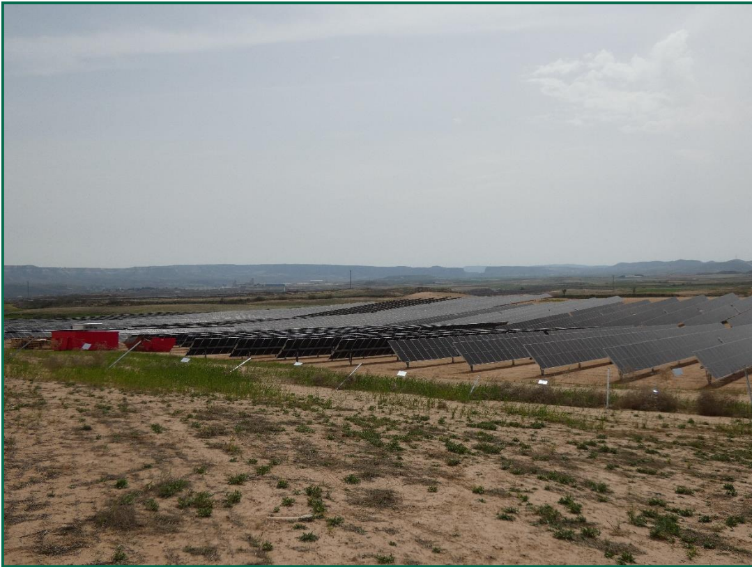
Fotografía 8. Vallado perimetral doblado.

Se ha realizado seguimiento de avifauna, anotando los avistamientos durante por recorridos por el entorno de la obra, hasta el momento se han observado pocos vuelos, las aves avistadas han sido palomas torcaces ( Columba palumbus ), busardo ratonero ( Buteo buteo ), águila real ( Aquila chrysaetos ) y chova piquirroja ( Pyrhocorax pyrrhocorax ) sobre los campos próximos.