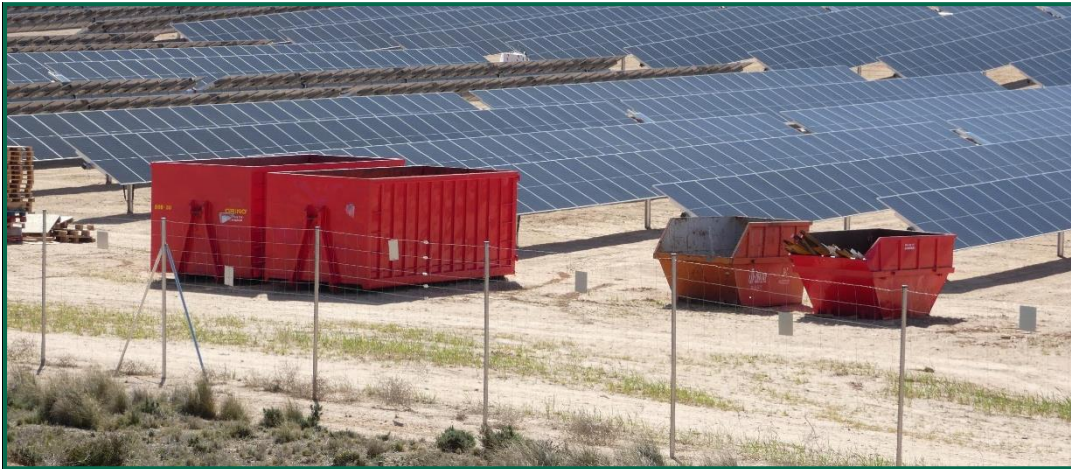
Fotografía 9. Contenedores para inertes.