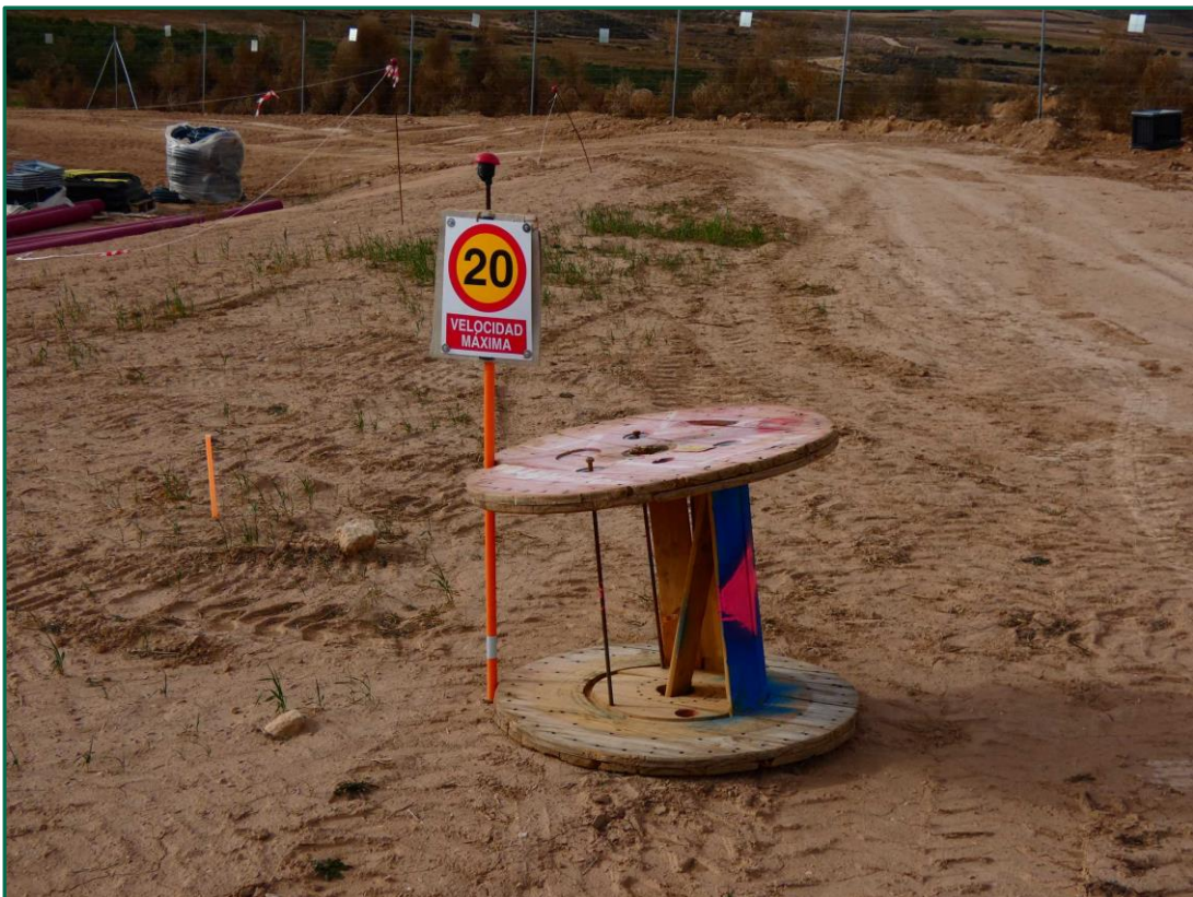
Fotografía 2. Señal de limitación de velocidad.

Se restringe la velocidad a 20 km/h en toda la zona de trabajos.