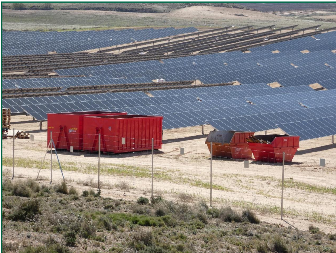
Fotografía 7. Placas anticolidión.

El vallado perimetral ya se ha instalado, utilizando malla cinégetica y dejando un espacio de al menos 20 cm desde el suelo, también se han colocado las placas anticolidión, dispuestas una por vano entre postes a diferentes alturas.