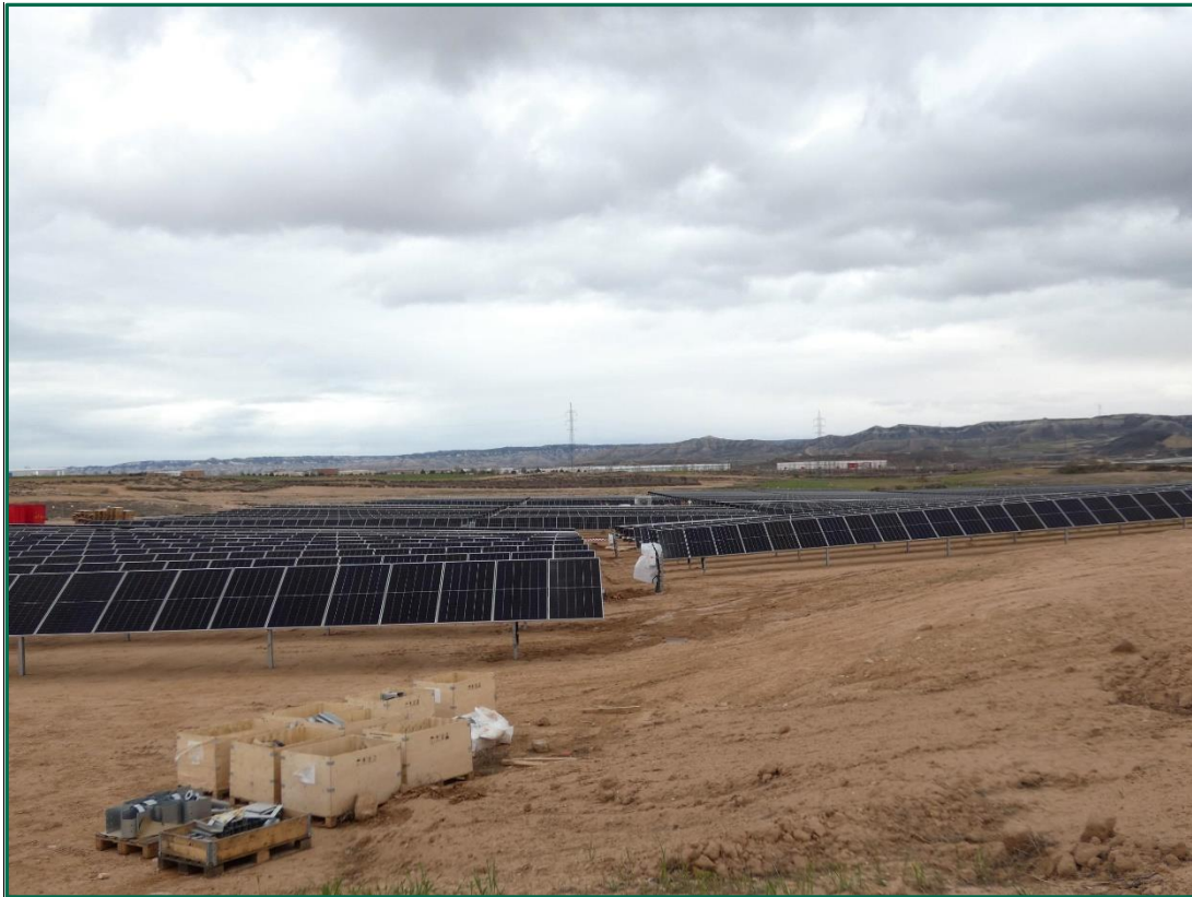
Fotografía 3. Placas ya colocadas

plantaciones para crear una patalla vegetal no se ha realizado ningún movimiento de tierra, conservando la capa de tierra vegetal presente. La tierra extraída de las zanjas se ha vuelto a utilizar para rellenarlas una vez pasado el cable.