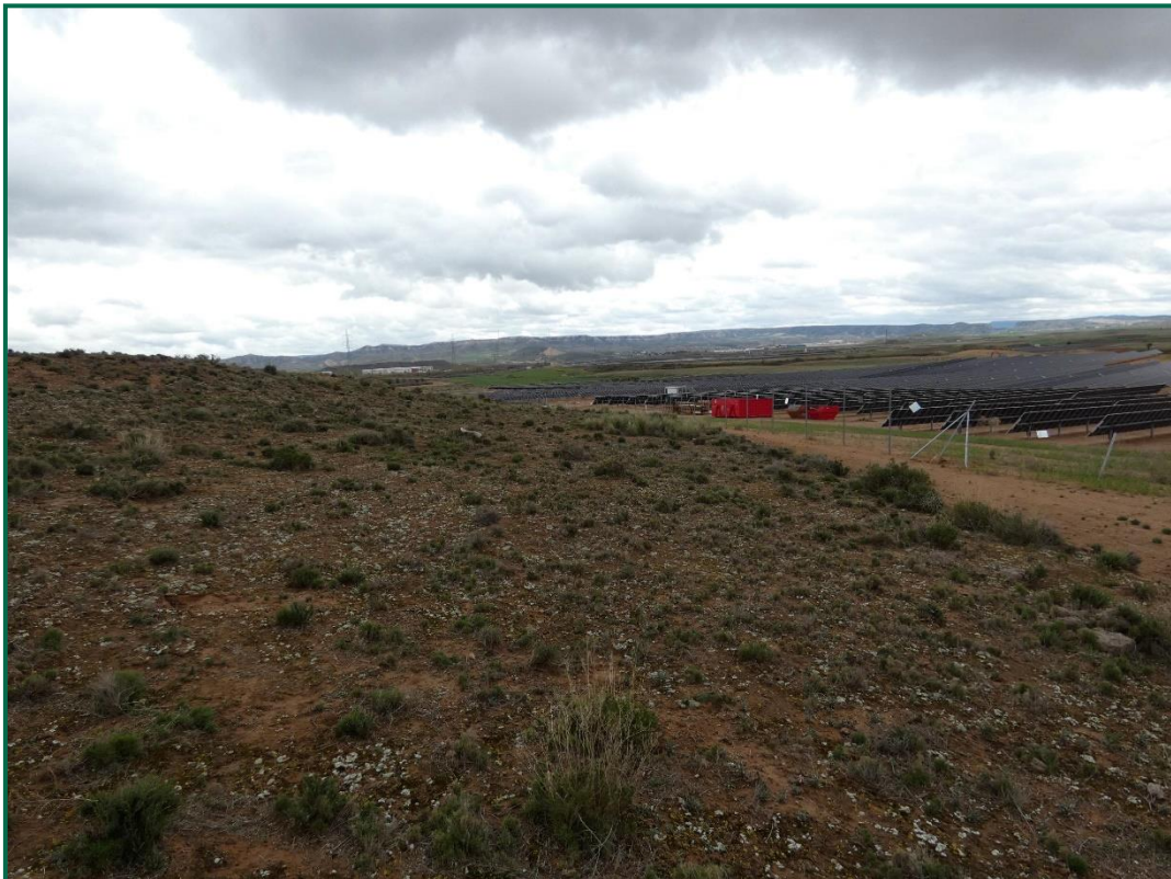
Fotografía 6. Cobertura vegetal colindante a la planta.

Durante las visitas a obra se realiza el seguimiento que la ocupación se limita a lo aprobado en el proyecto. Se verifica también que la maquinaria circula únicamente por los viales habilitados para tal fin.