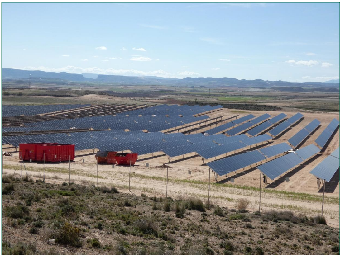
Fotografía 5. Superficie de la planta.