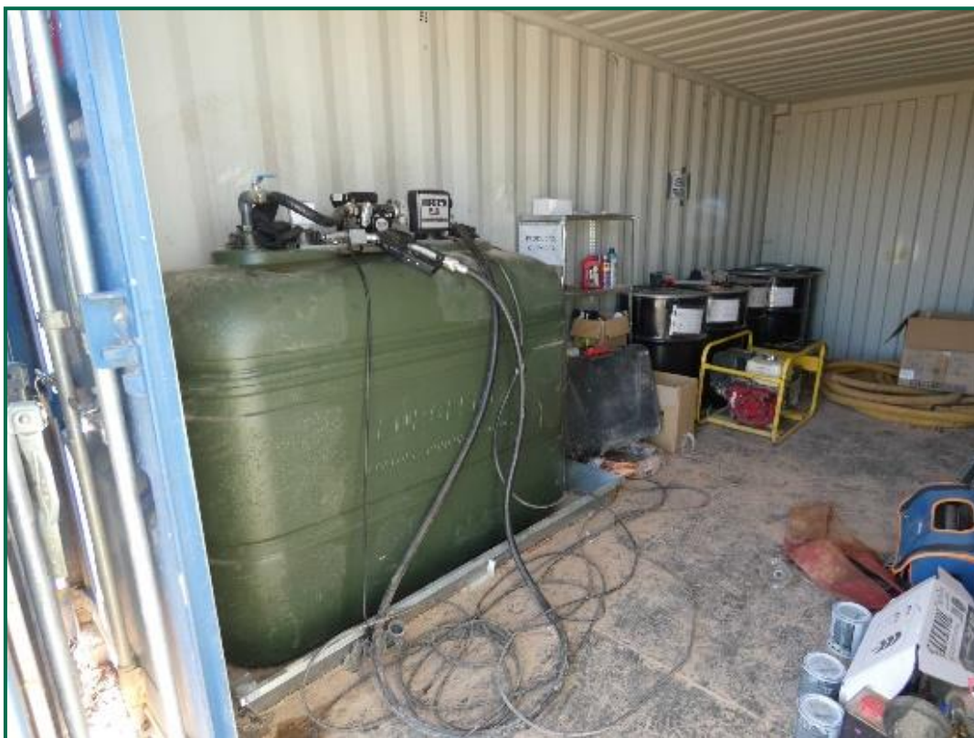
Fotografía 13. Embase de combustible y punto limpio.