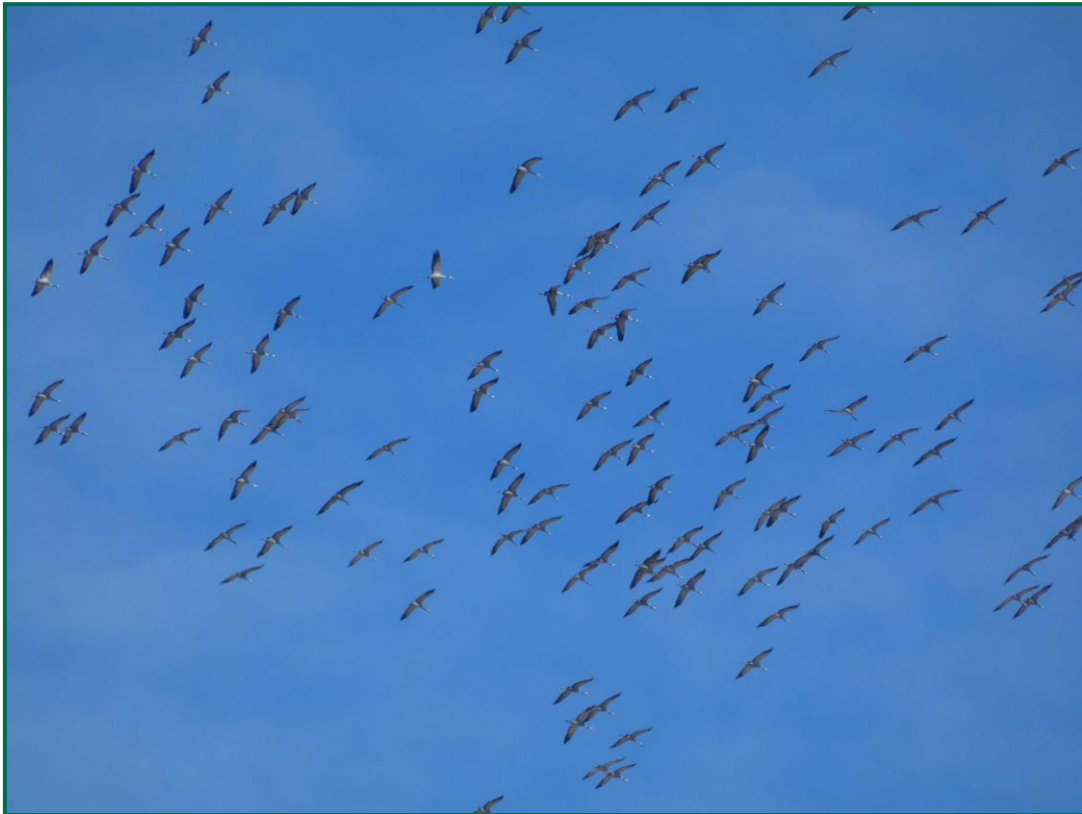
Fotografía 11. Grulla común ( Grus grus ).