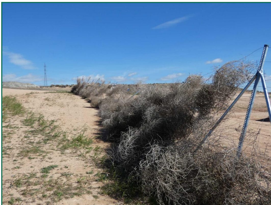
Fotografía 8. Franja vegetal y plantas rodadoras sobre el vallado.