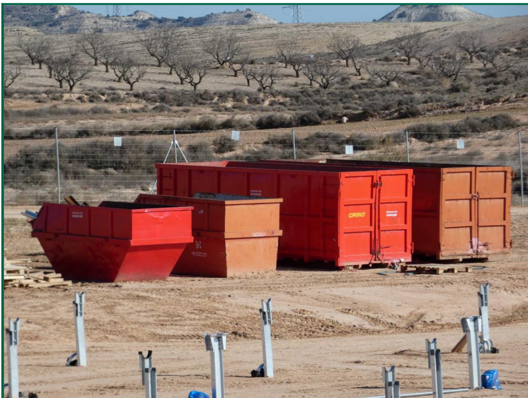
Fotografía 12. Contenedores para inertes.