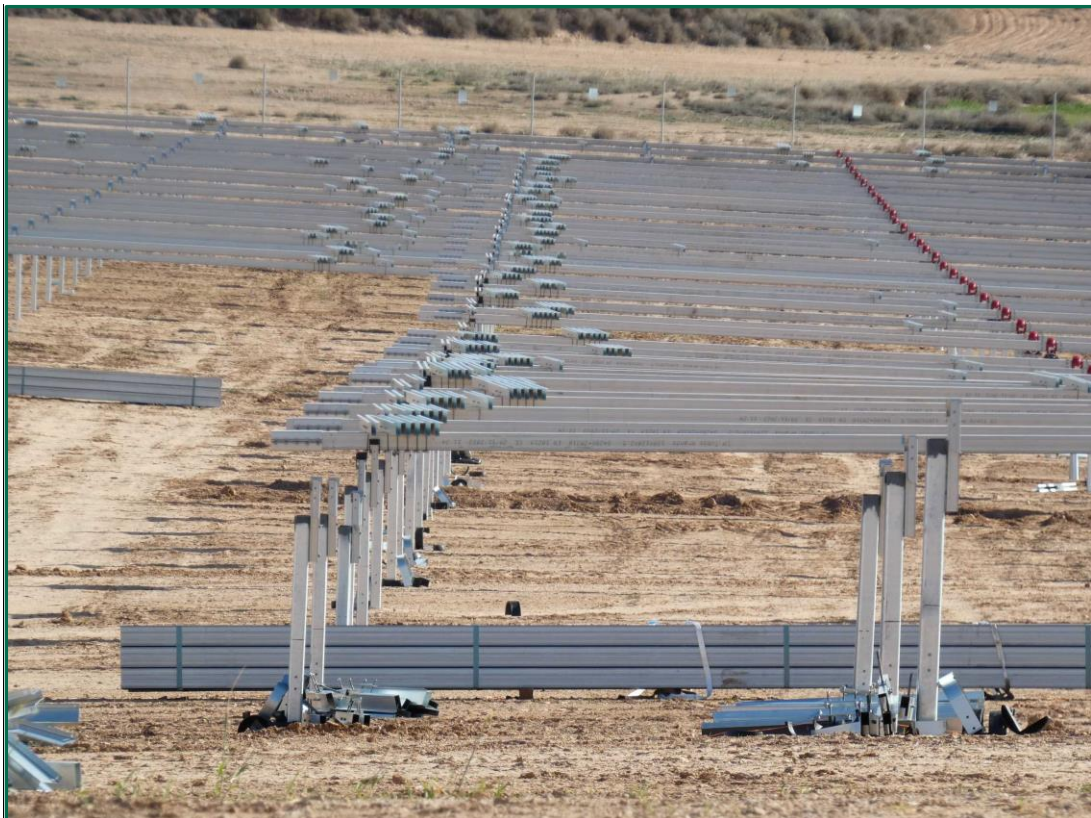
Fotografía 3. Colocación de postes horizontales.

Por el momento la tierra vegetal extraída ha sido escasa debido a que no ha sido necesario nivelar todo el terreno, únicamente algunas zonas y con un espesor limitado, y esta se ha ido extendiendo sobre el terreno y en el talud creado en la zona norte. En las zonas donde se van a realizar plantaciones para crear una patalla vegetal no se ha realizado ningún movimiento de tierra, conservando la capa de tierra vegetal presente. La tierra extraída de las zanjas se volverá a utilizar para rellenarlas una vez pasado el cable.