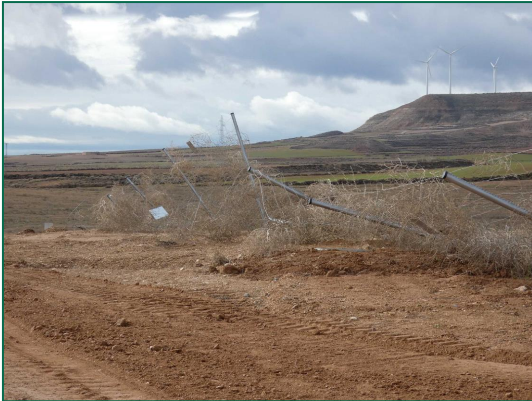
Fotografía 10. Vallado perimetral doblado.

Se ha realizado seguimiento de avifauna, anotando los avistamientos durante por recorridos por el entorno de la obra, hasta el momento se han observado pocos vuelos, las aves avistadas han sido palomas torcaces ( Columba palumbus ), busardo ratonero ( Buteo buteo ), milano real ( Milvus milvus ) y chova piquirroja ( Pyrrhocorax pyrrhocorax ) sobre los campos próximos, además se han observado grandes bandos de grulla común ( Grus grus ) en migración.