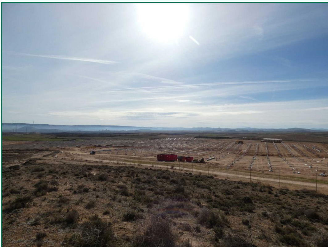
Fotografía 7. Cobertura vegetal colindante a la planta.