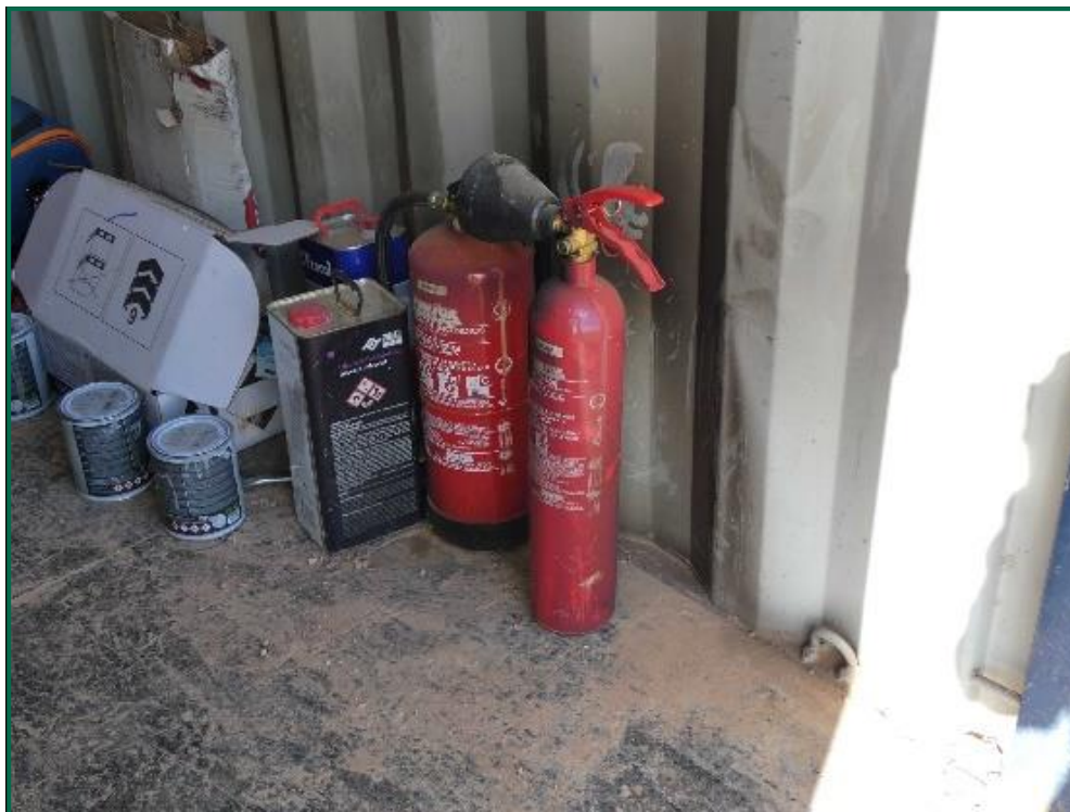
Fotografía 14. Material de extinción.