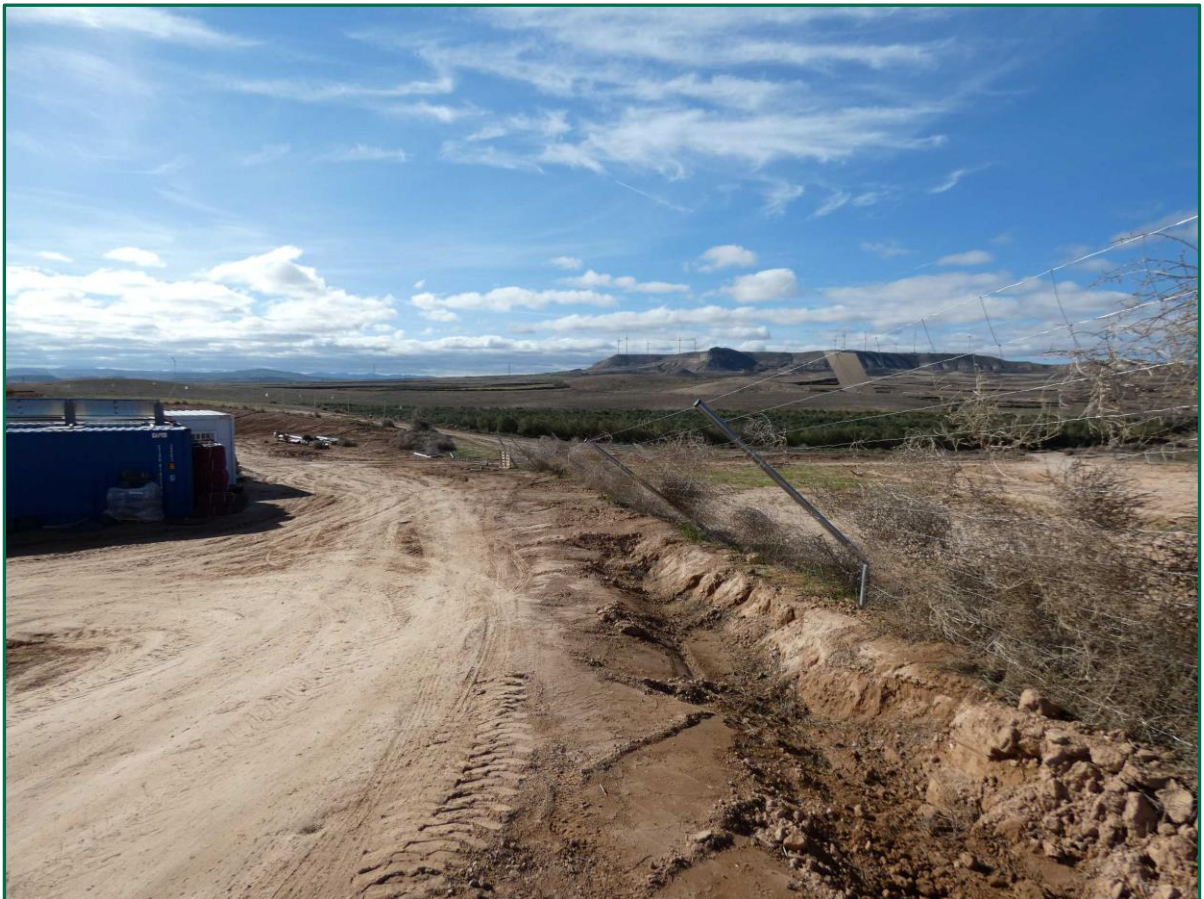
Fotografía 1. Vallado perimetral tumbado por el viento.

No se realiza el balizamiento de todo el perímetro de la obra ya que se generaría una gran cantidad de residuos de malla de obra o cinta que tiende a romperse y dispersarse por toda la zona. Durante la primera semana de obras se instaló el vallado perimetral de forma que los límites quedaron definidos. La Dirección Ambiental realiza un control visual continuado para comprobar que no se sobrepasan los límites de la zona de ocupación.