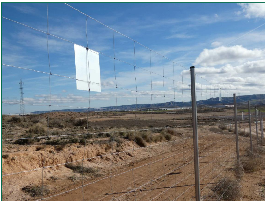
Fotografía 9. Placas anticolidión.

El vallado perimetral ya se ha instalado, utilizando malla cinagética y dejando un espacio de al menos 20 cm desde el suelo, también se han colocado las placas anticolidión, dispuestas una por vano entre postes a diferentes alturas.