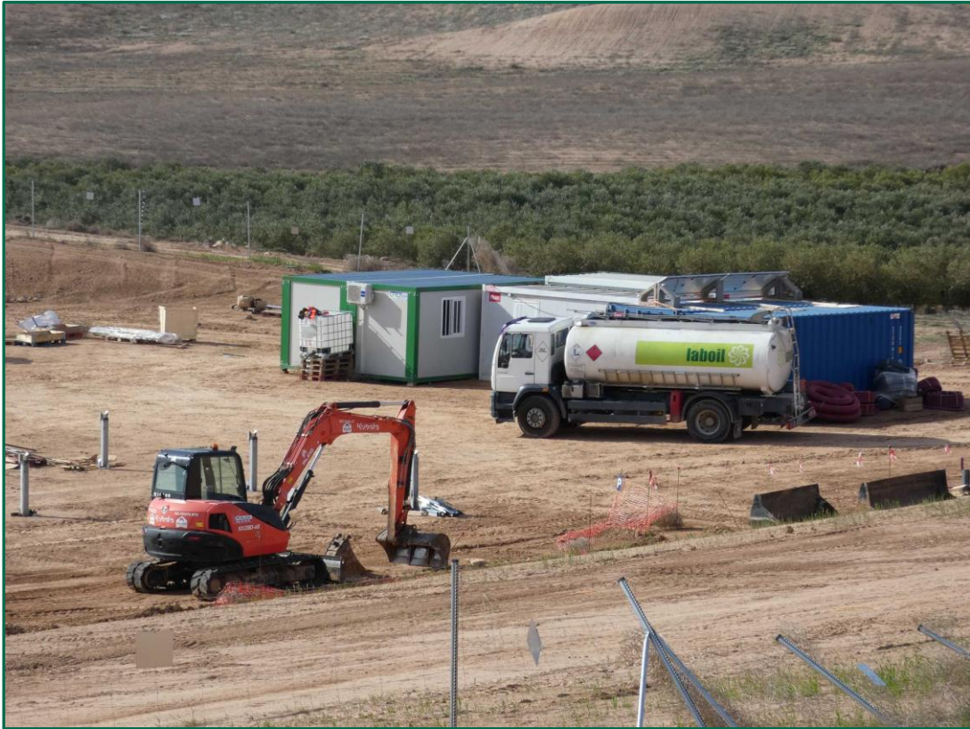
Fotografía 4. Maquinaria de construcción.