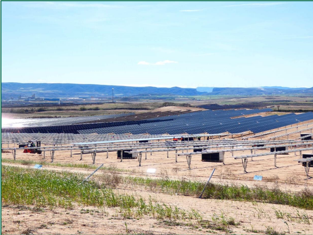
Fotografía 6. Superficie de la planta.