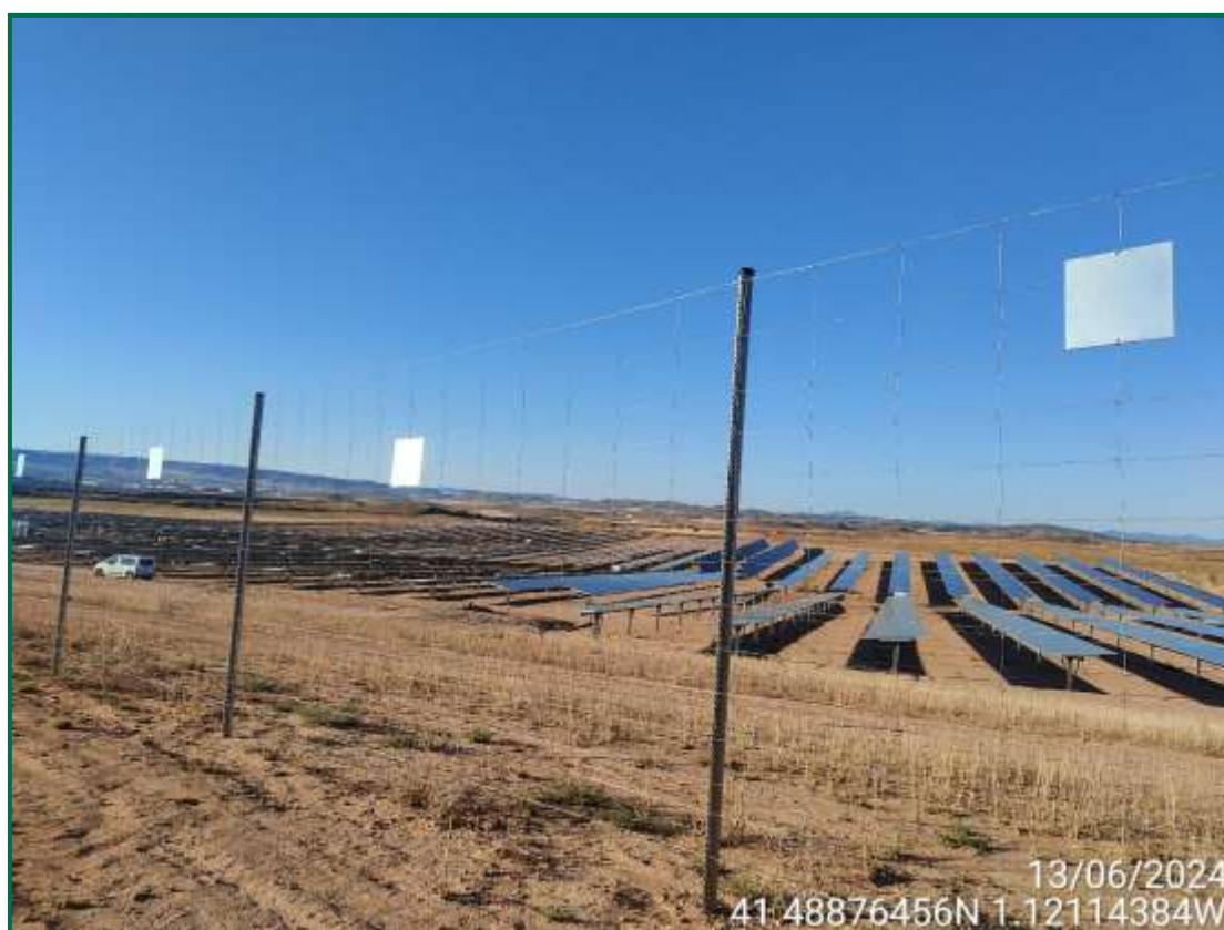
Fotografía 9. Placas anticolidión.

El vallado perimetral ya se ha instalado, utilizando malla cinegética y dejando un espacio de al menos 20 cm desde el suelo, también se han colocado las placas anticolidión, dispuestas una por vano entre postes a diferentes alturas.