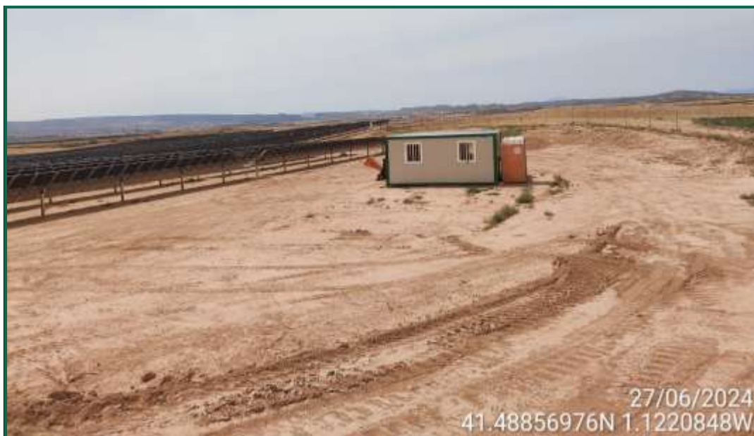
Fotografía 10. Última caseta de obra y baño químico. Contenedores ya retirados.

Los contenedores de residuos y el punto limpio ya han sido desmantelados y retirados por gestor autorizado.