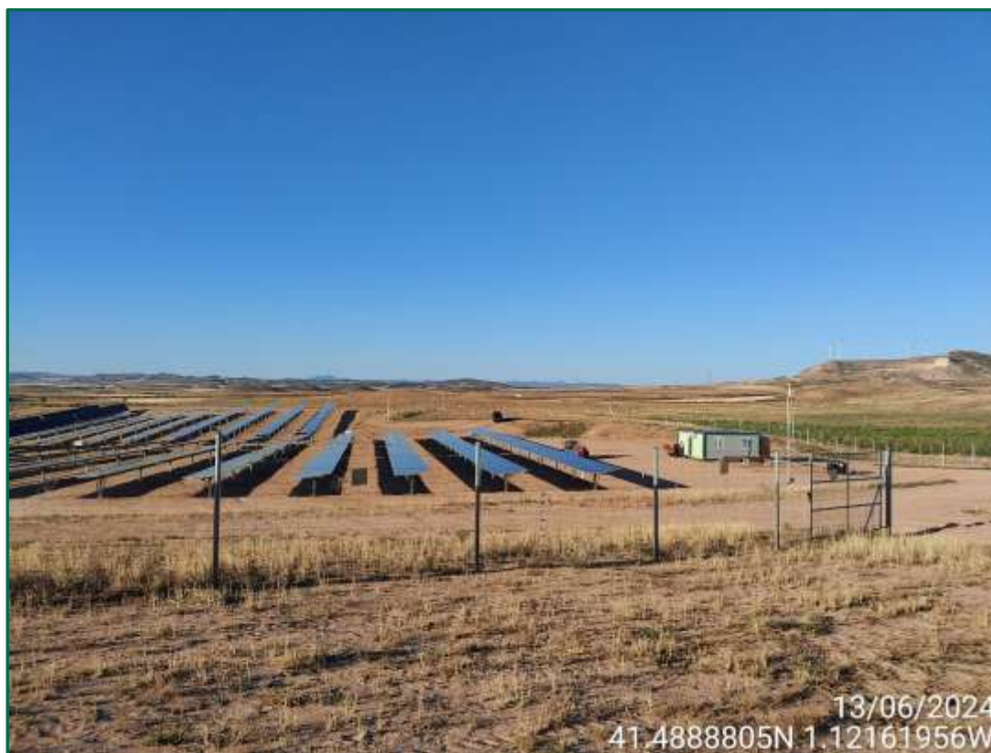
Fotografía 5. Placas ya colocadas