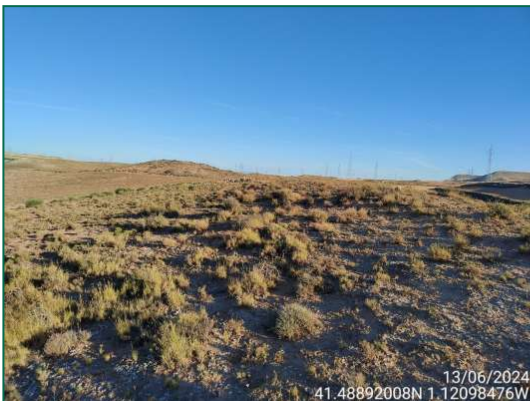
Fotografía 8. Cobertura vegetal colindante a la planta.

Durante las visitas a obra se realiza el seguimiento que la ocupación se limita a lo aprobado en el proyecto. Se verifica también que la maquinaria circula únicamente por los viales habilitados para tal fin.