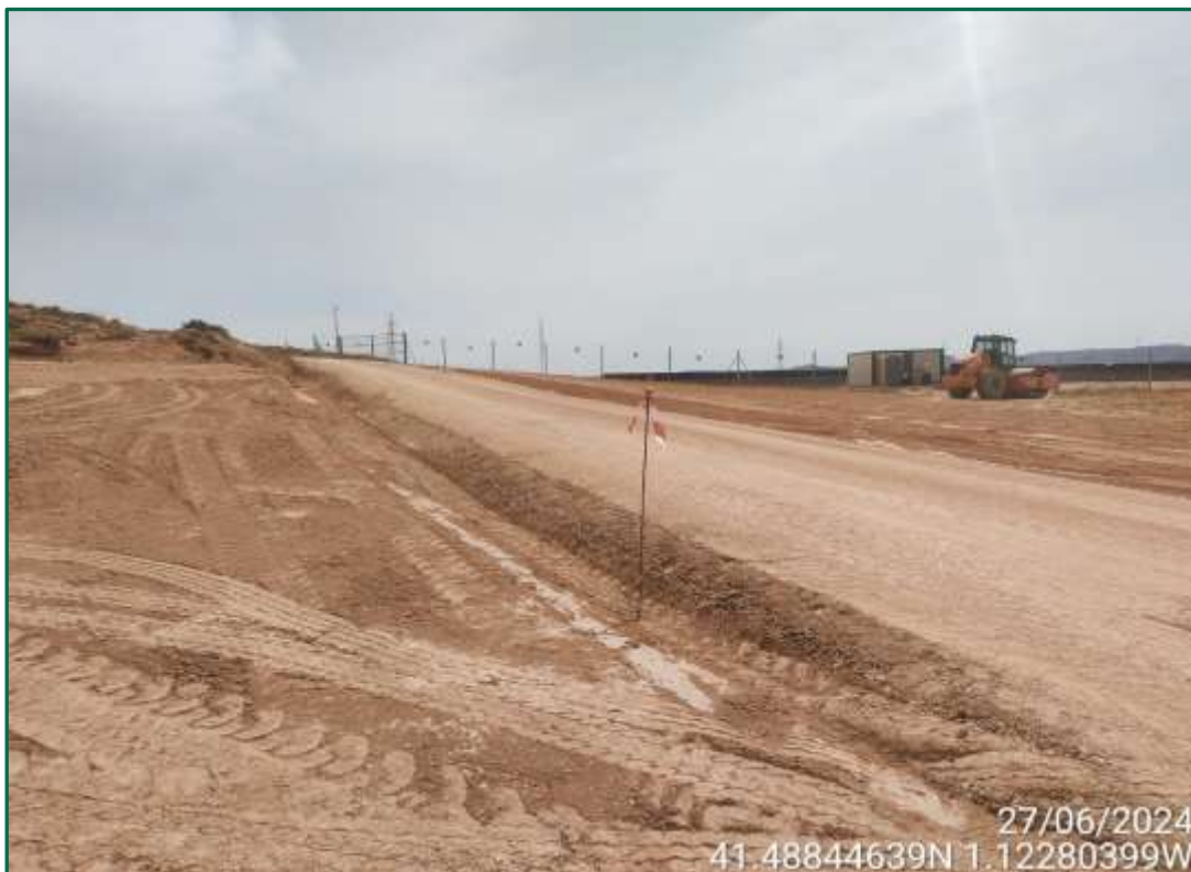
Fotografía 6. Vial