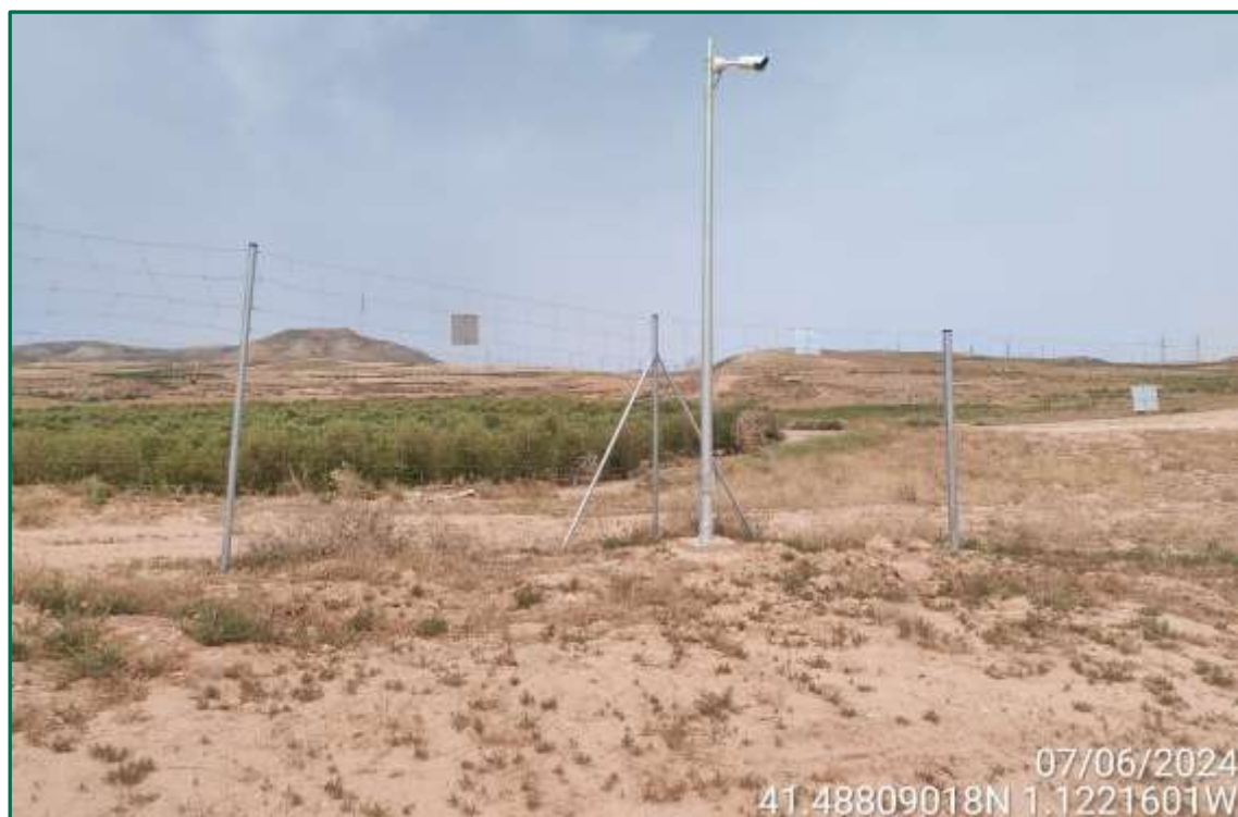
Fotografía 1. Vallado perimetral.

El vallado se ha visto afectado en algunas zonas por los episodios de fuertes vientos que se han producido en la zona. Estos vientos han arrastrado plantas rodadoras del entorno, que al encontrar el vallado como obstáculo se acumularon provocando la rotura de este en varios puntos. Ya se han reparando las zonas afectadas utilizando postes reforzados de mayor grosor.