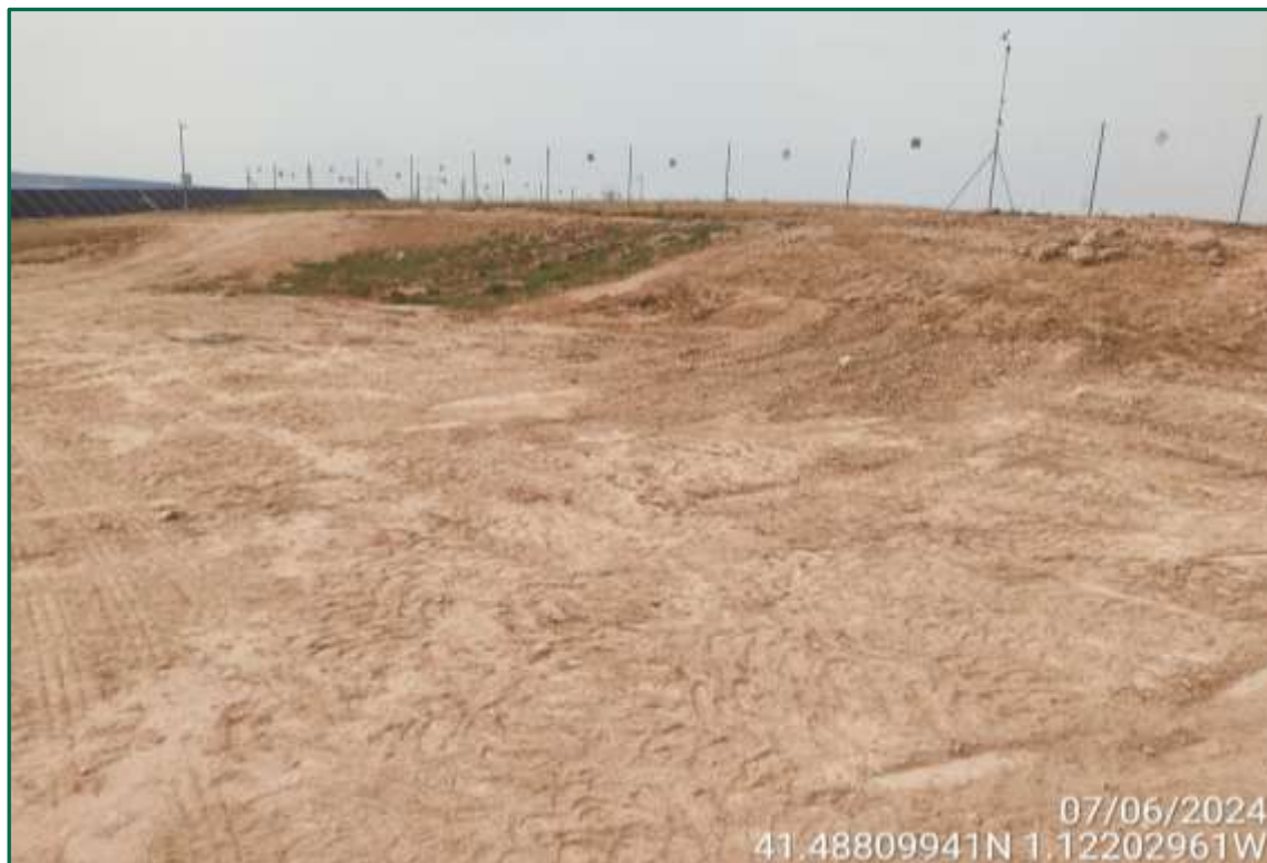
Fotografía 2. Vallado perimentral.