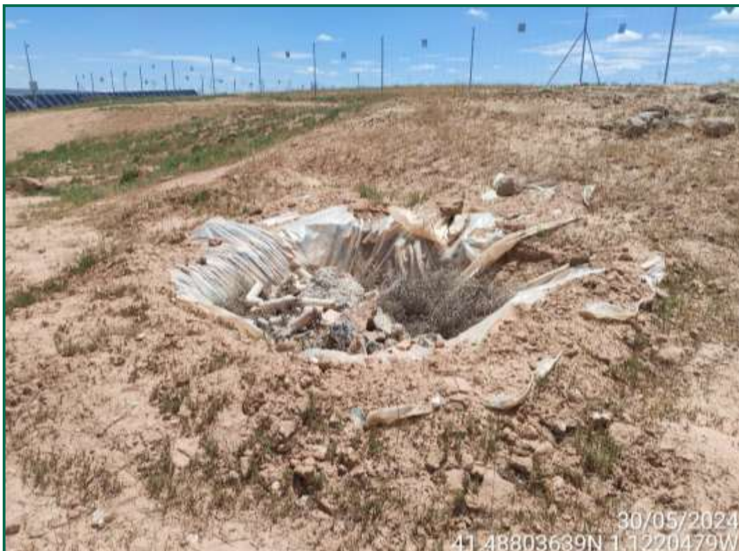
Fotografía 11. Zona de lavado de hormigón, antes de su retirada.