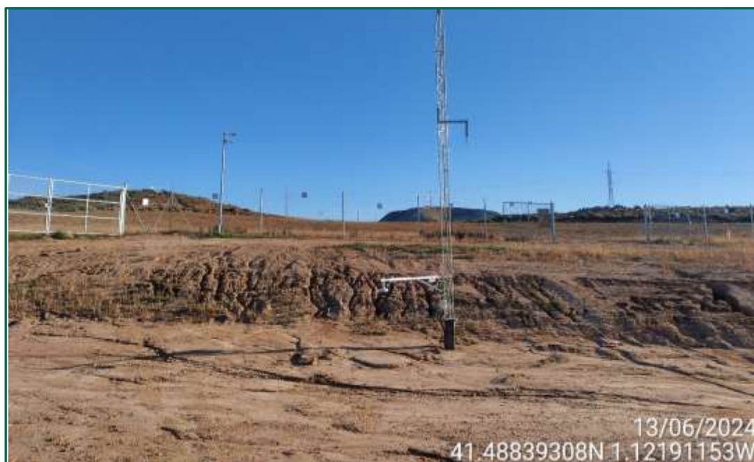
Fotografía 7. Episodios de erosión.