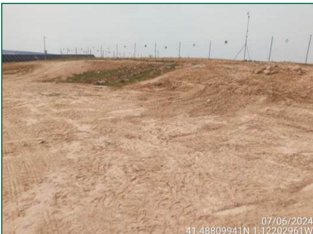
Fotografía 12. Zona de lavado de hormigón, ya retirada.