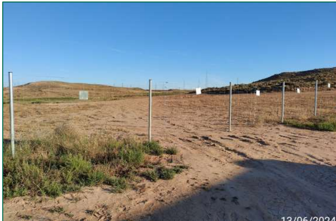
Fotografía 3. Vallado perimentral.