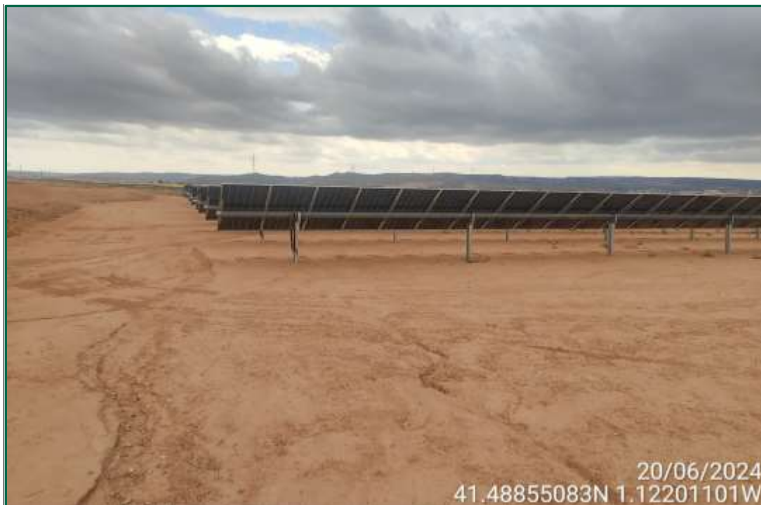
Fotografía 4. Placas ya colocadas.