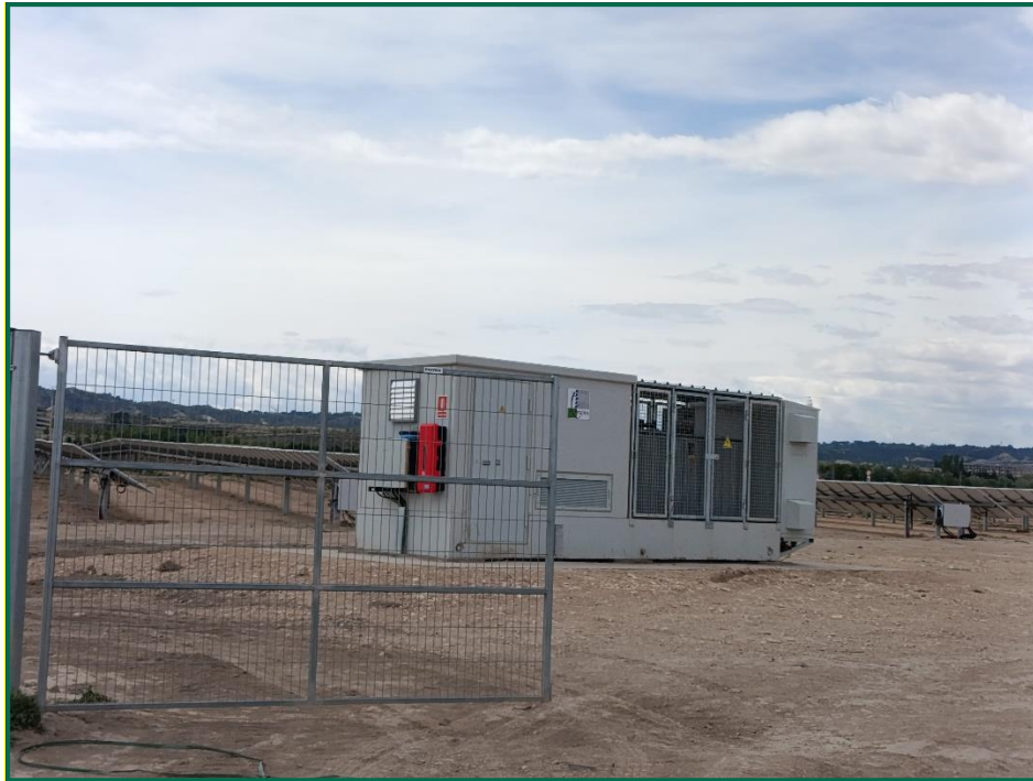
Fotografía 11. Material de extinción.