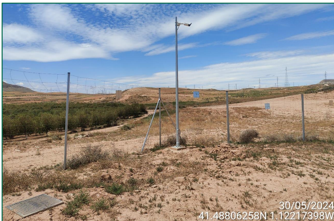
Fotografía 3. Vallado perimenteral.