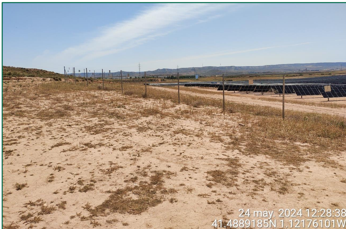
Fotografía 2. Vallado perimenteral.