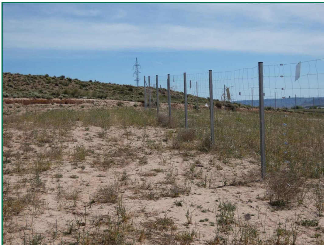
Fotografía 7. Cobertura vegetal colindante a la planta.