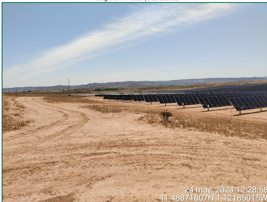
Fotografía 5. Placas ya colocadas