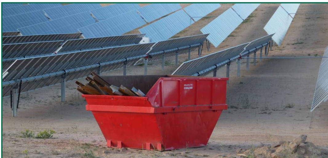
Fotografía 9. Contenedores para inertes, ya retirados.

Tanto los residuos inertes como los peligrosos, así como los contenedores y punto limpio ya han sido desmantelados y retirados por gestor autorizado, el único elemento que queda en planta es la balsa para limpieza de hormigón, que se mantiene por si es necesario realizar alguna reparación.