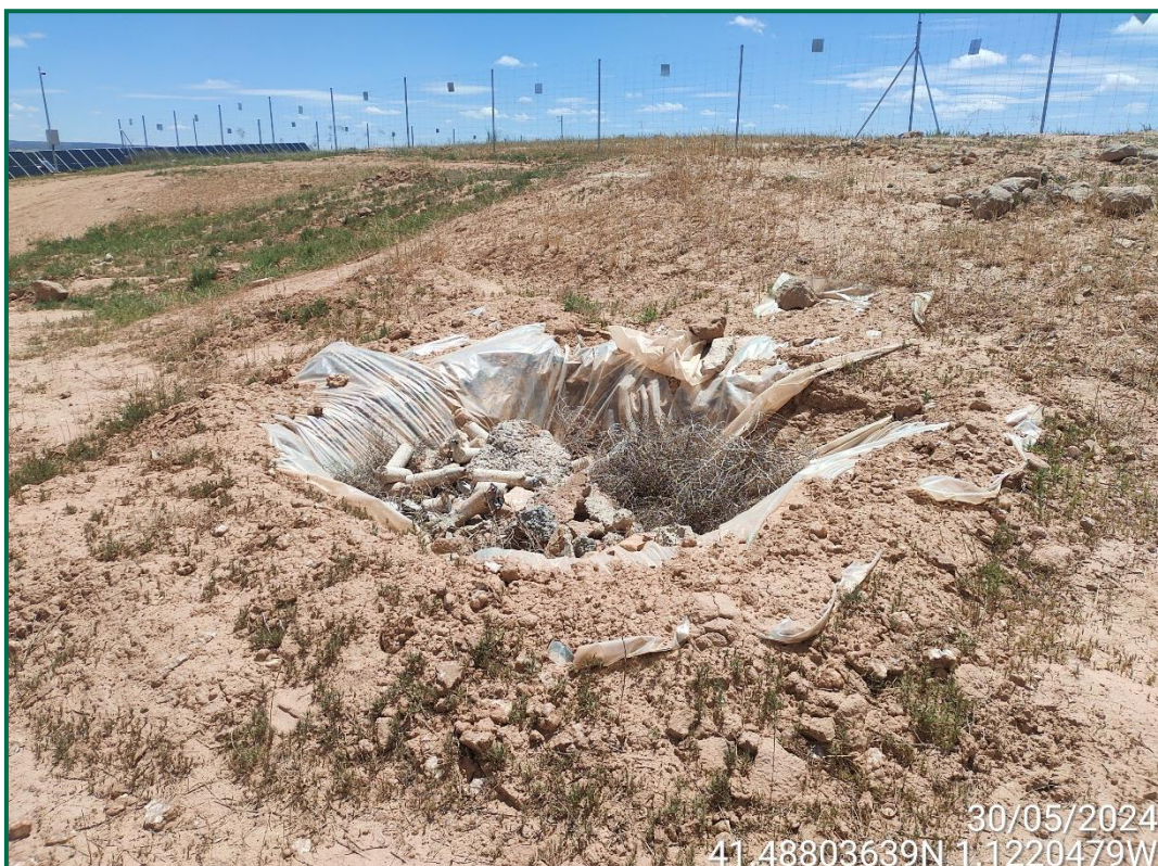
Fotografía 10. Zona de lavado de hormigón.