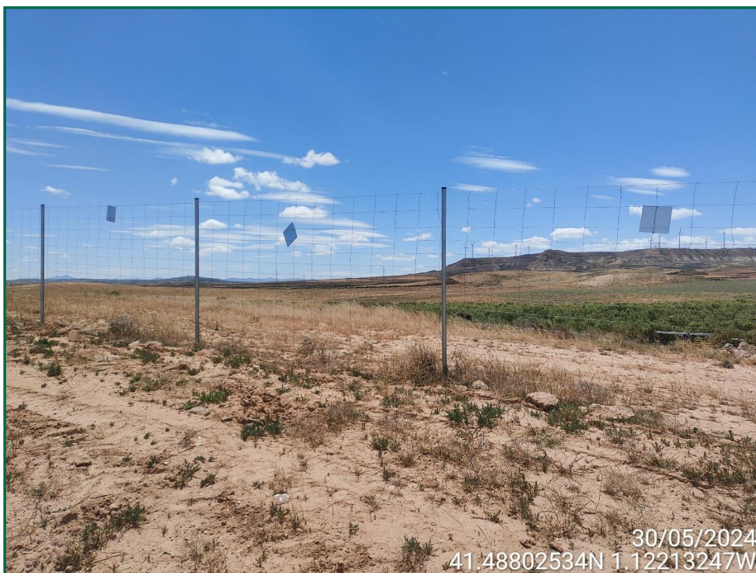
Fotografía 8. Placas anticolidión.

Se ha realizado seguimiento de avifauna, anotando los avistamientos durante por recorridos por el entorno de la obra, hasta el momento se han observado pocos vuelos, las aves avistadas en este mes han sido palomas torcaces ( Columba palumbus ), y busardo ratonero ( Buteo buteo ).