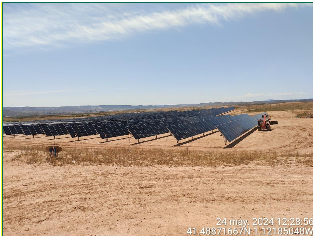
Fotografía 4. Placas ya colocadas