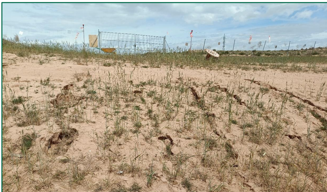
Fotografía 6. Episodios de erosión.