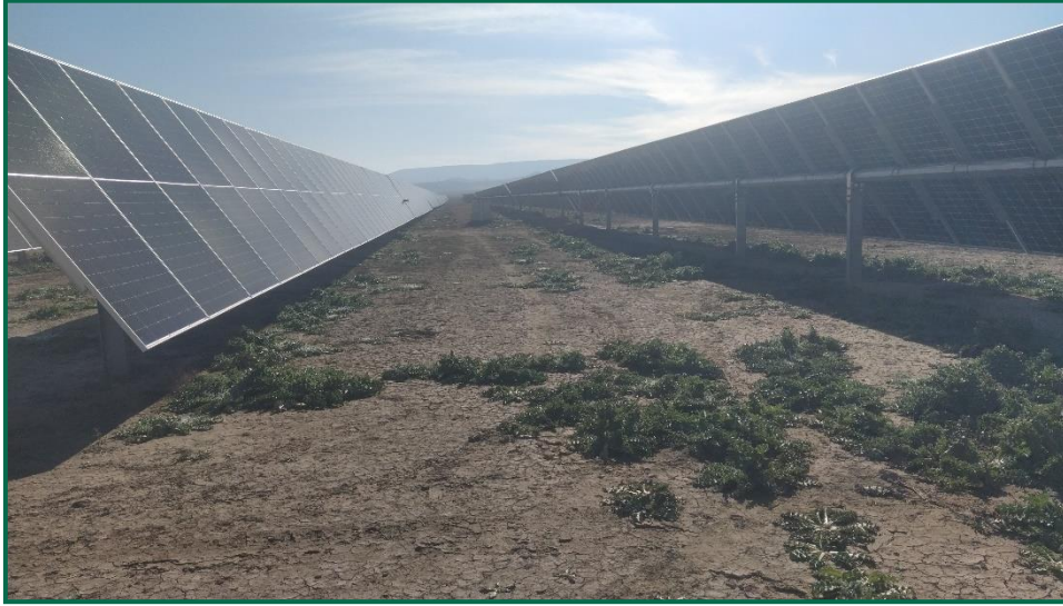
Fotografía 4. Hincas sobre el terreno.