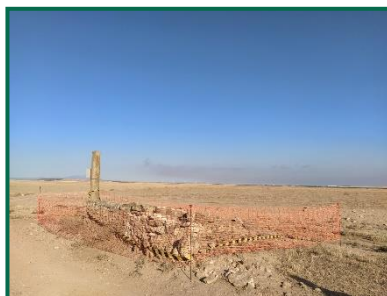
Fotografía 17. Muelle de carga