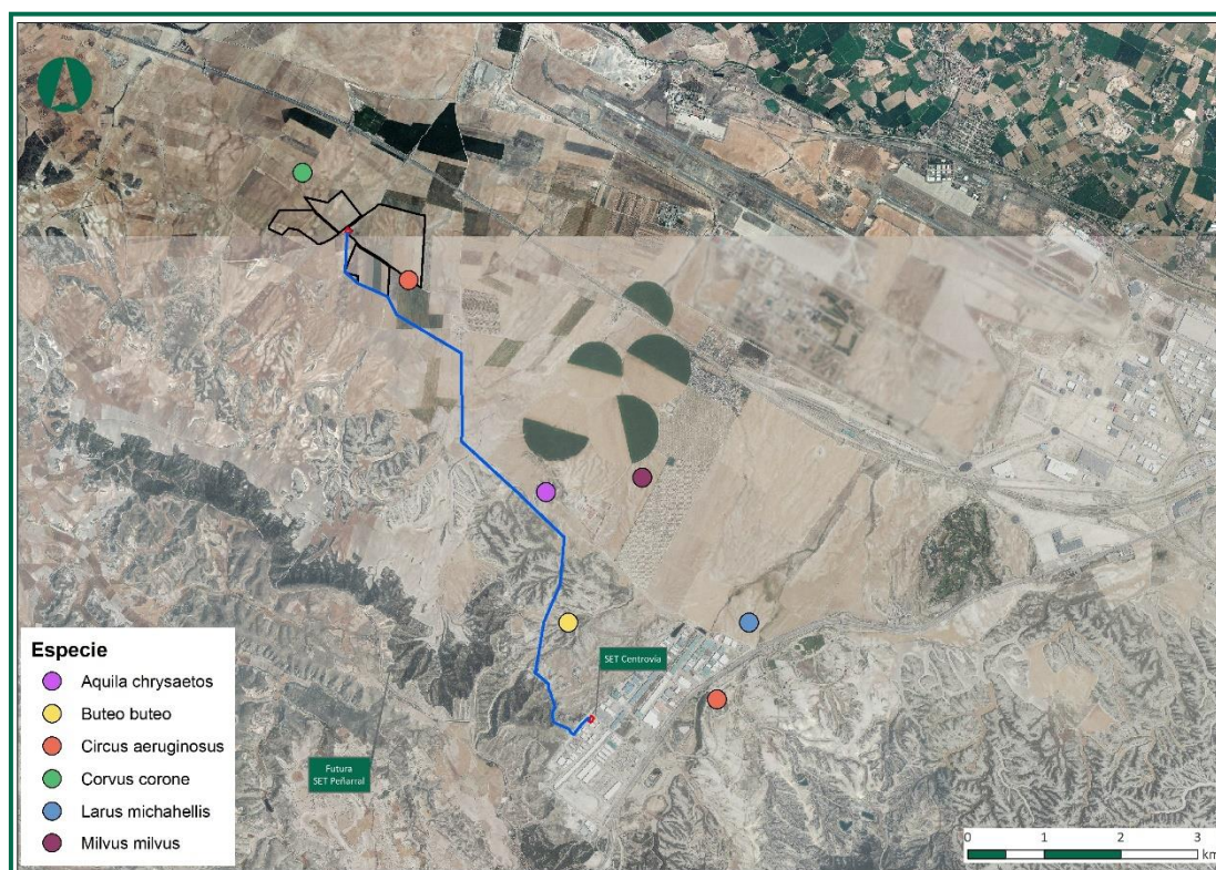
Figura 2. Avistamientos en obra

En este mes se han avistado varias especies residentes como aguilucho lagunero, un águila real, varias cornejas y dos gaviotas patiamarillas, además de un milano real, especie invernante. Todavía no se ha visto cernícalo primilla en Dehesa de ganaderos ni sus inmediaciones, se prevé que regresen a finales del mes de febrero.