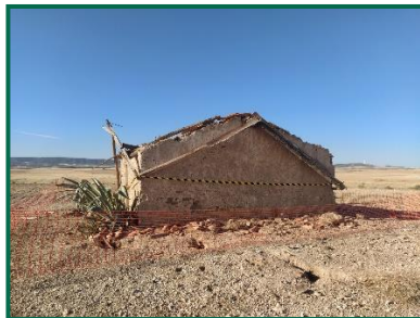
Fotografía 14. Caseta 1

Ya se ha procedido al balizado de los elementos arqueológicos indicados, a continuación, se muestran fotografías de estos balizados: