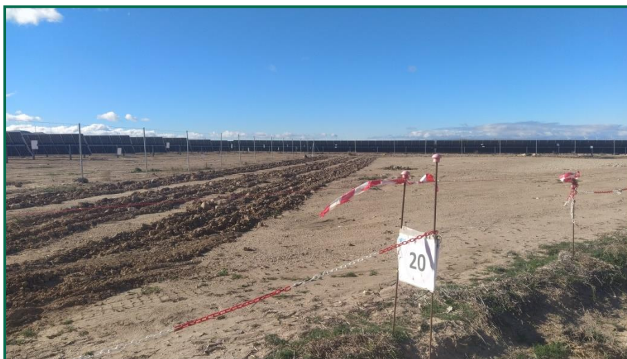
Fotografía 3. Señal de limitación de velocidad.

Durante las visitas a obra no se constata afección por emisión de polvo significativa, no se están realizando movimientos de tierra.