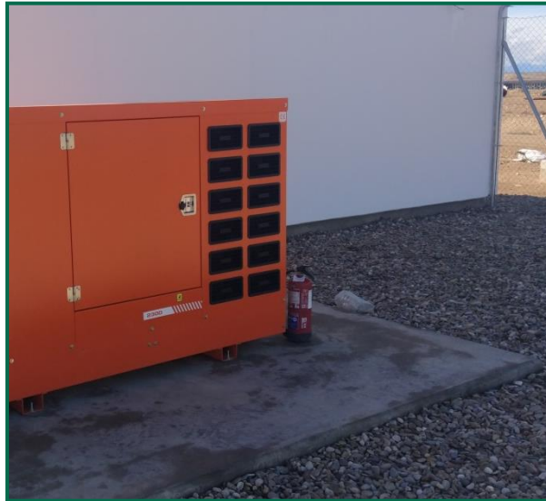
Fotografía 13. Extintor.

Informe mensual 4 año 2 (Diciembre 2023)