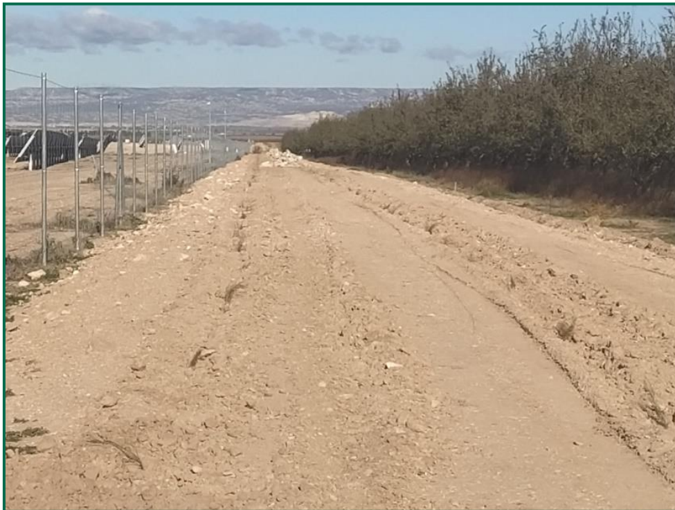
Fotografía 10. Zona con plantones ya colocados.

Todavía no se ha comenzado ningún tipo de trabajo en los citados apoyos de la línea de evacuación, únicamente se han excavado y hormigonado hasta el apoyo 11, excepto el 9, y se han montado las estructuras, todos en los que se ha trabajado se encuentran en campo de cultivo.