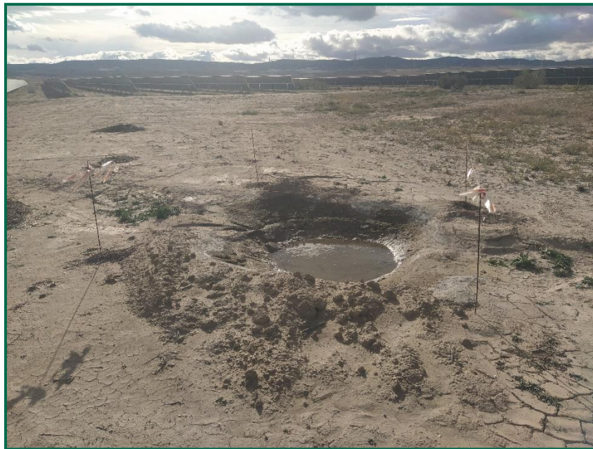
Fotografía 6. Balsete ya construido.

Esta medida ya se ha implantado , en la siguiente foto pueden verse una de las balsas construidas.