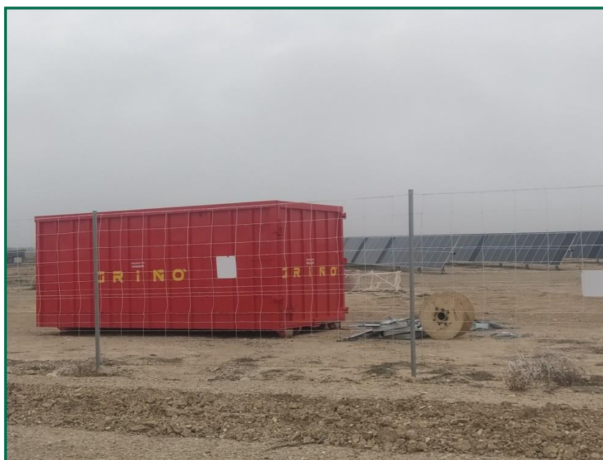
Fotografía 8. Contenedor para voluminosos.

El grupo electrógeno en uso actualmente cuenta con chasis estanco, está ubicado sobre y una base hormigonada dentro del perímetro de la subestación, y el bidón para combustible cuenta con una bandeja metálica para evitar vertidos accidentales en la recarga de combustible.