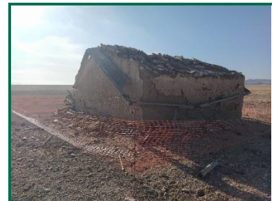
Fotografía 16. Caseta 3