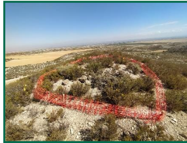
Fotografía 21. Pozo de tirador 3