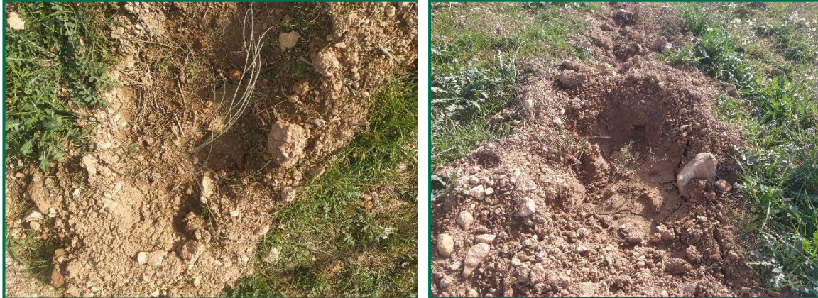
Fotografías 11 y 12. Plantones.