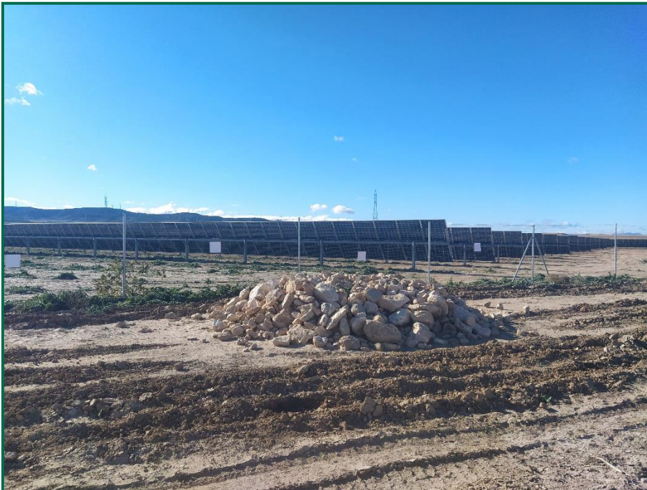
Fotografía 7. Montículos de piedras.