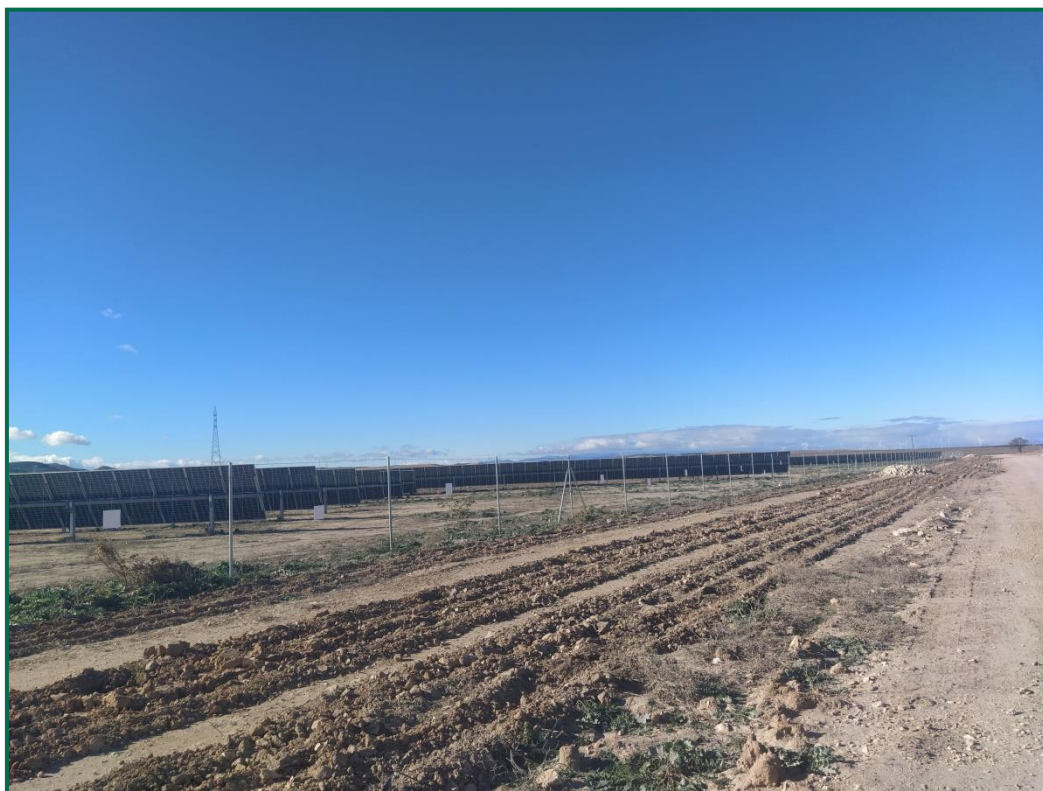
Fotografía 2. Vallado.