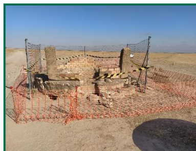
Fotografía 18. Pozo