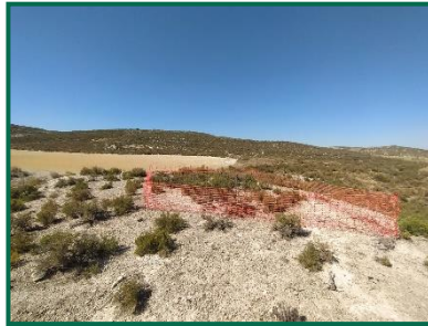
Fotografía 20. Pozo de tirador 2

Informe mensual 4 año 2 (Diciembre 2023)