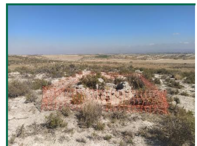
Fotografía 19. Pozo de tirador 1