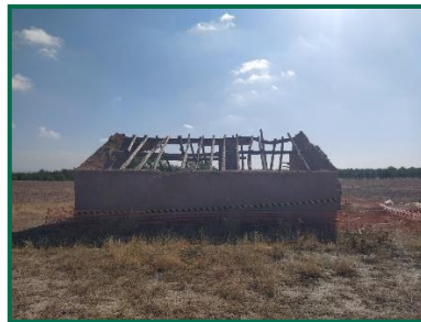
Fotografía 15. Caseta 2