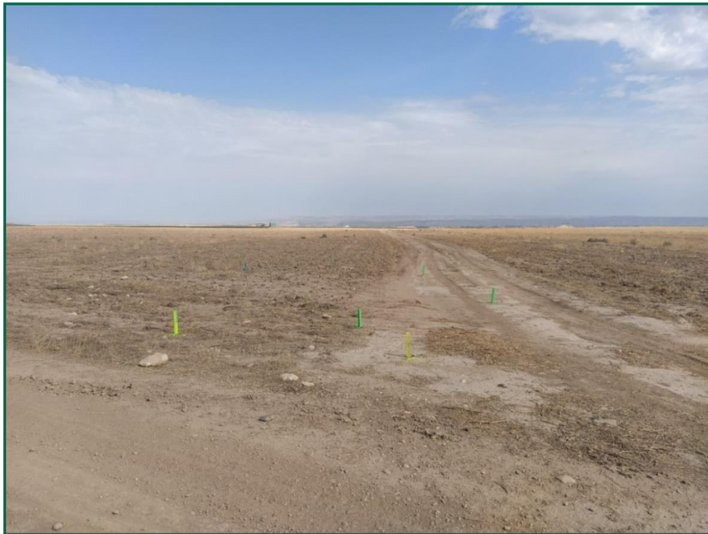
Fotografía 1. Jalonamiento previo.

Informe mensual 4 año 2 (Diciembre 2023)