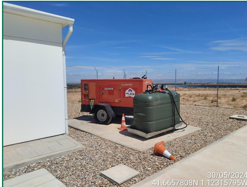
Fotografía 8. Grupo electrógeno.

El grupo electrógeno en uso actualmente cuenta con chasis estanco, está ubicado sobre y una base hormigonada dentro del perímetro de la subestación, y el bidón para combustible cuenta con una bandeja metálica para evitar vertidos accidentales en la recarga de combustible.