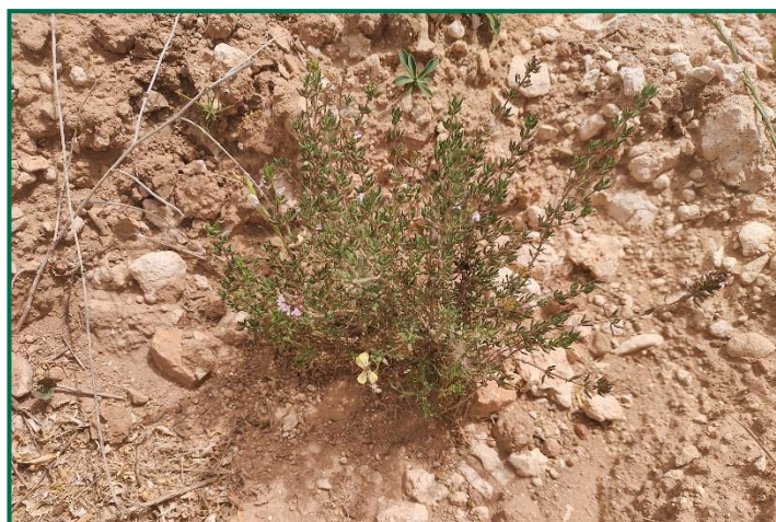
Fotografía 10. Plantones.