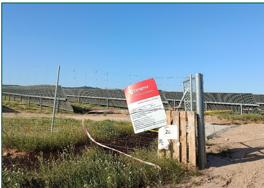
Fotografía 3. Señal de limitación de velocidad.