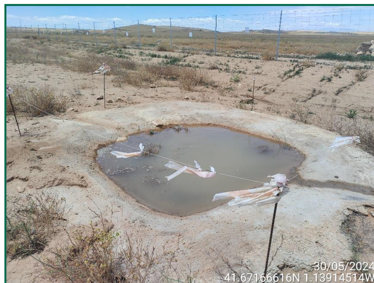
Fotografía 6. Basete ya construido.

Esta medida ya se ha implantado , en la siguiente foto puede verse la balsa construida.