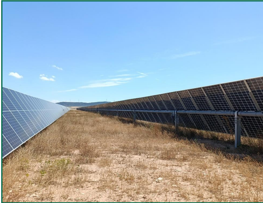
Fotografía 4. Hincas sobre el terreno.