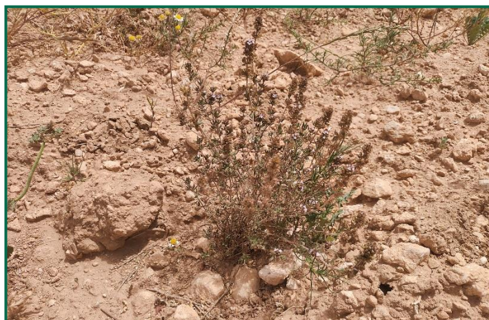
Fotografía 9. Plantones.