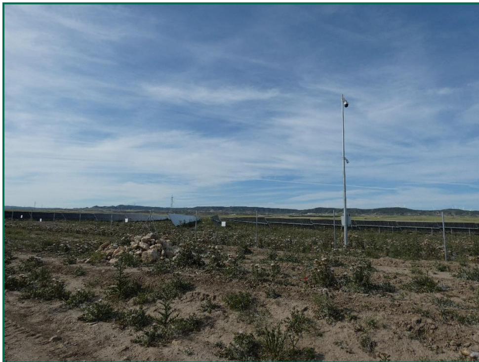
Fotografía 7. Montículos de piedras.