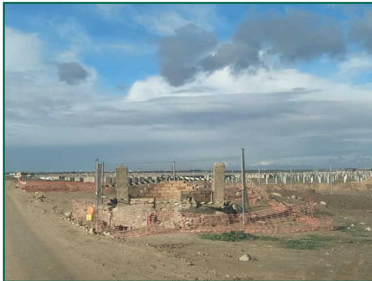
Fotografía 12. Muelle de carga

Ya se ha procedido al balizado del citado elemento arqueológicos, a continuación, se muestran fotografía de este balizado: