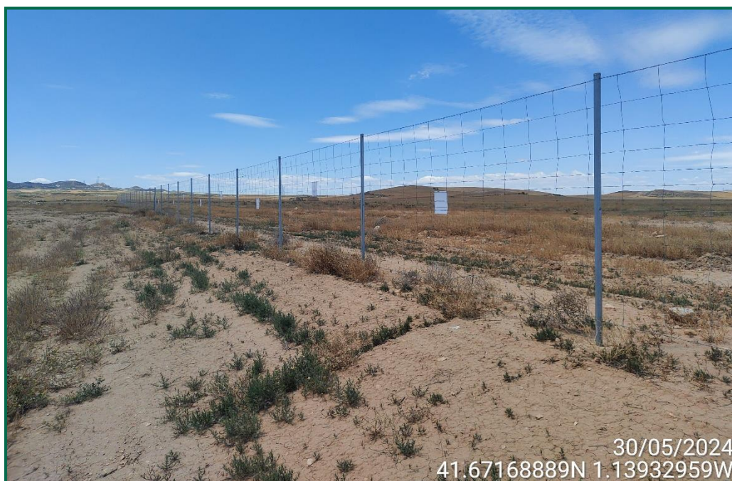
Fotografía 2. Vallado.