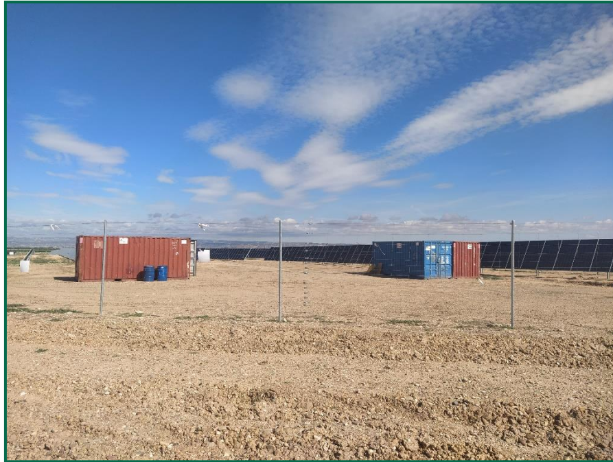
Fotografía 8. Contenedor para voluminosos.

El grupo electrógeno en uso actualmente cuenta con chasis estanco, está ubicado sobre y una base hormigonada dentro del perímetro de la subestación, y el bidón para combustible cuenta con una bandeja metálica para evitar vertidos accidentales en la recarga de combustible.