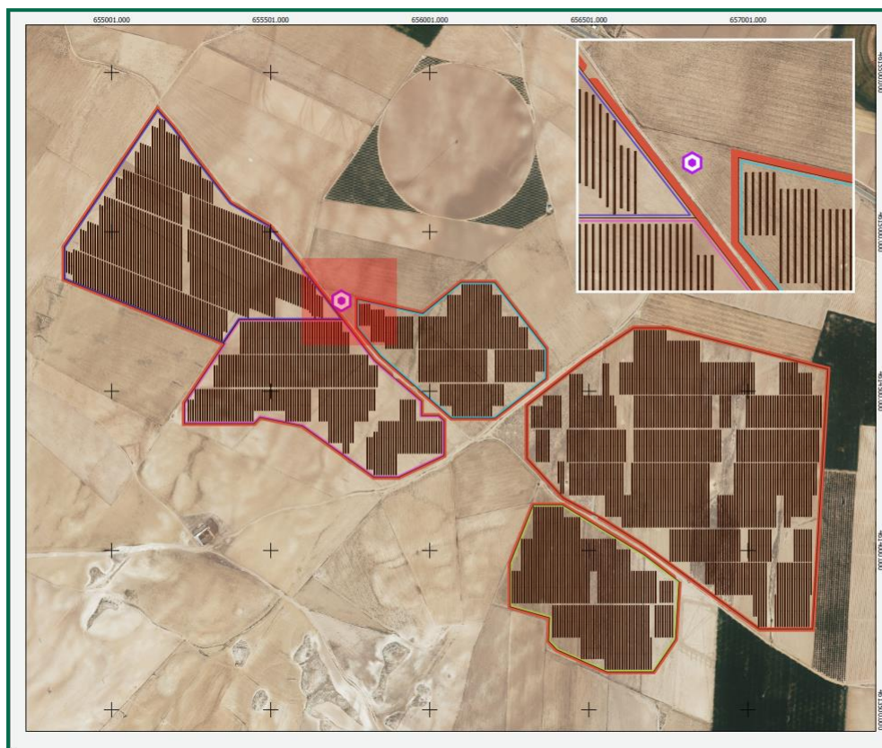
Figura 3. Ubicación primillar propuesto.

Tras la construcción del primillar se iniciará la puesta en marcha de un proceso de hacking (o cría campestre) durante un mínimo de 3 años, durante el cual se introducirán pollos procedentes de cría en cautividad que aseguren el funcionamiento de la colonia reproductora como tal, una vez acabe el citado periodo.