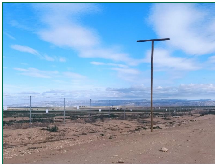
Fotografía 5. Poste posadero