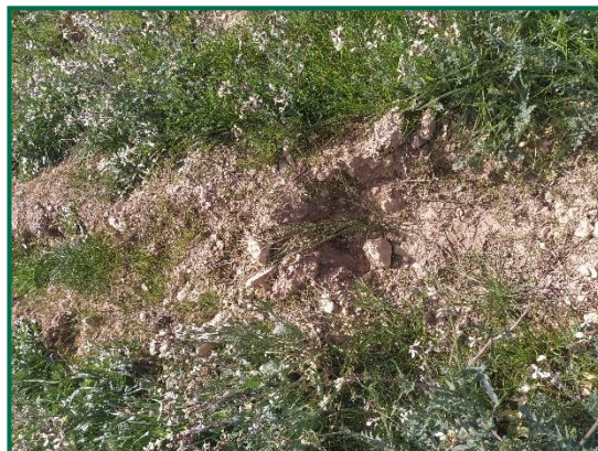
Fotografías 11 y 12. Plántones.