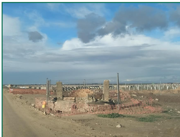
Fotografía 14. Muelle de carga

Ya se ha procedido al balizado del citado elemento arqueológicos, a continuación, se muestran fotografía de este balizado: