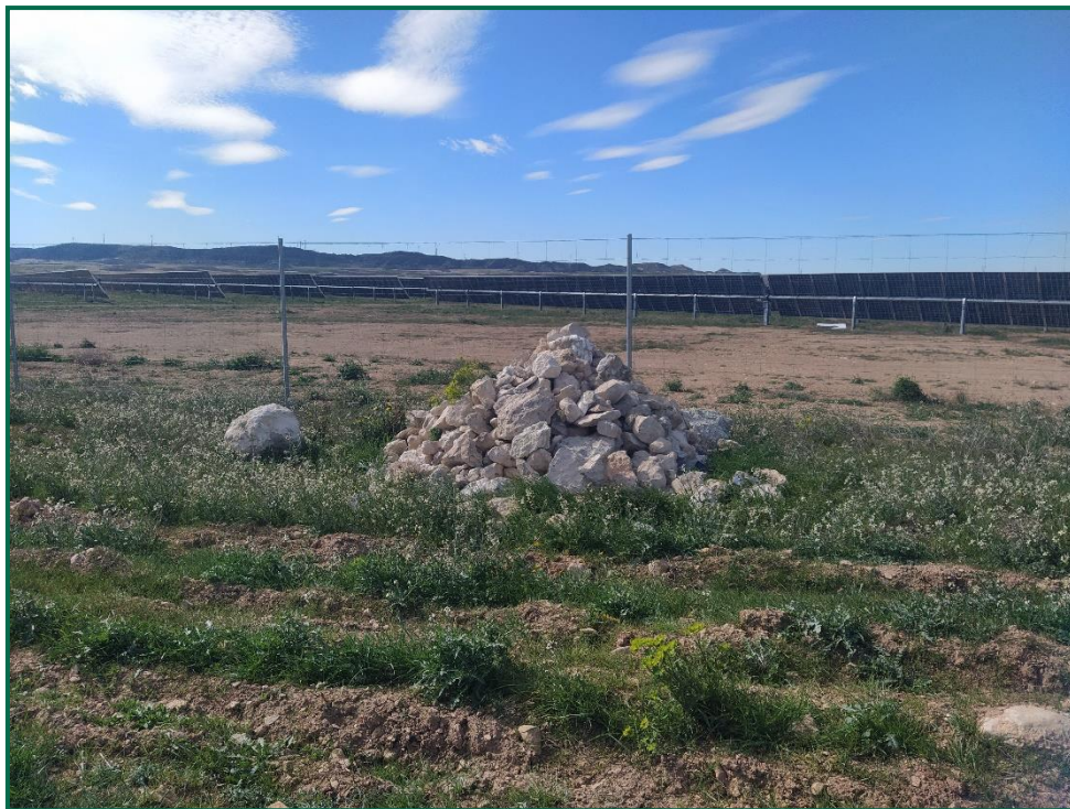
Fotografía 7. Montículos de piedras.