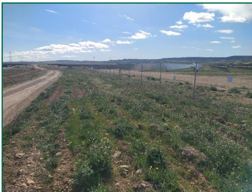
Fotografía 10. Zona con plántones ya colocados.

Las plantaciones se efectuaron entre los meses de noviembre y diciembre de 2023.