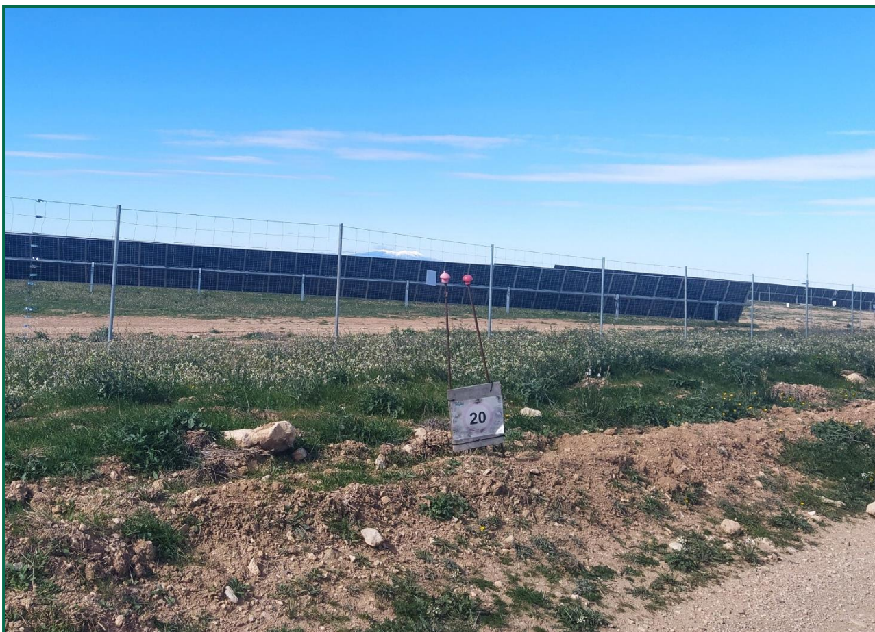
Fotografía 3. Señal de limitación de velocidad.