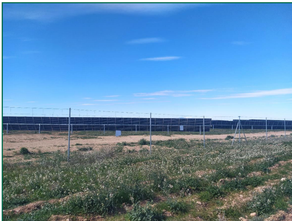
Fotografía 2. Vallado.