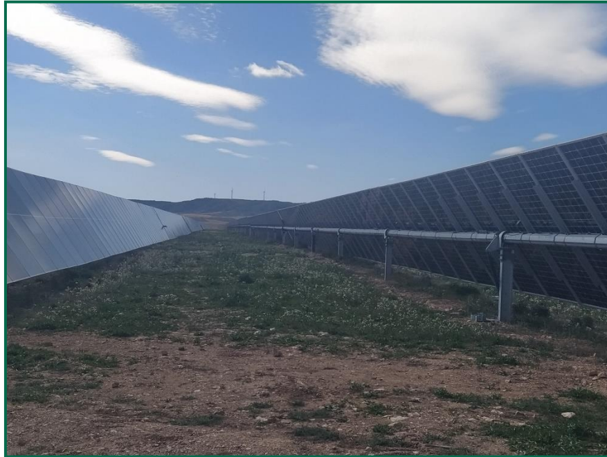
Fotografía 4. Hincas sobre el terreno.