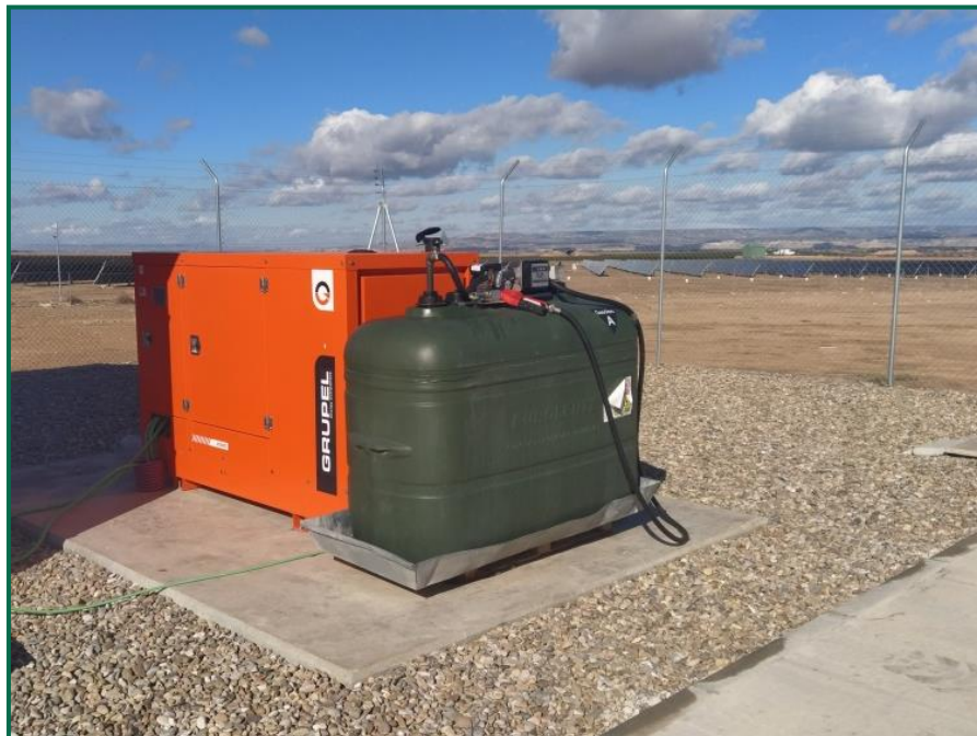
Fotografía 9. Grupo electrógeno.