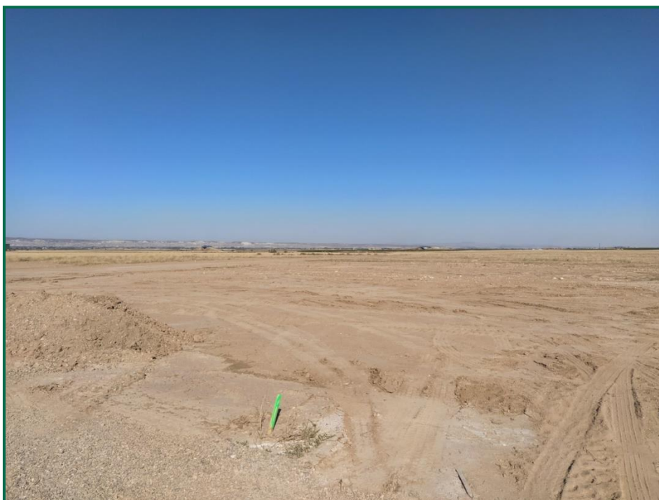
Fotografía 1. Jalonamiento previo.

Se realiza un jalonamiento del perímetro mediante estacas. La Dirección Ambiental realiza un control visual continuado para comprobar que no se sobrepasan los límites de la zona de ocupación.