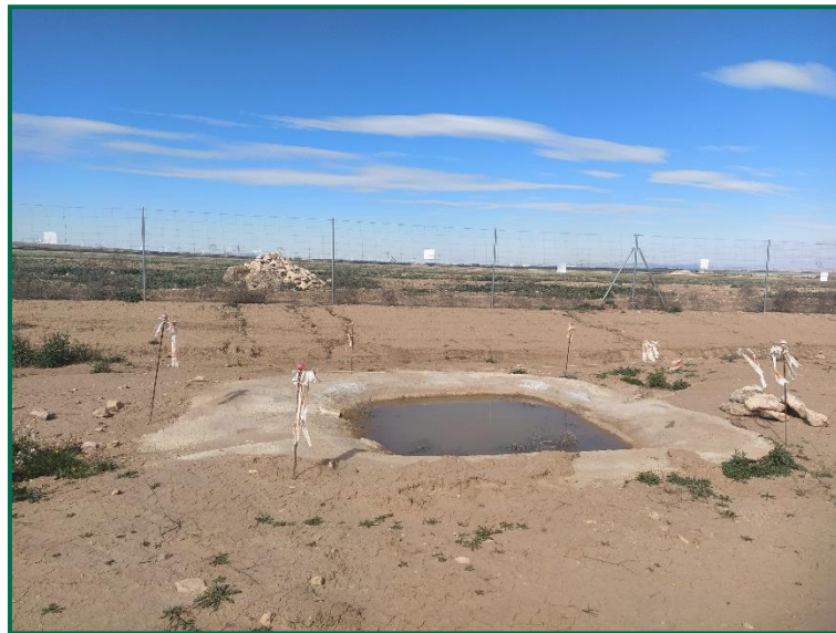
Fotografía 6. Basete ya construido.

Esta medida ya se ha implantado , en la siguiente foto puede verse la balsa construida.