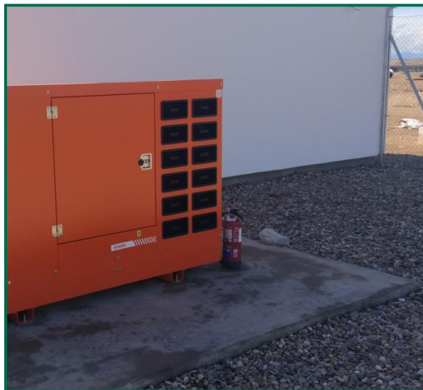
Fotografía 13. Extintor.

Se dispone de extintores, en la zona de la subestación, junto al grupo electrógeno y en la zona de obras. No se han depositado restos de desbroces ni materiales combustibles.