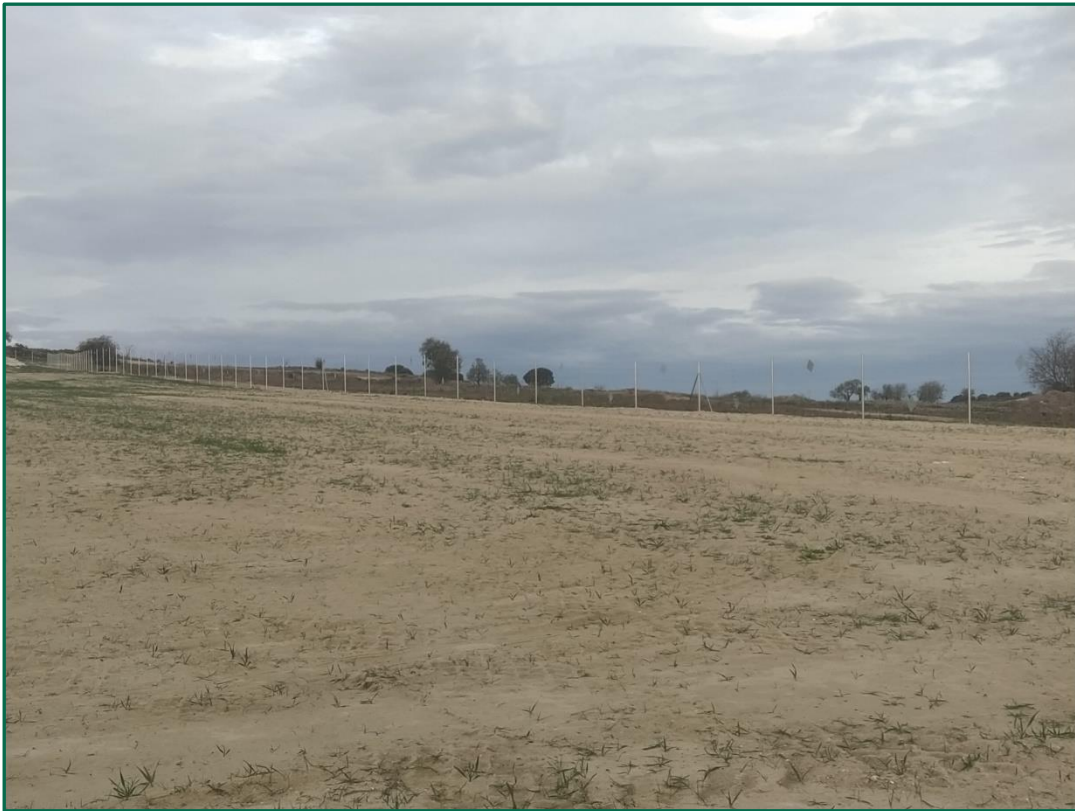
Fotografía 5. Superficie de la planta.

Por el momento la tierra vegetal extraída ha sido escasa debido a que no ha sido necesario nivelar todo el terreno, únicamente algunas zonas y con un espesor limitado, y esta se ha ido extendiendo sobre el terreno. En las zonas donde se van a realizar plantaciones para crear una patalla vegetal no se ha realizado ningún movimiento de tierra, conservando la capa de tierra vegetal presente.