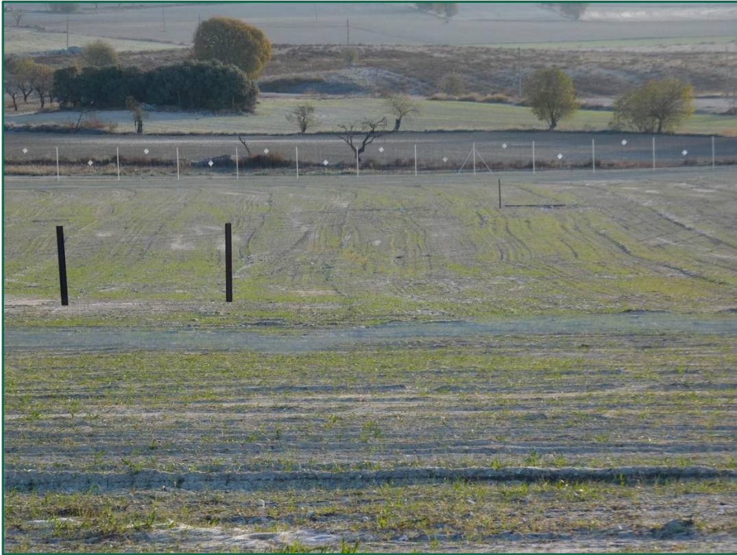
Fotografía 6. Superficie de la planta.