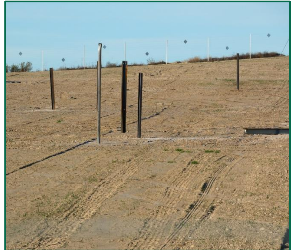
Fotografías 1 y 2. Pruebas de hincado y maquinaria utilizada.