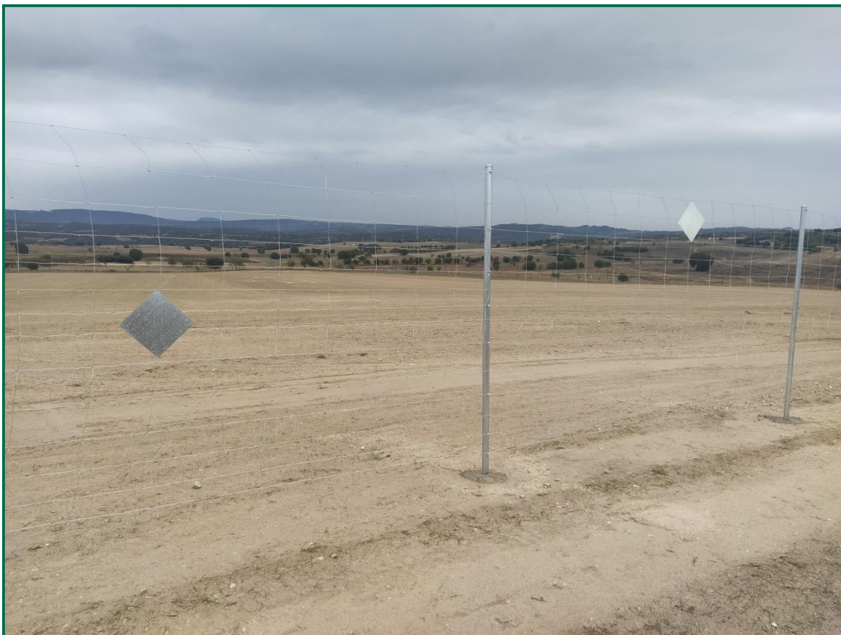
Fotografía 8. Vallado perimetral.

Se ha realizado seguimiento de avifauna, anotando los avistamientos durante por recorridos por el entorno de la obra, hasta el momento se han observado pocos vuelos, las aves avistadas han sido varias cornejas negras ( Corvus corone ) sobre los campos próximos.