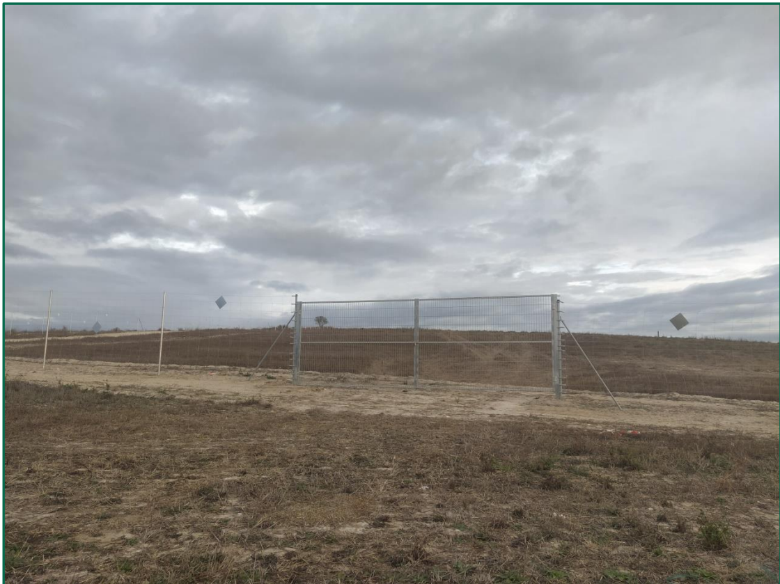
Fotografía 3. Puerta y vallado perimetral y puerta de acceso.

No se realiza el balizamiento de todo el perímetro de la obra ya que se generaría una gran cantidad de residuos de malla de obra o cinta que tiende a romperse y dispersarse por toda la zona. Durante este primer mes ya se ha instalado el vallado perimetral de forma que los límites quedan definidos. La Dirección Ambiental realiza un control visual continuado para comprobar que no se sobrepasan los límites de la zona de ocupación.