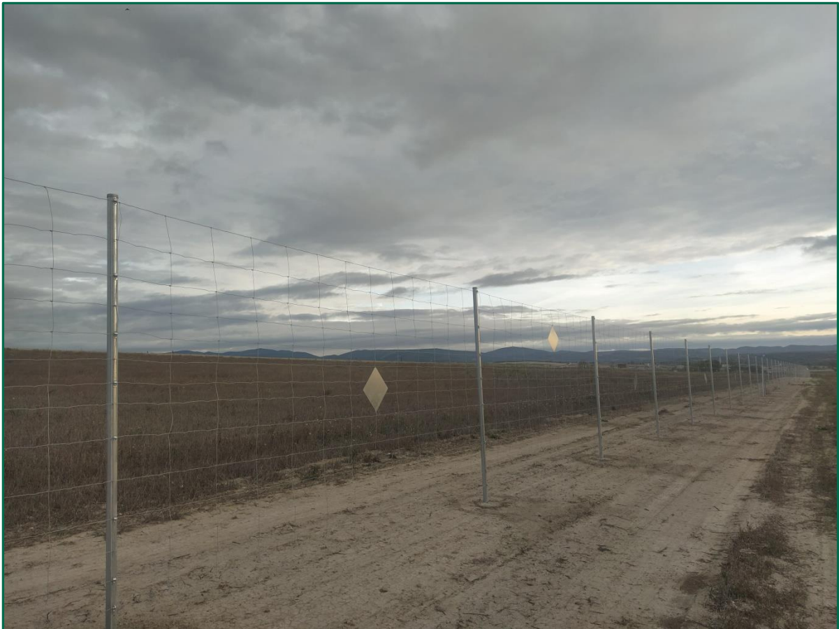
Fotografía 4. Vallado.