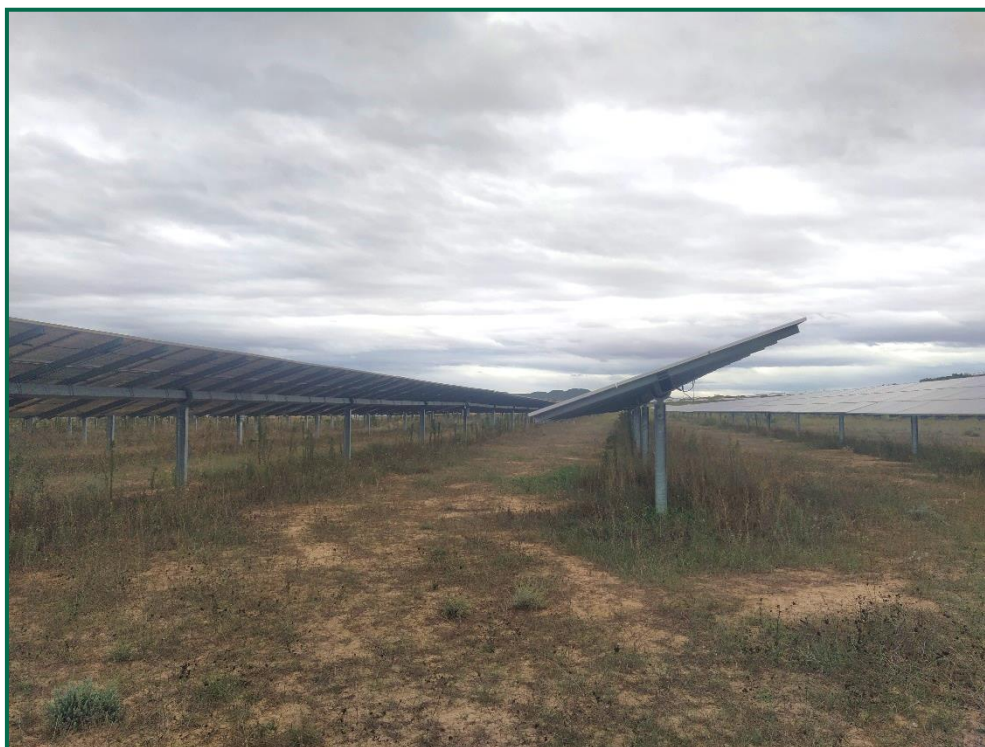
Fotografía 1. Vegetación entre placas actualmente.

Se ha realizado un seguimiento de la evolución de las revegetaciones realizadas durante los meses de invierno de 2020. Estas plantas se desarrollan, aunque se ha observado la desaparición de ejemplares. Durante la primavera se produce un desarrollo de la vegetación espontánea de la zona, que en ocasiones compite con la vegetación plantada. En todo caso esta proliferación vegetal contribuye a evitar la erosión.