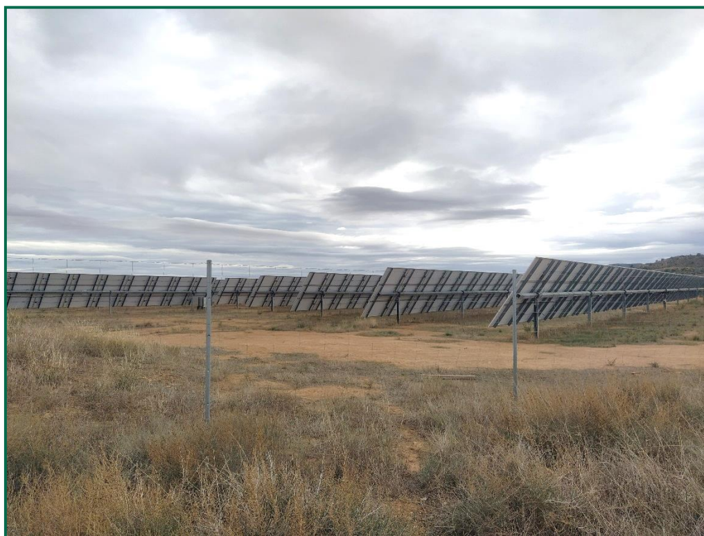
Fotografía 2. Vallado perimetral.

Respecto al vallado perimetral, se ha utilizado en todas las plantas malla cinagética que permite el paso de fauna de pequeño tamaño. Este vallado mide 2 metros de altura total y está formado por una serie de alambres verticales y horizontales, con una separación entre los verticales de 30cm, y entre los horizontales de mínimo 15cm en la línea inferior. Este vallado no presenta elementos cortantes ni punzantes.