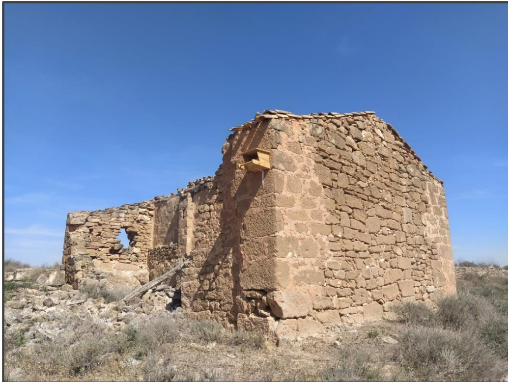
Fotografía 6. Caja para rapaz sobre construcción.