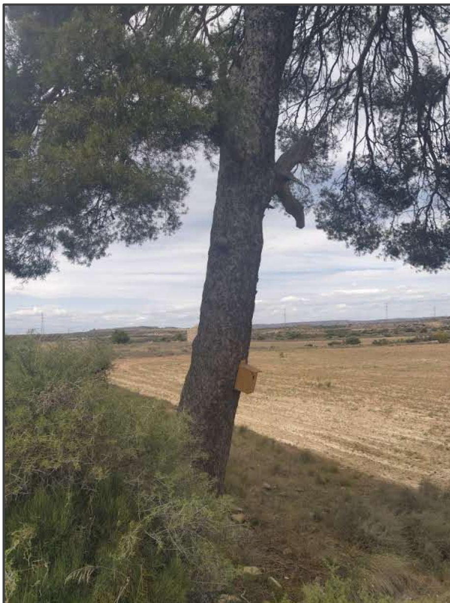
Fotografía 8. Caja para carraca sobre árbol.