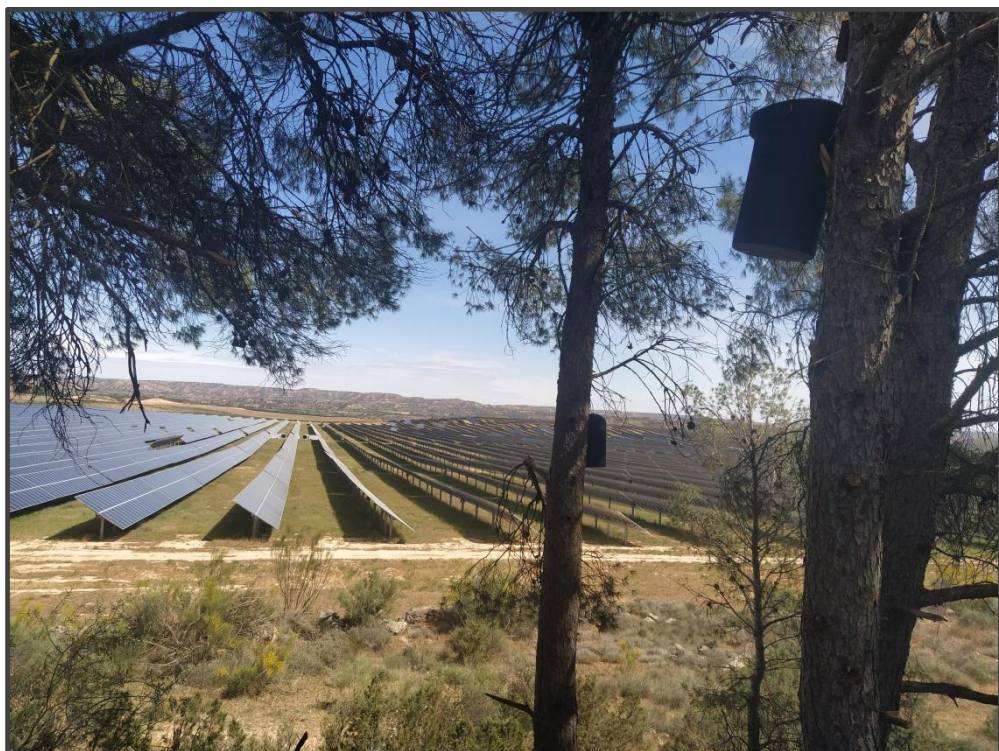
Fotografía 10. Cajas para quirópteros.