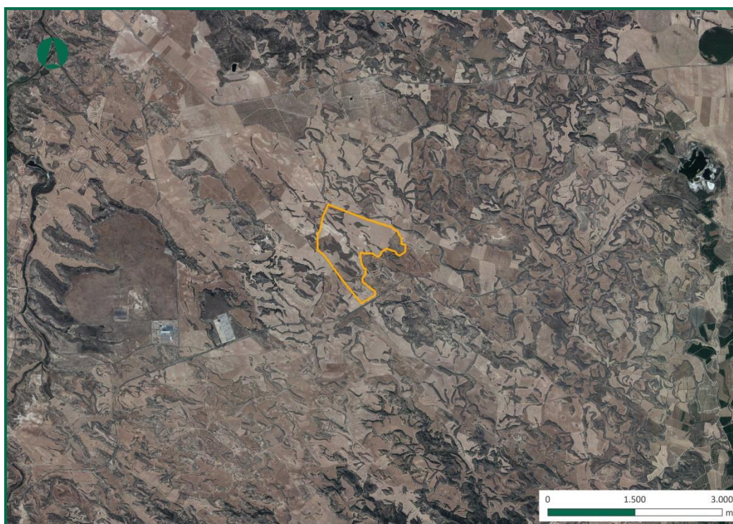
Figura 2. Localización de la zona de estudio.

La Planta FV IGNIS SOLAR UNO se extiende por un conjunto de parcelas, todas ellas pertenecientes al municipio de Escatrón, contiguas unas con otras y que suman una superficie total aproximada de 165 Ha, cuyo uso y calificación previo era agrícola.