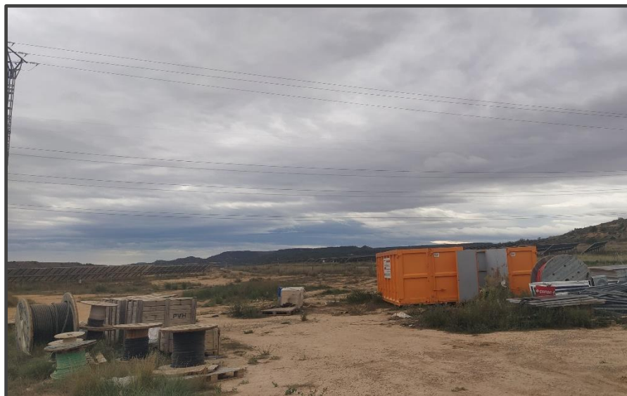
Fotografía 12. Contenedores de residuos.