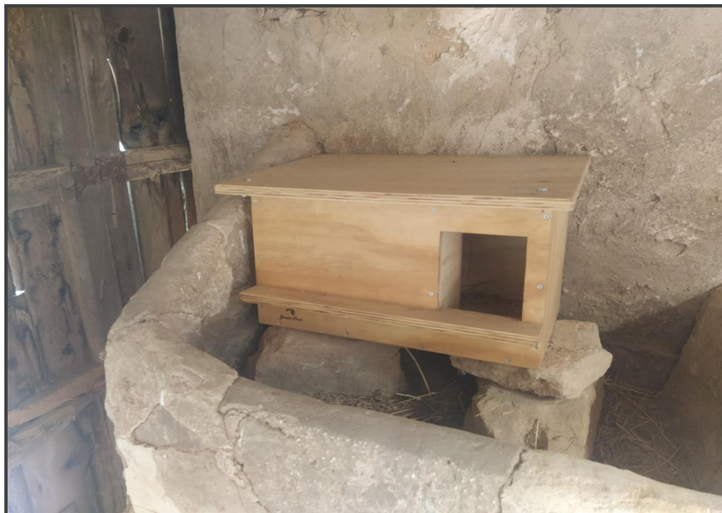
Fotografía 7. Caja para lechuza/rapaz nocturna en el interior de construcción.