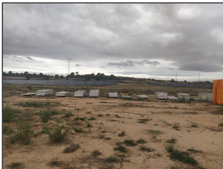
Fotografía 13. Zona de acopio de placas solares deterioradas.