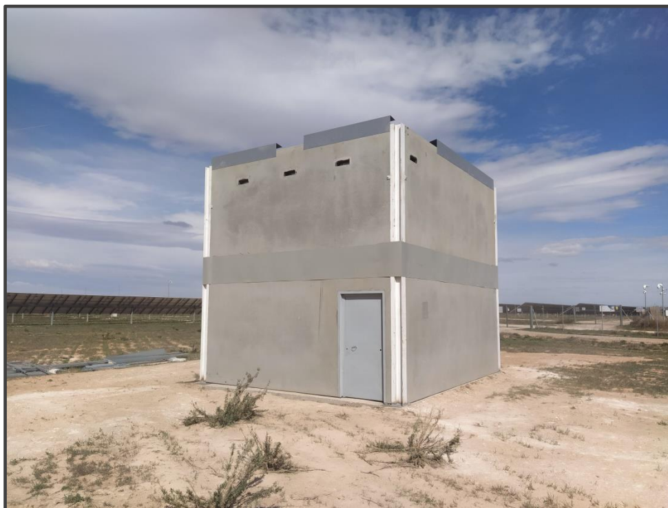
Fotografía 4. Exterior del primillar de nueva construcción.

Por el momento no ha sido ocupado por parejas de cernícalo primilla. En futuras fases se contempla la posibilidad de introducción de ejemplares criados en cautividad en caso de no ser ocupado de forma espontánea.