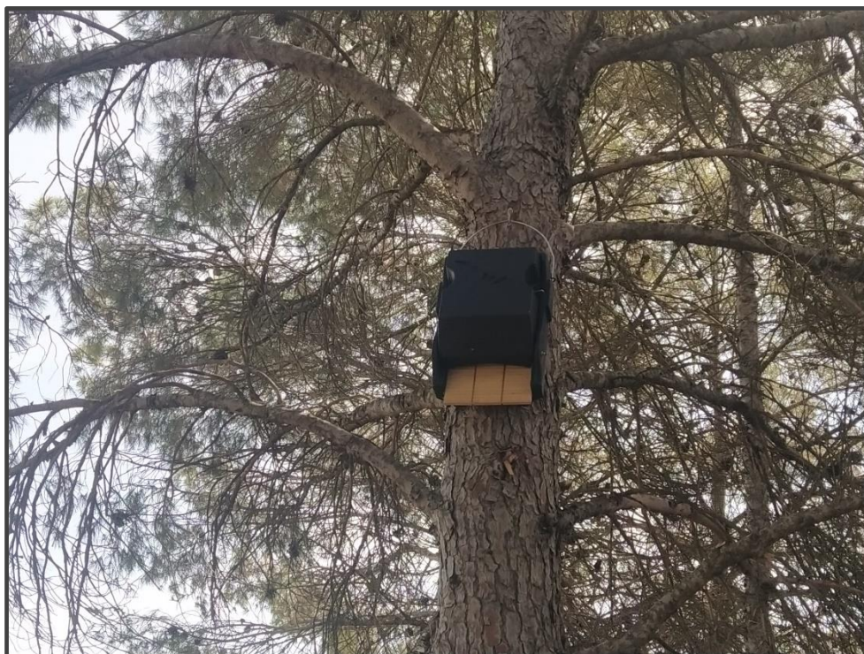
Fotografía 13. Caja para colonia de quirópteros.

La empresa que en la actualidad es propietaria y gestora de las Plantas fotovoltaicas está diseñando, adicionalmente a las medidas ya implantadas, y en colaboración con el área de Ecología de la Universidad de Zaragoza, un plan que desarrolle la forma más apropiada de implementar nuevas medidas, para lo cual se está realizando un estudio previo del medio, que incluye vegetación, suelos y fauna, y se redactará una propuesta de actuaciones, a consultar con la administración.