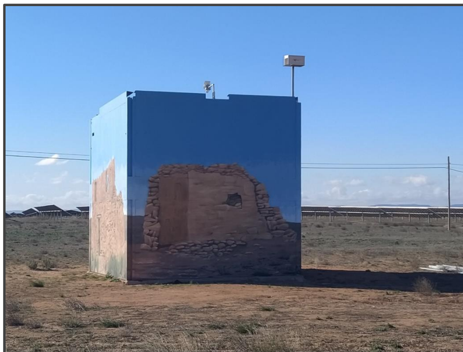
Fotografía 6. Exterior del primillar, pintado.

En este cuatrimestre se ha pintado el exterior de este primillar, para mejorar su integración paisajística en el entorno.