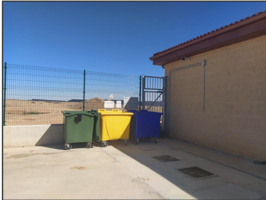
Fotografía 14. Contenedores de residuos.