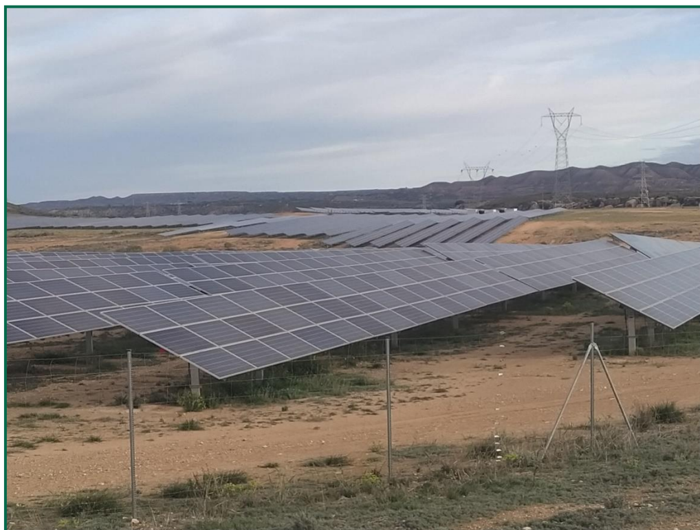
Fotografía 3. Vallado perimetral.

Con objeto de realizar un seguimiento de fauna se han realizado las siguientes acciones: