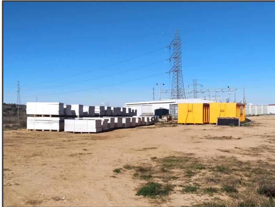
Fotografía 15. Zona de acopio de placas solares deterioradas.