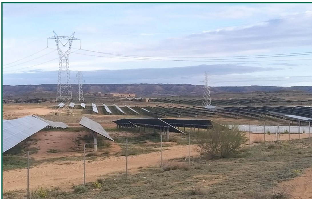
Fotografía 1. Vegetación entre placas actualmente.

Se ha realizado un seguimiento de la evolución de las revegetaciones realizadas durante los meses de invierno de 2020. Estas plantas se desarrollan, aunque se ha observado la desaparición de ejemplares. Durante la primavera se produce un desarrollo de la vegetación espontánea de la zona, que en ocasiones compite con la vegetación plantada. En todo caso esta proliferación vegetal contribuye a evitar la erosión.