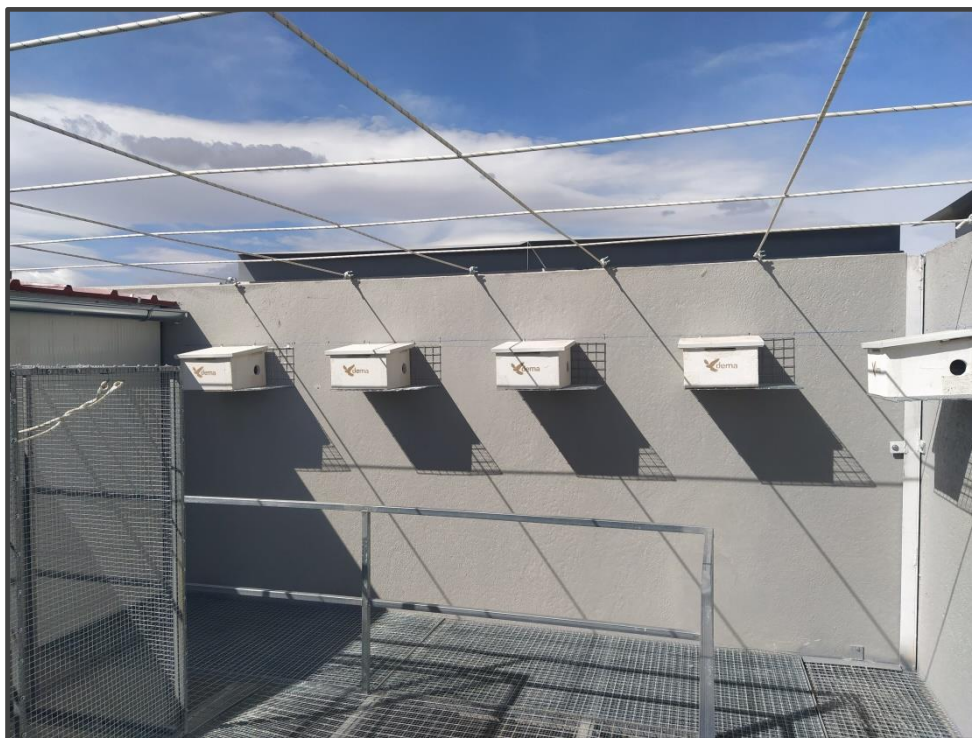
Fotografía 5. Interior del primillar, cajas nido.

En este cuatrimestre se ha pintado el exterior de este primillar, para mejorar su integración paisajística en el entorno.