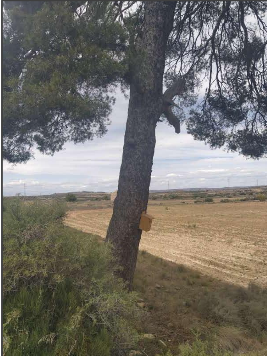
Fotografía 10. Caja para carraca sobre árbol.