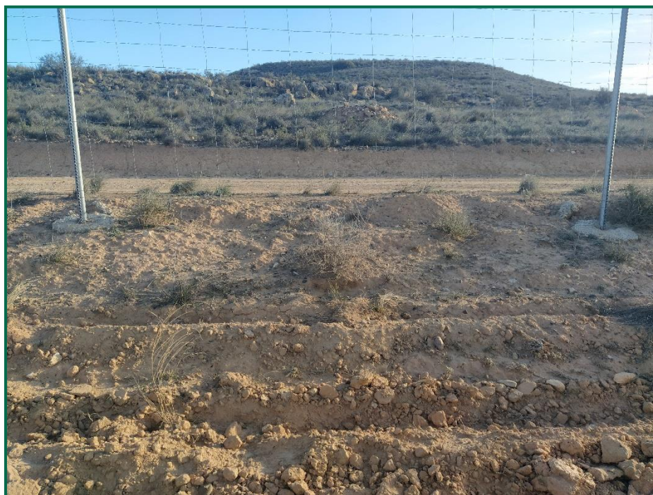
Fotografía 2. Zona revegetada.