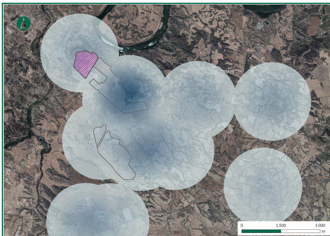
Figura 3. Uso del espacio por rapaces y aves de mayor envergadura.

Los resultados se pueden ver en la siguiente figura: