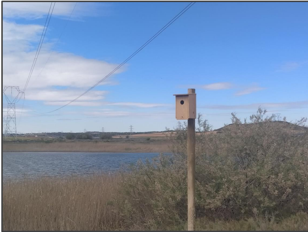
Fotografía 11. Caja para carraca junto a Hoya de Blase.