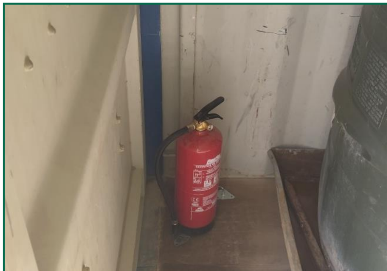
Fotografía 17. Extintor.

La maquinaria utilizada hasta el momento dispone de extintores, también se ha colocado uno junto al depósito de gasoil. No se ha depositado ningún tipo de material combustible sobre el terreno.