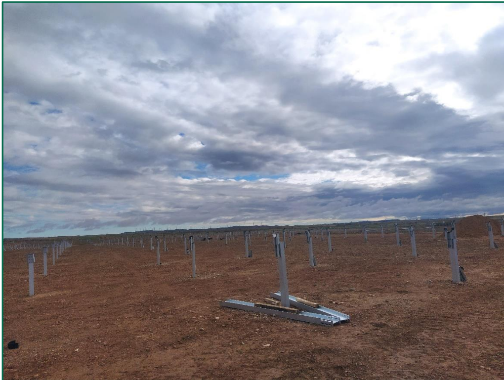
Fotografía 5. Superficie de la planta.

La tierra vegetal retirada durante las obras se acopiará en caballones con el objetivo de conservarla correctamente para su posterior uso en la restauración, por el momento no se ha extraído nada, excepto en la excavación de zanjas, debido a que el terreno es muy llano y no es necesario nivelarlo, únicamente se ha homogeneizado la superficie mediante el uso de traíllas y se han retirado las piedras de mayor tamaño. La tierra extraída en las zanjas se vuelve a depositar para rellenar estas una vez pasado el cable.