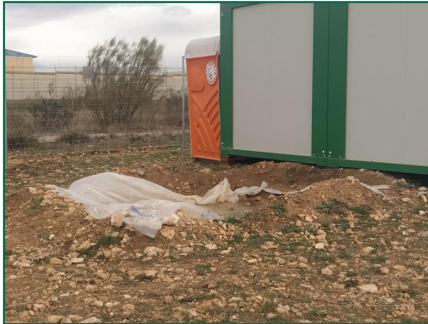
Fotografía 15. Zona para el lavado de canaletas.