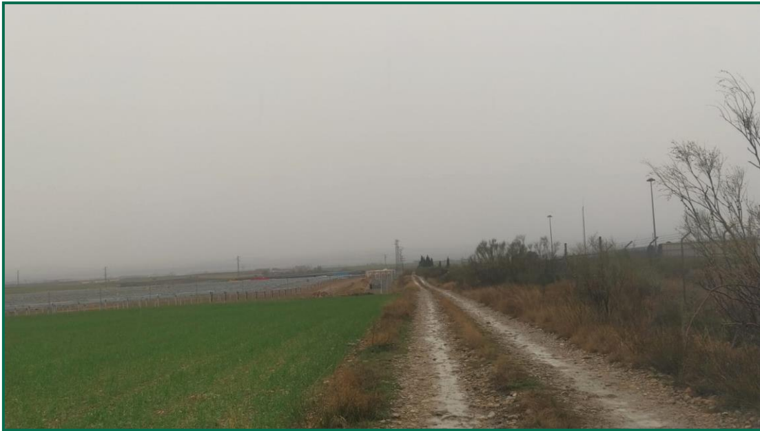
Fotografía 7. Vegetación próxima, que no se altera.