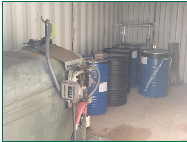
Fotografía 12. Zona de residuos peligrosos.