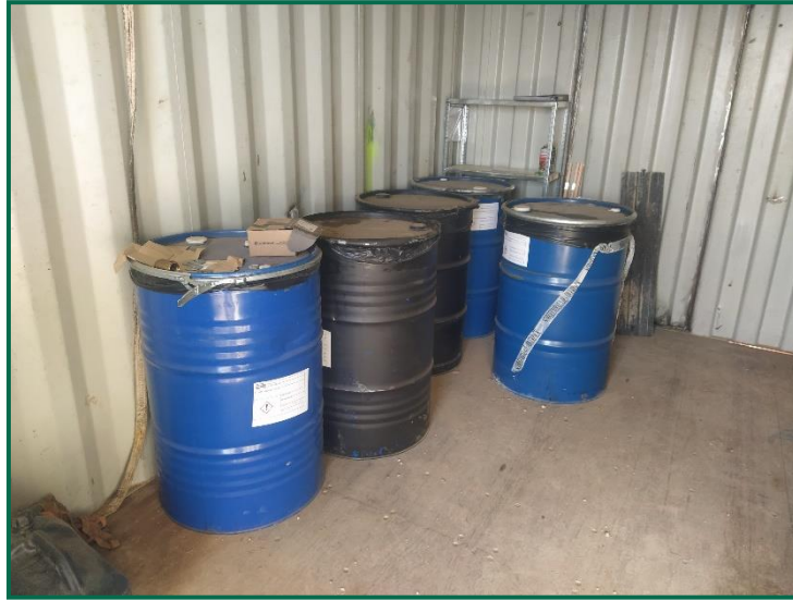
Fotografía 11. Zona de residuos peligrosos.