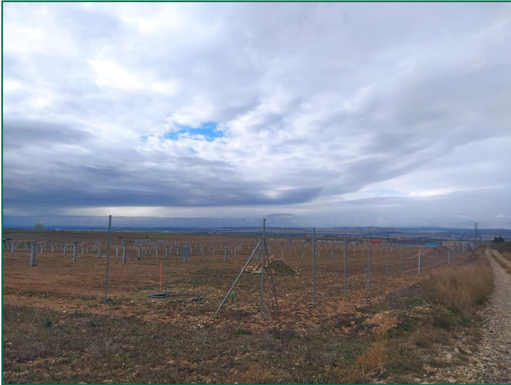
Fotografía 2. Vallado.