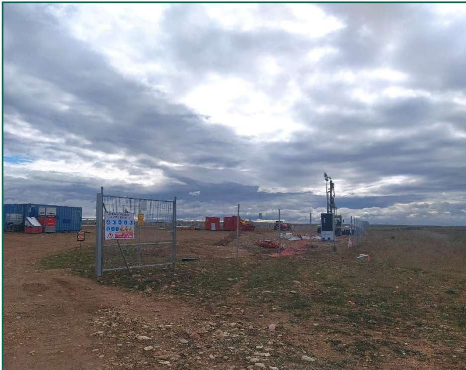
Fotografía 4. Señal de limitación de velocidad.

La velocidad de circulación se restringe a 20 km/h en toda la zona de trabajos.