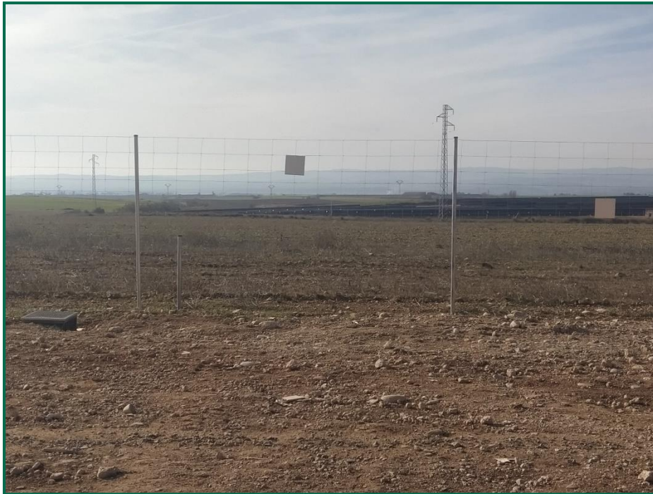
Fotografía 8. Vallado perimetral con pasos de fauna.

Se ha realizado seguimiento de avifauna, anotando los avistamientos durante los recorridos por el entorno de la obra, hasta el momento se han observado pocos vuelos, las aves avistadas este mes han sido cornejas negras ( Corvus corone ) tres busardos ratoneros ( Buteo buteo ) junto a la carretera de acceso que se observa en gran parte de las visitas.