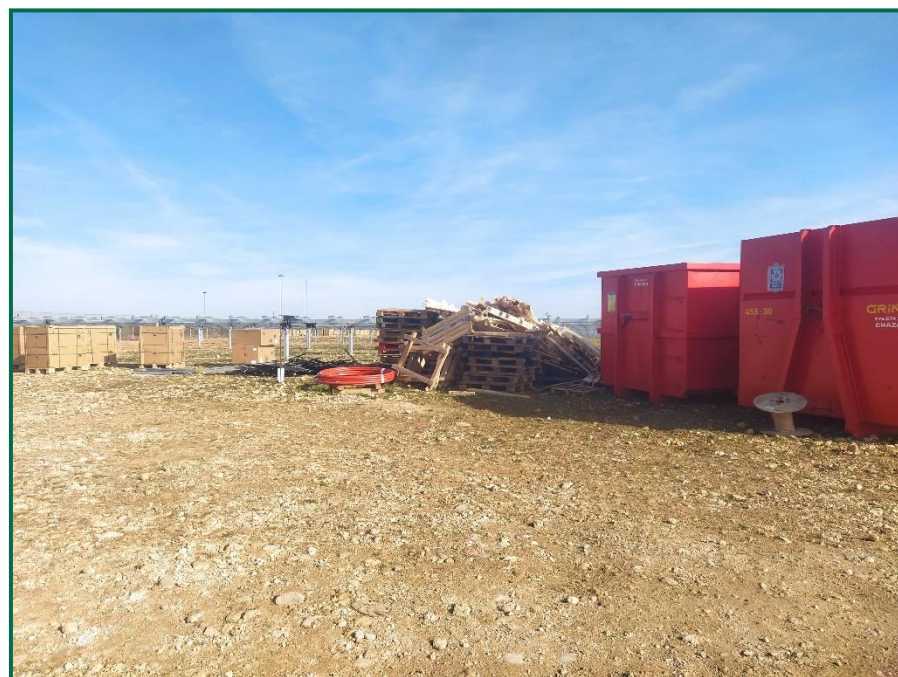
Fotografía 10. Zona de residuos inertes.