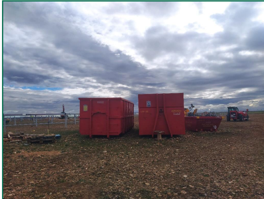
Fotografía 9. Zona de residuos inertes.

Se ha habilitado una zona para el lavado de canaletas de hormigoneras en planta, que cuenta con un plástico para evitar infiltraciones. Por el momento el único hormigón utilizado se ha empleado en la fijación de los postes del vallado y en la base del Centro de transformación.