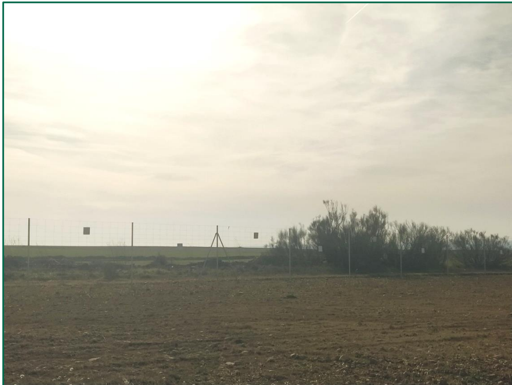
Fotografía 3. Vallado.