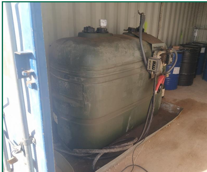
Fotografía 14. Bidón de gasoil sobre bandeja.