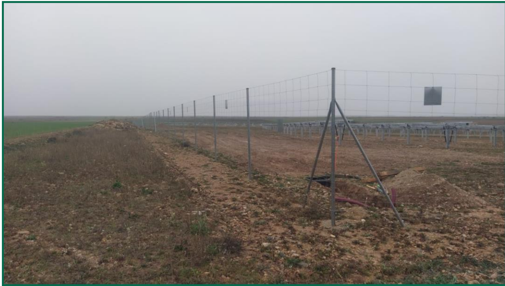
Fotografía 16. Espacio reservado para la pantalla vegetal.