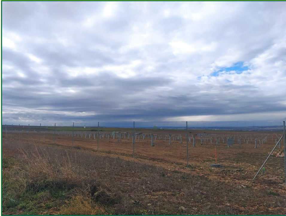
Fotografía 6. Superficie de la planta.