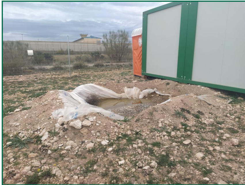
Fotografía 15. Zona para el lavado de canaletas.