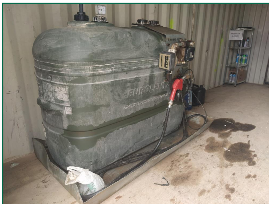
Fotografía 14. Bidón de gasoil sobre bandeja.