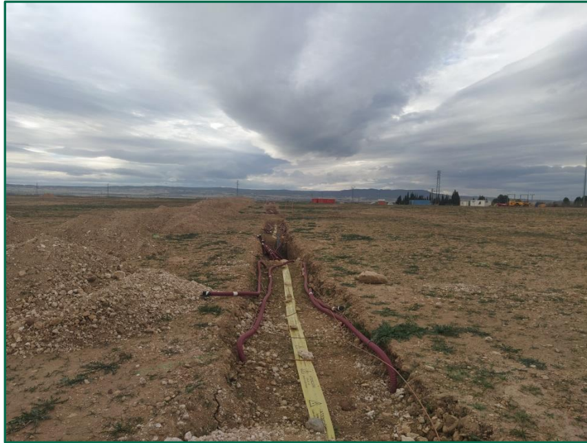
Fotografía 6. Zanjas excavadas.