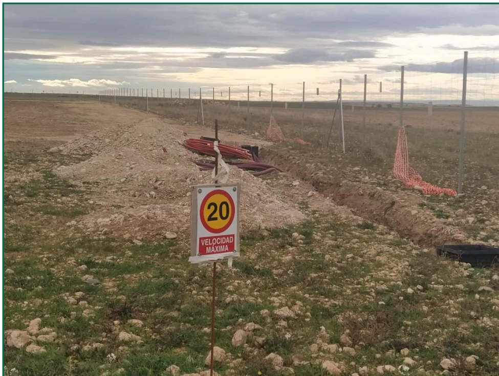
Fotografía 4. Señal de limitación de velocidad.

La velocidad de circulación se restringe a 20 km/h en toda la zona de trabajos.