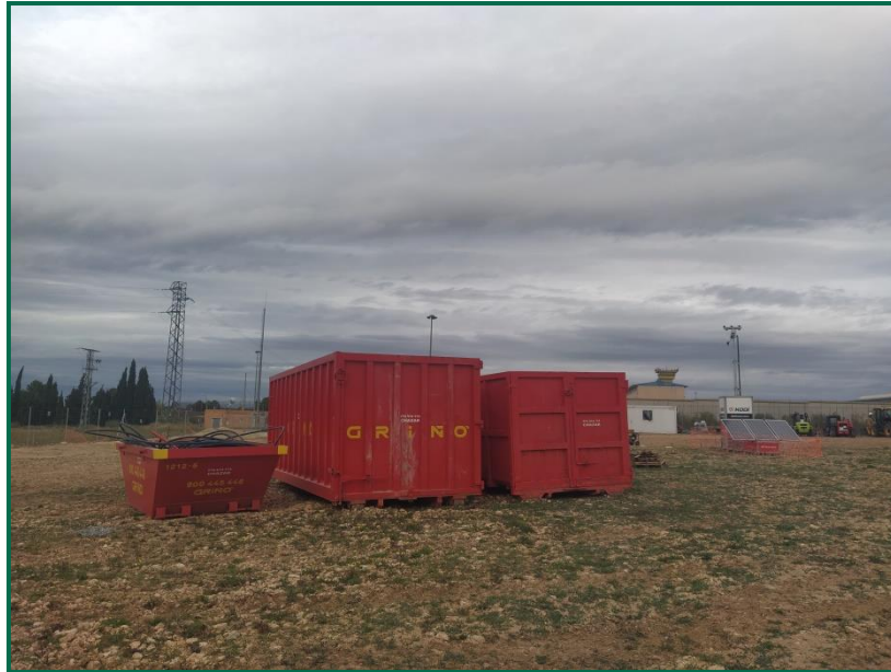
Fotografía 9. Zona de residuos inertes.

Se ha habilitado una zona para el lavado de canaletas de hormigoneras en planta, que cuenta con un plástico para evitar infiltraciones. Por el momento el único hormigón utilizado se ha empleado en la fijación de los postes del vallado.