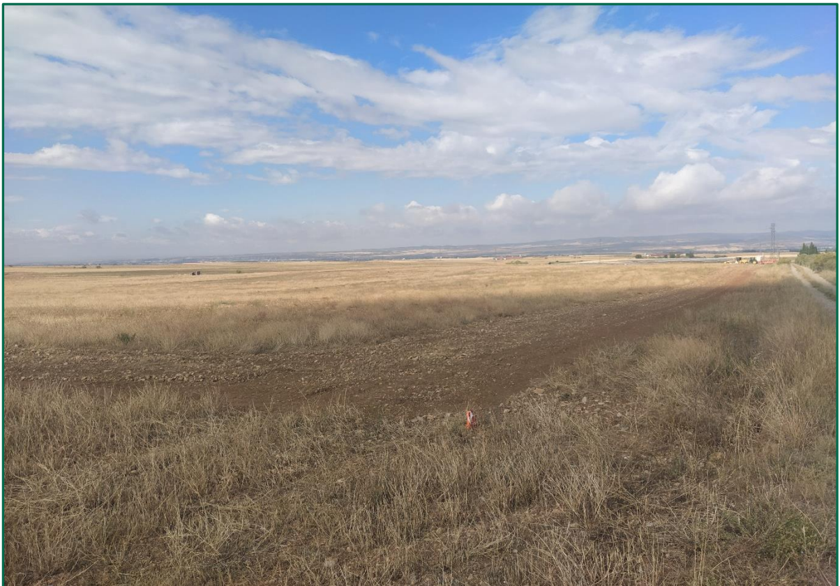
Fotografía 1. Jalonamiento previo.

Posteriormente se coloca el vallado perimetral por lo que la zona de obras queda totalmente delimitada.