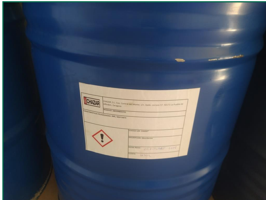
Fotografía 12. Ejemplo de contenedor etiquetado.