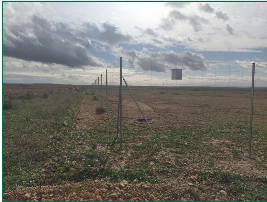
Fotografía 16. Espacio reservado para la pantalla vegetal.