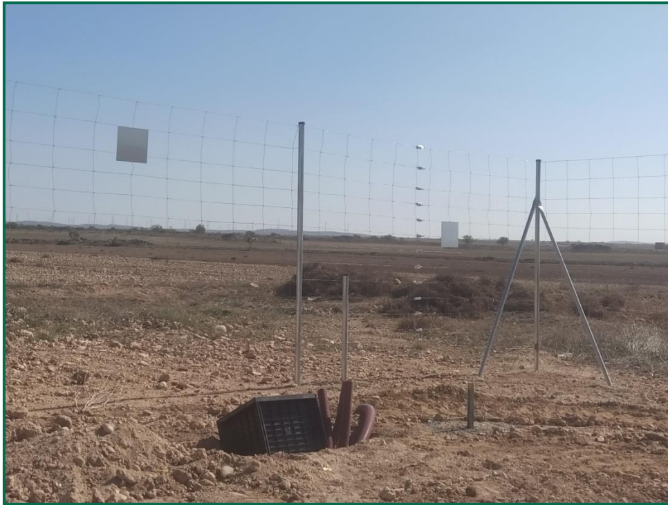
Fotografía 8. Vallado perimetral con pasos de fauna.

Se ha realizado seguimiento de avifauna, anotando los avistamientos durante los recorridos por el entorno de la obra, hasta el momento se han observado pocos vuelos, las aves avistadas este mes han sido dos milanos reales ( Milvus milvus ) junto al centro penitenciario, y un águila real junto a la carretera de acceso que se observa en todas visitas.