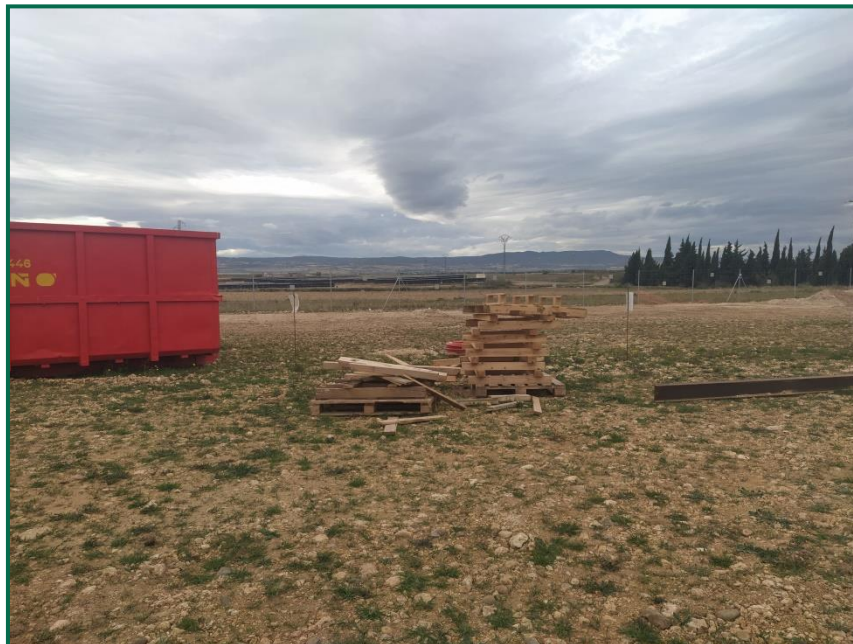
Fotografía 10. Zona para depositar madera.