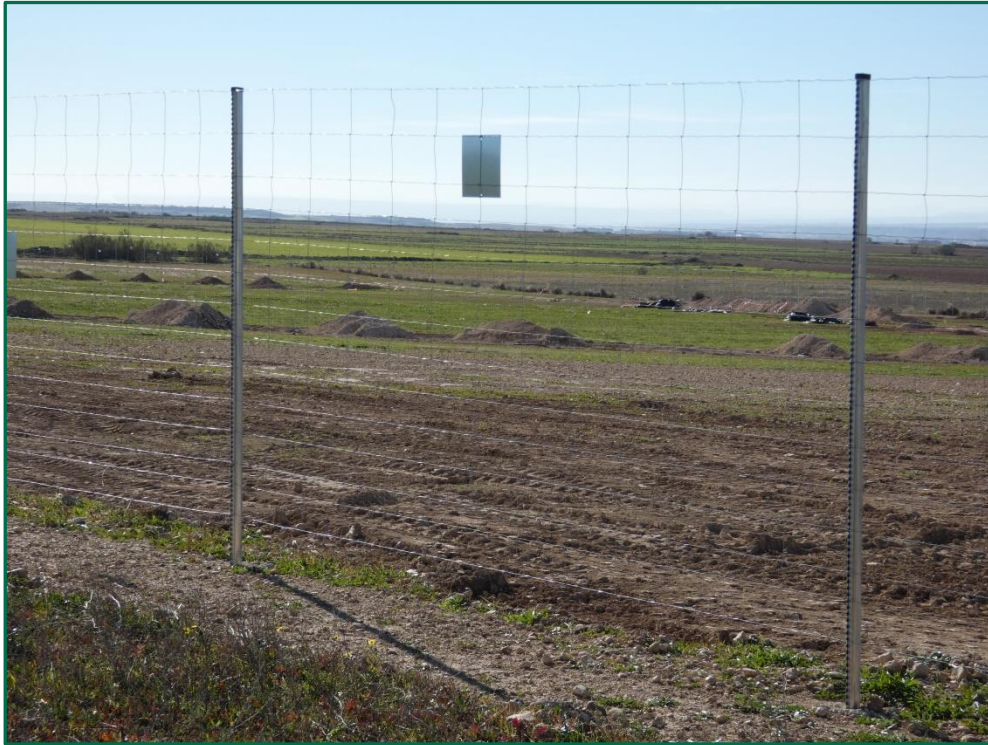
Fotografía 2. Vallado.