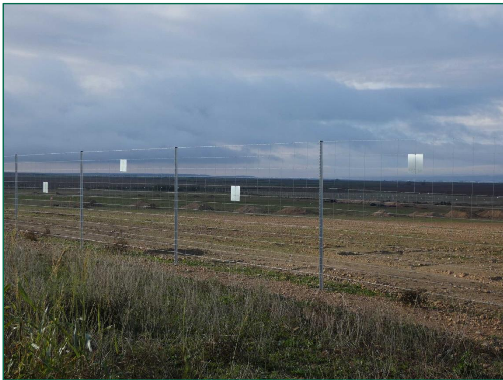
Fotografía 3. Vallado.