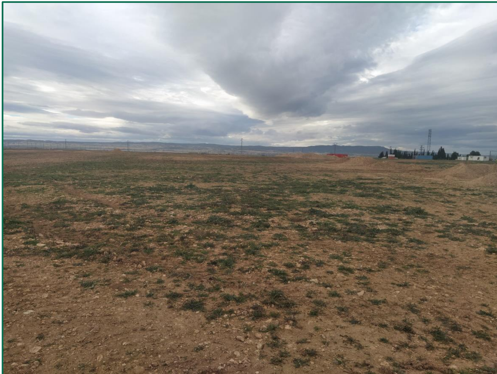
Fotografía 5. Superficie de la planta.

La tierra vegetal retirada durante las obras se acopiará en caballones con el objetivo de conservarla correctamente para su posterior uso en la restauración, por el momento no se ha extraído nada, excepto en la excavación de zanjas, debido a que el terreno es muy llano y no es necesario nivelarlo, únicamente se ha homogeneizado la superficie mediante el uso de traíllas y se han retirado las piedras de mayor tamaño. La tierra extraída en las zanjas se volverá a depositar para rellenar estas una vez pasado el cable.