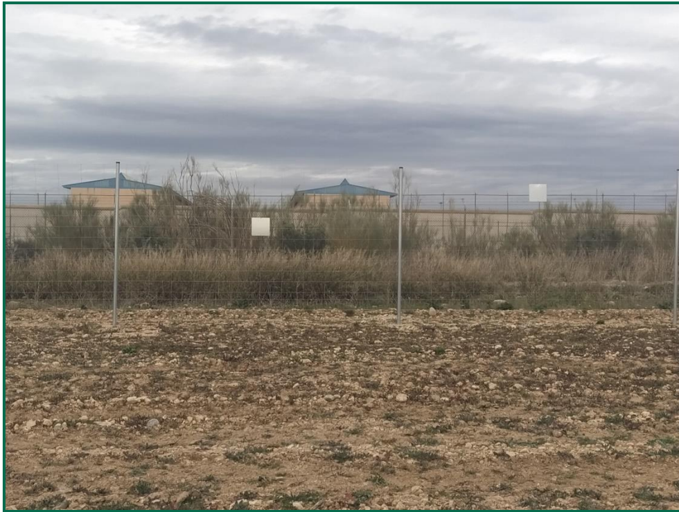
Fotografía 7. Vegetación próxima, que no se altera.