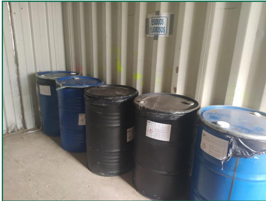
Fotografía 11. Zona de residuos peligrosos.