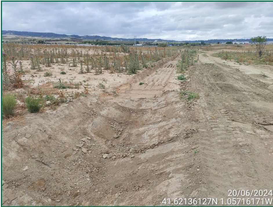
Fotografía 6. Cuneta del barranco.