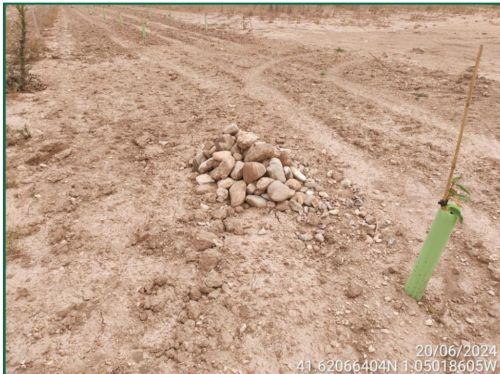
Fotografía 14. Majano para reptiles.