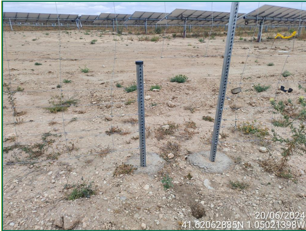
Fotografía 13. Espaciado cinegético.