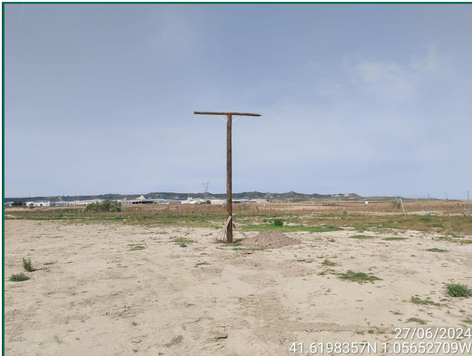
Fotografía 15. Posaderos para rapaces.

Se ha realizado seguimiento de avifauna durante el proceso de la obra, observándose las siguientes especies: busardo ratonero ( Buteo buteo ), corneja negra ( Corvus corone ), cuervo grande ( Corvus corax ), chova piquirroja ( Pyrrhocorax pyrrhocorax ), aguilucho lagunero ( Circus aeruginosus ), milano negro ( Milvus migrans ), buitre leonado ( Gyps fulvus ), culebrera europea ( Circaetus gallicus ), gaviota patiamarilla ( Larus michaellis ), anade azulón ( Anas platyrhynchos ), pato colorado ( Netta rufina ), garza real ( Ardea cinerea ), zampullín común ( Tachybaptus ruficollis ). También otras especies como estornino negro ( Sturnus unicolor ), abubilla común ( Upupa epops ), urraca común ( Pica pica ) y diversos alaudidos. Por otro lado se ha observado la presencia de un primillar cercano que se encuentra a más de 3 km de la obra.