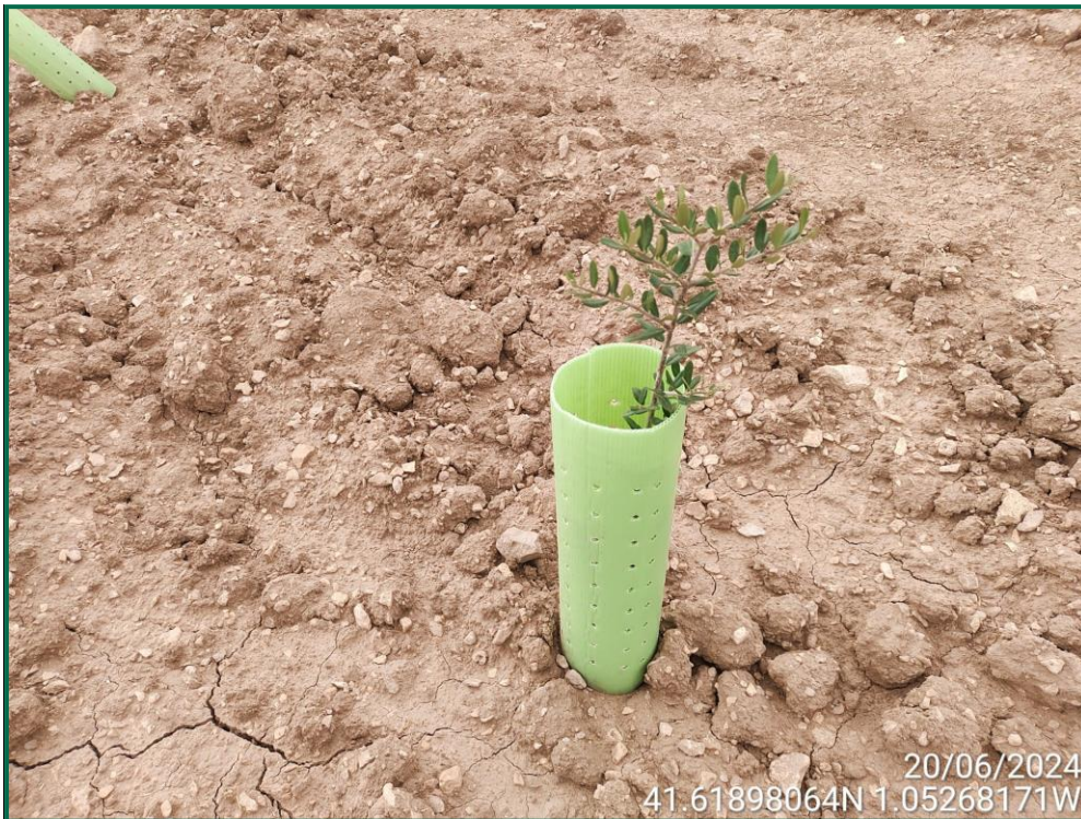
Fotografía 24. Olivo.