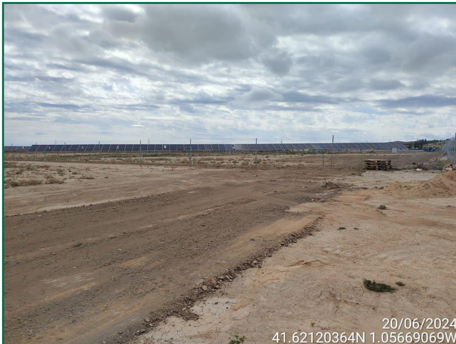
Fotografía 7. Tapado de zanjas.