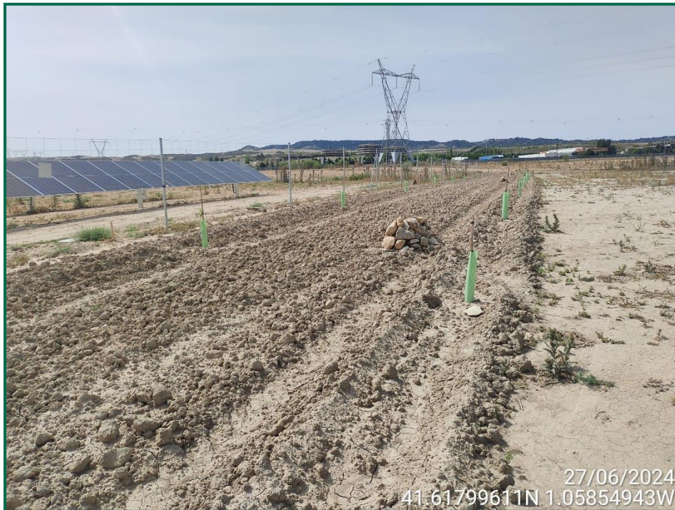
Fotografía 8. Arado de la pantalla vegetal.