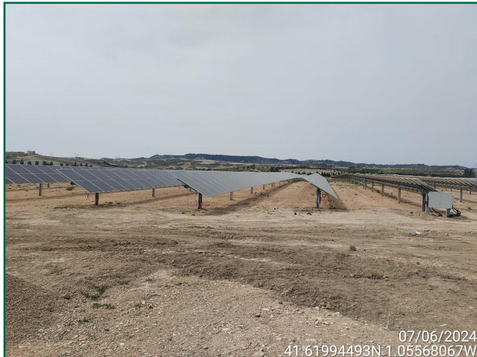
Fotografía 4. Superficie de la planta.