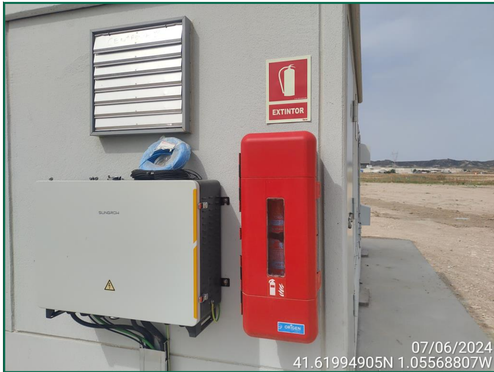
Fotografía 28. Extintor en la caseta del inversor.