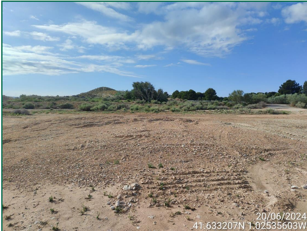
Fotografía 29. Final de la línea de evacuación y vegetación natural.