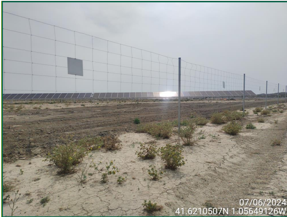
Fotografía 12. Placas anticolidión.

Durante este mes se han colocado en distintas zonas postes que sirven como posadero para rapaces de pequeño y mediano tamaño. Se han recibido los hoteles de insectos que serán colocados próximamente.