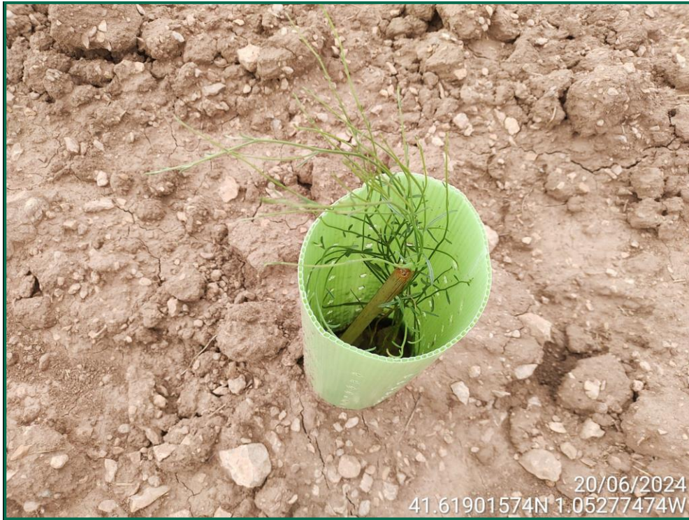
Fotografía 25. Retama.