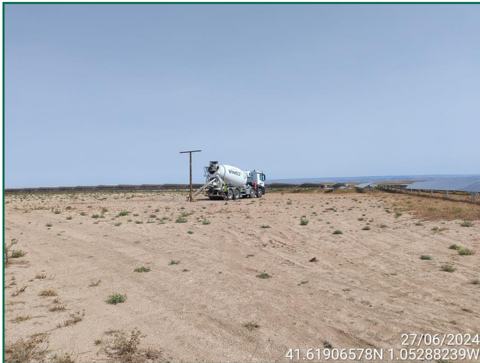
Fotografía 3. Hormigonera colocando el posadero.