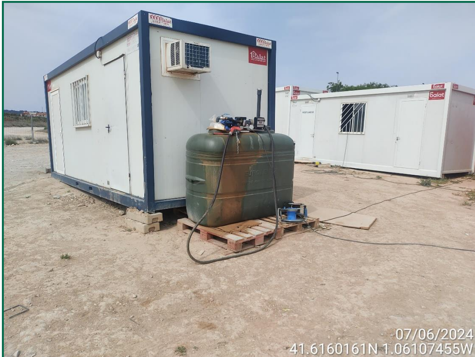
Fotografía 19. Depósito de combustible.