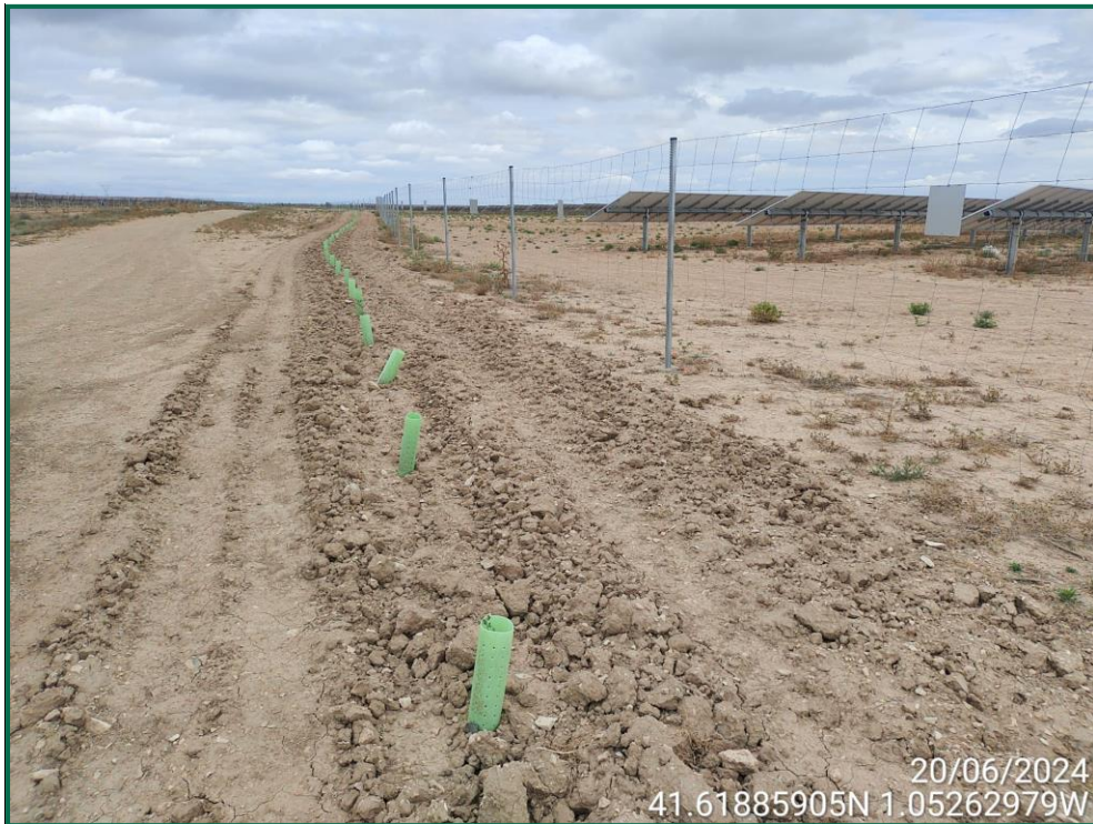
Fotografía 23. Plantación de olivos, retamas y romeros.