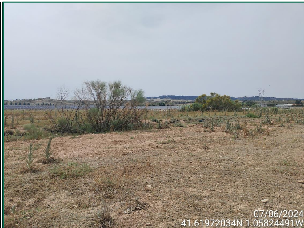
Fotografía 10. Vegetación natural.

Durante las visitas semanales a obra en el mes en curso se comprueba que la ocupación de zonas de vegetación se limita a lo aprobado en el proyecto. Se verifica también que la maquinaria circula únicamente por los viales habilitados para tal fin. Desde el inicio de las obras se ha planificado la ejecución de una franja vegetal de 8 m de anchura en torno al futuro vallado perimetral.