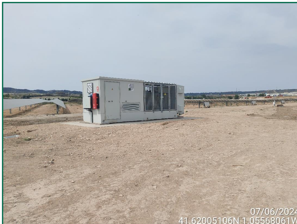
Fotografía 9. Estructura del inversor.