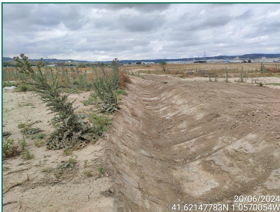
Fotografía 5. Cuneta del barranco.

Se ha excavado una cuneta en la zona de barranco donde se había habilitado un paso temporal para los vehículos, en la cual se había añadido tierra anteriormente.