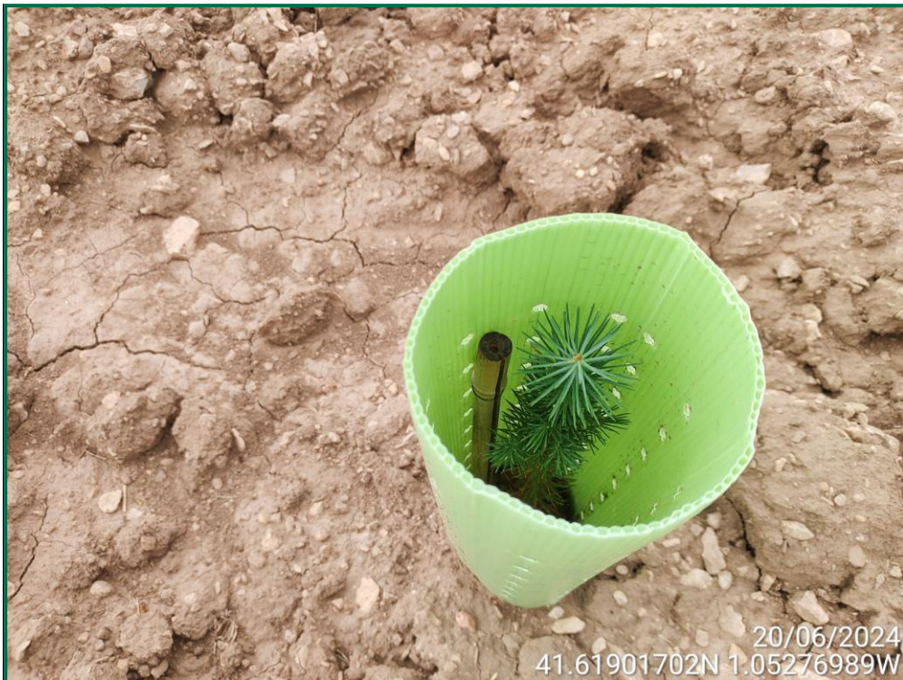
Fotografía 26. Romero y tutor de bambú.