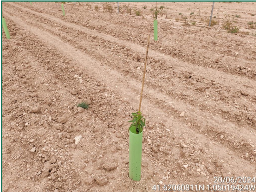
Fotografía 22. Almendro.

En los lugares donde no se puede realizar una pantalla cumpliendo con los retranqueos previstos en la normativa respecto a caminos u otros, se ha reducido la anchura excepcionalmente y en esas zonas se ha realizado la plantación de otras plantas que permiten la plantación más próxima unas de otras como retama, olivo y romero.