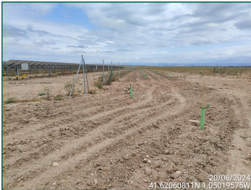
Fotografía 21. Plantación de almendros.

Se ha realizado una pantalla vegetal en todo el perímetro a excepción de la zona del perímetro que colinda con zonas urbanizadas. Se han plantado mayoritariamente almendros al tresbolillo y la separación recomendada para su correcto crecimiento.