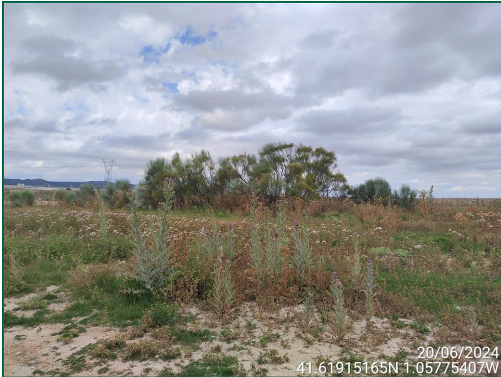
Fotografía 11. Vegetación natural.