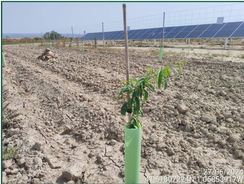
Fotografía 27. Tubo protector y tutor.

Para garantizar su crecimiento se ha realizado y seguirá realizando riegos de apoyo. Además, todas las plantas se han colocado con tutor para facilitar el buen crecimiento y han sido provistas de un tubo protector de 30cm de altura tutor de caña de bambú.