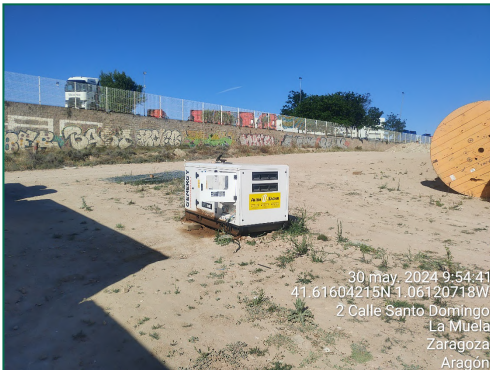
Fotografía 17. Grupo electrógeno.