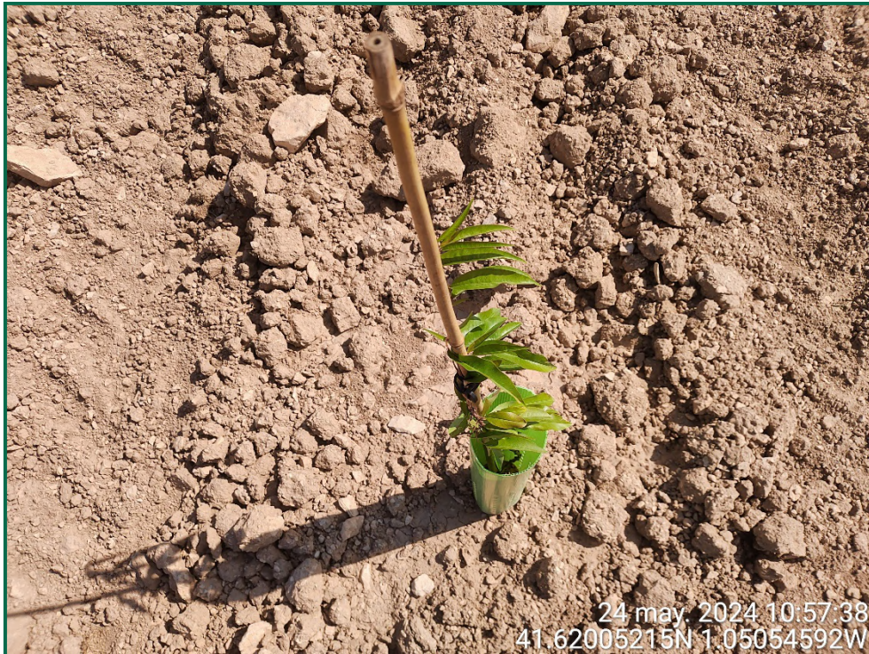
Fotografía 21. Almendro.

En los lugares donde no se puede realizar una pantalla cumpliendo con los retranqueos previstos en la normativa respecto a caminos u otros, se ha reducido la anchura excepcionalmente y en esas zonas se ha realizado la plantación de otras plantas que permiten la plantación más próxima unas de otras como retama, olivo y romero.