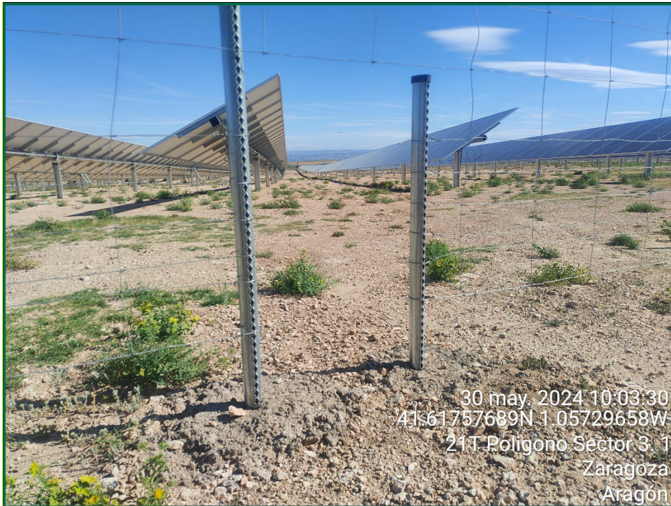
Fotografía 10. Espaciado cinegético.