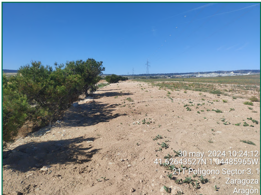
Fotografía 29. Vegetación natural y tapado de zanjas.