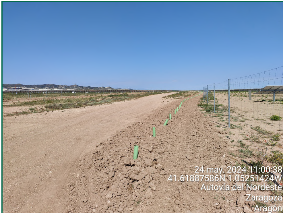
Fotografía 22. Plantación de olivos, retamas y romeros.