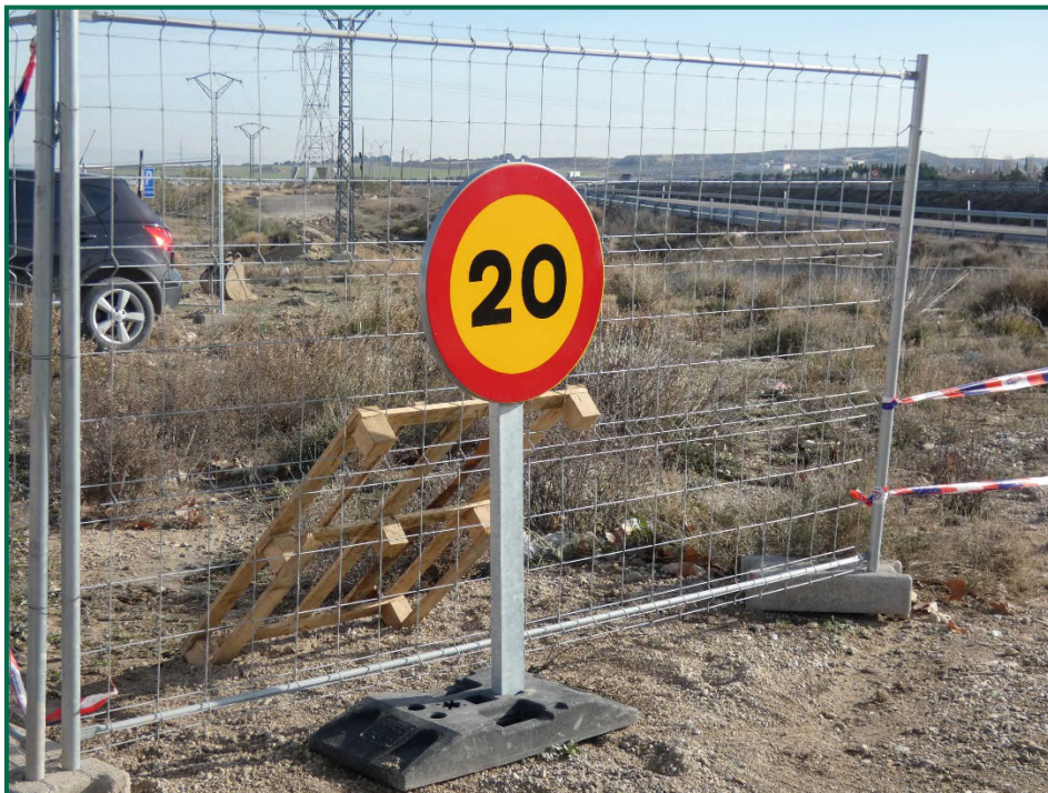
Fotografía 2. Señalización de velocidad.

Durante las visitas a obra no se constata afección por emisión de polvo significativa durante los trabajos. Se prevé humedecer los caminos cuando las circunstancias lo requieran con la presencia de una cuba esparciendo agua por el terreno.