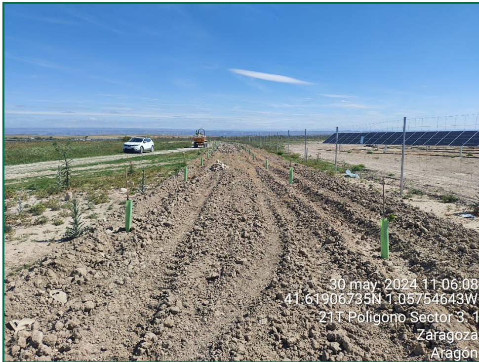
Fotografía 12. Colocación de majanos.

Se ha realizado seguimiento de avifauna durante el proceso de la obra, observándose las siguientes especies: busardo ratonero ( Buteo buteo ), corneja negra ( Corvus corone ) cuervo grande ( Corvus corax ), chova piquirroja ( Pyrrhocorax pyrrhocorax ), aguilucho lagunero ( Circus aeruginosus ), milano negro ( Milvus migrans ), buitre leonado ( Gyps fulvus ), culebrera europea ( Circaetus gallicus ), gaviota patiamarilla ( Larus michaellis ), anade azulón ( Anas platyrhynchos ), pato colorado ( Netta rufina ) y garza real ( Ardea cinerea ). Además, otras especies como estornino negro ( Sturnus unicolor ), abubilla común ( Upupa epops ) o urraca común ( Pica pica ) entre otras.