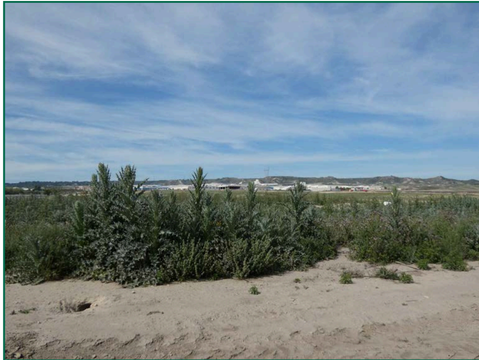
Fotografía 7. Vegetación natural.