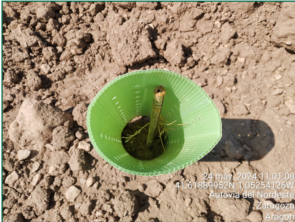
Fotografía 24. Retama.