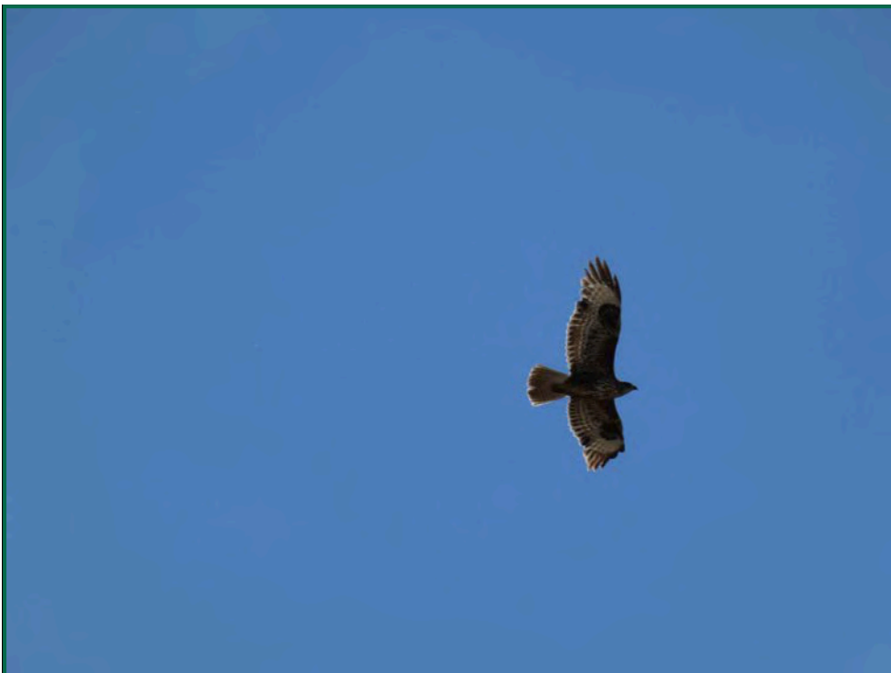
Fotografía 14. Busardo ratonero ( Buteo buteo ).