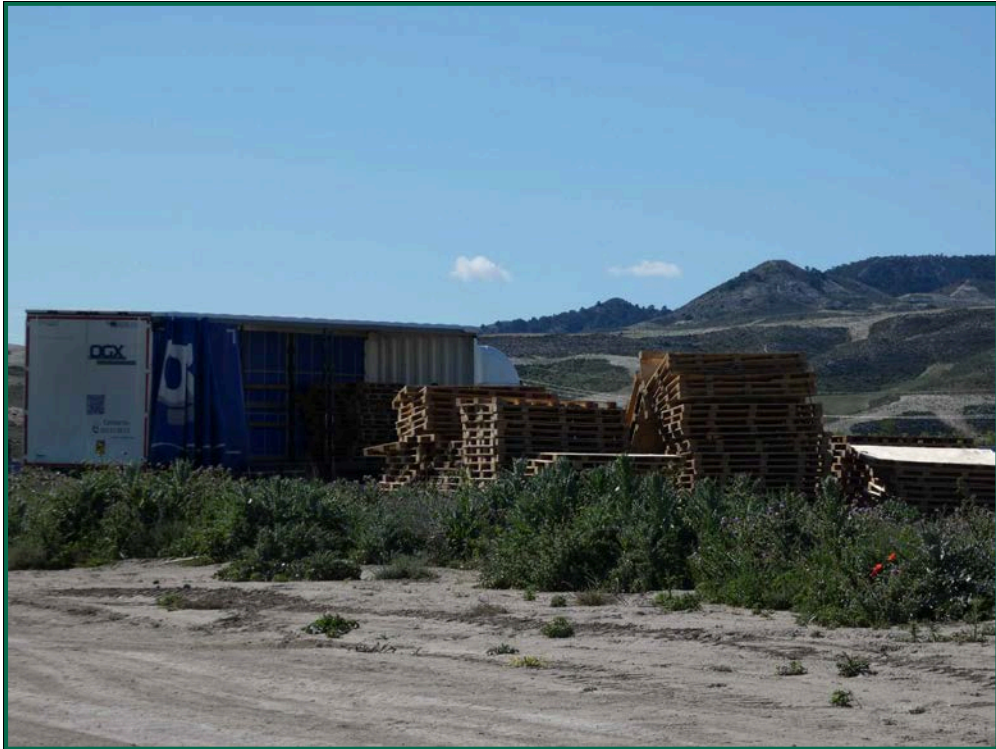
Fotografía 18. Recogida de palets.