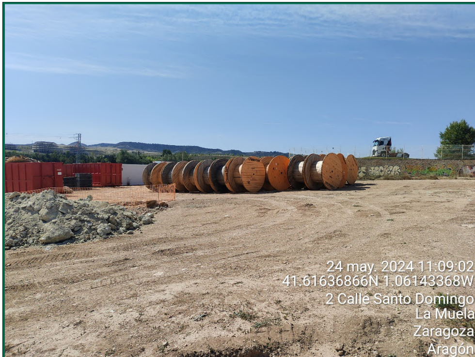
Fotografía 19. Recogida de bobinas utilizadas.