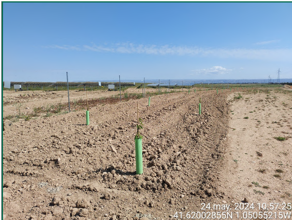
Fotografía 20. Plantación de almendros.

Se ha realizado una pantalla vegetal en todo el perímetro a excepción de la zona del perímetro que colinda con zonas urbanizadas. Se han plantado mayoritariamente almendros al tresbolillo y la separación recomendada para su correcto crecimiento.