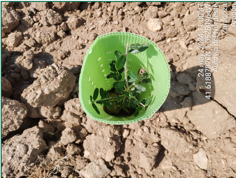
Fotografía 23. Olivo.