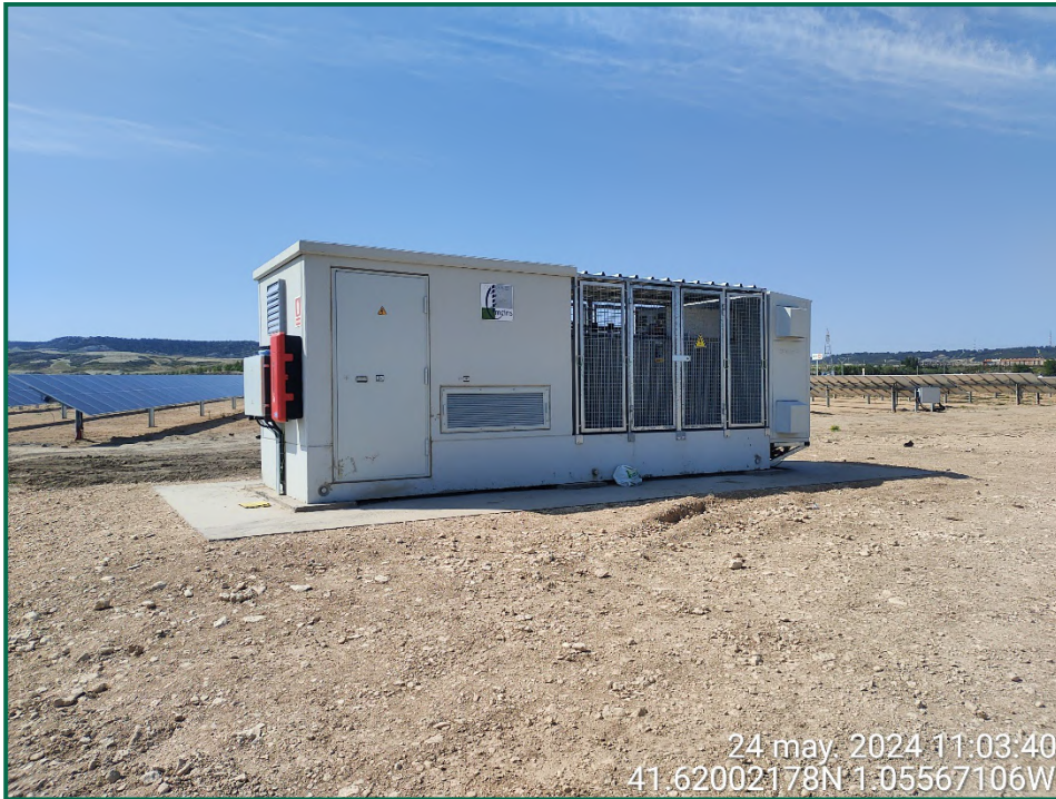
Fotografía 6. Estructura del inversor.