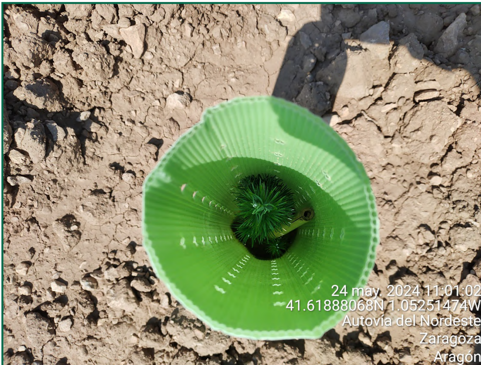
Fotografía 25. Romero y tutor de bambú.