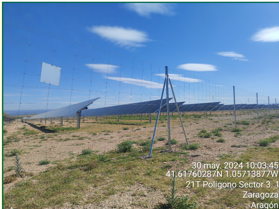
Fotografía 9. Placas anticolisión.

Además se ha comenzado a colocar majanos de piedra entre la pantalla vegetal plantada para que puedan ser ocupados principalmente por reptiles. Estos majanos son de aproximadamente un metro de largo y están formados por rocas de gran tamaño.