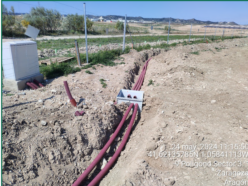
Fotografía 5. Zanjas.