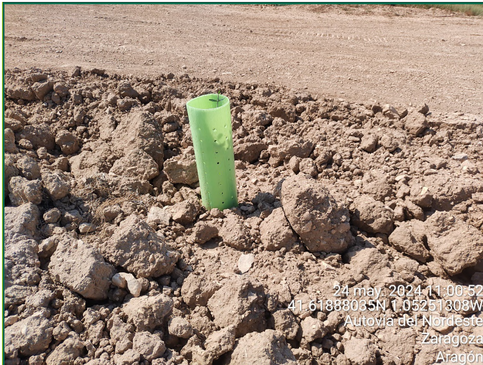
Fotografía 26. Tubo protector.

Para garantizar su crecimiento se ha realizado y seguirá realizando riegos de apoyo. Además, todas las plantas se han colocado con tutor para facilitar el buen crecimiento y han sido provistas de un tubo protector de 30cm de altura tutor de caña de bambú.