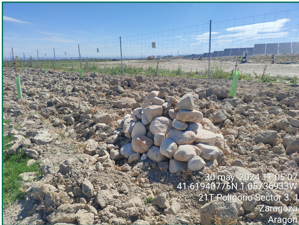
Fotografía 11. Majano para reptiles.