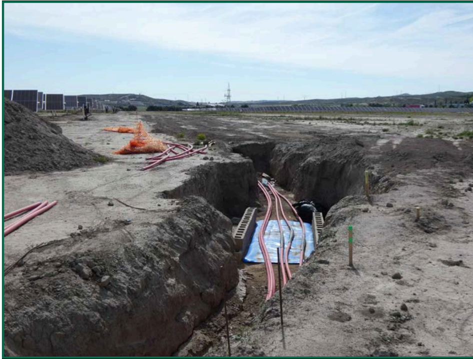
Fotografía 4. Acopios de tierra, zanjas y colocación de cableado.