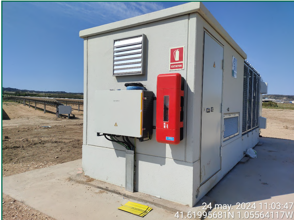
Fotografía 27. Extintor en la caseta del inversor.