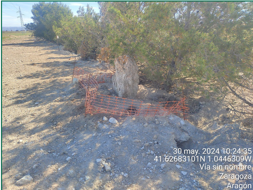
Fotografía 28. Balizamiento de madrigueras.