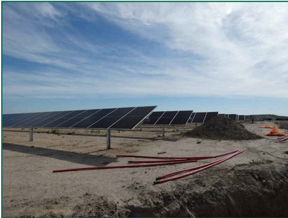
Fotografía 1. Superficie de la obra y placas fotovoltaicas.

No se realiza el balizamiento de todo el perímetro de la obra ya que se generaría una gran cantidad de residuos de malla de obra o cinta que tiende a romperse y dispersarse por toda la zona. Sí se realiza un jalonamiento del perímetro mediante banderines y también se realiza un balizamiento del gasoducto y oleoducto. La Dirección Ambiental realiza un control visual continuado para comprobar que no se sobrepasan los límites de la zona de ocupación.