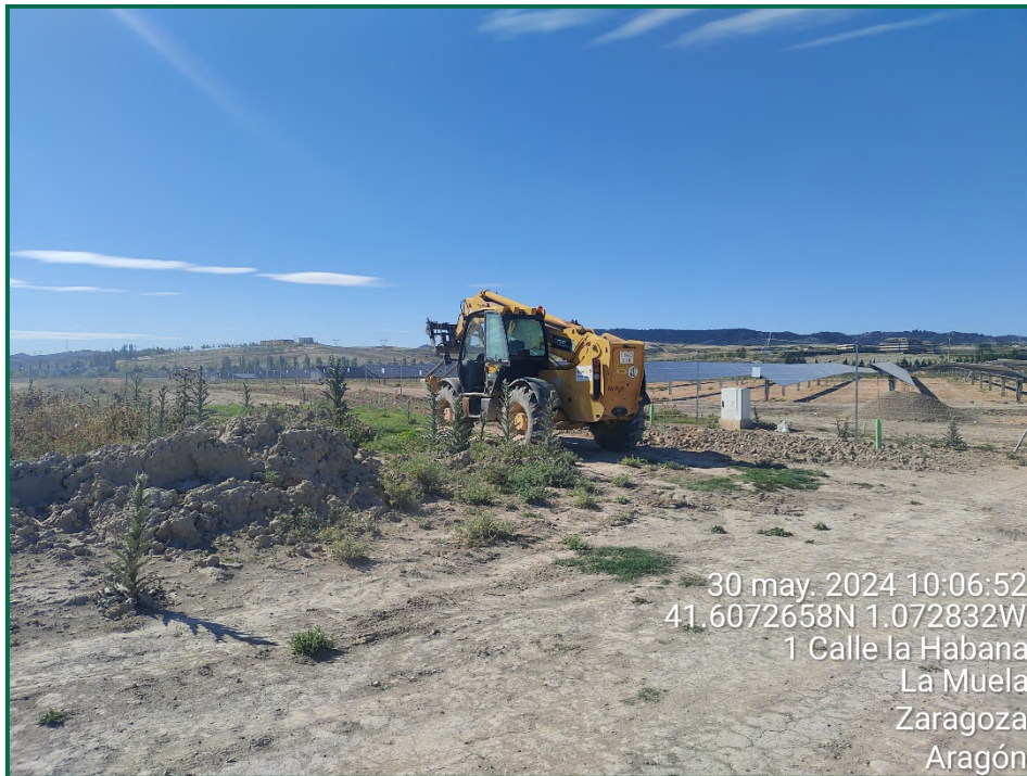
Fotografía 3. Maquinaria de obra.