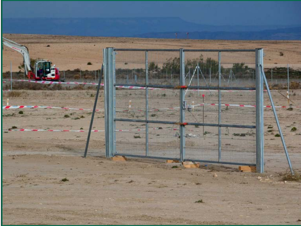
Fotografía 5. Puerta de acceso.

Se ha realizado seguimiento de avifauna durante el proceso de la obra, observándose las siguientes especies: milano real ( Milvus milvus ), busardo ratonero ( Buteo buteo ), corneja negra ( Corvus corone ) cuervo grande ( Corvus corax ), perdiz roja ( Alectoris rufa ), y otras especies como estornino negro ( Sturnus unicolor ) o urraca común ( Pica pica ) entre otras.