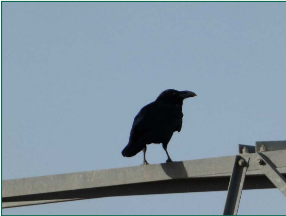
Fotografía 6. Cuervo grande ( Corvus corax ).