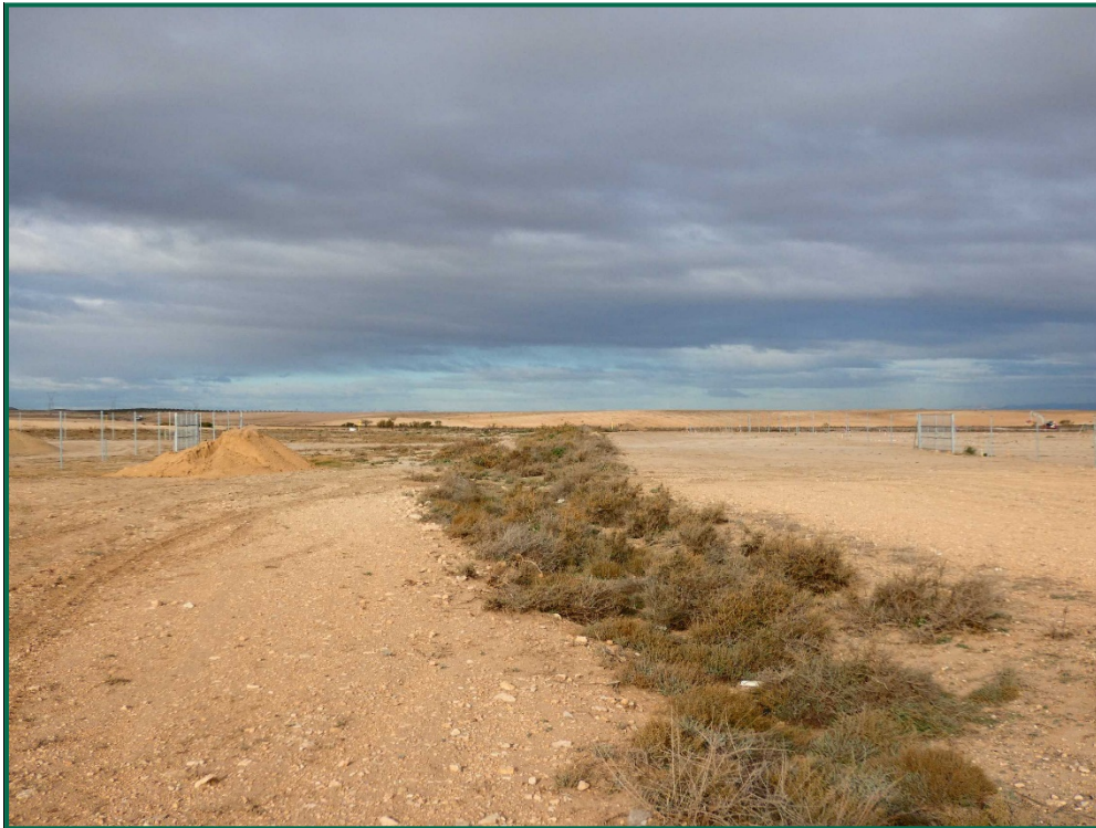
Foto 3. Franja vegetal.