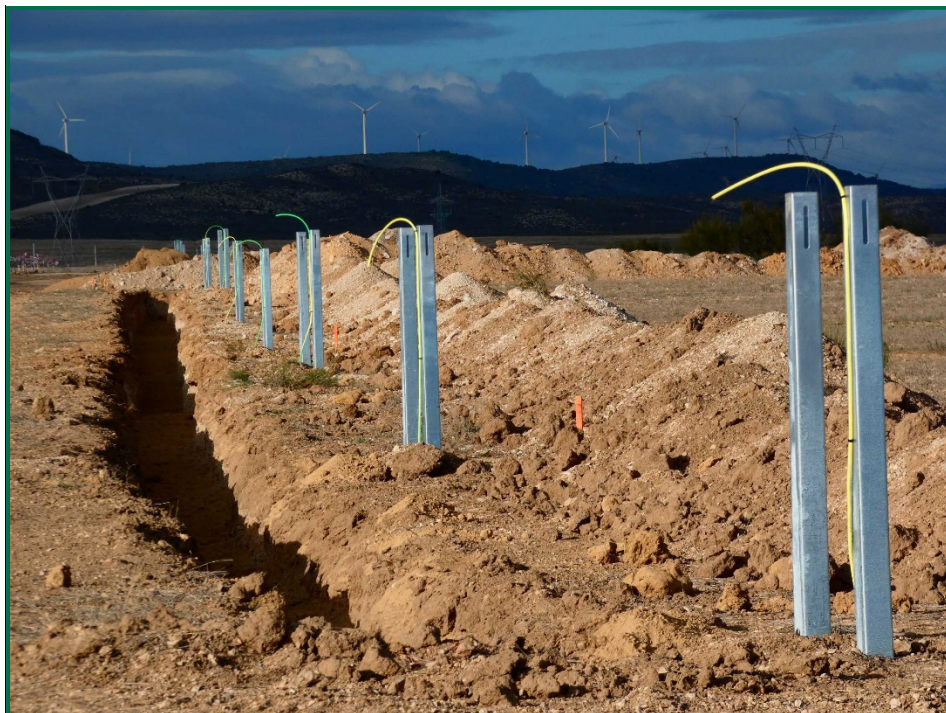
Fotografía 3. Acopios de tierra, zanjas y postes de los inversores.