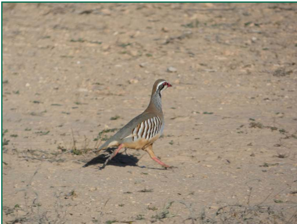
Fotografía 7. Perdiz roja ( Alectoris rufa ).