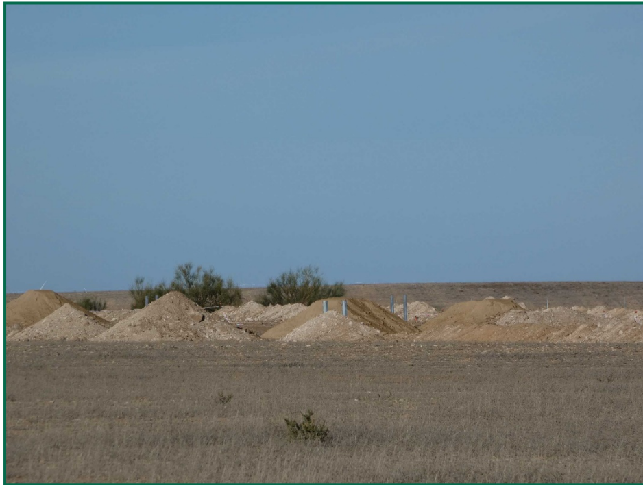
Fotografía 2. Acopios de tierra.