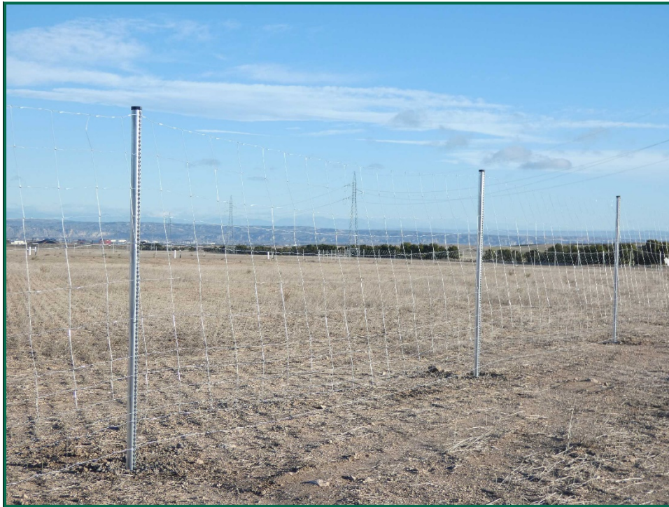
Fotografía 4. Vallado perimetral.