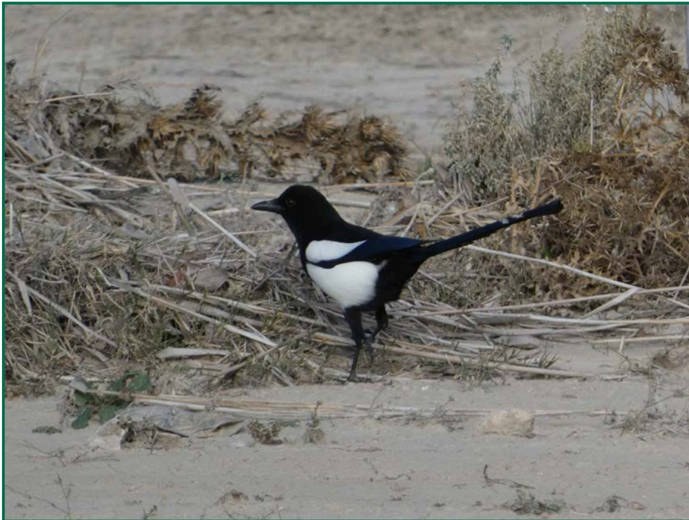
Fotografía 9. Urraca común ( Pica pica ).