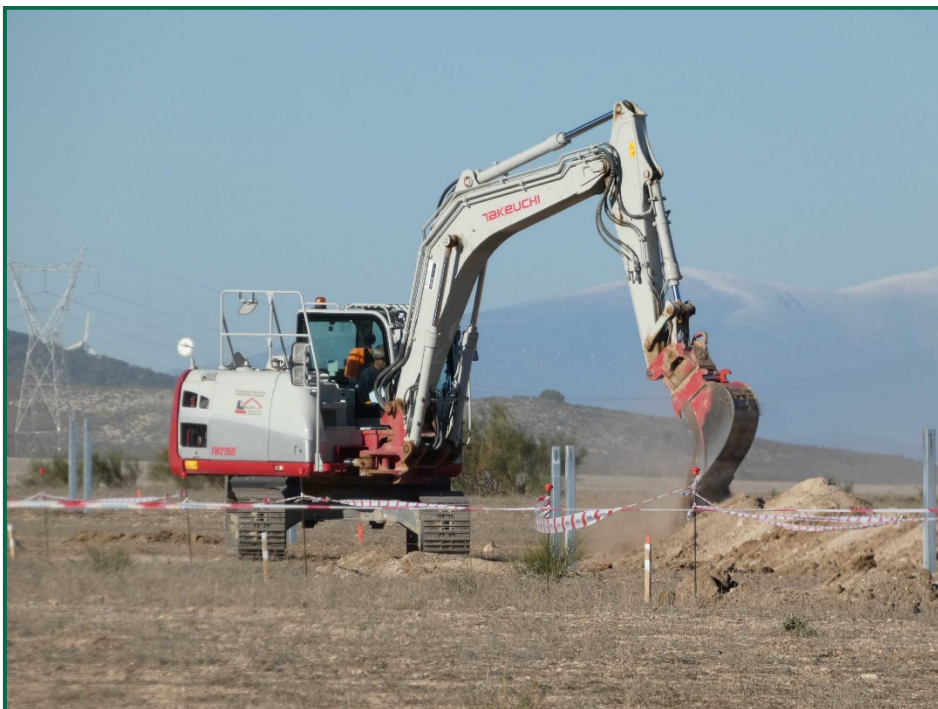
Fotografía 5. Escavadora haciendo zanjas.