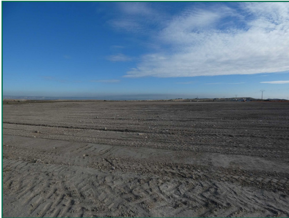
Fotografía 4. Allanado del terreno.