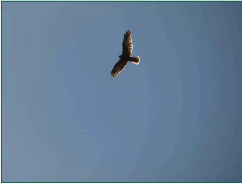
Fotografía 11. Busardo ratonero ( Buteo buteo ).