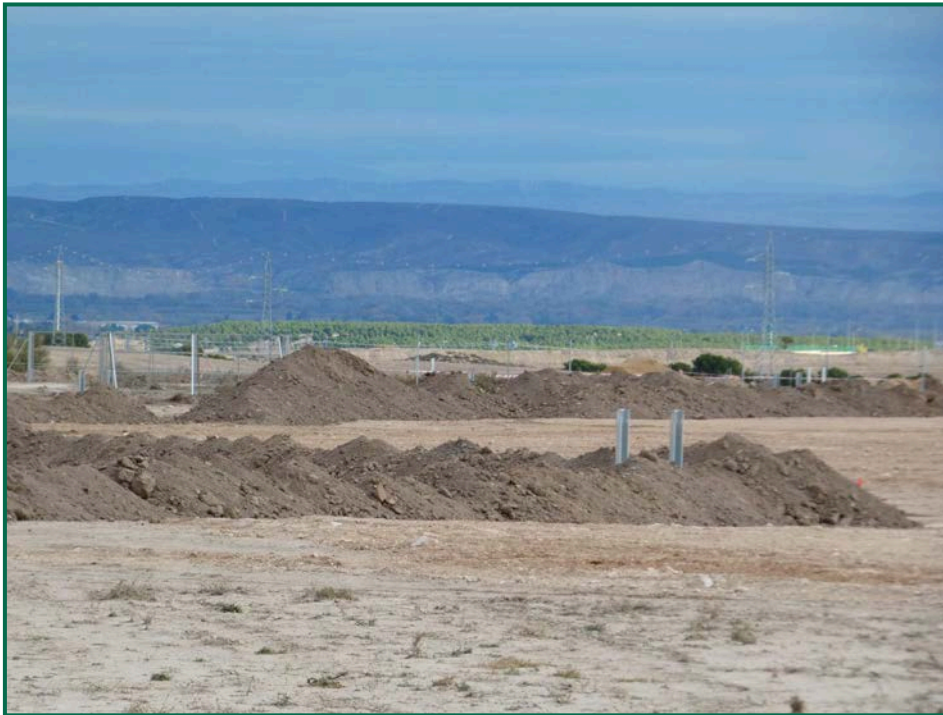
Fotografía 6. Acopios de tierra, zanjas y postes de los inversores.