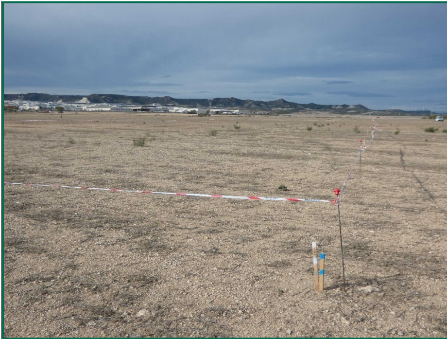
Fotografía 2. Balizamiento del oleoducto.