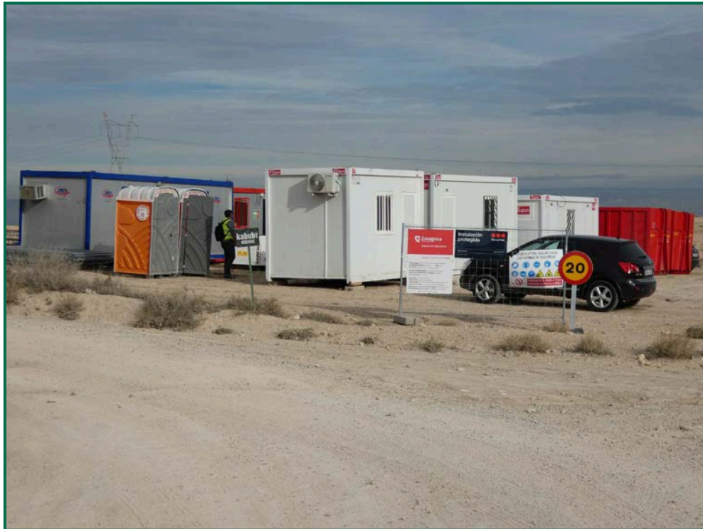
Fotografía 14. Vestuarios, servicios y contenedores de residuos.