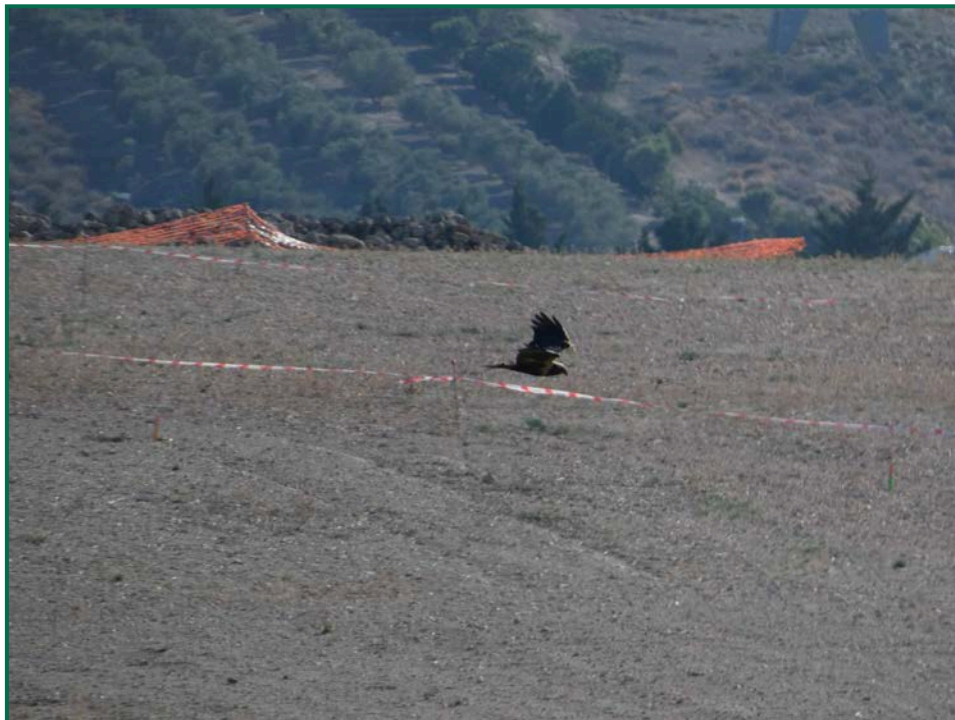
Fotografía 12. Aguilucho lagunero ( Circus aeruginosus ).