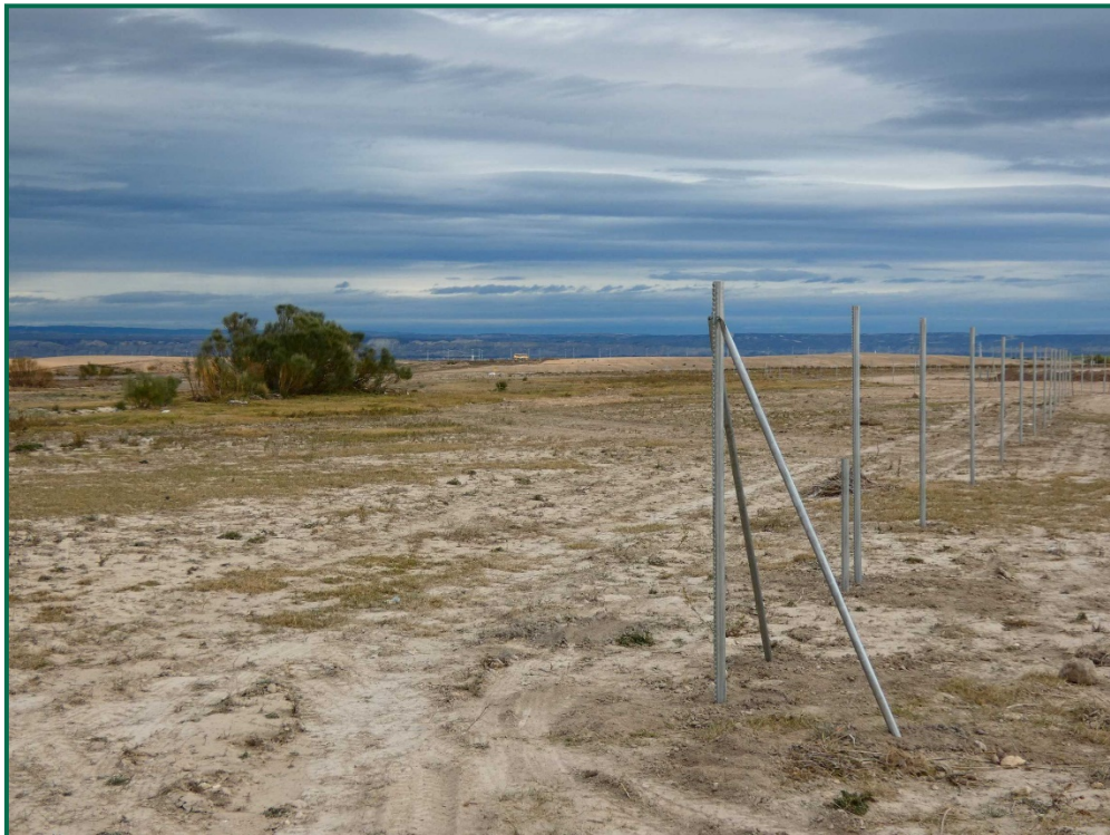
Foto 3. Vegetación natural.

Durante las visitas a obra se comprueba que la ocupación de zonas de vegetación se limita a lo aprobado en el proyecto. Se verifica también que la maquinaria circula únicamente por los viales habilitados para tal fin. Desde el inicio de las obras se ha planificado la ejecución de una franja vegetal de 8 m de anchura en torno al futuro vallado perimetral.