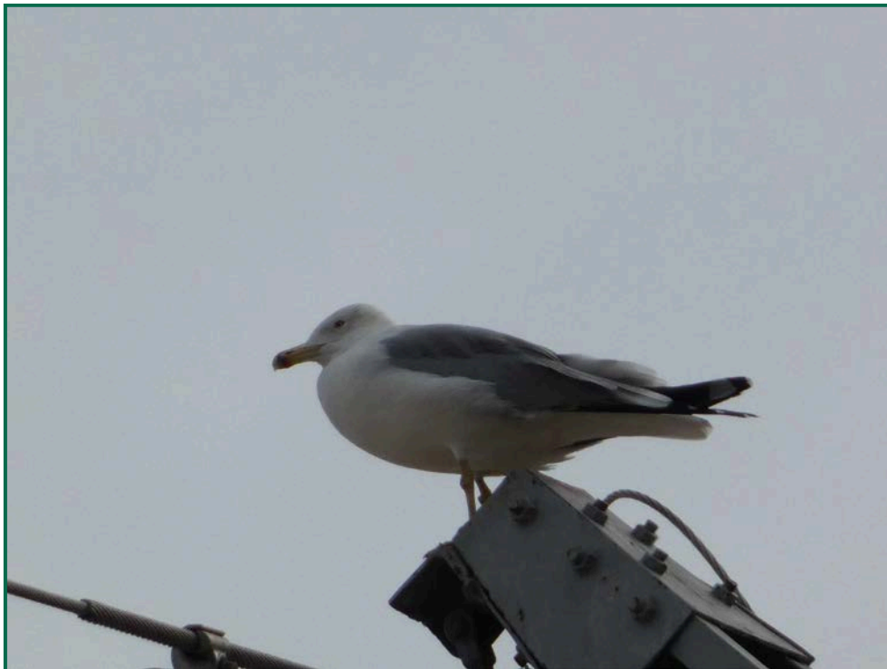
Fotografía 10. Gaviota patiamarilla ( Larus michaellis ).