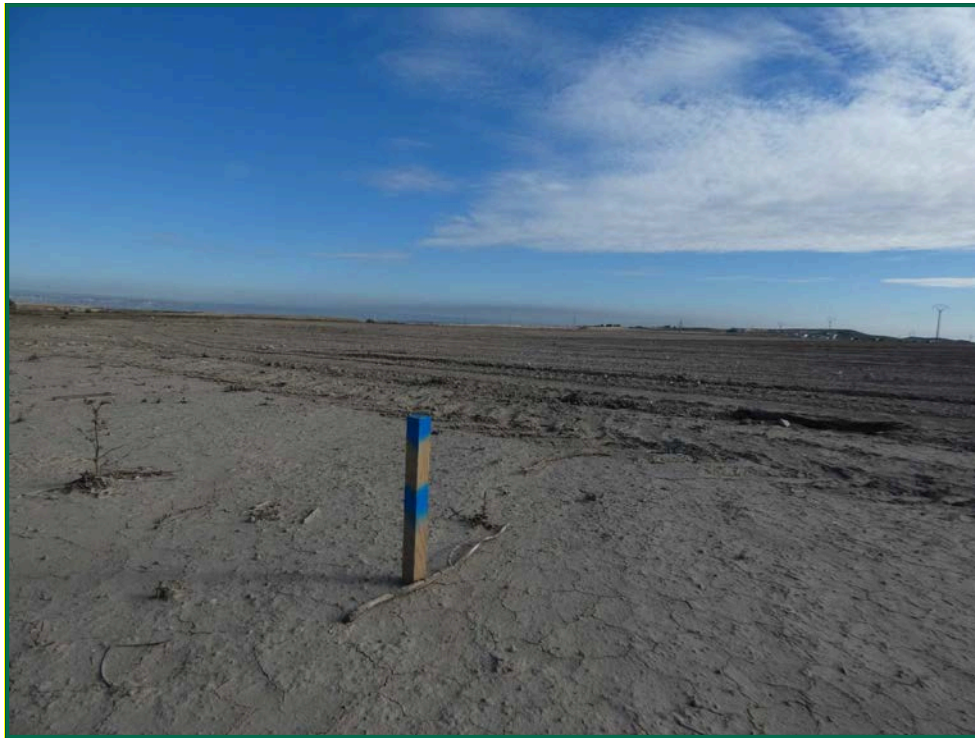
Fotografía 1. Jalonamiento.

No se realiza el balizamiento de todo el perímetro de la obra ya que se generaría una gran cantidad de residuos de malla de obra o cinta que tiende a romperse y dispersarse por toda la zona. Sí se realiza un jalonamiento del perímetro mediante banderines y también se realiza un balizamiento del gasoducto y oleoducto. La Dirección Ambiental realiza un control visual continuado para comprobar que no se sobrepasan los límites de la zona de ocupación.