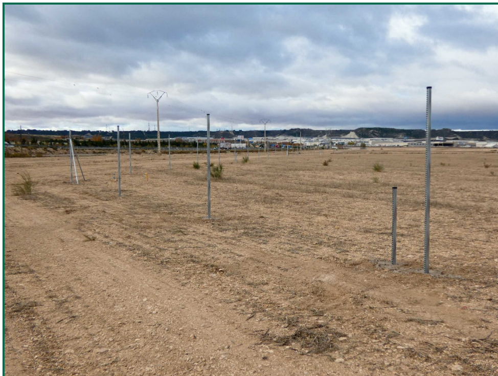
Fotografía 8. Postes para el vallado.

El vallado perimetral, el cual se han colocando los postes, se instalará utilizando malla cinégetica y dejando un espacio de al menos 20 cm desde el suelo, así como las placas anticolidión que se instalarán colocando al menos un apor vano entre postes a diferentes alturas.