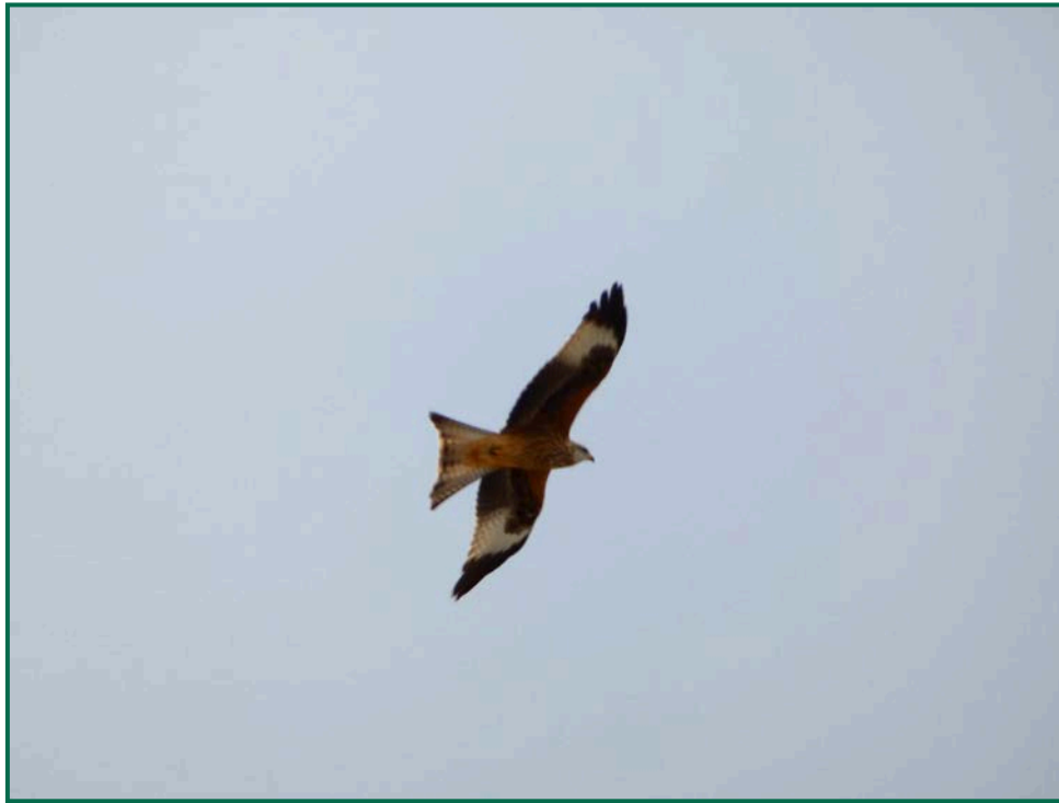
Fotografía 13. Milano real ( Milvus milvus ).