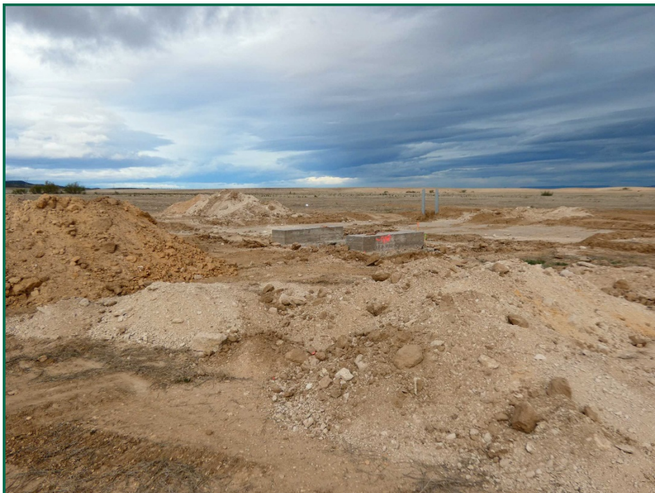
Fotografía 7. Estructuras para los inversores.