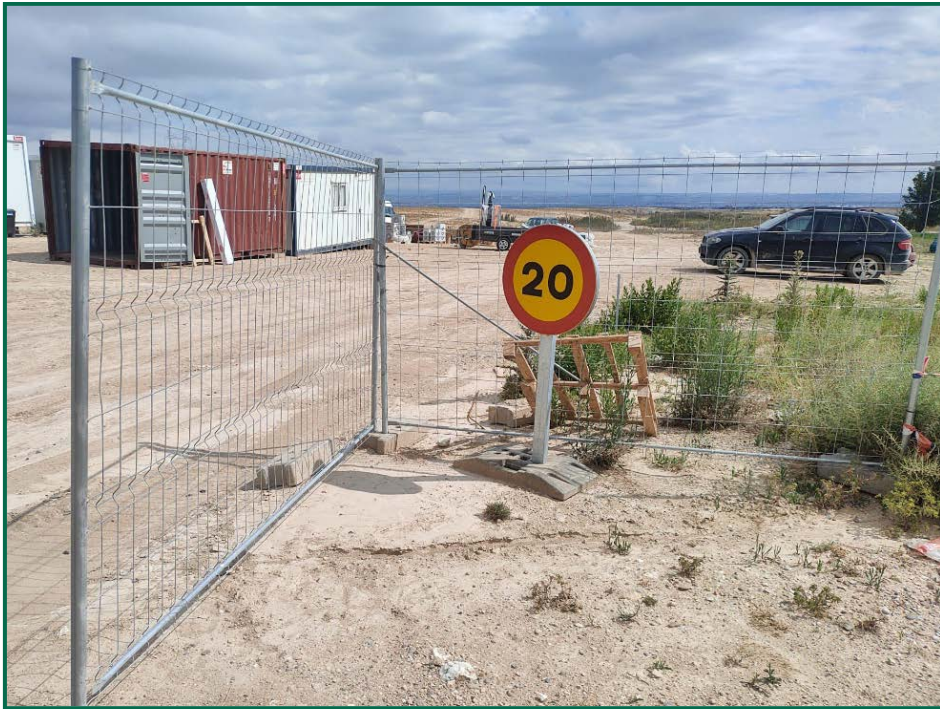
Fotografía 1. Señalización de velocidad.