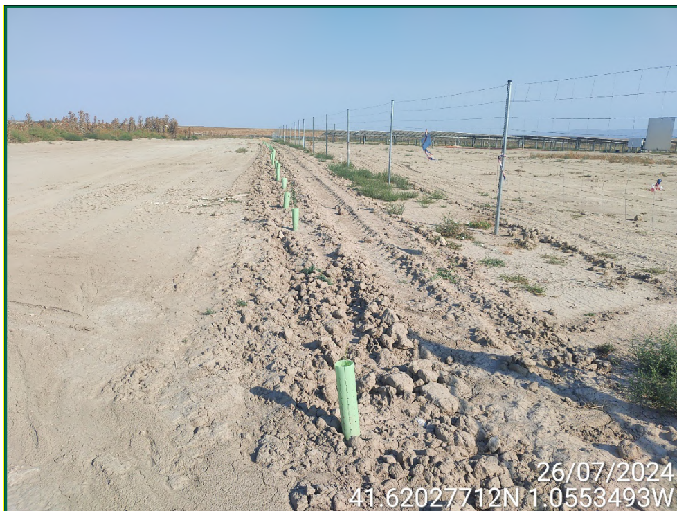
Fotografía 17. Plantación de olivos, retamas y romeros.

Para garantizar su crecimiento se ha realizado y seguirá realizando riegos de apoyo. Además, todas las plantas se han colocado con tutor para facilitar el buen crecimiento y han sido provistas de un tubo protector de 30cm de altura tutor de caña de bambú.