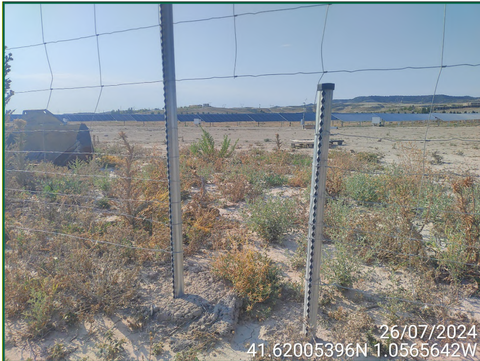
Fotografía 7. Espaciado cinegético.