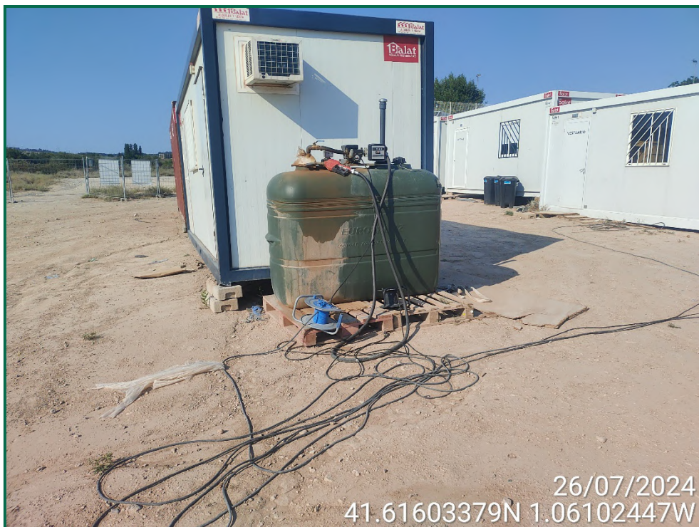
Fotografía 11. Depósito de combustible.