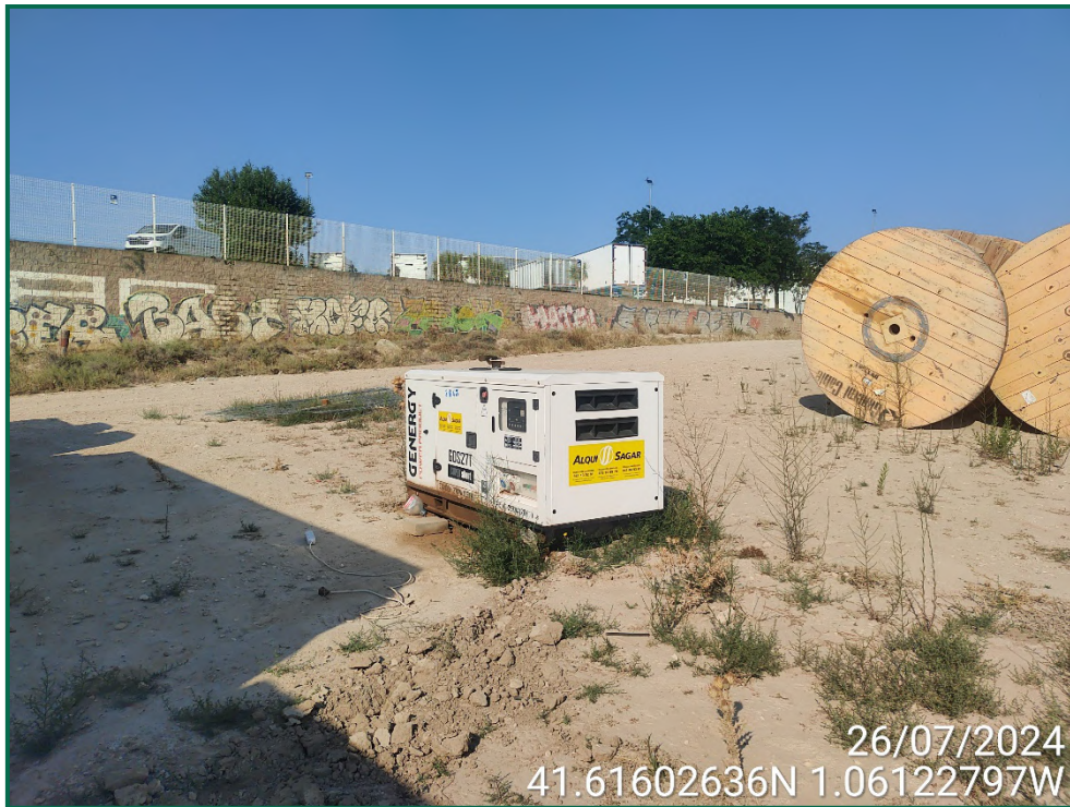
Fotografía 12. Grupo electrógeno.