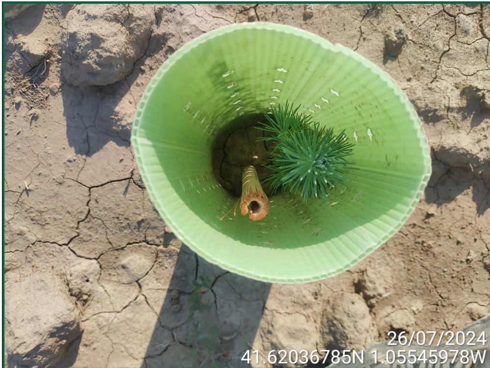
Fotografía 20. Romero y tutor de bambú.