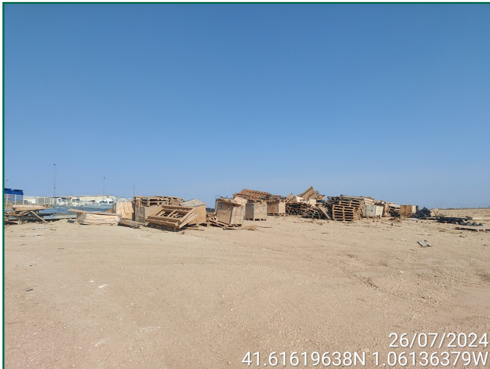
Fotografía 14. Restos de materiales.