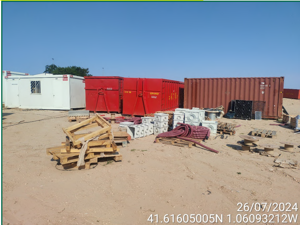
Fotografía 10. Contenedores de residuos y restos de materiales.