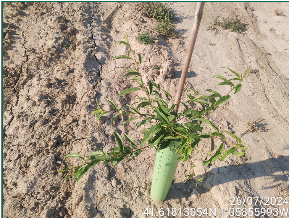
Fotografía 16. Almendro.