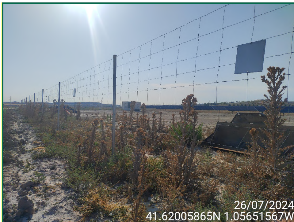
Fotografía 6. Placas anticollisión.

Se ha colocado un hotel de insectos en la caseta de control de Centrovía I y se ha preparado una caja nido que será colocada en una caseta a suficiente altura, esta caja nido ha sido colocada remplazando las tejas nidos que marca la DIA, ya que no sería posible colocarla sobre el edificio de control.