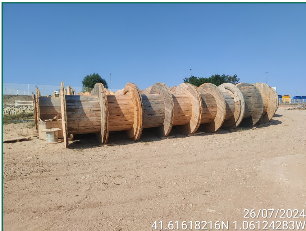
Fotografía 13. Restos de materiales.