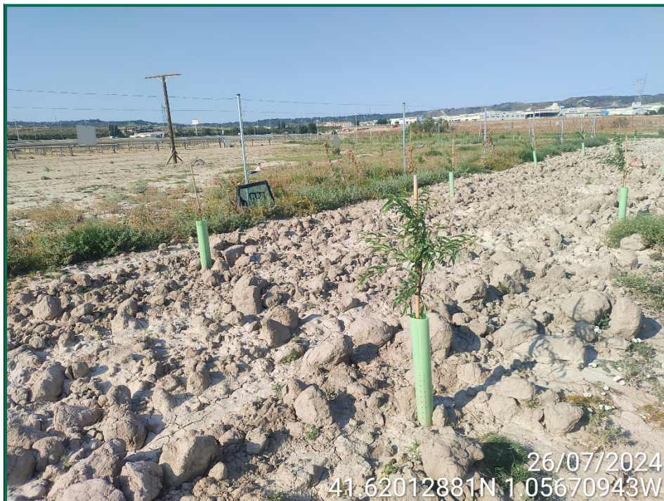
Fotografía 3. Arado de la pantalla vegetal.

Por el momento la tierra vegetal extraída ha sido escasa debido a que no ha sido necesario nivelar todo el terreno, únicamente algunas zonas y con un espesor limitado, y esta se ha ido extendiendo sobre el terreno. La tierra extraída para la construcción de balsas de limpieza se ha acopiado en caballones al igual que la tierra retirada para realizar zanjas. En las zonas donde se han realizado plantaciones para crear una pantalla vegetal el terreno ha sido arado.