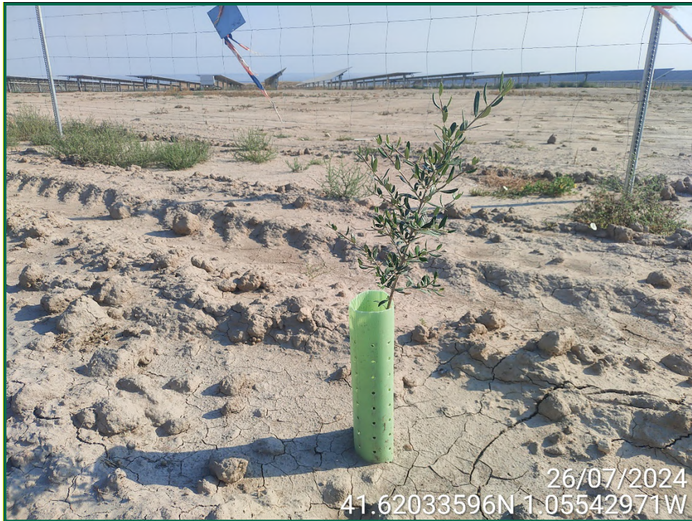
Fotografía 18. Olivo.