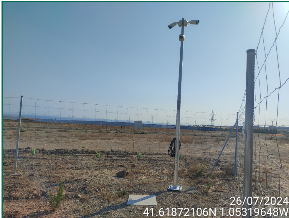
Fotografía 4. Colocación de las cámaras de vigilancia.