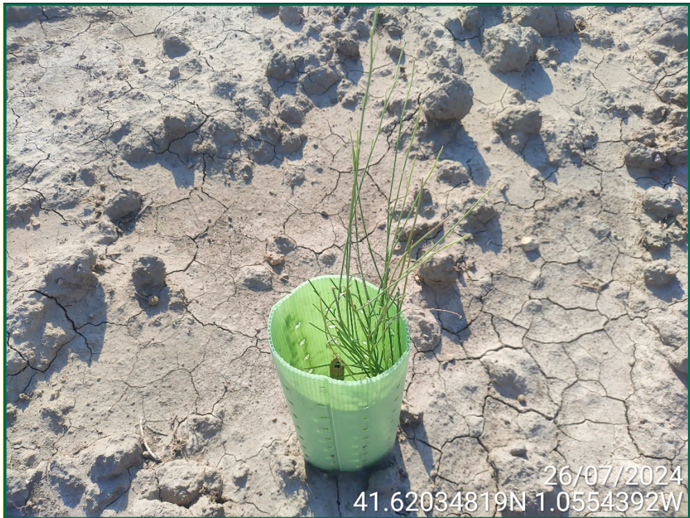
Fotografía 19. Retama.