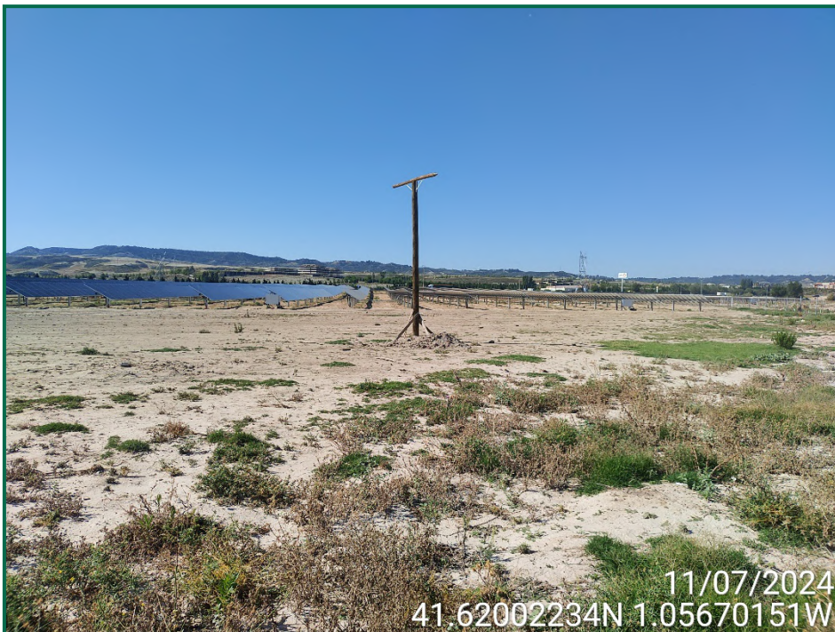
Fotografía 2. Superficie de la planta.