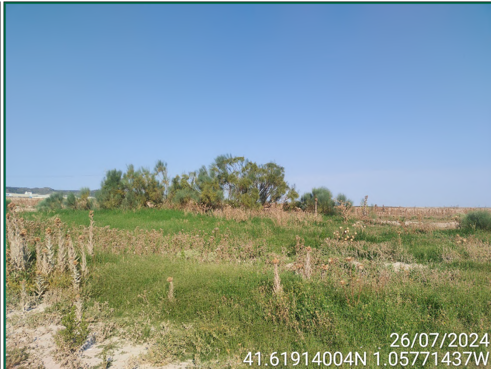
Fotografía 5. Vegetación natural.