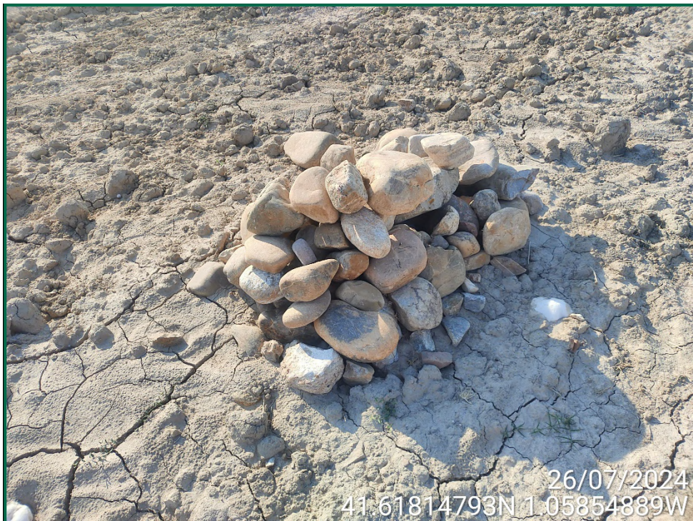
Fotografía 8. Majano para reptiles.