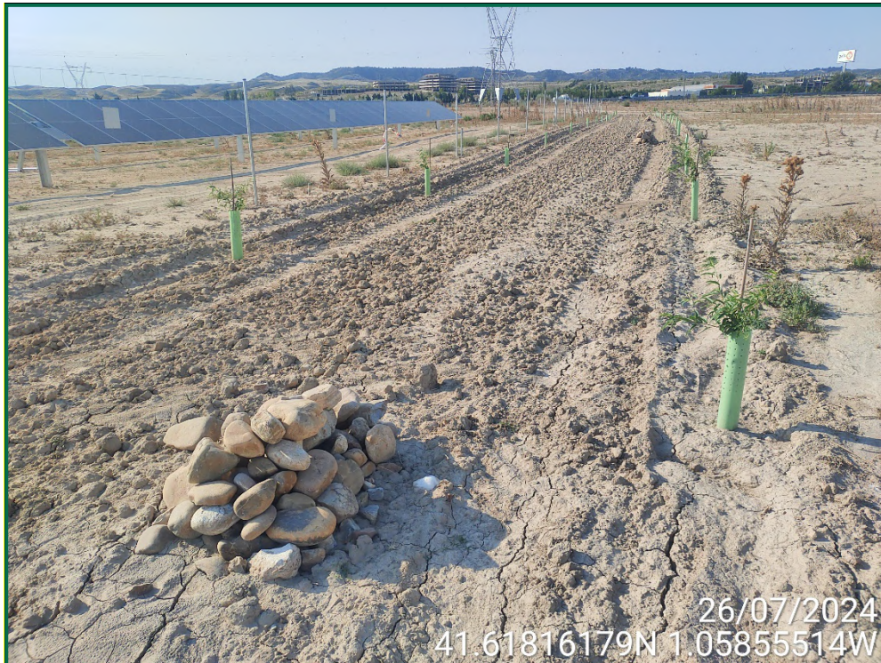
Fotografía 15. Plantación de almendros.