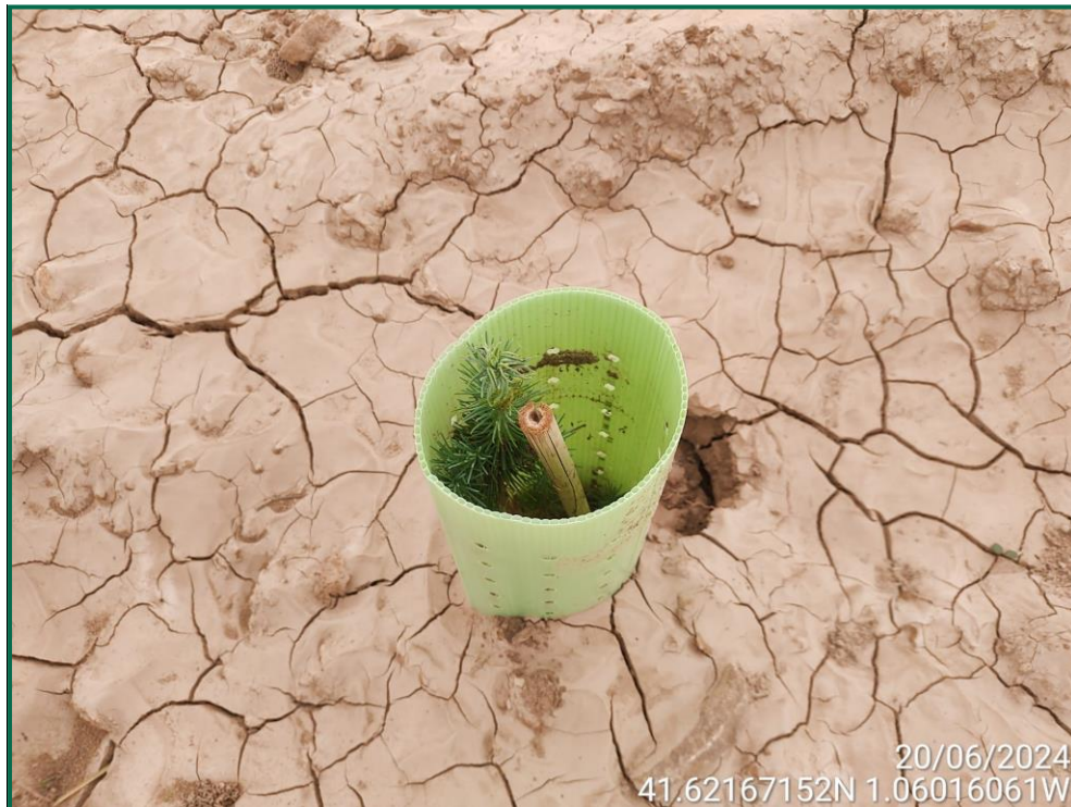
Fotografía 25. Romero y tutor de bambú.

Para garantizar su crecimiento se ha realizado y seguirá realizando riegos de apoyo. Además, todas las plantas se han colocado con tutor para facilitar el buen crecimiento y han sido provistas de un tubo protector de 30cm de altura tutor de caña de bambú.