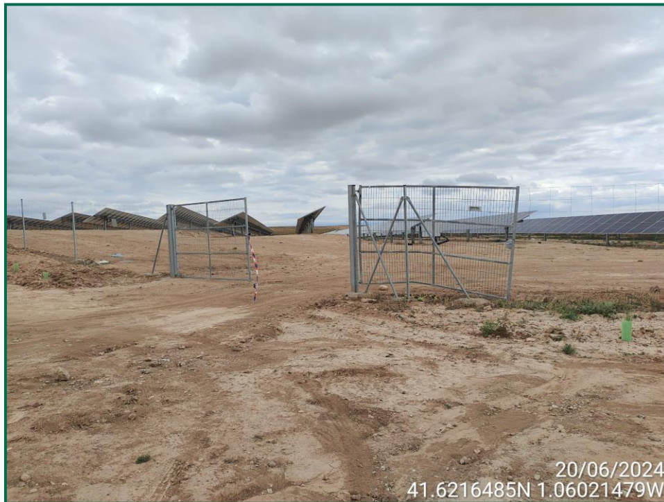
Fotografía 11. Puerta de acceso doblado.