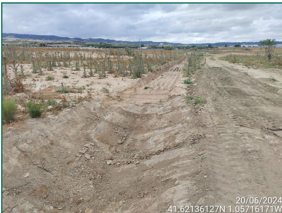
Fotografía 7. Cuneta del barranco.