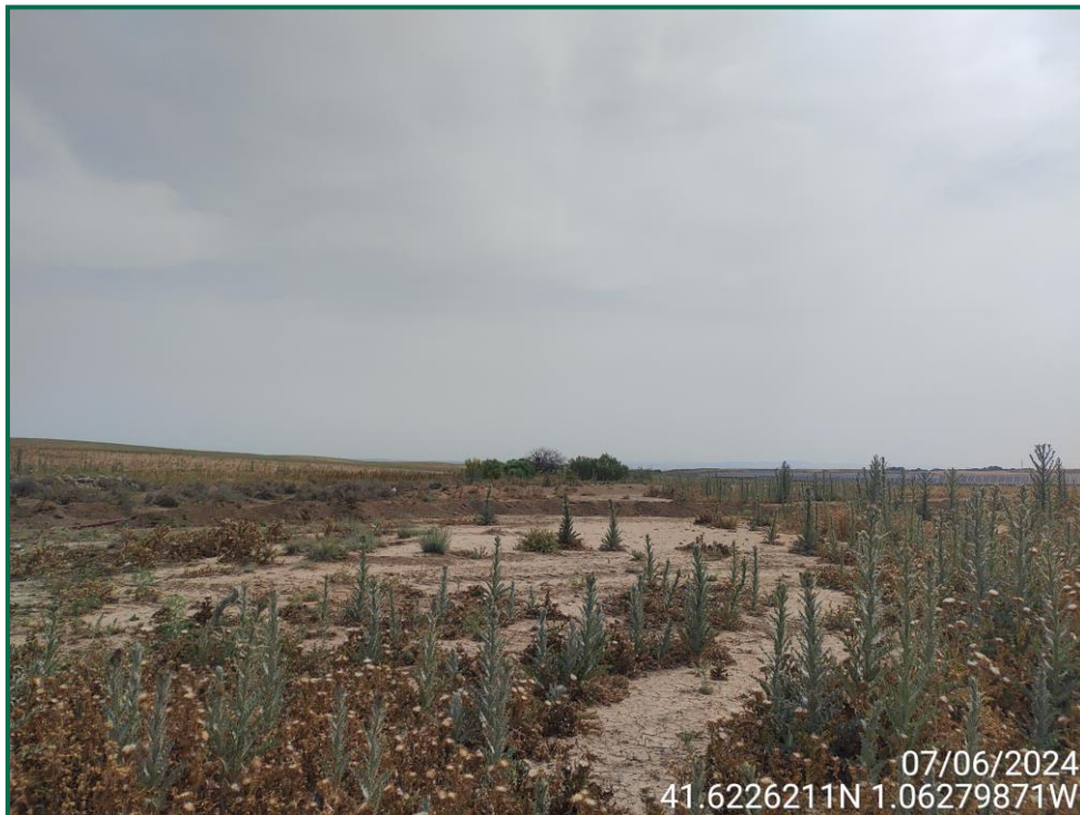
Fotografía 9. Vegetación natural.