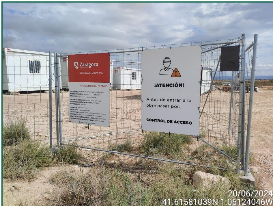
Fotografía 2. Control de acceso.