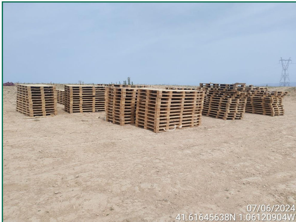
Fotografía 19. Recogida de palets.