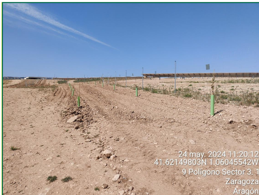
Fotografía 21. Plantación de almendros.

Se ha realizado una pantalla vegetal en todo el perímetro a excepción de la zona del perímetro que colinda con zonas urbanizadas. Se han plantado mayoritariamente almendros al tresbolillo y la separación recomendada para su correcto crecimiento.