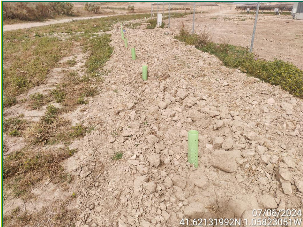
Fotografía 26. Tubo protector.