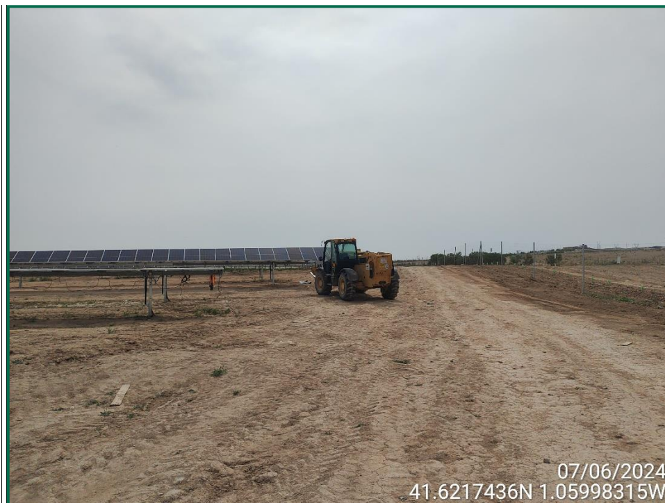
Fotografía 3. Maquinaria y placas fotovoltaicas.

Se ha excavado una cuneta en la zona de barranco donde se había habilitado un paso temporal para los vehículos, en la cual se había añadido tierra anteriormente.