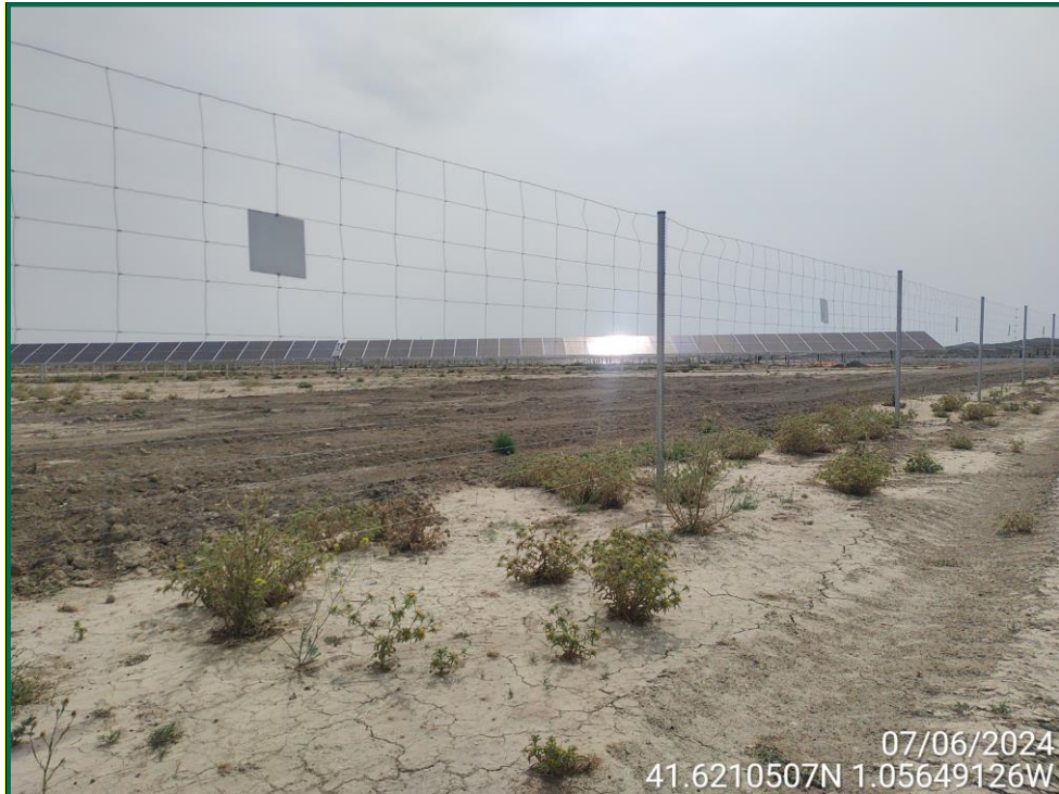
Fotografía 10. Placas anticolidión.

Durante este mes se han colocado en distintas zonas postes que sirven como posadero para rapaces de pequeño y mediano tamaño. Se han recibido los hoteles de insectos que serán colocados próximamente.