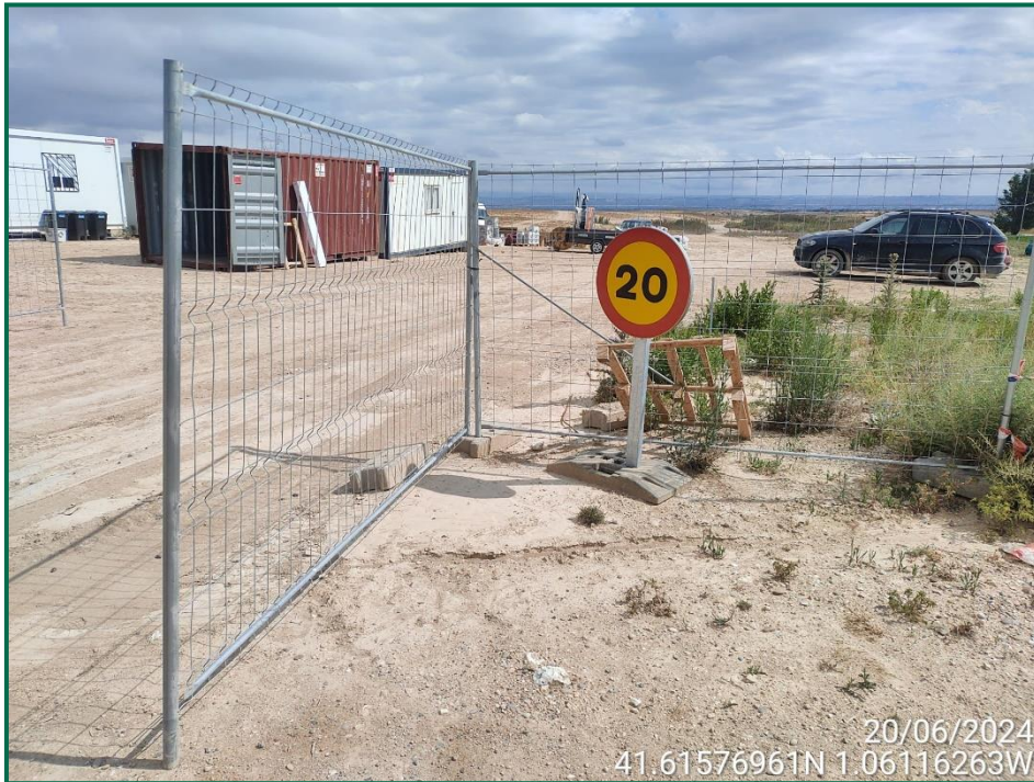
Fotografía 1. Señalización de velocidad.