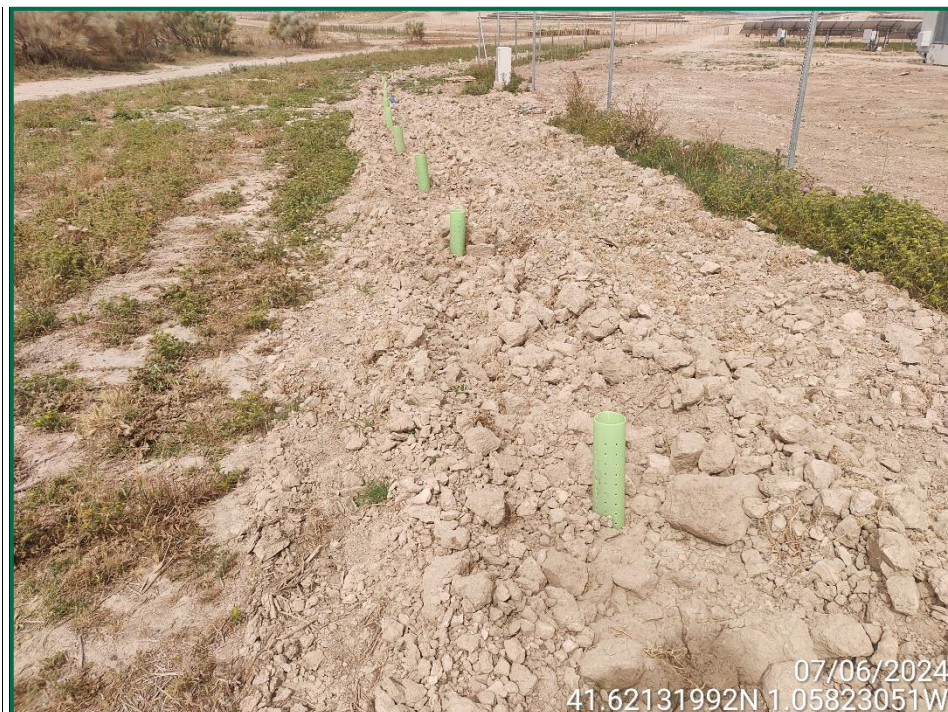
Fotografía 5. Arado de la pantalla vegetal.