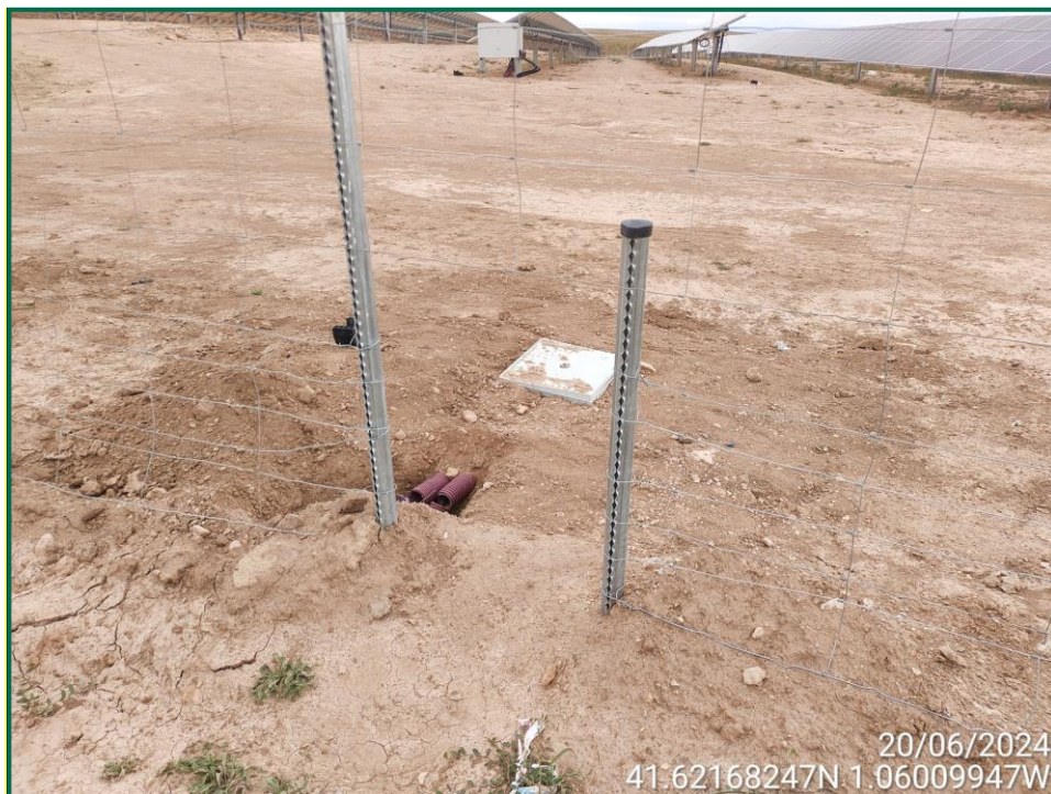
Fotografía 12. Espaciado cinegético y zanjas.