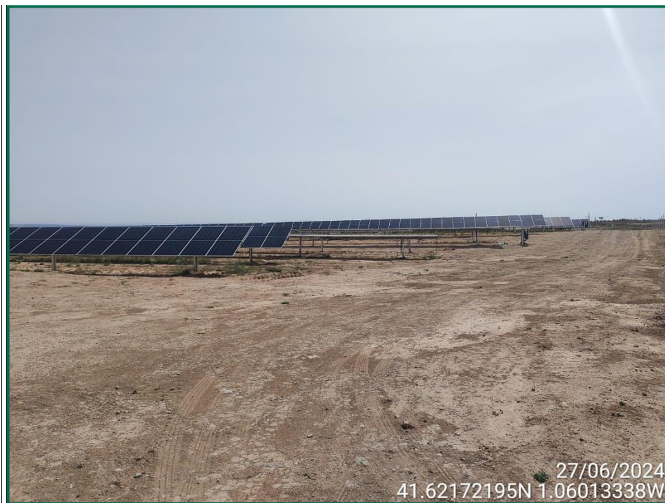
Fotografía 4. Superficie de la obra.