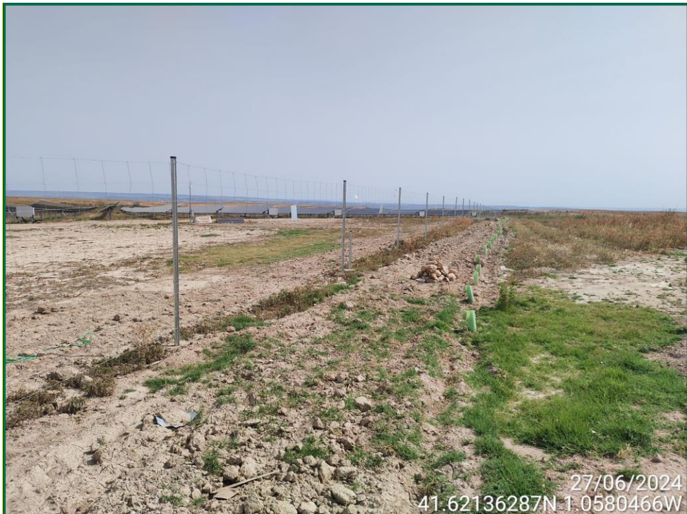
Fotografía 22. Plantación de olivos, retamas y romeros.

En los lugares donde no se puede realizar una pantalla cumpliendo con los retranqueos previstos en la normativa respecto a caminos u otros, se ha reducido la anchura excepcionalmente y en esas zonas se ha realizado la plantación de otras plantas que permiten la plantación más próxima unas de otras como retama, olivo y romero.