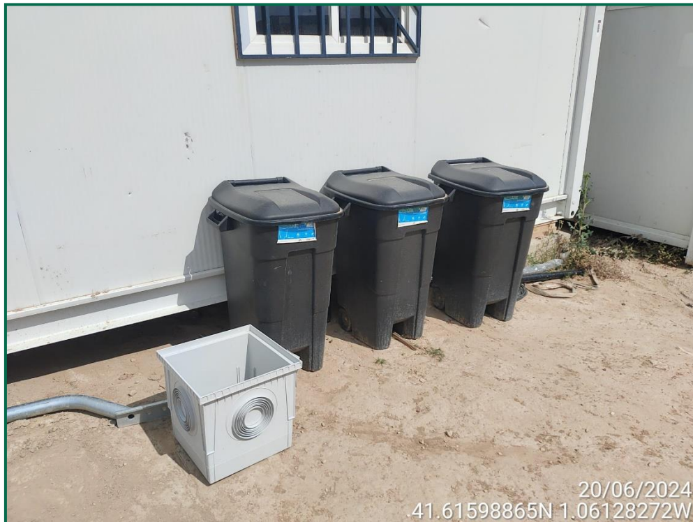
Fotografía 17. Contenedores de residuos peligrosos.