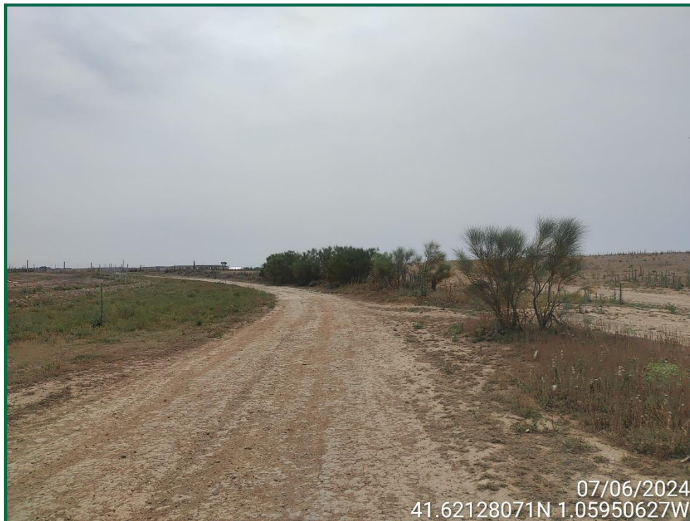
Fotografía 8. Vegetación natural.

Durante las visitas semanales a obra en el mes en curso se comprueba que la ocupación de zonas de vegetación se limita a lo aprobado en el proyecto. Se verifica también que la maquinaria circula únicamente por los viales habilitados para tal fin. Desde el inicio de las obras se ha planificado la ejecución de una franja vegetal de 8 m de anchura en torno al futuro vallado perimetral.