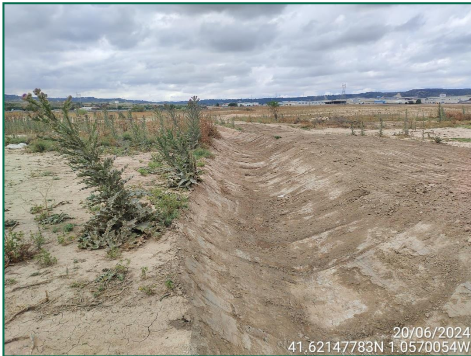
Fotografía 6. Cuneta del barranco.