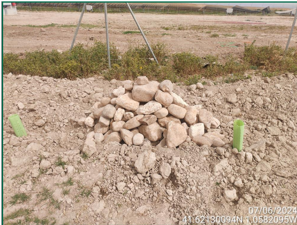
Fotografía 13. Majano para reptiles.