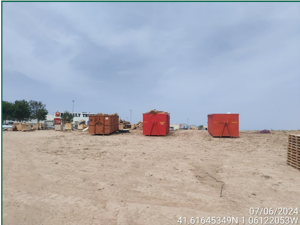
Fotografía 15. Contenedores de residuos.