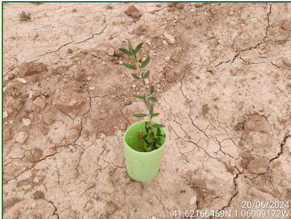
Fotografía 23. Olivo.