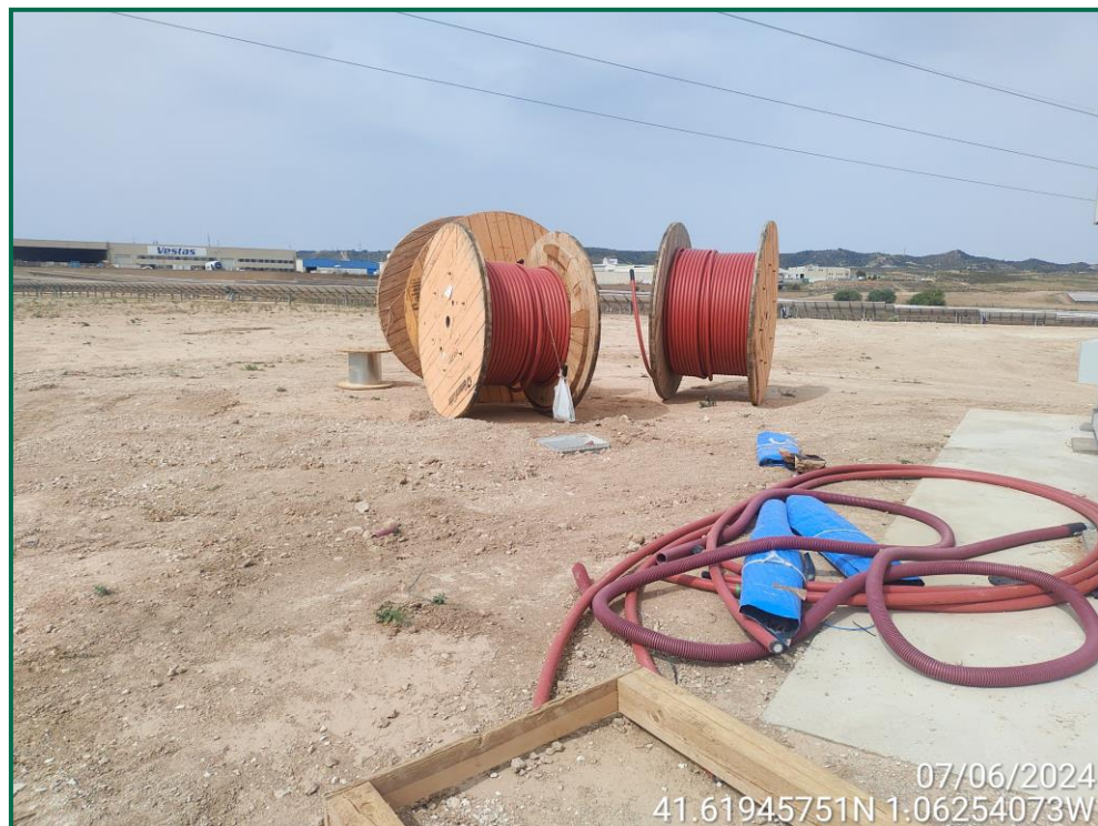
Fotografía 20. Materiales de obra.