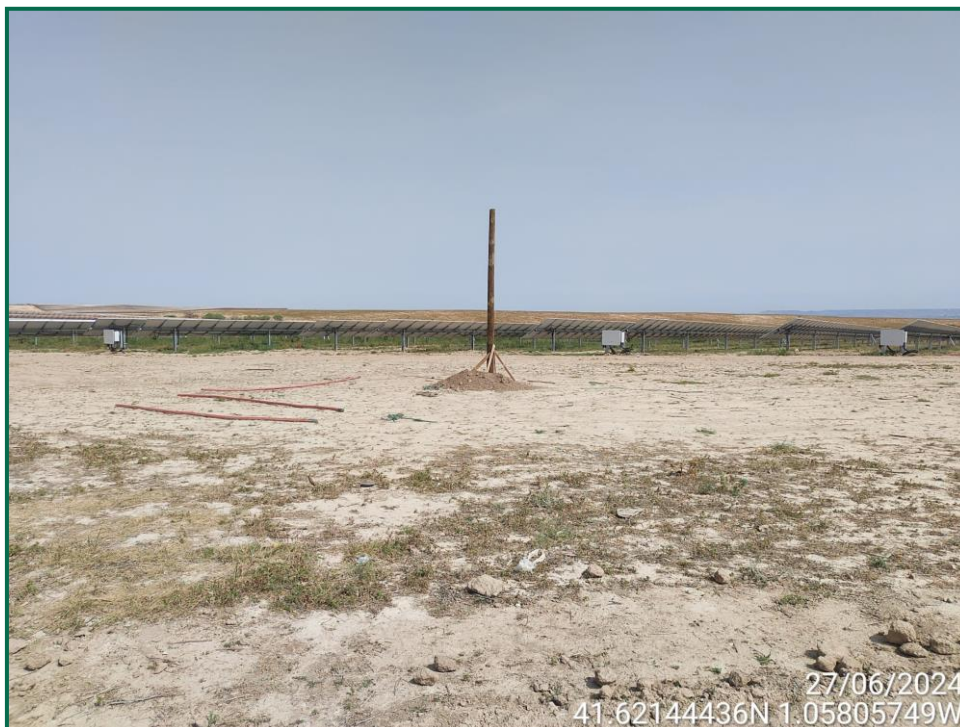
Fotografía 14. Posaderos para rapaces.