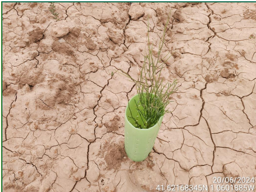
Fotografía 24. Retama.