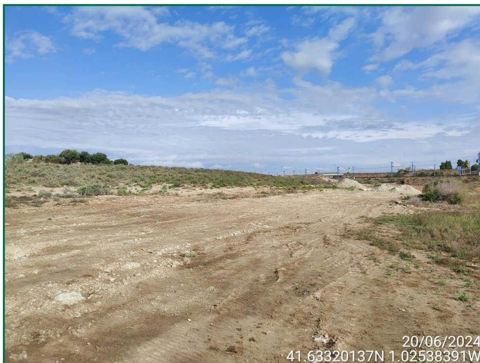
Fotografía 29. Tapado de zanjas.