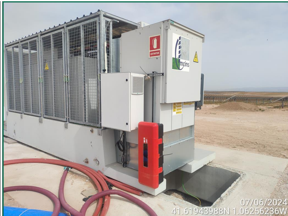
Fotografía 27. Caseta del inversor y equipo de extinción.