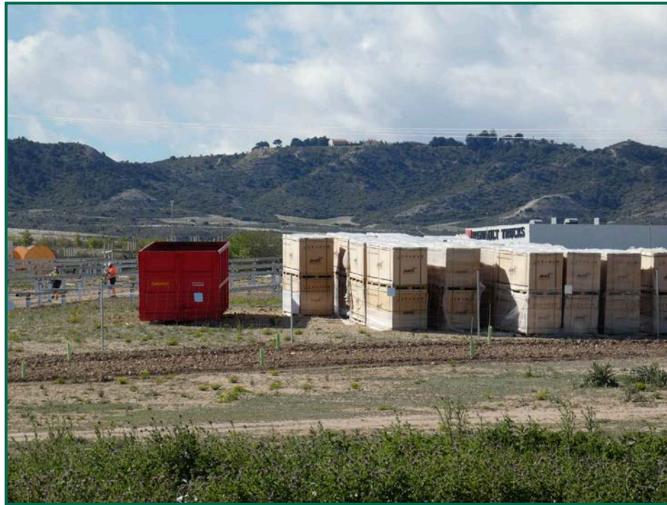
Fotografía 6. Materiales de obra.