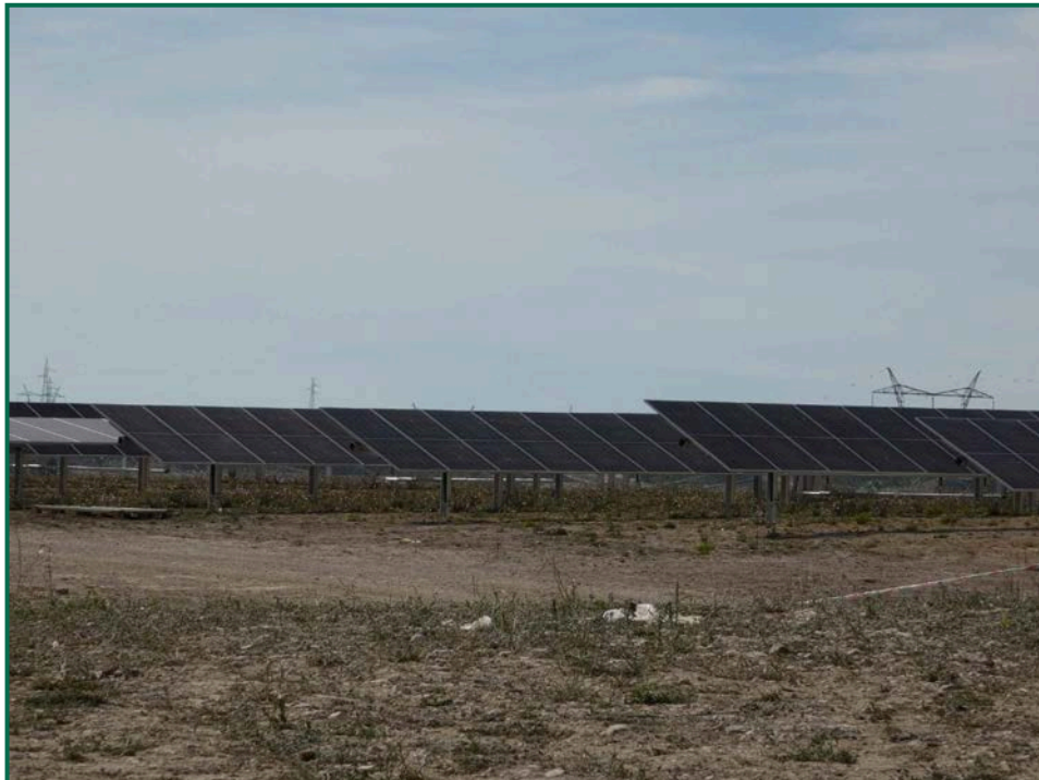
Fotografía 5. Colocación de placas fotovoltaicas.