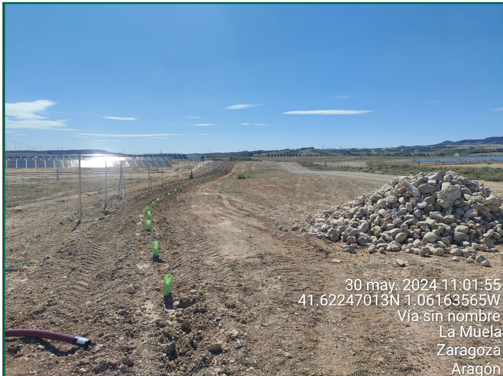
Fotografía 19. Plantación de olivos, retamas y romeros. Acumulación de piedras para majano.

En los lugares donde no se puede realizar una pantalla cumpliendo con los retranqueos previstos en la normativa respecto a caminos u otros, se ha reducido la anchura excepcionalmente y en esas zonas se ha realizado la plantación de otras plantas que permiten la plantación más próxima unas de otras como retama, olivo y romero.