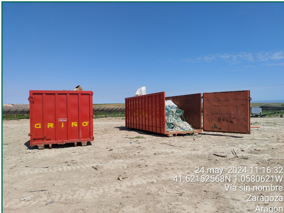
Fotografía 16. Contenedores de residuos sobre la superficie de la obra.