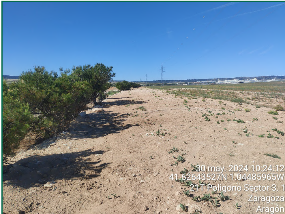
Fotografía 27. Vegetación natural y tapado de zanjas.