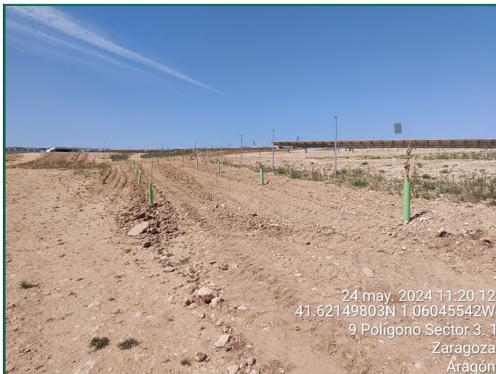
Fotografía 18. Plantación de almendros.

Se ha realizado una pantalla vegetal en todo el perímetro a excepción de la zona del perímetro que colinda con zonas urbanizadas. Se han plantado mayoritariamente almendros al tresbolillo y la separación recomendada para su correcto crecimiento.