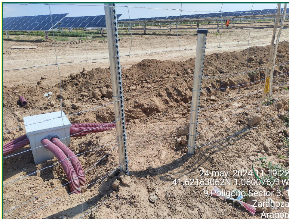
Fotografía 9. Espaciado cinegético y zanjas.