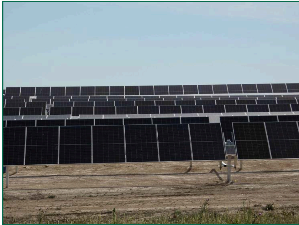
Fotografía 4. Placas fotovoltaicas.