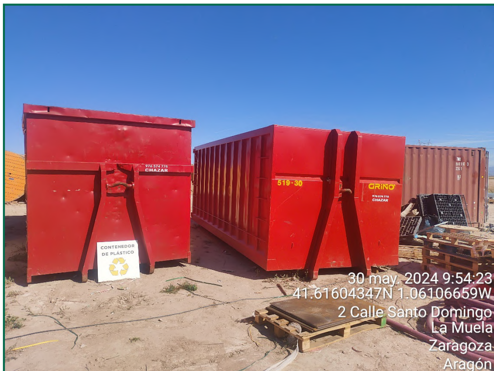
Fotografía 13. Contenedores de residuos.

Se están utilizando grupos electrógenos y se han instalado envases de combustible. Además, se han colocado bandejas de contención debajo de ellos para evitar derrames por pérdidas accidentales sobre el terreno.