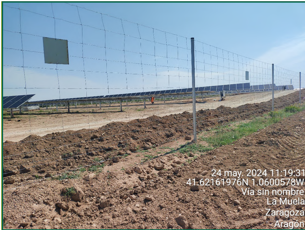
Fotografía 8. Placas anticolidión.