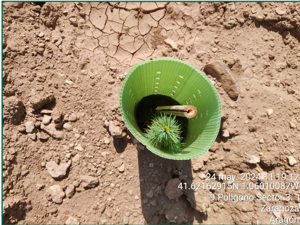
Fotografía 22. Romero y tutor de bambú.

Para garantizar su crecimiento se ha realizado y seguirá realizando riegos de apoyo. Además, todas las plantas se han colocado con tutor para facilitar el buen crecimiento y han sido provistas de un tubo protector de 30cm de altura tutor de caña de bambú.