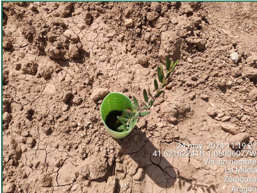
Fotografía 20. Olivo.