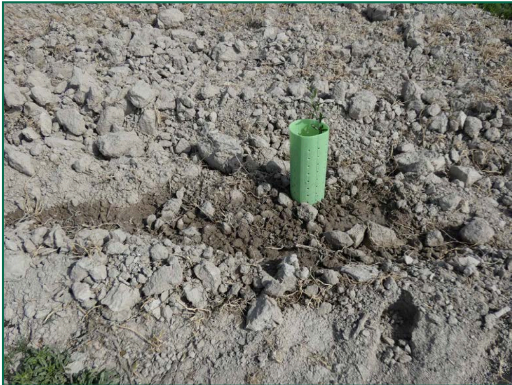
Fotografía 23. Riegos de apoyo.