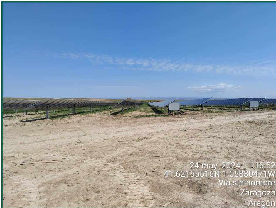
Fotografía 3. Superficie de la obra.