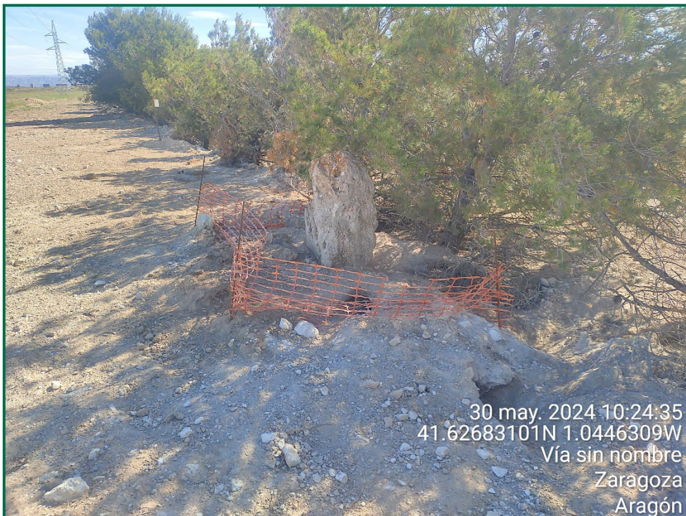
Fotografía 26. Balizamiento de madrigueras.

Durante este mes se ha finalizado la construcción de la línea de evacuación, la cual es soterrada. Se ha procedido a balizar la vegetación natural colindante, los caminos próximos a las zanjas y los materiales que se encuentren sobre campos de cultivo. Para su construcción se han realizado zanjas, se ha colocado el cableado y posteriormente se están tapado dichas zanjas.