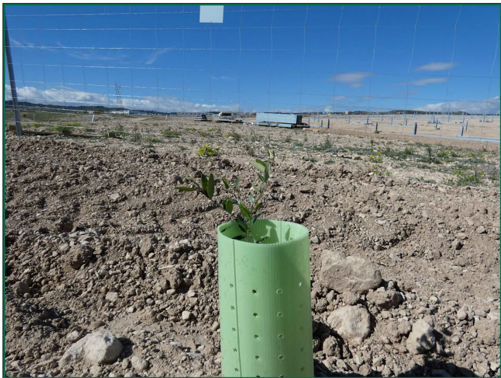
Fotografía 24. Tubo protector.