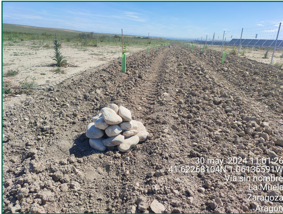
Fotografía 10. Majano para reptiles.

Se ha realizado seguimiento de avifauna durante el proceso de la obra, observándose las siguientes especies: busardo ratonero ( Buteo buteo ), corneja negra ( Corvus corone ) cuervo grande ( Corvus corax ), chova piquirroja ( Pyrhacorax pyrrhacorax ), aguilucho lagunero ( Circus aeruginosus ), milano negro ( Milvus migrans ), buitre leonado ( Gyps fulvus ), culebrera europea ( Circaetus gallicus ), gaviota patiamarilla ( Larus michaellis ), anade azulón ( Anas platyrhynchos ), pato colorado ( Netta rufina ) y garza real ( Ardea cinerea ). Además, otras especies como estornino negro ( Sturnus unicolor ), abubilla común ( Upupa epops ) o urraca común ( Pica pica ) entre otras.