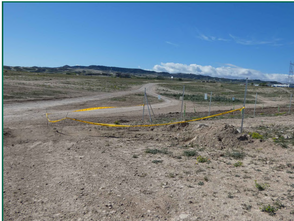
Fotografía 1. Balizado de zanjas.

No se realiza el balizamiento de todo el perímetro de la obra ya que se generaría una gran cantidad de residuos de malla de obra o cinta que tiende a romperse y dispersarse por toda la zona. Sí se realiza un jalonamiento del perímetro mediante banderines y también se realiza un balizamiento del gasoducto y oleoducto. Además se realiza un balizamiento del patrimonio histórico-arqueológico. La Dirección Ambiental realiza un control visual continuado para comprobar que no se sobrepasan los límites de la zona de ocupación.