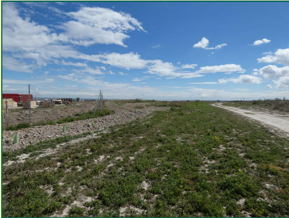
Fotografía 7. Franja vegetal.