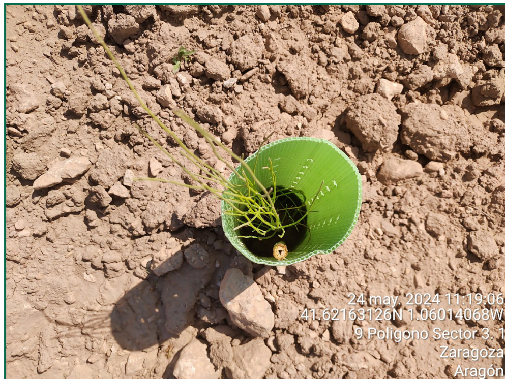
Fotografía 21. Retama.