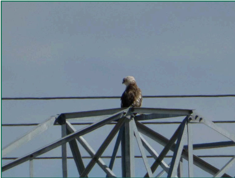
Fotografía 11. Culebrera europea ( Circaetus gallicus ).