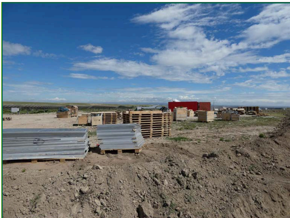
Fotografía 17. Recolección de residuos y materiales.