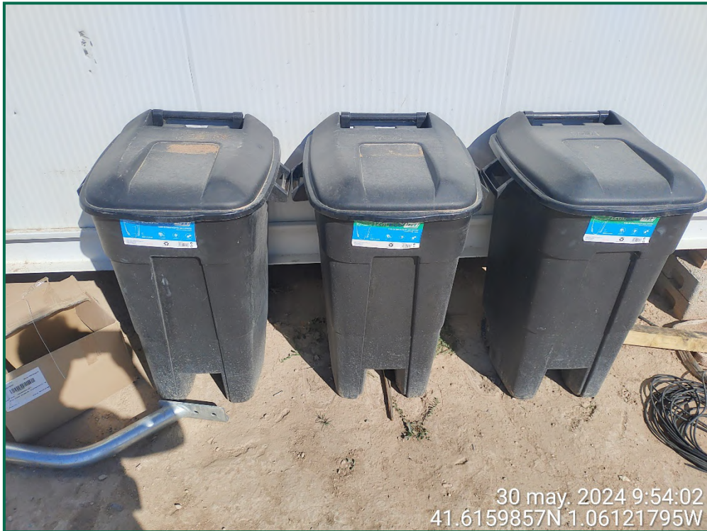
Fotografía 14. Contenedores de residuos peligrosos.