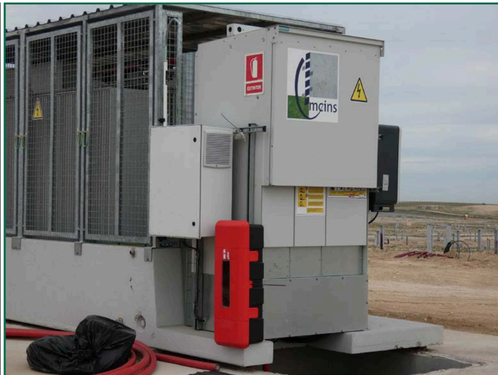
Fotografía 25. Caseta del inversor y equipo de extinción.

Se tiene en cuenta las disposiciones contenidas sobre protección y lucha en la campaña de incendios forestales de la Comunidad Autónoma de Aragón durante el año 2023. El Gobierno de Aragón a adelantado el plan de prevención de incendios al 1 de mayo de 2023 cuando habitualmente es el 15 de junio.