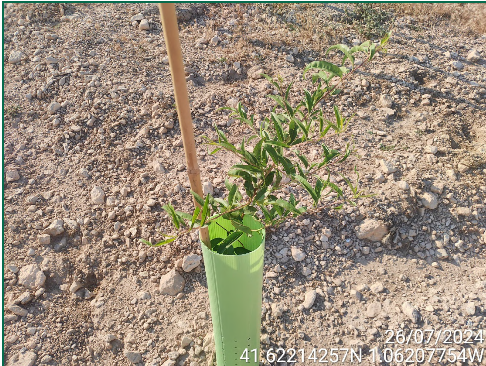
Fotografía 18. Almendro.

En los lugares donde no se puede realizar una pantalla cumpliendo con los retranqueos previstos en la normativa respecto a caminos u otros, se ha reducido la anchura excepcionalmente y en esas zonas se ha realizado la plantación de otras plantas que permiten la plantación más próxima unas de otras como retama, olivo y romero.