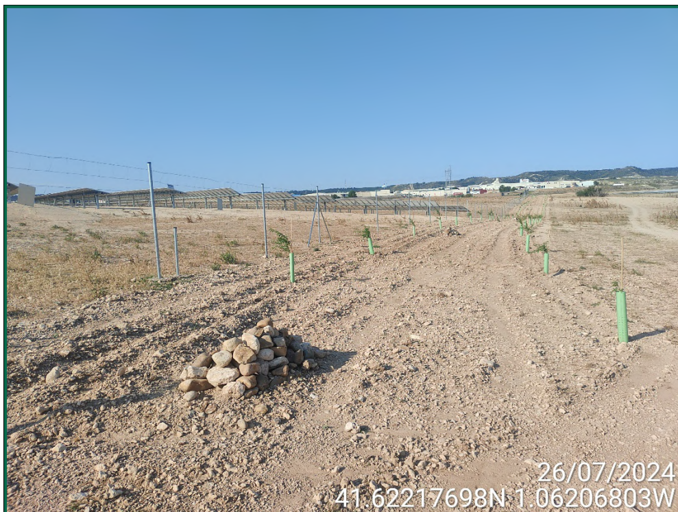
Fotografía 17. Plantación de almendros.

Se ha realizado una pantalla vegetal en todo el perímetro a excepción de la zona del perímetro que colinda con zonas urbanizadas. Se han plantado mayoritariamente almendros al tresbolillo y la separación recomendada para su correcto crecimiento.