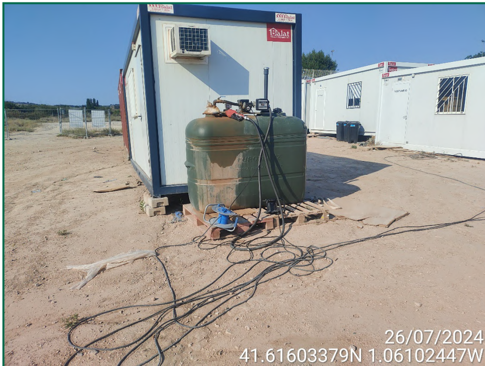
Fotografía 13. Depósito de combustible.