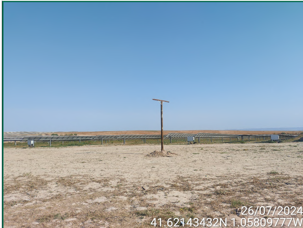
Fotografía 10. Posaderos para rapaces.