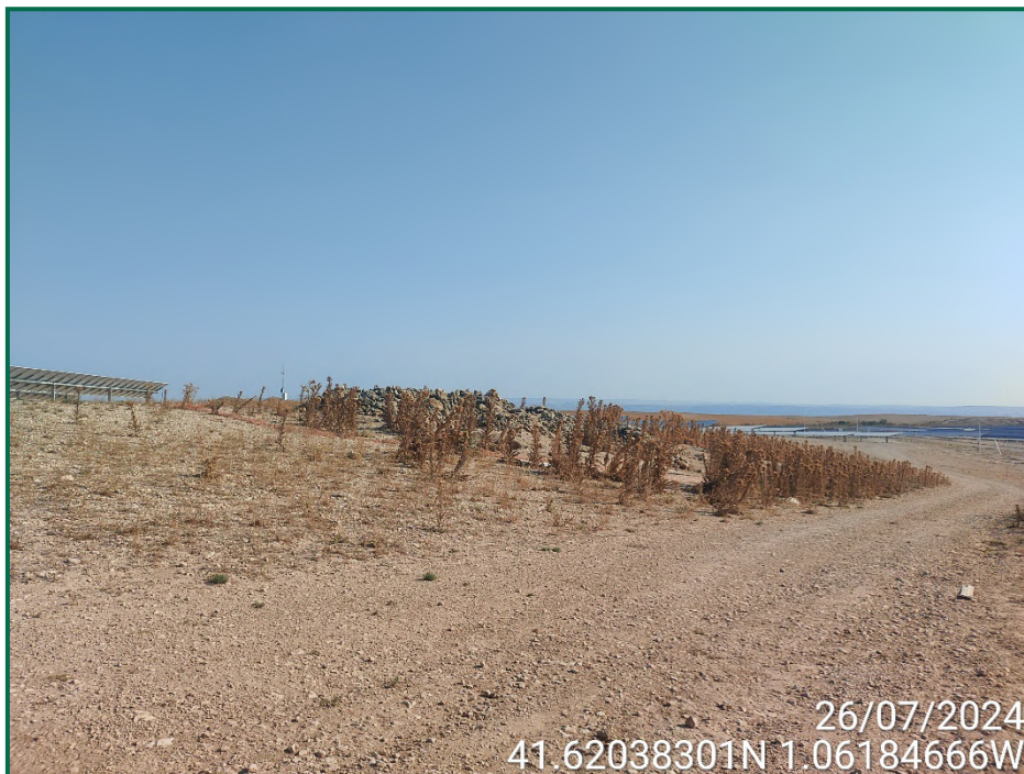
Fotografía 1. Balizado de majano.

No se realiza el balizamiento de todo el perímetro de la obra ya que se generaría una gran cantidad de residuos de malla de obra o cinta que tiende a romperse y dispersarse por toda la zona. Sí se realiza un jalonamiento del perímetro mediante banderines y también se realiza un balizamiento del gasoducto y oleoducto. La Dirección Ambiental realiza un control visual continuado para comprobar que no se sobrepasan los límites de la zona de ocupación.