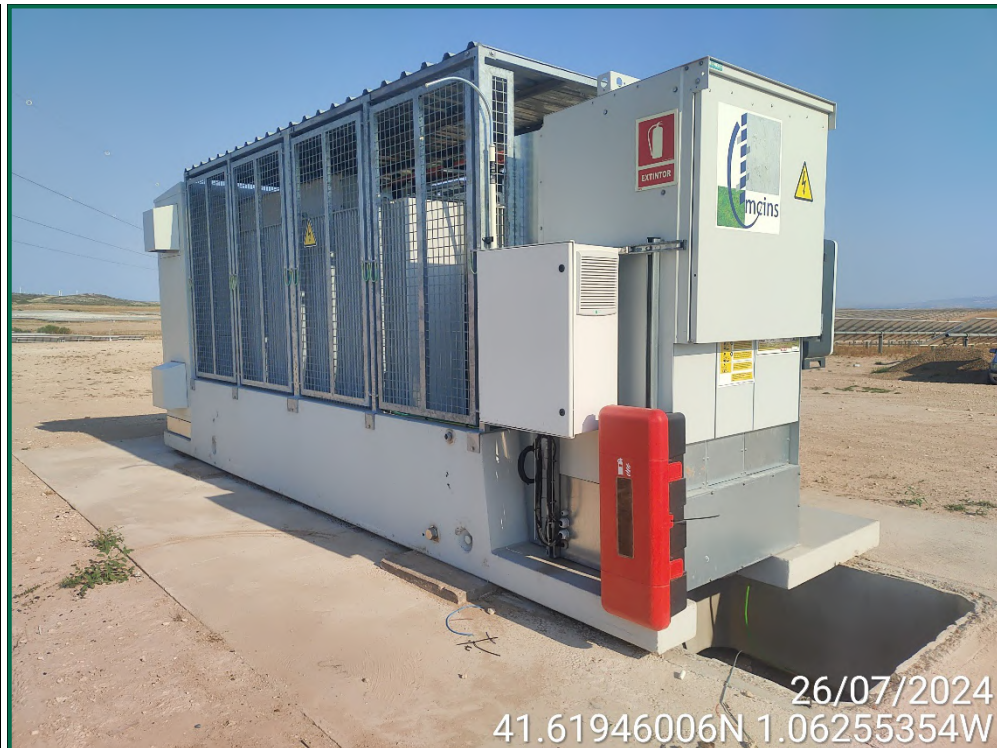
Fotografía 20. Equipo de extinción.