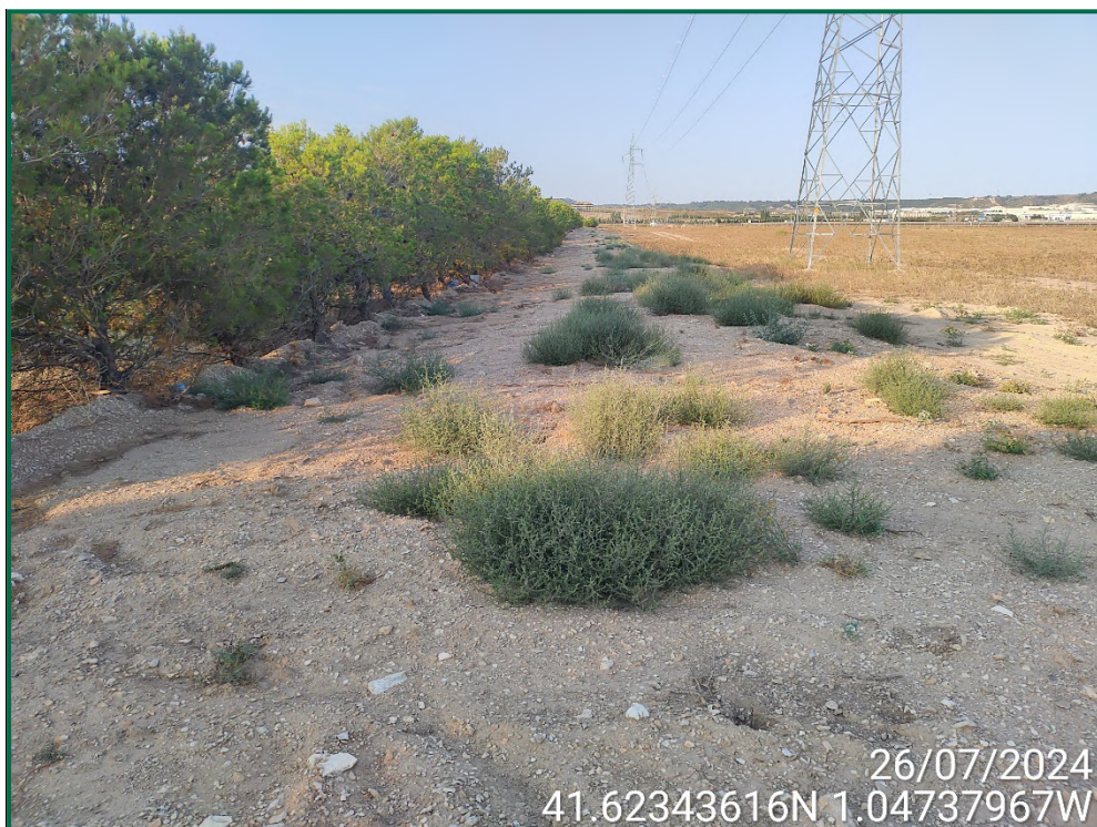
Fotografía 22. Tapado de zanjas.