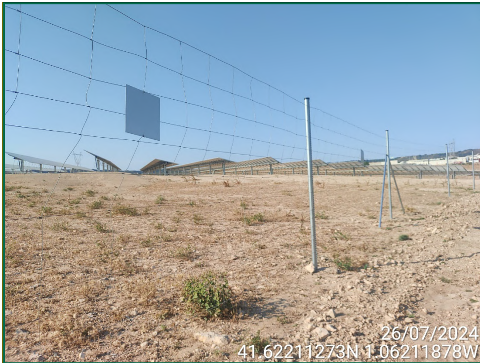
Fotografía 7. Placas anticollisión.