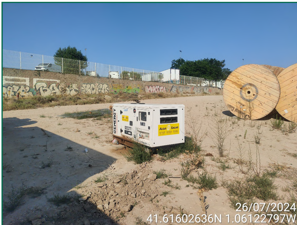
Fotografía 14. Grupo electrógeno.