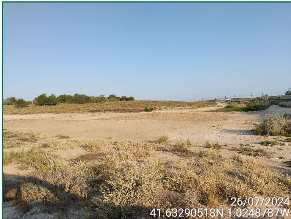
Fotografía 21. Final de la línea de evacuación y vegetación natural.