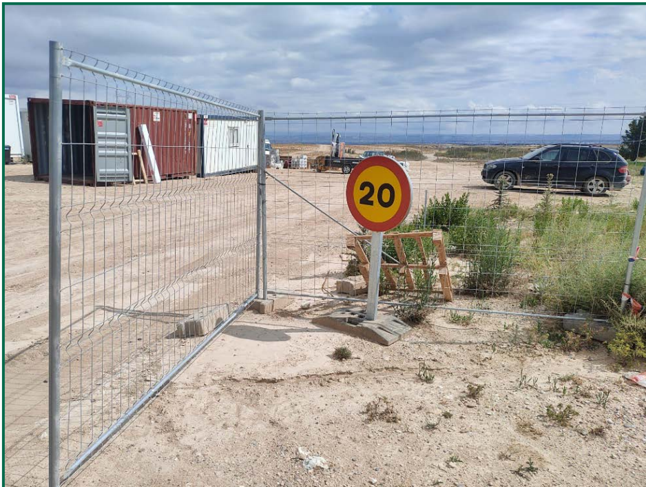
Fotografía 2. Señalización de velocidad.

Durante las visitas a obra no se constata afección por emisión de polvo significativa durante los trabajos. Se prevé humedecer los caminos cuando las circunstancias lo requieran con la presencia de una cuba esparciendo agua por el terreno.