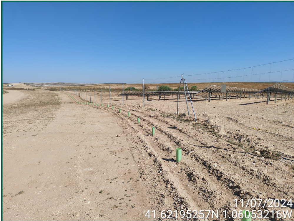
Fotografía 19. Plantación de olivos, retamas y romeros.