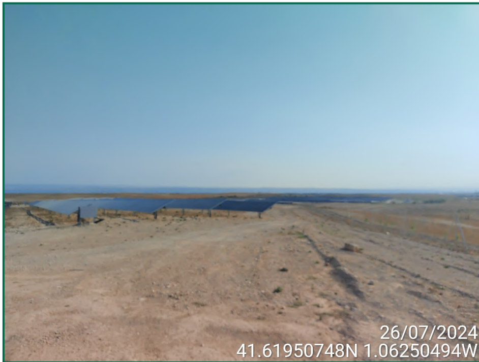
Fotografía 3. Superficie de la obra.