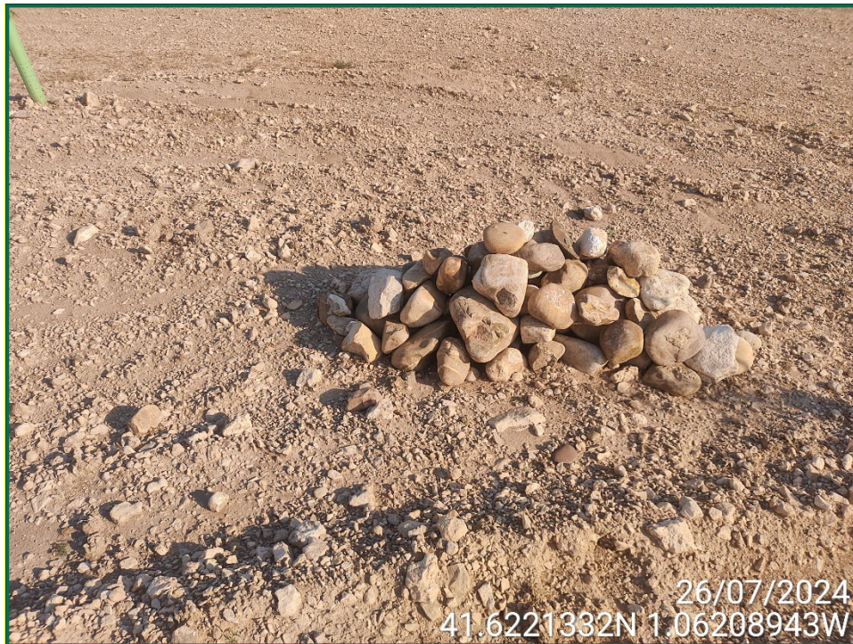
Fotografía 9. Majano para reptiles.