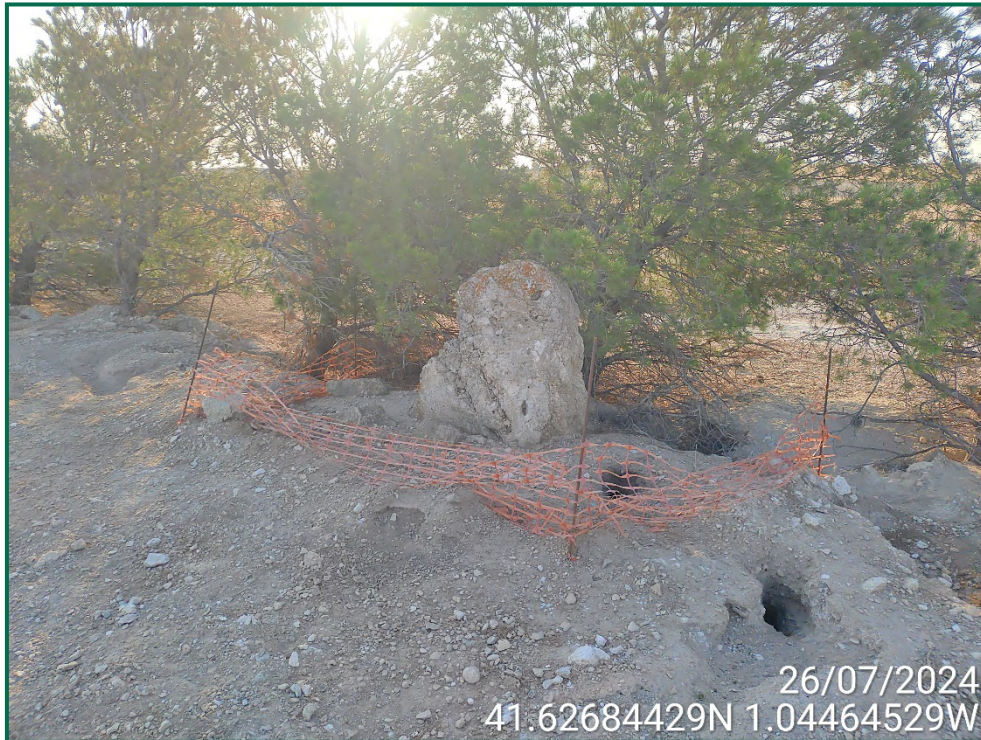
Fotografía 23. Balizado en la línea de evacuación.