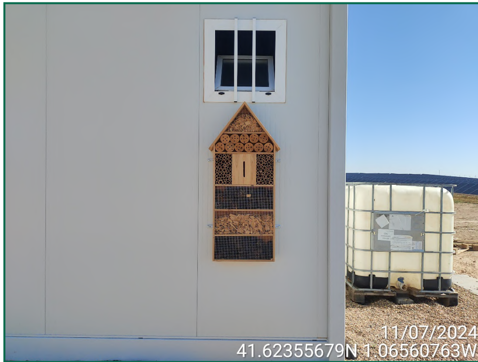
Fotografía 11. Colocación de hotel de insectos.

Se ha realizado seguimiento de avifauna durante el proceso de la obra, observándose las siguientes especies: corneja negra ( Corvus corone ), chova piquirroja ( Pyrrhocorax pyrrhocorax ), aguilucho lagunero ( Circus aeruginosus ), milano negro ( Milvus migrans ), anade azulón ( Anas platyrhynchos ). También otras especies como estornino negro ( Sturnus unicolor ), abubilla común ( Upupa epops ), urraca común ( Pica pica ) y diversos alaudidos. Por otro lado se ha observado la presencia de un primillar cercano que se encuentra a más de 3 km de la obra.