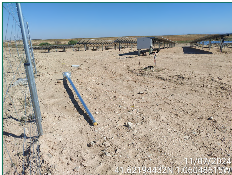
Fotografía 5. Colocación de postes para las cámaras de vigilancia.