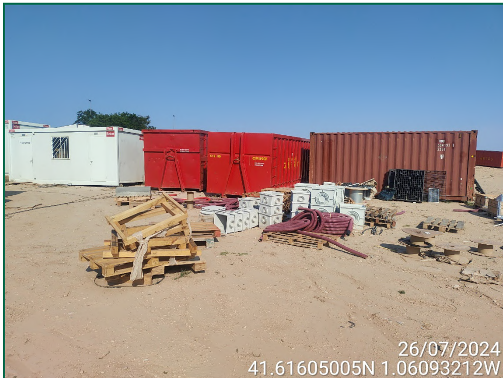
Fotografía 12. Contenedores de residuos y restos de materiales.

Durante las visitas realizadas se observa que se han realizado batidas para retirar los restos de residuos arrastrados por el viento por el vallado y zonas colindantes. La mayor parte de los residuos han sido retirados aunque aún quedan restos, por lo que se seguirán realizando batidas para su recogida. Se están utilizando grupos electrógenos y se han instalado envases de combustible.