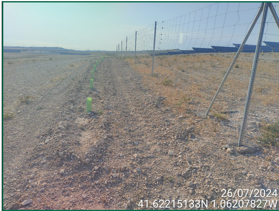
Fotografía 4. Arado de la pantalla vegetal.