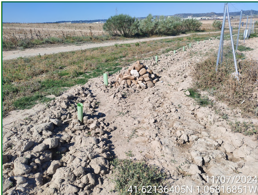
Fotografía 6. Vegetación natural y franja vegetal.

Durante las visitas semanales a obra en el mes en curso se comprueba que la ocupación de zonas de vegetación se limita a lo aprobado en el proyecto. Se verifica también que la maquinaria circula únicamente por los viales habilitados para tal fin. Desde el inicio de las obras se ha planificado la ejecución de una franja vegetal de 8 m de anchura en torno al futuro vallado perimetral.