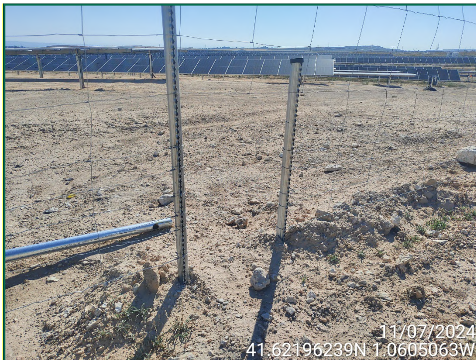
Fotografía 8. Espaciado cinegético.