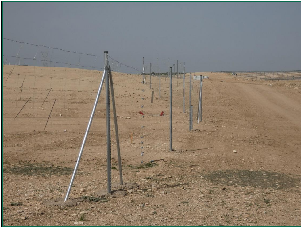
Fotografía 14. Vallado y superficie sin restos de embalaje.