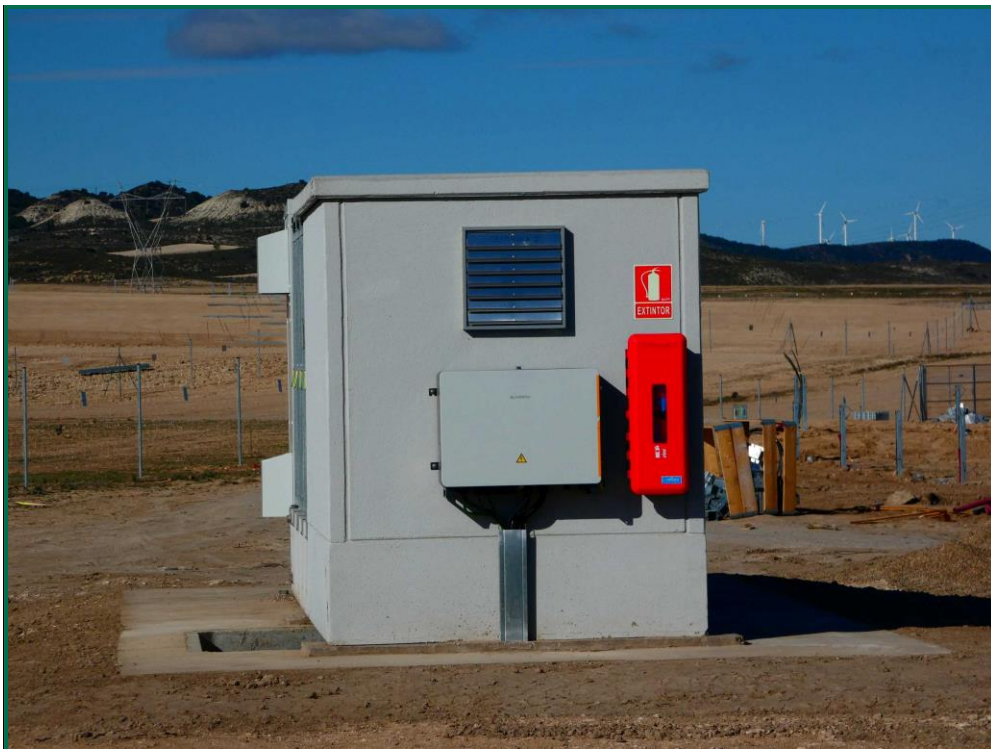
Fotografía 15. Caseta del inversor y equipo de extinción.

Se tiene en cuenta las disposiciones contenidas sobre protección y lucha en la campaña de incendios forestales de la Comunidad Autónoma de Aragón durante el año 2023. El Gobierno de Aragón ha adelantado el plan de prevención de incendios al 1 de mayo de 2023 cuando habitualmente es el 15 de junio.