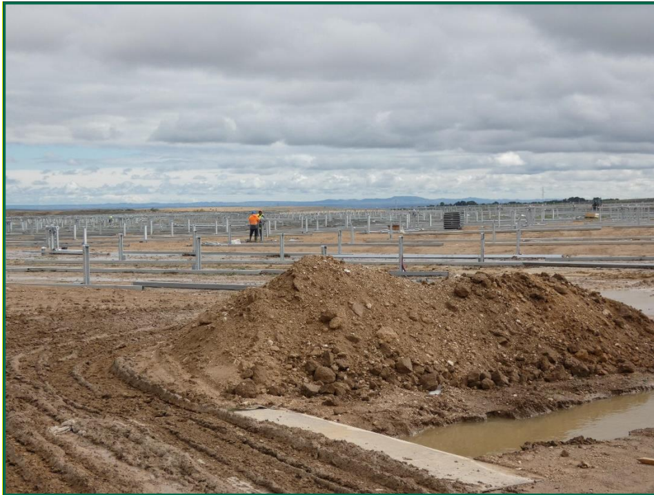
Fotografía 4. Acopios de tierra.