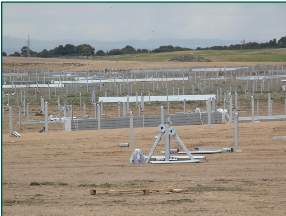
Fotografía 5. Colocación de postes verticales y horizontales para las placas fotovoltaicas.