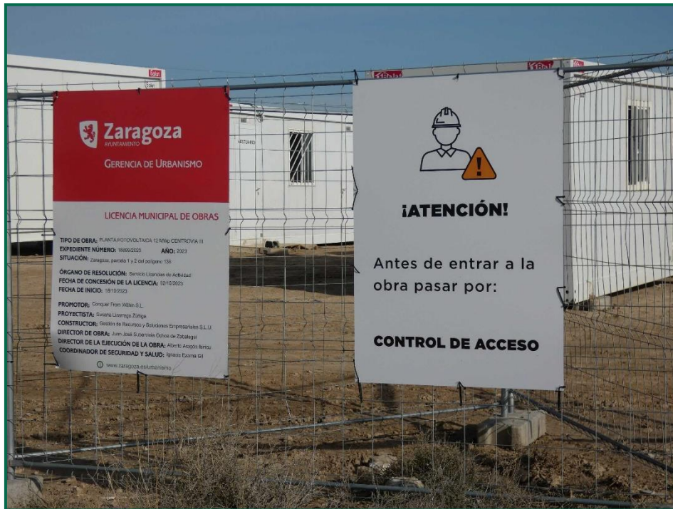
Fotografía 3. Carteles informativos.