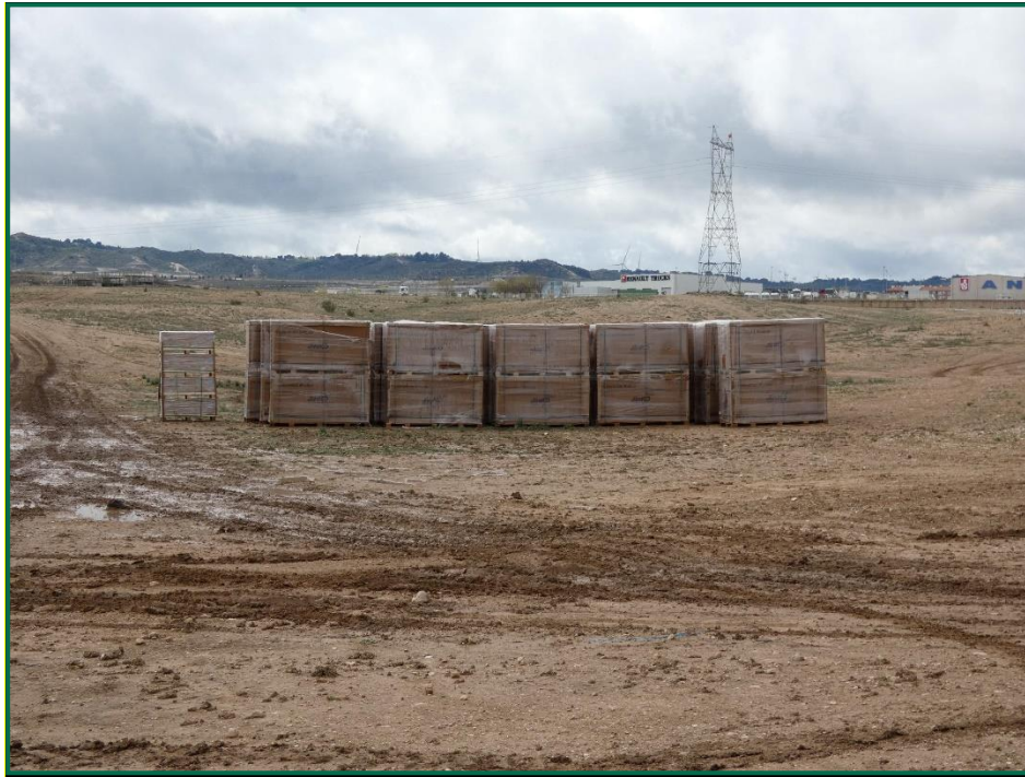
Fotografía 6. Materiales de obra