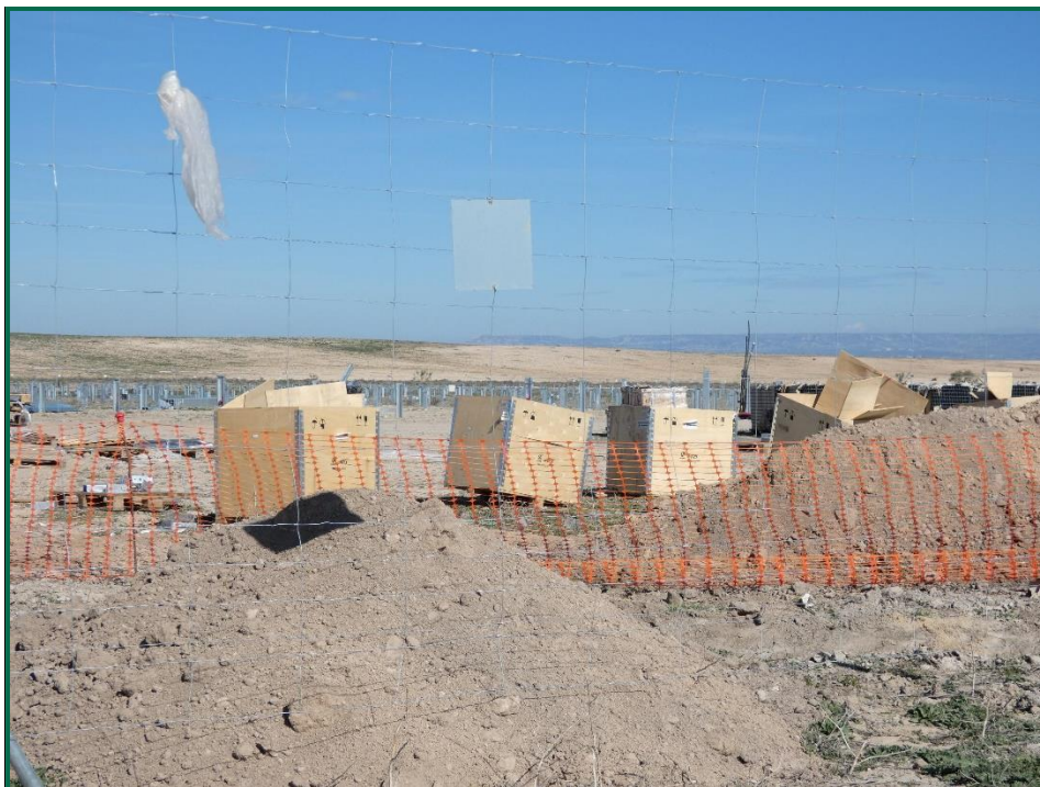
Fotografía 1. Balizado de la zanja de la línea de evacuación.

No se realiza el balizamiento de todo el perímetro de la obra ya que se generaría una gran cantidad de residuos de malla de obra o cinta que tiende a romperse y dispersarse por toda la zona. Sí se realiza un jalonamiento del perímetro mediante banderines y también se realiza un balizamiento del gasoducto y oleoducto. Además se realiza un balizamiento del patrimonio histórico-arqueológico. La Dirección Ambiental realiza un control visual continuado para comprobar que no se sobrepasan los límites de la zona de ocupación.