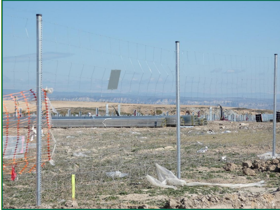
Fotografía 8. Placas anticolisión y restos de embalaje.