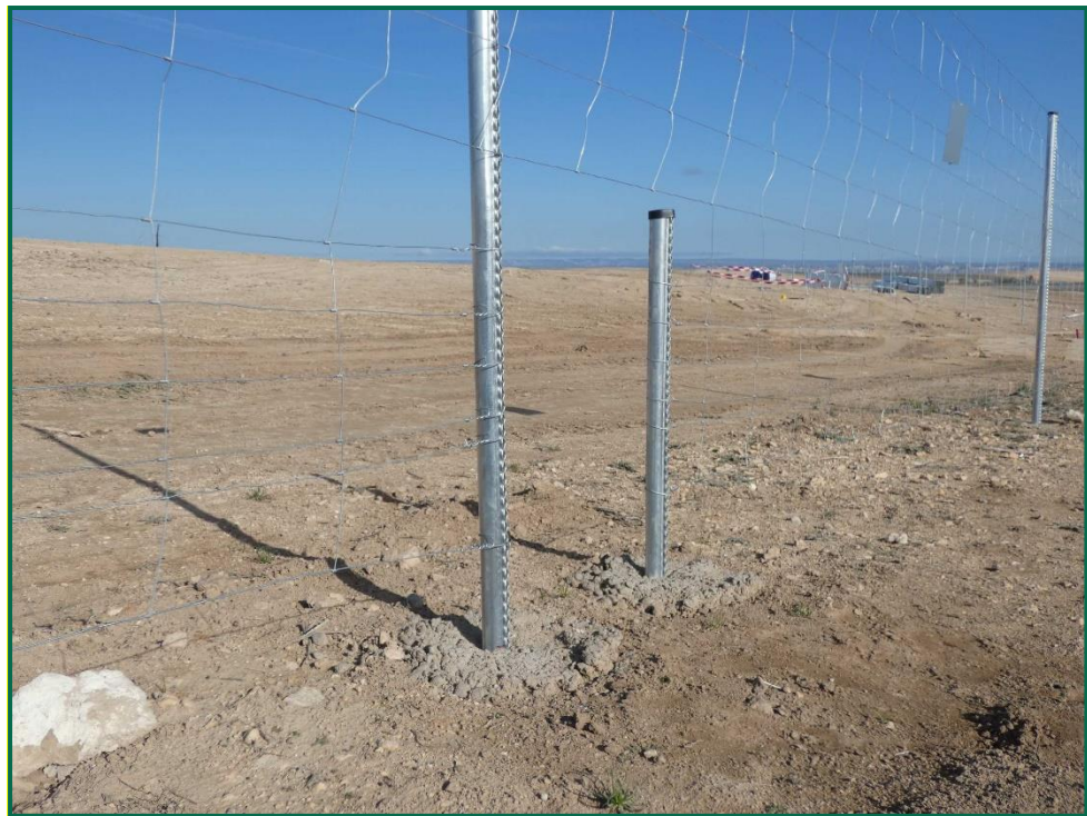
Fotografía 9. Espaciado cingético.