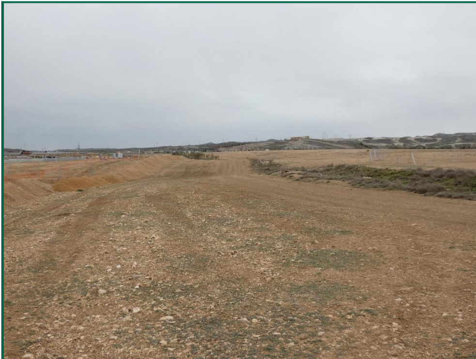
Fotografía 7. Franja vegetal, vallado perimetral y vegetación natural.