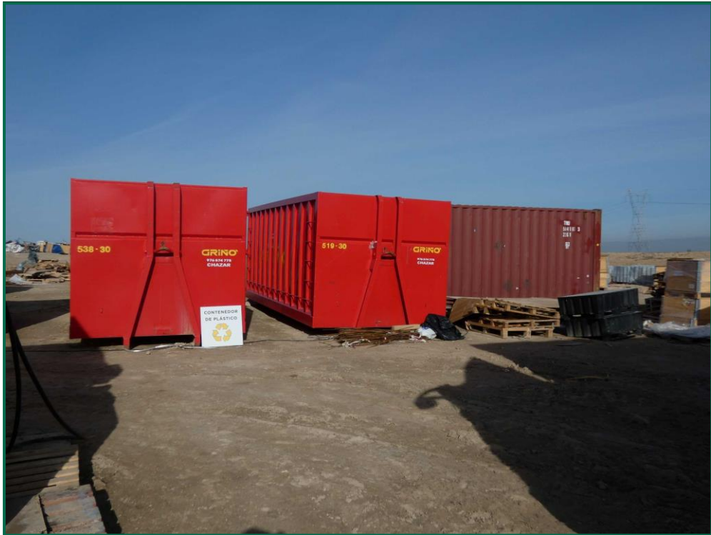
Fotografía 10. Contenedores de residuos.