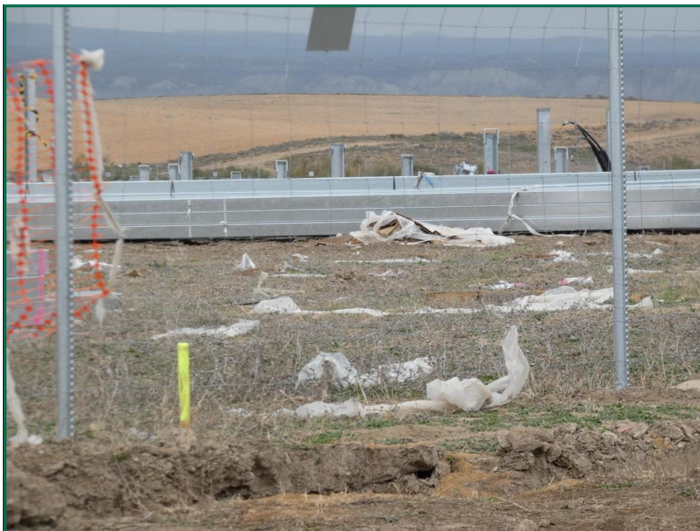
Fotografía 13. Restos de embalaje sobre el vallado.