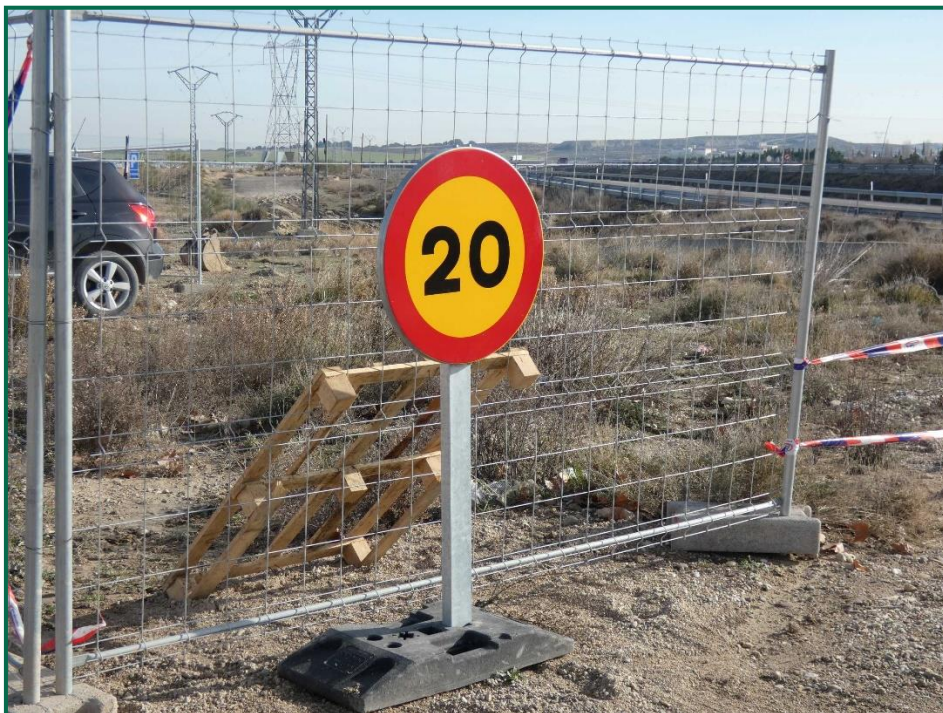
Fotografía 2. Señalización de velocidad.

El mes de febrero ha llovido con frecuencia por lo que no ha sido necesario el uso de la cubas de agua.