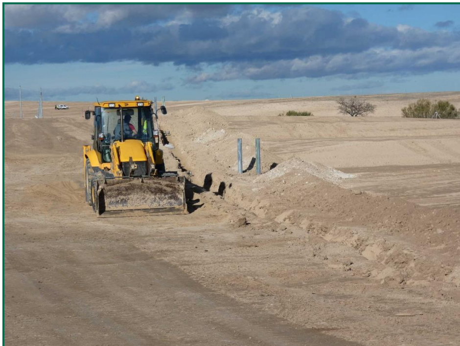
Fotografía 2. Maquinaria de construcción.