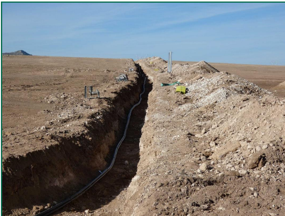
Fotografía 5. Zanjas y acopios de tierra.