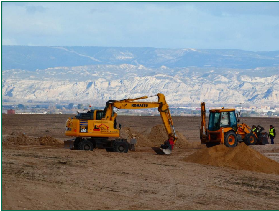
Fotografía 4. Máquina escavadora y acopios de tierra.