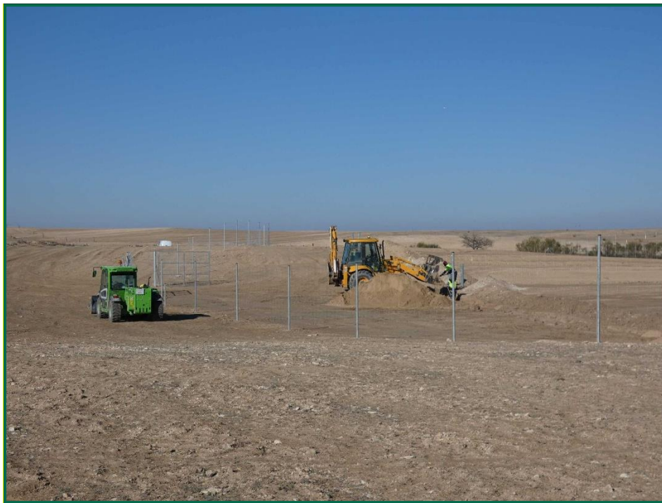
Fotografía 3. Tapado de zanjas.

Por el momento la tierra extraída durante la realización de zanjas ha sido colocada en acopios que posteriormente serán colocados en su respectivo lugar. Además, se ha homogenizado la superficie mediante el uso de traíllas y se han retirado las piedras de mayor tamaño.