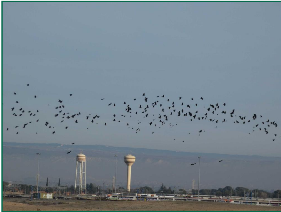
Fotografía 13. Chova piquirroja ( Pyrhocorax pyrrhocorax ).