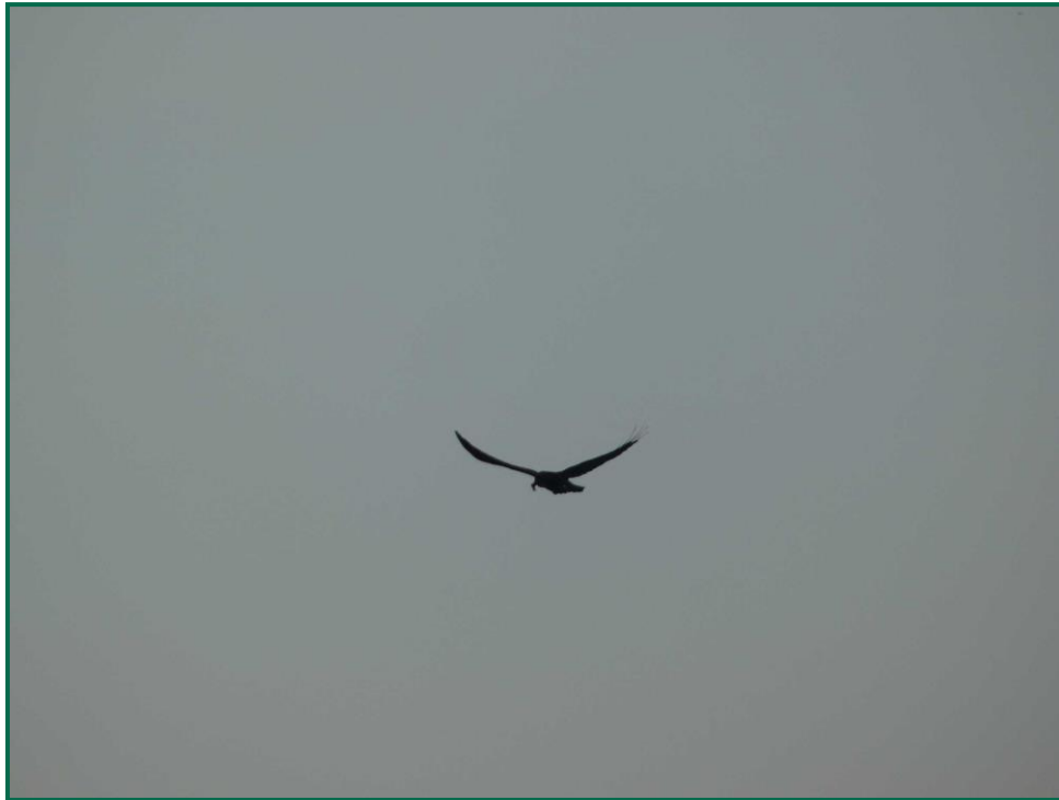
Fotografía 10. Cuervo grande ( Corvus corax ).

Se ha realizado seguimiento de avifauna durante el proceso de la obra, observándose las siguientes especies: busardo ratonero ( Buteo buteo ), corneja negra ( Corvus corone ) cuervo grande ( Corvus corax ), chova piquirroja ( Pyrrhocorax pyrrhocorax ), gavilán común ( Accipiter nisus ), aguilucho lagunero ( Circus aeruginosus ), abubilla común ( Upupa epops ), garza real ( Ardea cinerea ), gaviota patiamarilla ( Larus michaellis ) y otras especies como estornino negro ( Sturnus unicolor ) o urraca común ( Pica pica ) entre otras.