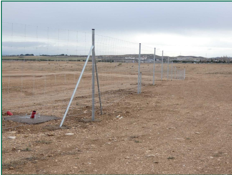
Fotografía 7. Franja vegetal y vallado perimetral.