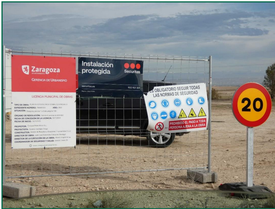
Fotografía 1. Señalización.