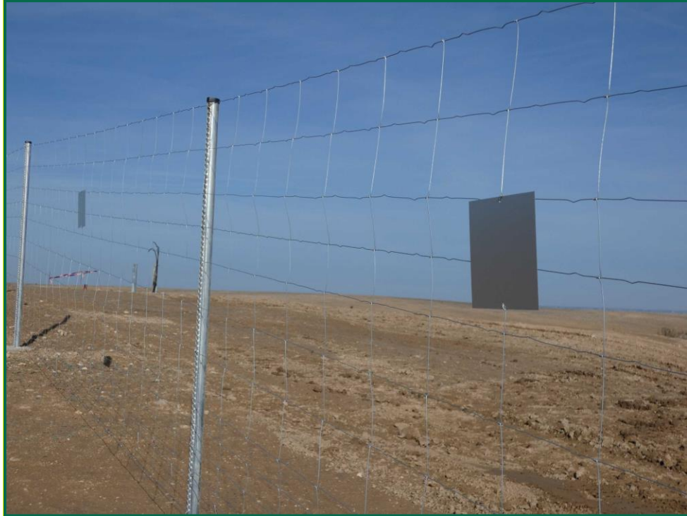
Fotografía 8. Placas anticolisión.