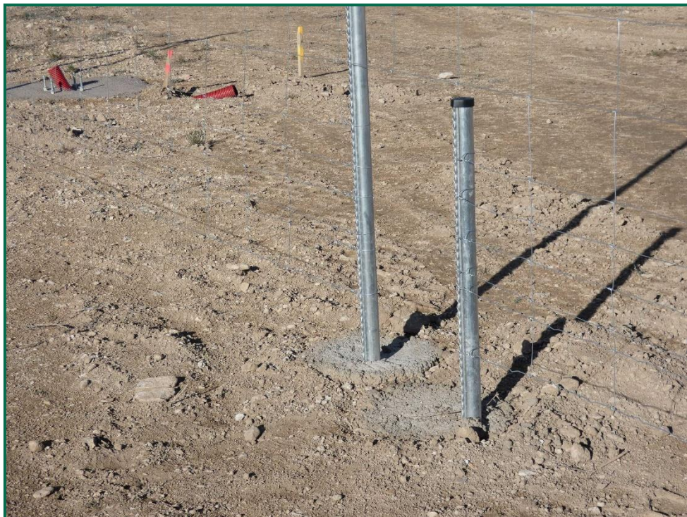
Fotografía 9. Espaciado cinético.