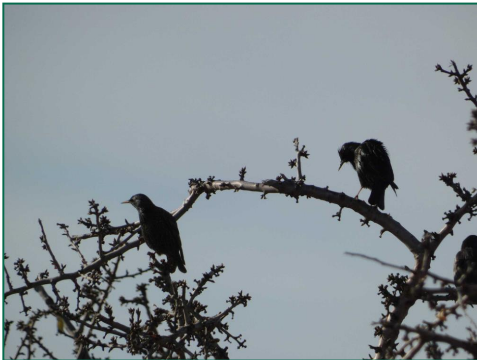
Fotografía 14. Estornino negro ( Sturnus unicolor ).