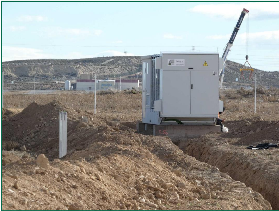
Fotografía 6. Colocación de caseta del inversor.