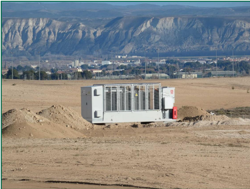
Fotografía 19. Caseta del inversor y equipo de extinción.

Se tiene en cuenta las disposiciones contenidas sobre protección y lucha en la campaña de incendios forestales de la Comunidad Autónoma de Aragón durante el año 2023. El Gobierno de Aragón ha adelantado el plan de prevención de incendios al 1 de mayo de 2023 cuando habitualmente es el 15 de junio.