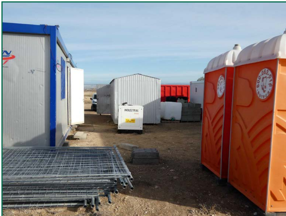
Fotografía 11. Vestuarios, servicios y materiales de obra.

Todavía no se han utilizado grupos electrógenos ni se han instalado envases de combustible, cuando se comiencen a utilizar se colocarán bandejas de contención debajo de ellos para evitar derrames por pérdidas accidentales sobre el terreno.