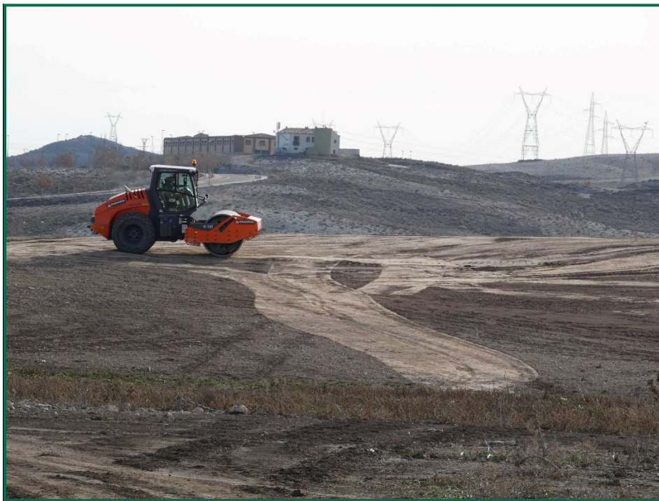
Fotografía 3. Allanado del terreno.

Por el momento la tierra extraída durante la realización de zanjas ha sido colocada en acopios que posteriormente serán colocados en su respectivo lugar. Además, se ha homogenizado la superficie mediante el uso de traíllas y se han retirado las piedras de mayor tamaño.