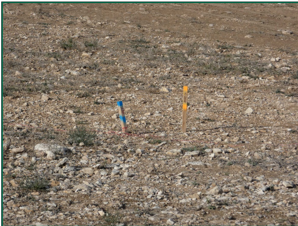
Fotografía 1. Jalonamiento.

No se realiza el balizamiento de todo el perímetro de la obra ya que se generaría una gran cantidad de residuos de malla de obra o cinta que tiende a romperse y dispersarse por toda la zona. Sí se realiza un jalonamiento del perímetro mediante banderines y también se realiza un balizamiento del gasoducto y oleoducto. Además se realiza un balizamiento del patrimonio histórico-arqueológico. La Dirección Ambiental realiza un control visual continuado para comprobar que no se sobrepasan los límites de la zona de ocupación.