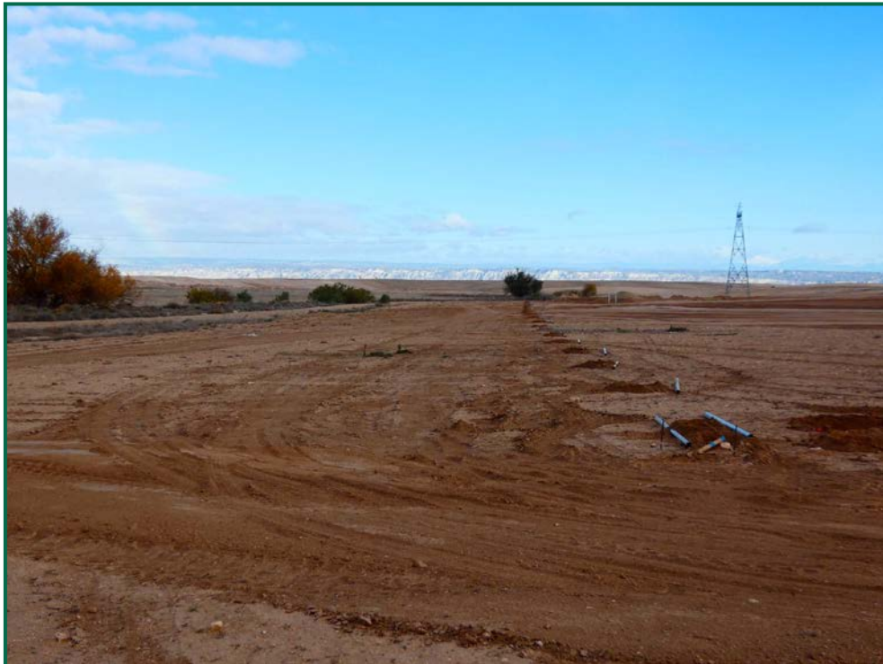
Fotografía 7. Franja vegetal.