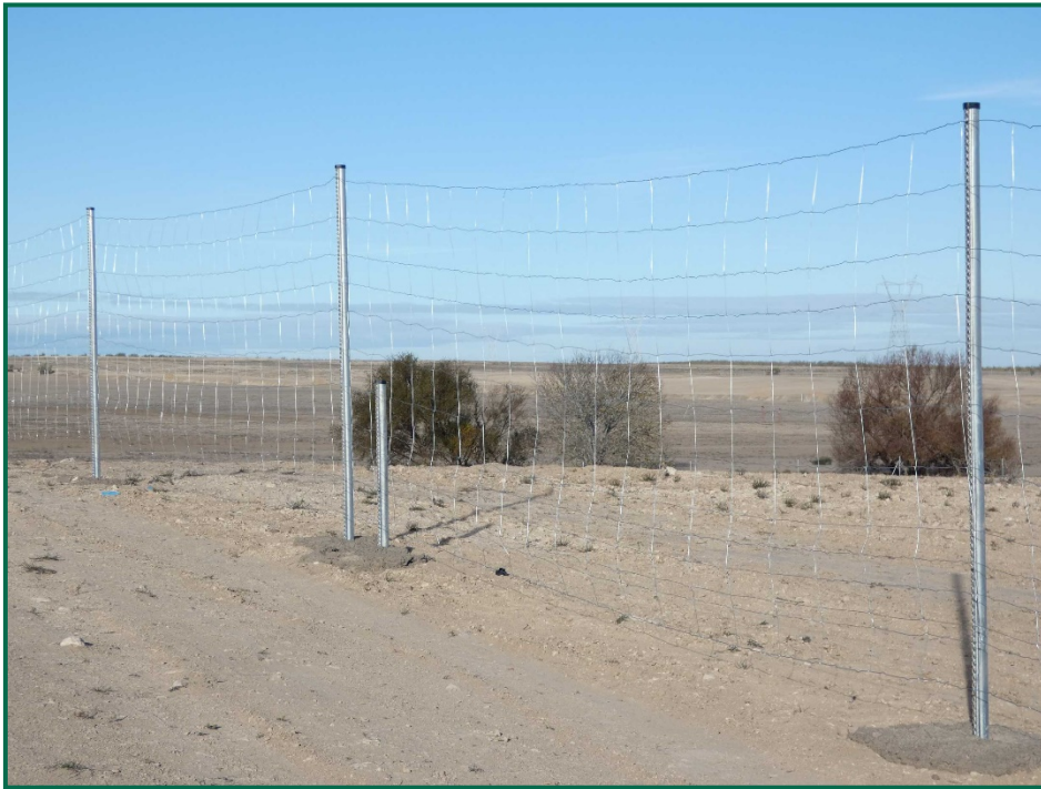
Fotografía 6. Vallado perimetral.