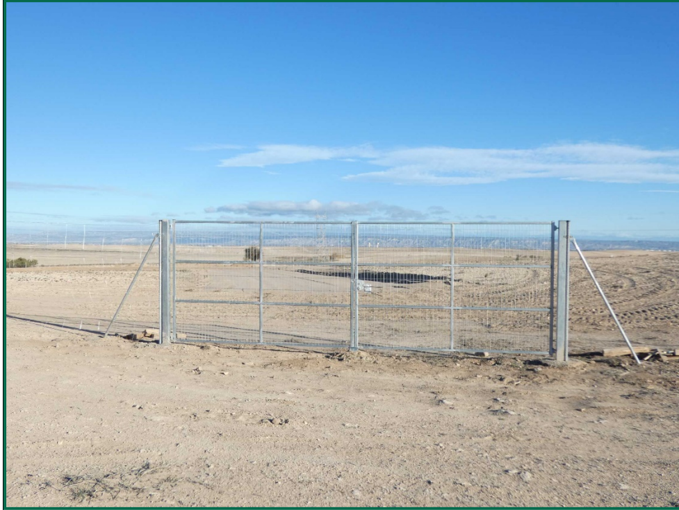
Fotografía 8. Puerta de acceso.

Se ha realizado seguimiento de avifauna durante el proceso de la obra, observándose las siguientes especies: milano real ( Milvus milvus ), busardo ratonero ( Buteo buteo ), corneja negra ( Corvus corone ) cuervo grande ( Corvus corax ), perdiz roja ( Alectoris rufa ), y otras especies como estornino negro ( Sturnus unicolor ) o urraca común ( Pica pica ) entre otras.