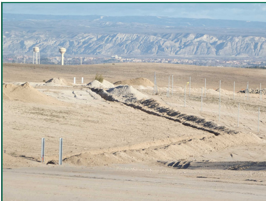
Fotografía 5. Postes y zanjas para los inversores.