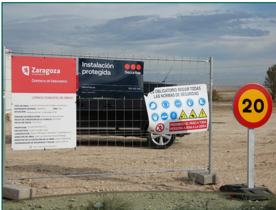
Fotografía 2. Señalización.

Durante las visitas a obra no se constata afección por emisión de polvo significativa durante los trabajos, en parte debido a la climatología del mes objeto de este informe que ha sido lluvioso. Se prevé humedecer los caminos cuando las circunstancias lo requieran con la presencia de una cuba esparciendo agua por el terreno.