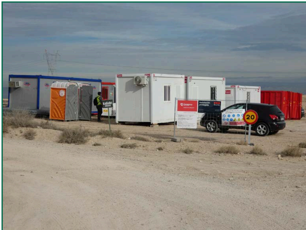
Fotografía 16. Vestuarios, servicios y contenedores de residuos.

Todavía no se han utilizado grupos electrógenos ni se han instalado envases de combustible, cuando se comiencen a utilizar se colocarán bandejas de contención debajo de ellos para evitar derrames por pérdidas accidentales sobre el terreno.