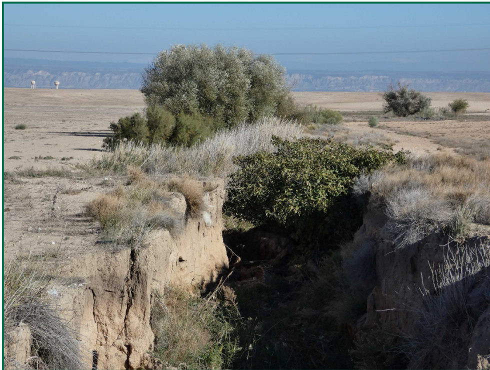
Fotografía 10. Vegetación natural.

Durante las visitas a obra se comprueba que la ocupación de zonas de vegetación se limita a lo aprobado en el proyecto. Se verifica también que la maquinaria circula únicamente por los viales habilitados para tal fin. Desde el inicio de las obras se ha planificado la ejecución de una franja vegetal de 8 m de anchura en torno al futuro vallado perimetral.