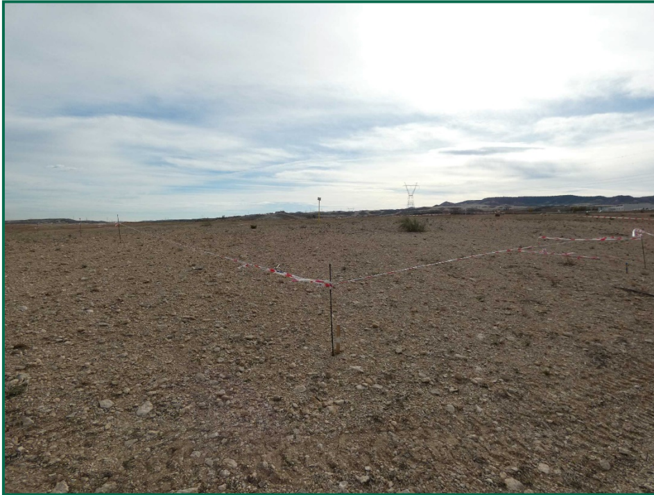
Fotografía 4. Balizamiento gasoducto.