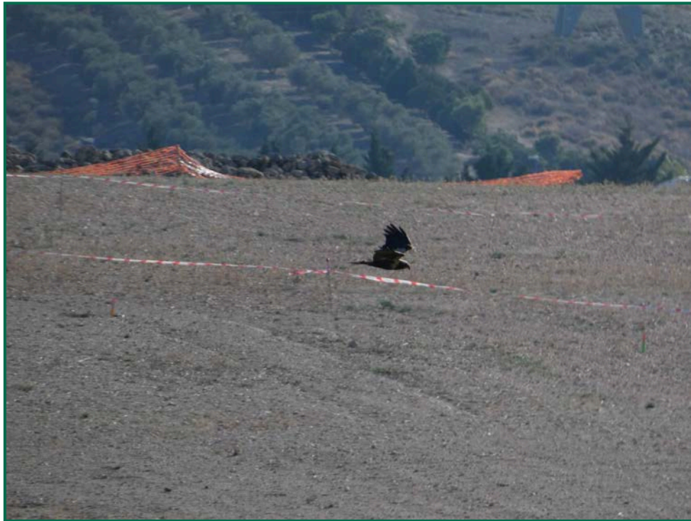
Fotografía 14. Aguilucho lagunero ( Circus aeruginosus ).