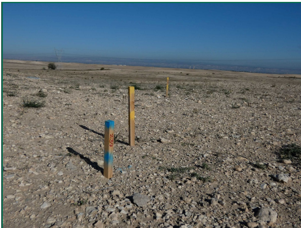
Fotografía 1. Jalonamiento.

No se realiza el balizamiento de todo el perímetro de la obra ya que se generaría una gran cantidad de residuos de malla de obra o cinta que tiende a romperse y dispersarse por toda la zona. Sí se realiza un jalonamiento del perímetro mediante banderines y también se realiza un balizamiento del gasoducto y oleoducto. Además se realiza un balizamiento del patrimonio histórico-arqueológico. La Dirección Ambiental realiza un control visual continuado para comprobar que no se sobrepasan los límites de la zona de ocupación.