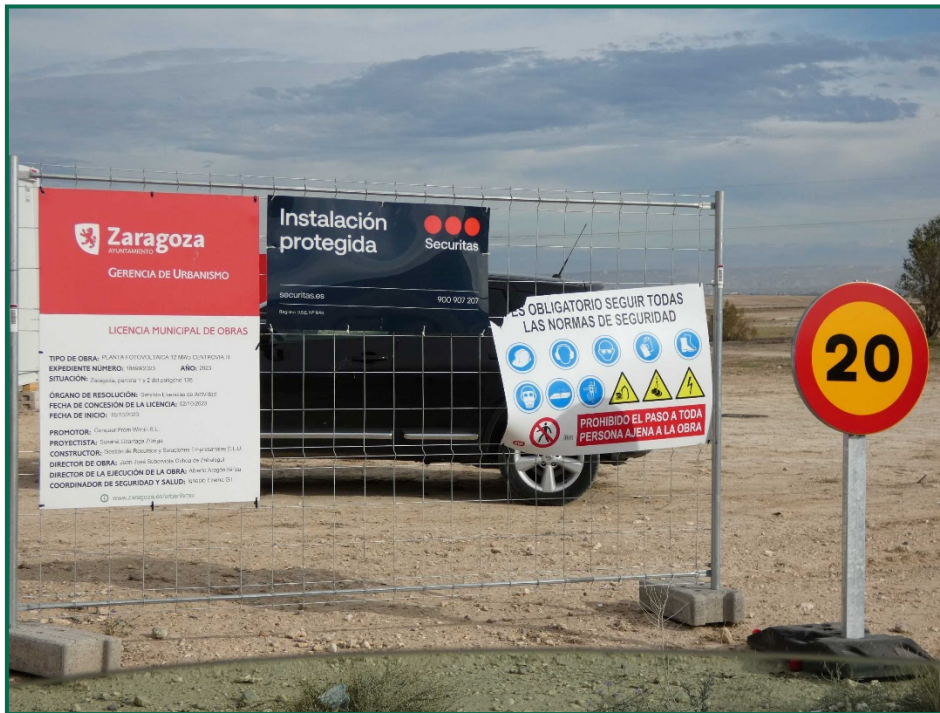
Fotografía 5. Señalización.