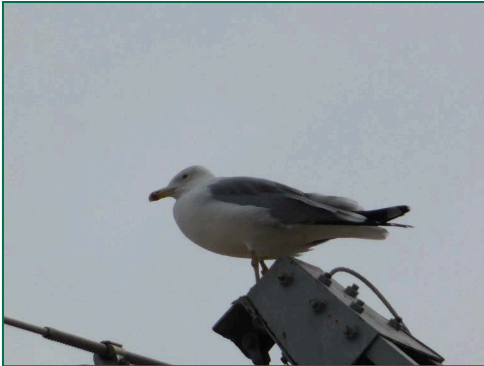
Fotografía 12. Gaviota patiamarilla ( Larus michaellis ).