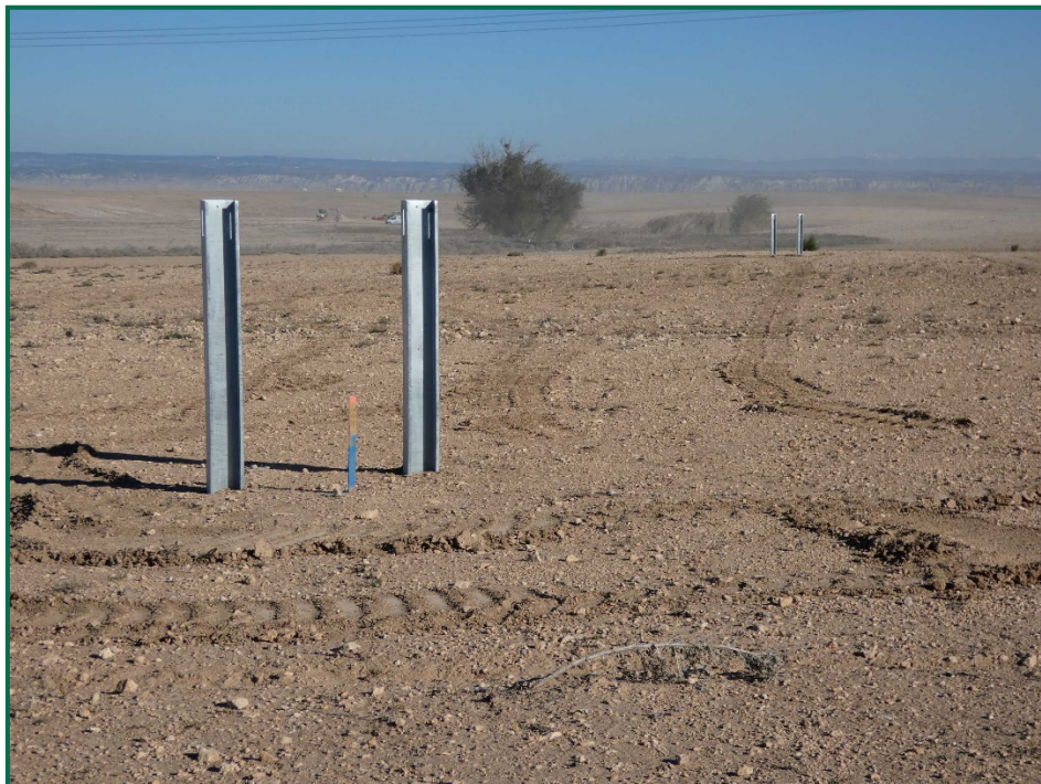
Fotografía 9. Postes para los inversores.