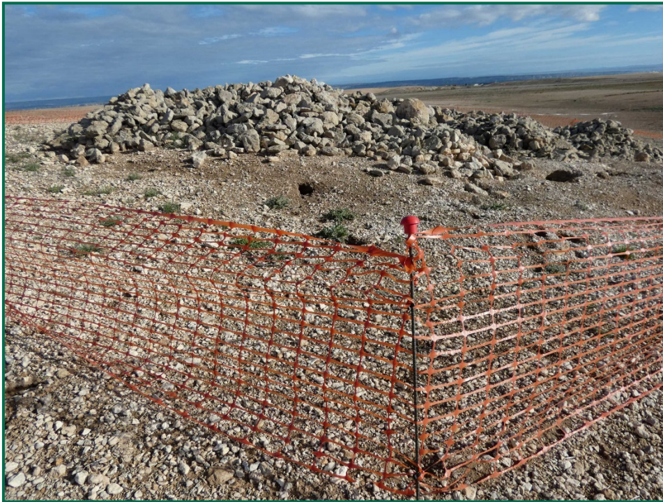
Fotografía 2. Balizamiento del patrimonio histórico-arqueológico.