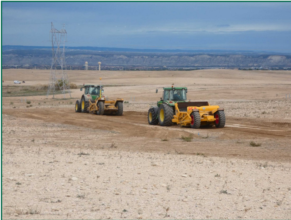
Fotografía 8. Maquinaria para allanar.