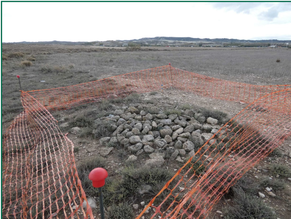
Fotografía 3. Balizamiento del patrimonio histórico-arqueológico.