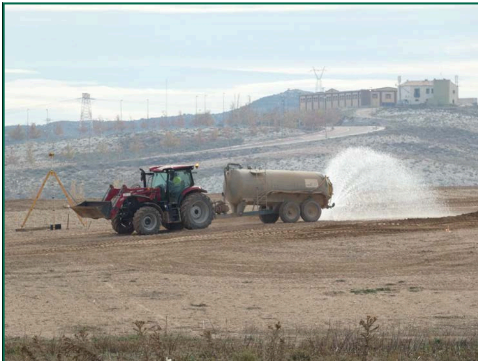
Fotografía 6. Cuba de agua.