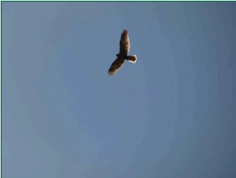
Fotografía 13. Busardo ratonero ( Buteo buteo ).