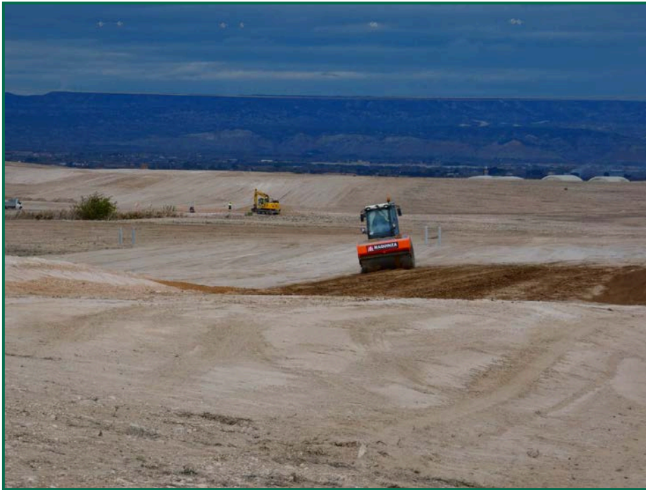
Fotografía 7. Allanado del terreno.

Por el momento apenas se ha extraído tierra debido a que el terreno es llano y no es necesario nivelarlo, se ha homogenizado la superficie mediante el uso de traíllas y se han retirado las piedras de mayor tamaño.