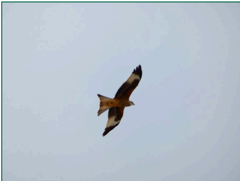
Fotografía 15. Milano real ( Milvus milvus ).