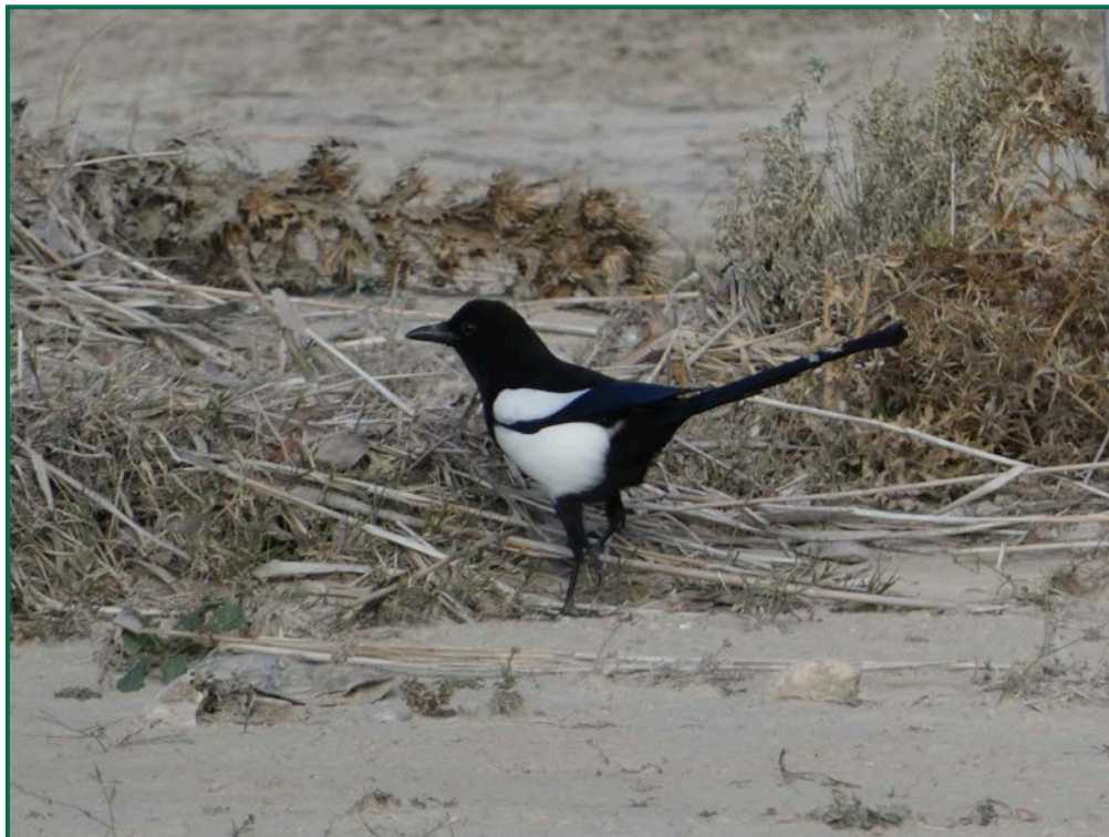
Fotografía 11. Urraca común ( Pica pica ).

Se ha realizado seguimiento de avifauna durante el proceso de la obra, observándose las siguientes especies: milano real ( Milvus milvus ) en desplazamiento, busardo ratonero ( Buteo buteo ) ciclando por los alrededores, corneja negra ( Corvus corone ) sobrevolando el terreno, aguilucho lagunero ( Circus aeruginosus ) en prospección, gaviota patiamarilla ( Larus michaellis ) posada en los alrededores, y otras especies como estornino negro ( Sturnus unicolor ) o urraca común ( Pica pica ).