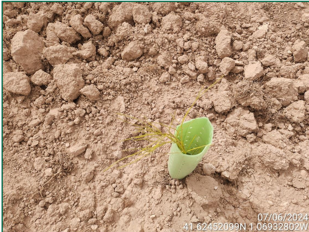
Fotografía 19. Retama.