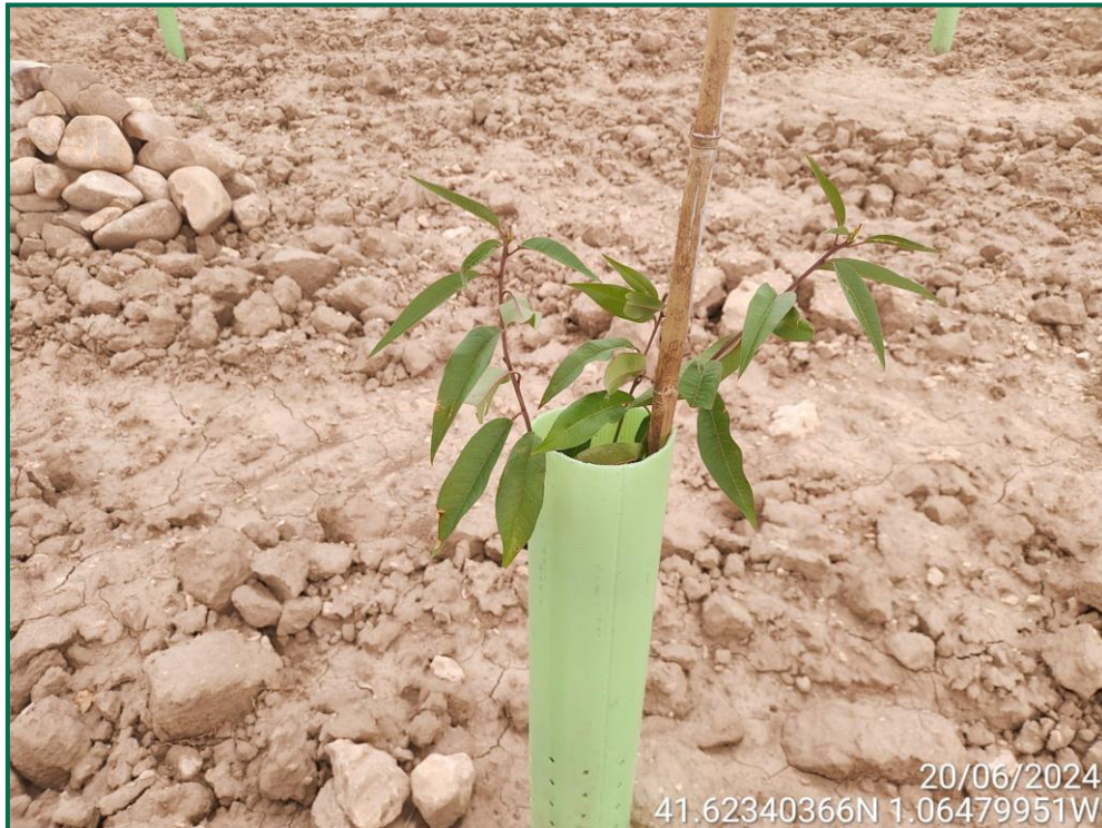
Fotografía 16. Almendro.

En los lugares donde no se puede realizar una pantalla cumpliendo con los retranqueos previstos en la normativa respecto a caminos u otros, se ha reducido la anchura excepcionalmente y en esas zonas se ha realizado la plantación de otras plantas que permiten la plantación más próxima unas de otras como retama, olivo y romero.