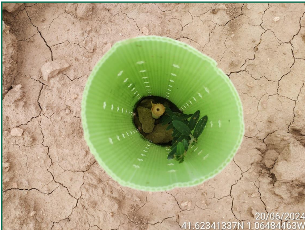
Fotografía 18. Olivo.