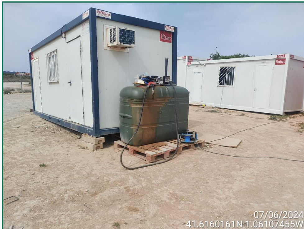
Fotografía 13. Depósito de combustible.