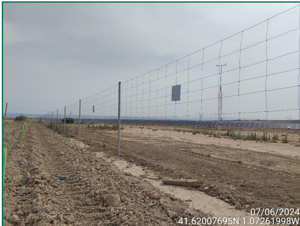
Fotografía 7. Placas anticolisión y vallado perimetral.