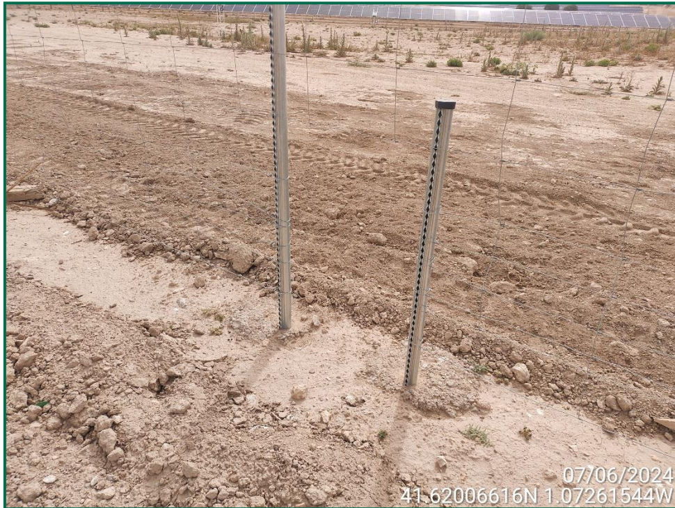
Fotografía 6. Pasos de fauna y espaciado cinegético.

Durante este mes se han colocado en distintas zonas postes que sirven como posadero para rapaces de pequeño y mediano tamaño. Se han recibido los hoteles de insectos que serán colocados próximamente.