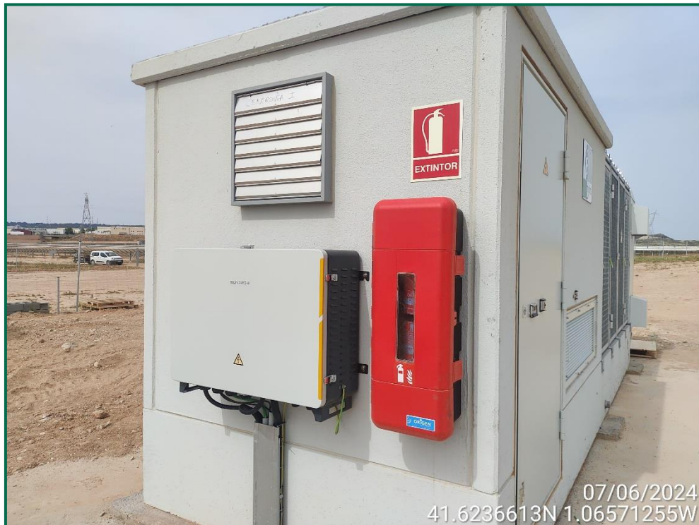
Fotografía 22. Extintor en la caseta del inversor.