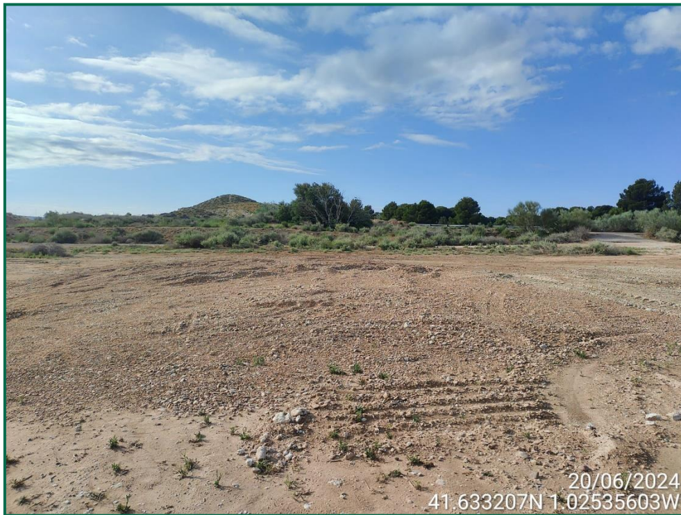
Fotografía 23. Final de la línea de evacuación y vegetación natural.