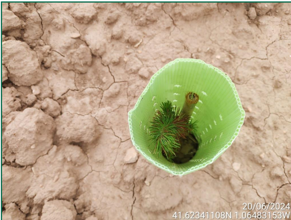
Fotografía 20. Romero y tutor de bambú.