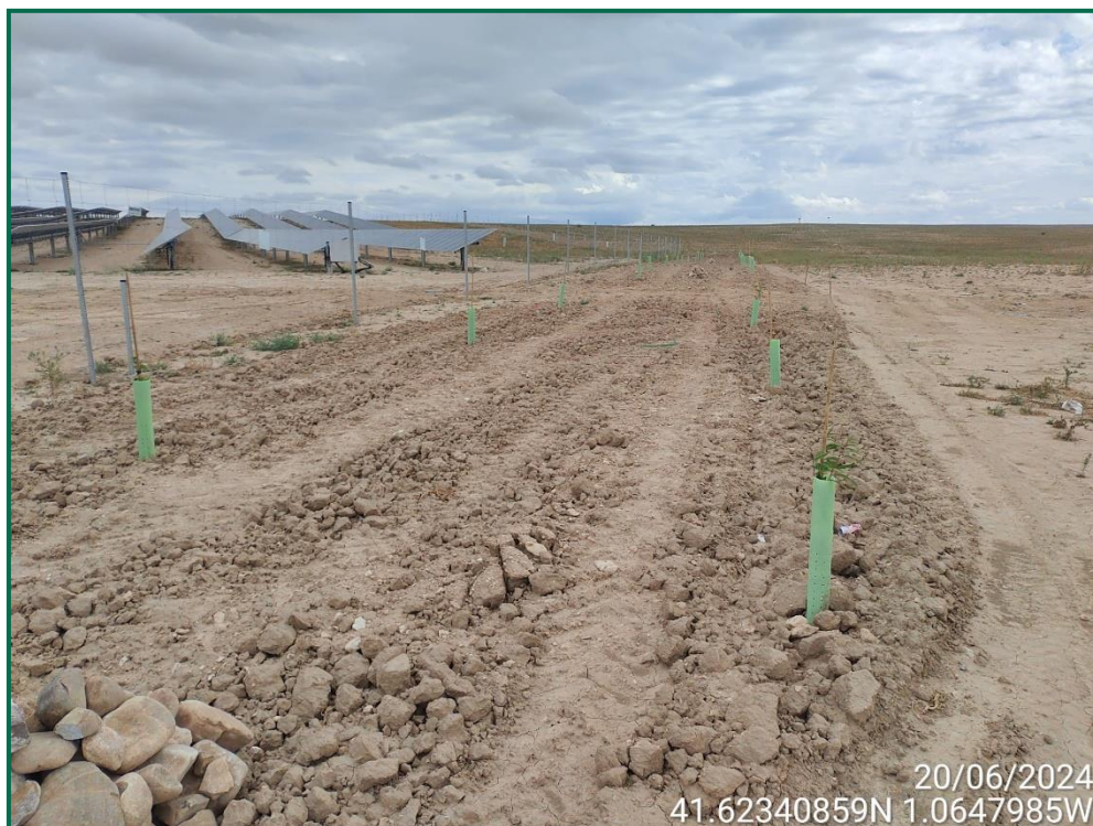
Fotografía 15. Franja vegetal con plantación de almendros.

Se ha realizado una pantalla vegetal en todo el perímetro a excepción de la zona del perímetro que colinda con zonas urbanizadas. Se han plantado mayoritariamente almendros al tresbolillo y la separación recomendada para su correcto crecimiento.