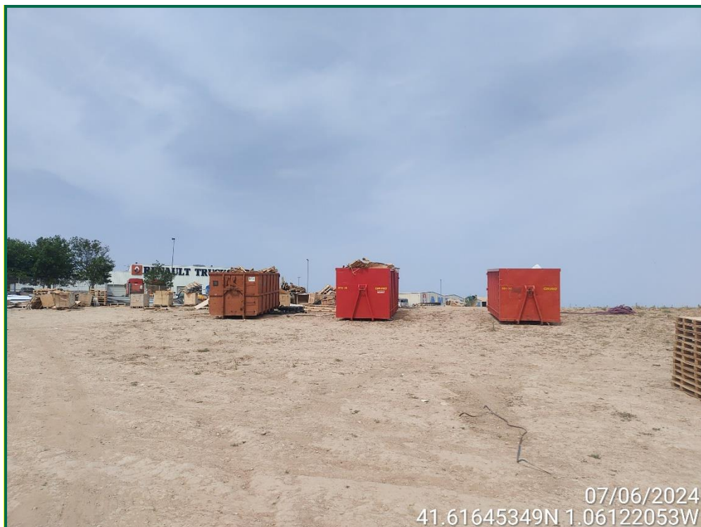
Fotografía 10. Contenedores de residuos.

Se están utilizando grupos electrógenos y se han instalado envases de combustible. Además, se han colocado bandejas de contención debajo de ellos para evitar derrames por pérdidas accidentales sobre el terreno.