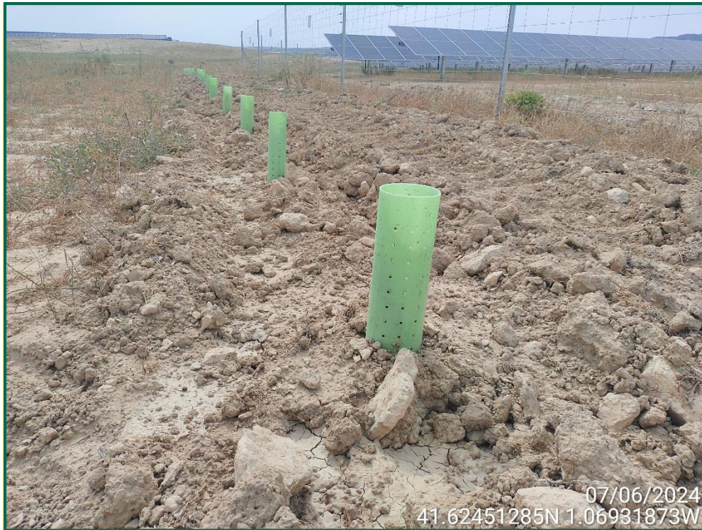
Fotografía 21. Tubo protector.

Para garantizar su crecimiento se ha realizado y seguirá realizando riegos de apoyo. Además, todas las plantas se han colocado con tutor para facilitar el buen crecimiento y han sido provistas de un tubo protector de 30cm de altura tutor de caña de bambú.