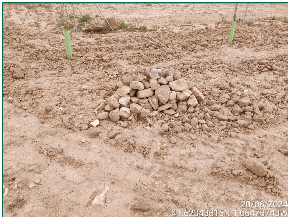
Fotografía 8. Majano para reptiles.