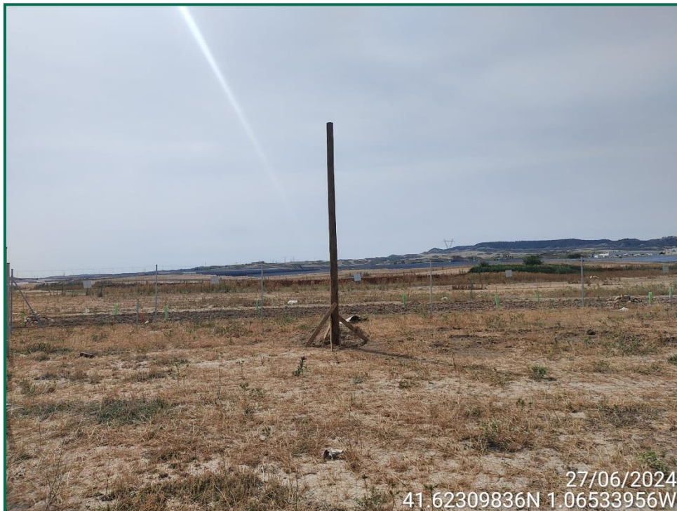
Fotografía 9. Posaderos para rapaces.

Se ha realizado seguimiento de avifauna durante el proceso de la obra, observándose las siguientes especies: busardo ratonero ( Buteo buteo ), corneja negra ( Corvus corone ) cuervo grande ( Corvus corax ), chova piquirroja ( Pyrrhocorax pyrrhocorax ), aguilucho lagunero ( Circus aeruginosus ), milano negro ( Milvus migrans ), buitre leonado ( Gyps fulvus ), culebrera europea ( Circaetus gallicus ), gaviota patiamarilla ( Larus michaellis ), anade azulón ( Anas platyrhynchos ), pato colorado ( Netta rufina ), garza real ( Ardea cinerea ), zampullín común ( Tachybaptus ruficollis ). También otras especies como estornino negro ( Sturnus unicolor ), abubilla común ( Upupa epops ), urraca común ( Pica pica ) y diversos alaudidos. Por otro lado se ha observado la presencia de un primillar cercano que se encuentra a más de 3 km de la obra.