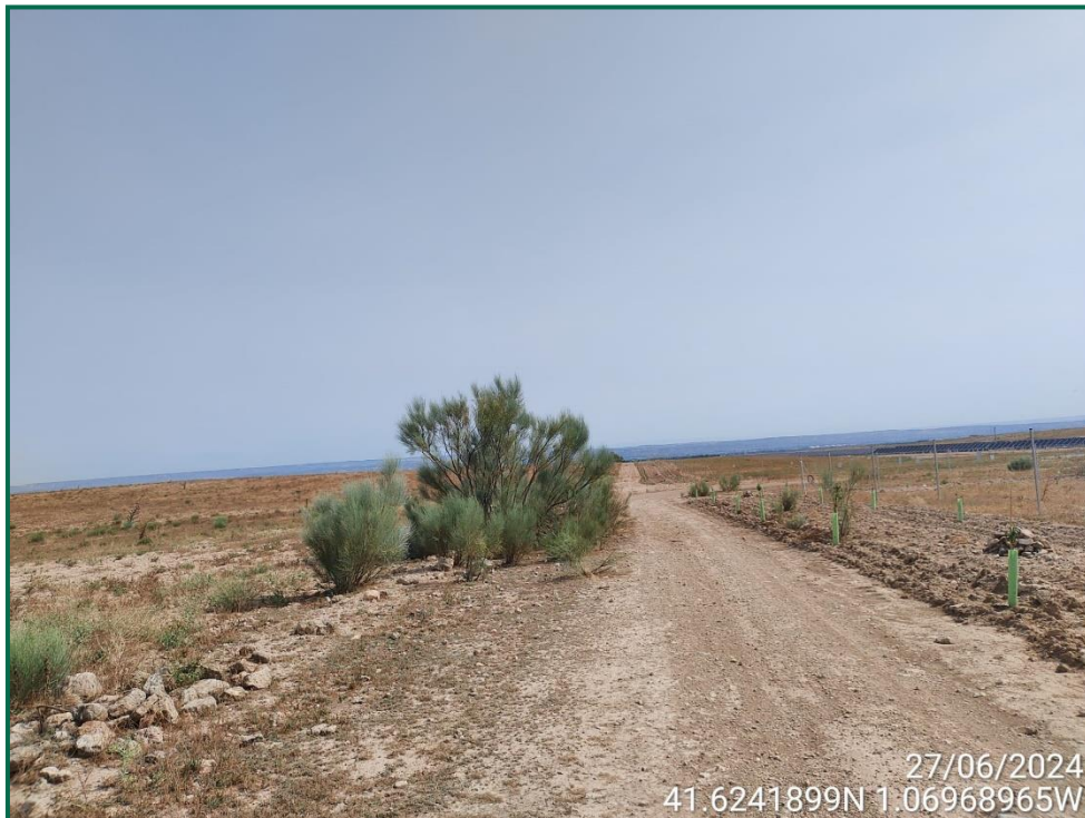
Fotografía 5. Vegetación natural.