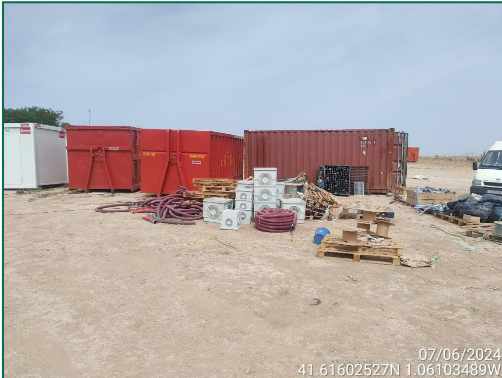
Fotografía 11. Contenedores de residuos y restos de materiales.