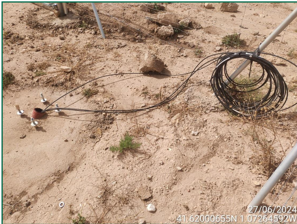
Fotografía 4. Cableado para las cámaras de vigilancia.