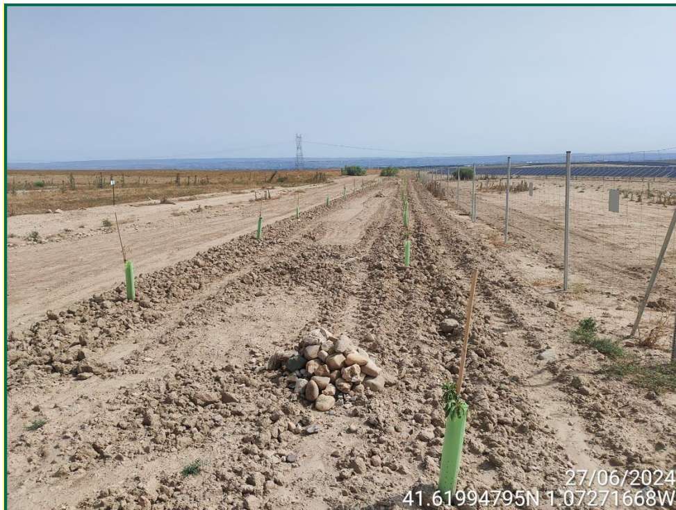
Fotografía 3. Arado de la pantalla vegetal.

Por el momento la tierra vegetal extraída ha sido escasa debido a que no ha sido necesario nivelar todo el terreno, únicamente algunas zonas y con un espesor limitado, y esta se ha ido extendiendo sobre el terreno. La tierra extraída para la construcción de balsas de limpieza se ha acopiado en caballones al igual que la tierra retirada para realizar zanjas. En las zonas donde se han realizado plantaciones para crear una pantalla vegetal el terreno ha sido arado.