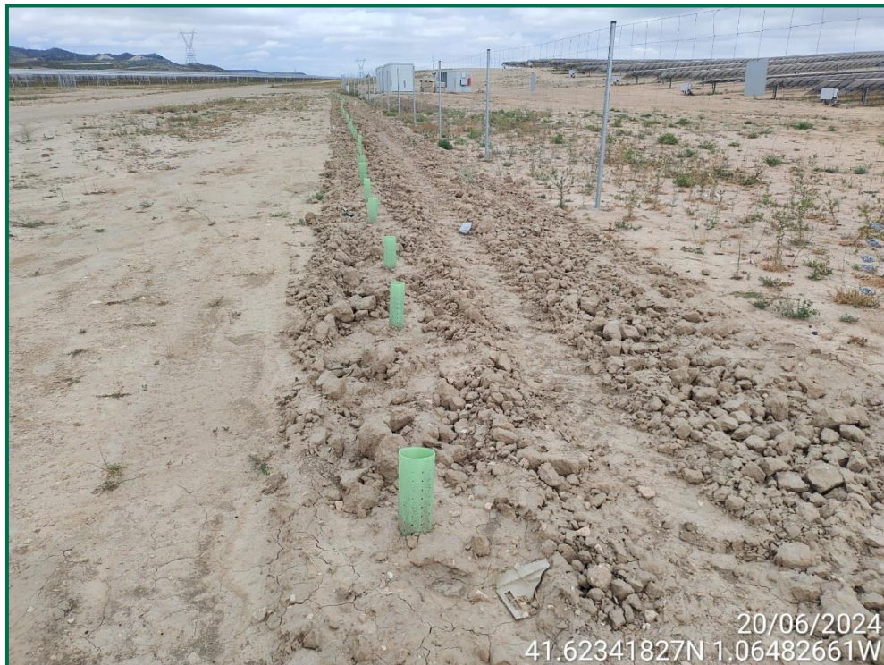
Fotografía 17. Plantación de olivos, retamas y romeros.