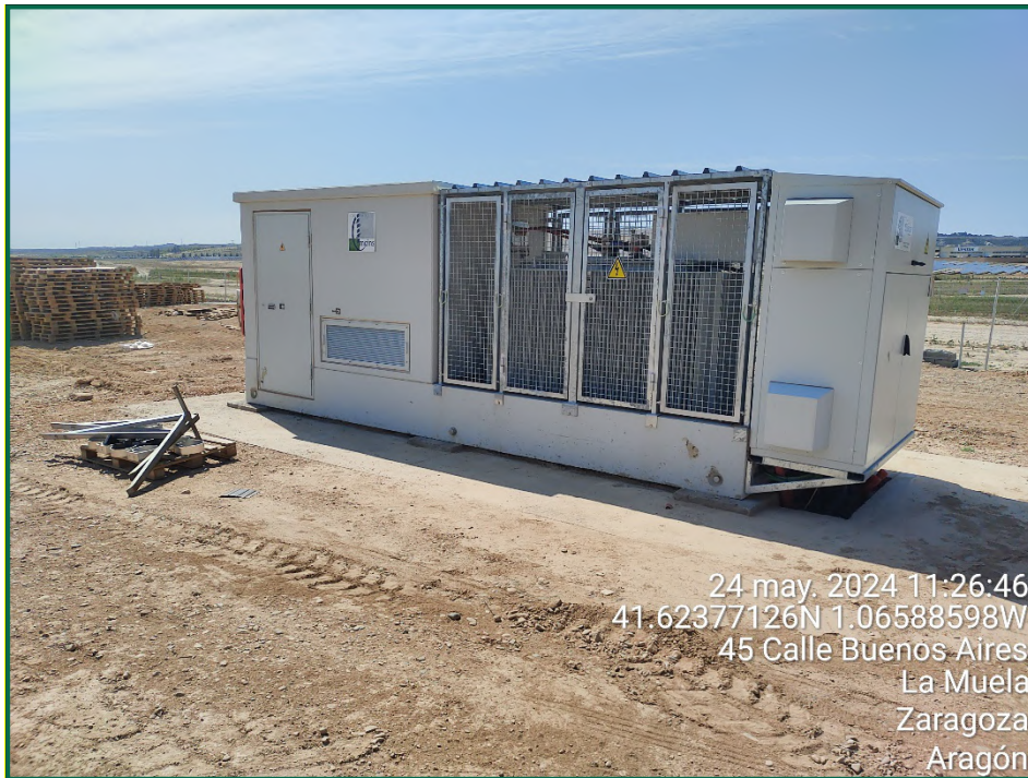
Fotografía 6. Estructura del inversor.