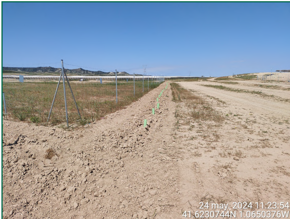
Fotografía 21. Plantación de olivos, retamas y romeros.

En los lugares donde no se puede realizar una pantalla cumpliendo con los retranqueos previstos en la normativa respecto a caminos u otros, se ha reducido la anchura excepcionalmente y en esas zonas se ha realizado la plantación de otras plantas que permiten la plantación más próxima unas de otras como retama, olivo y romero.