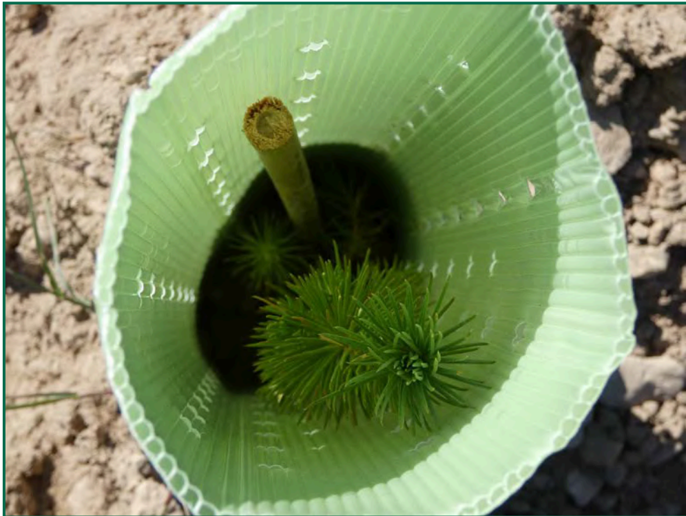
Fotografía 24. Romero y tutor de bambú.

Para garantizar su crecimiento se ha realizado y seguirá realizando riegos de apoyo. Además, todas las plantas se han colocado con tutor para facilitar el buen crecimiento y han sido provistas de un tubo protector de 30cm de altura tutor de caña de bambú.