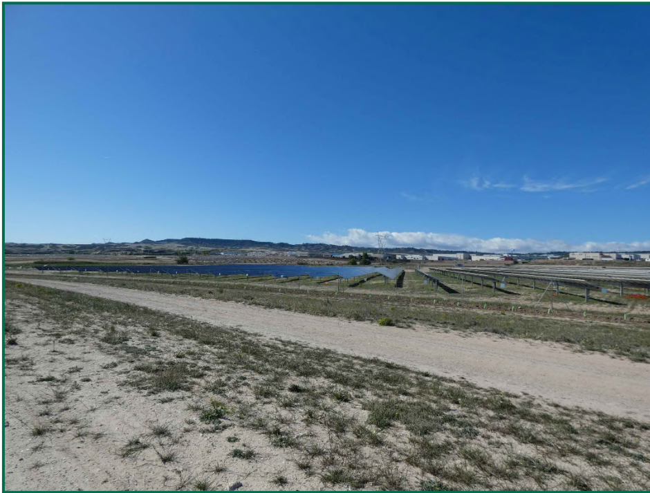
Fotografía 3. Superficie de la planta.