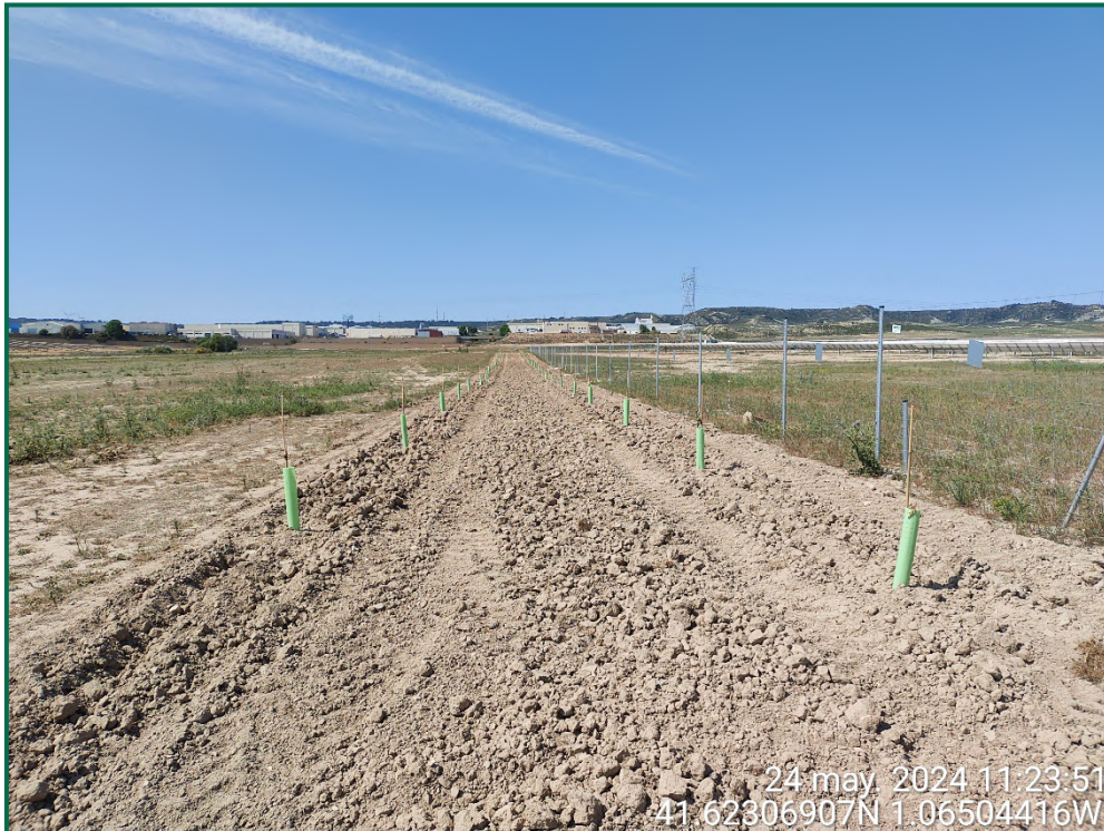
Fotografía 19. Franja vegetal con plantación de almendros.