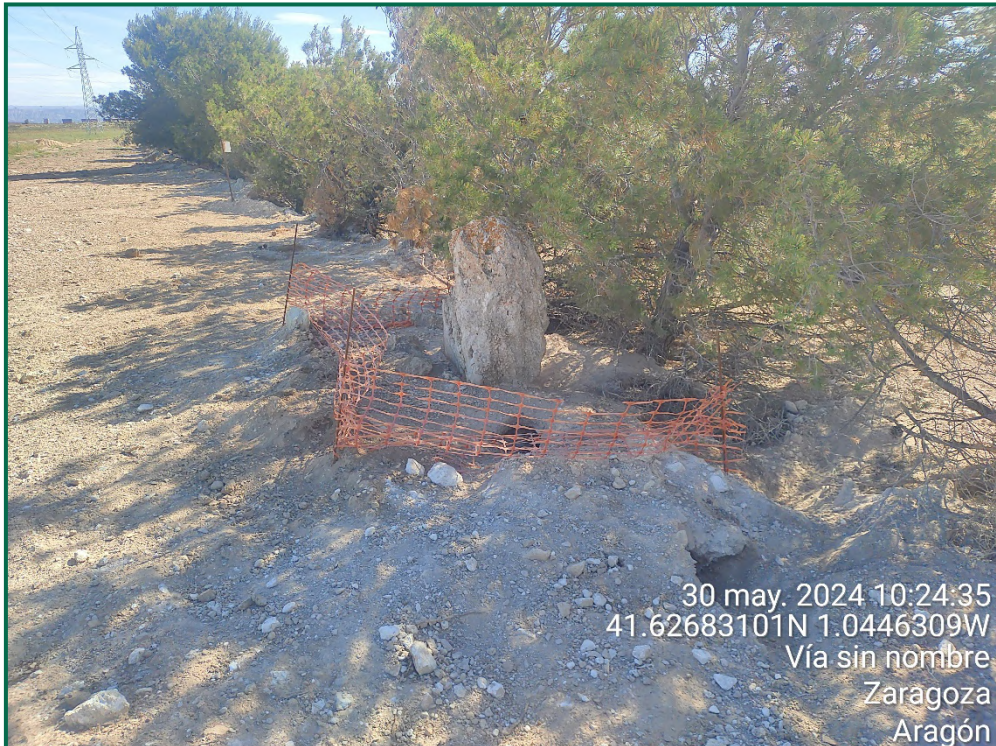
Fotografía 27. Balizamiento de madrigueras.