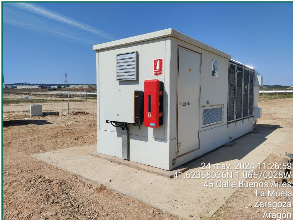
Fotografía 26. Extintor en la caseta del inversor.