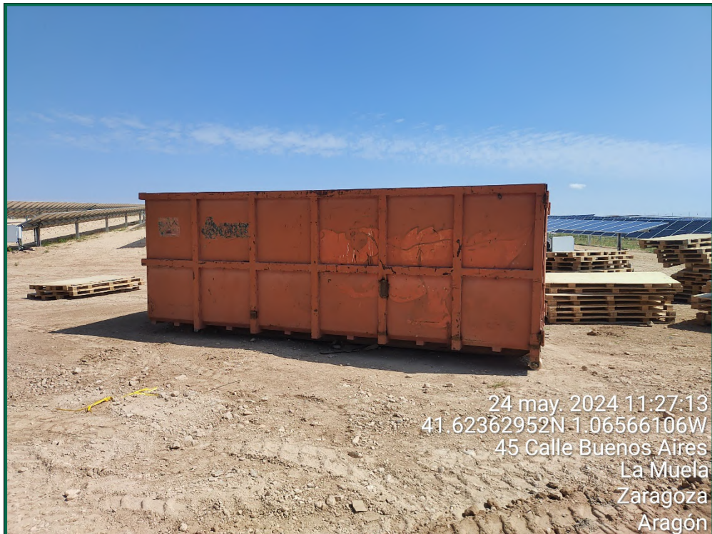
Fotografía 14. Contenedores de residuos.