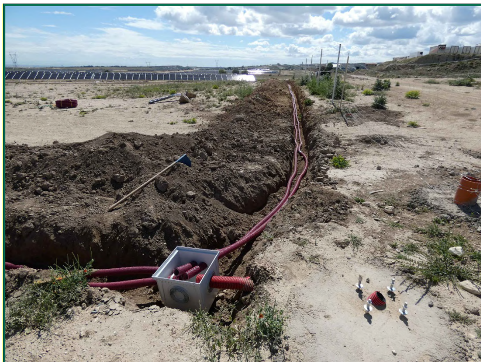
Fotografía 5. Colocación de cableado para las cámaras de vigilancia.