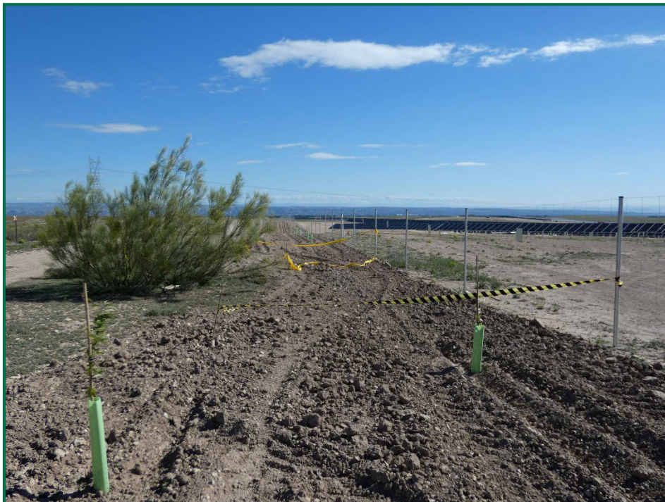
Fotografía 1. Balizamiento de vegetación natural.

No se realiza el balizamiento de todo el perímetro de la obra ya que se generaría una gran cantidad de residuos de malla de obra o cinta que tiende a romperse y dispersarse por toda la zona. Sí se realiza un jalonamiento del perímetro mediante banderines y también se realiza un balizamiento del gasoducto y oleoducto. La Dirección Ambiental realiza un control visual continuado para comprobar que no se sobrepasan los límites de la zona de ocupación.