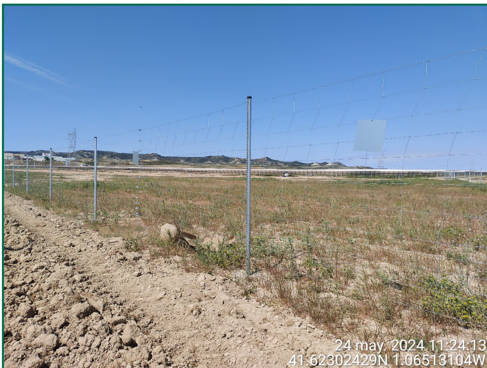
Fotografía 9. Placas anticoliisión y vallado perimetral.