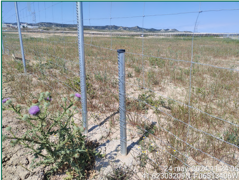
Fotografía 8. Espaciado cinético.