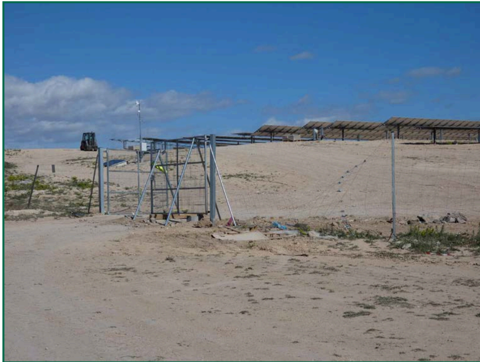
Fotografía 10. Arreglo de puerta de acceso.