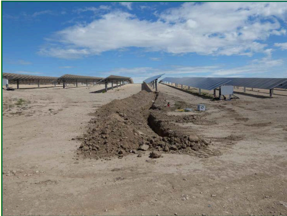
Fotografía 4. Zanjas y acopios de tierra.