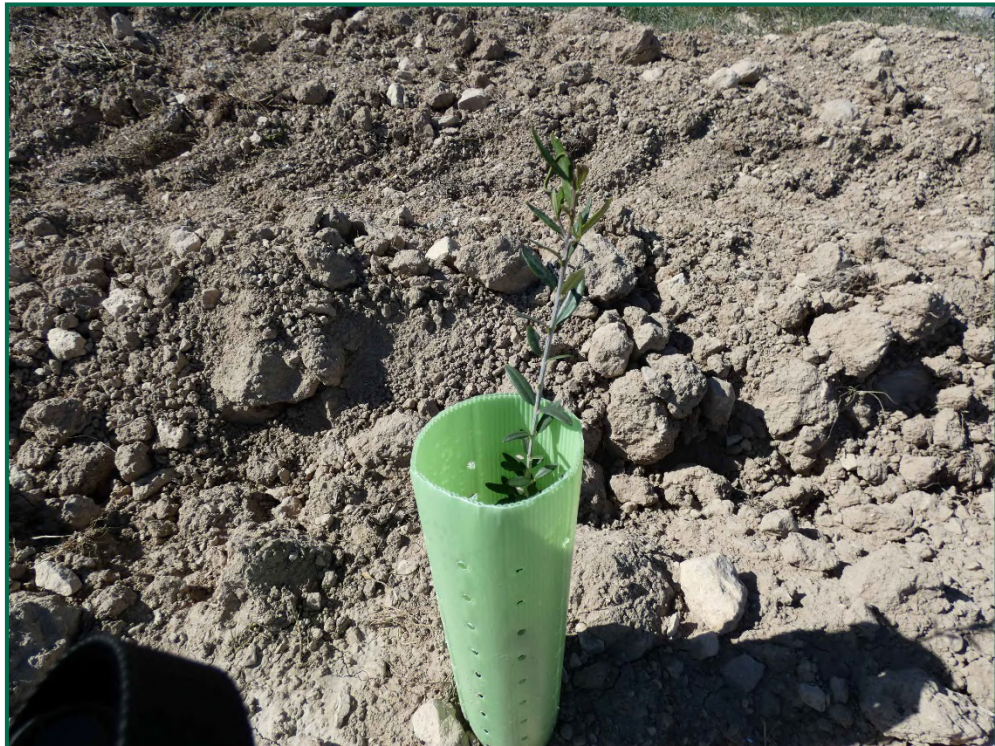
Fotografía 22. Olivo.