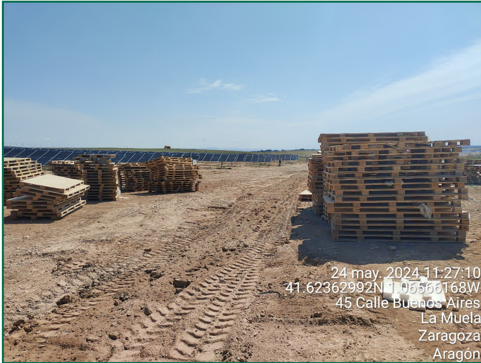
Fotografía 18. Recogida de palets.