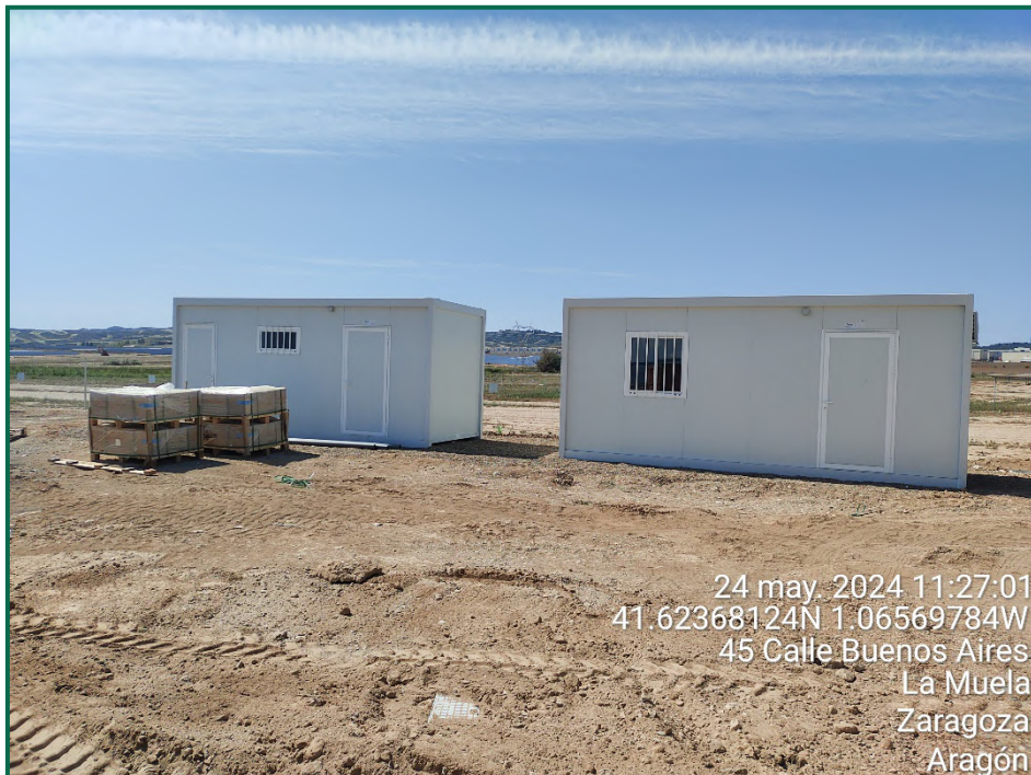
Fotografía 7. Casetas de gestión.