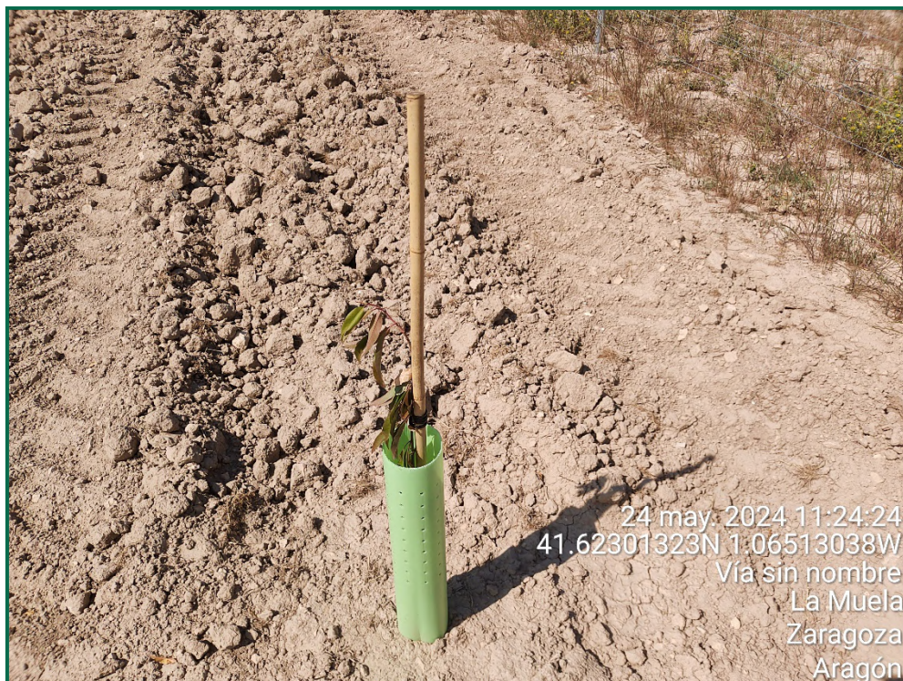
Fotografía 20. Almendro.