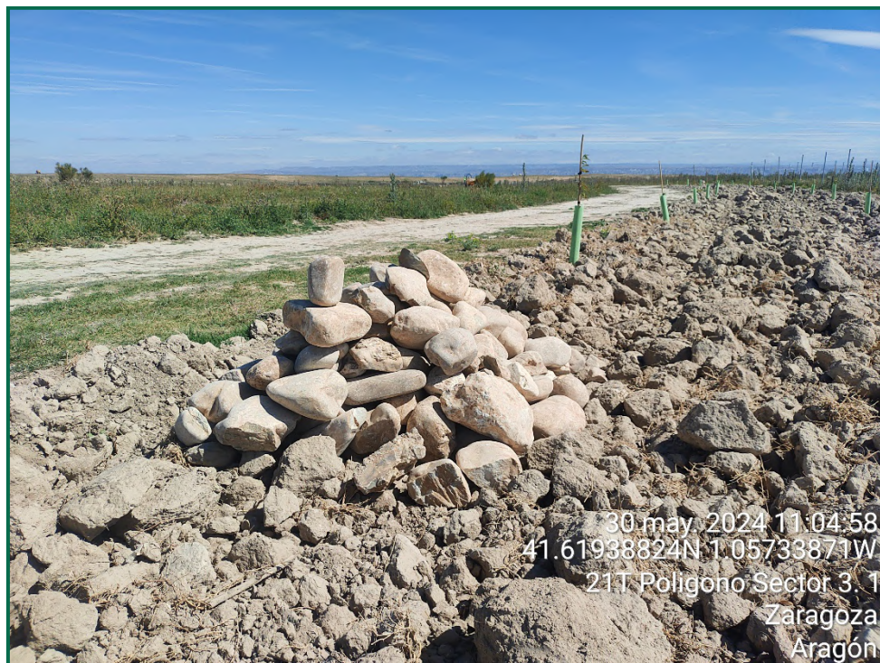
Fotografía 11. Majano para reptiles.