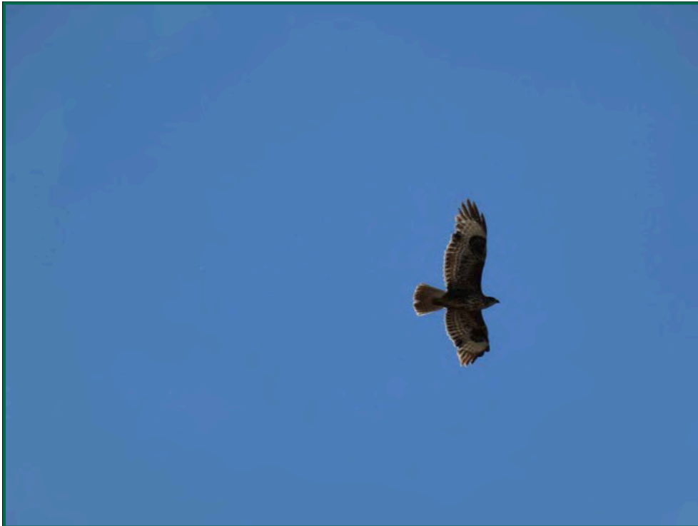
Fotografía 13. Busardo ratonero ( Buteo buteo ).