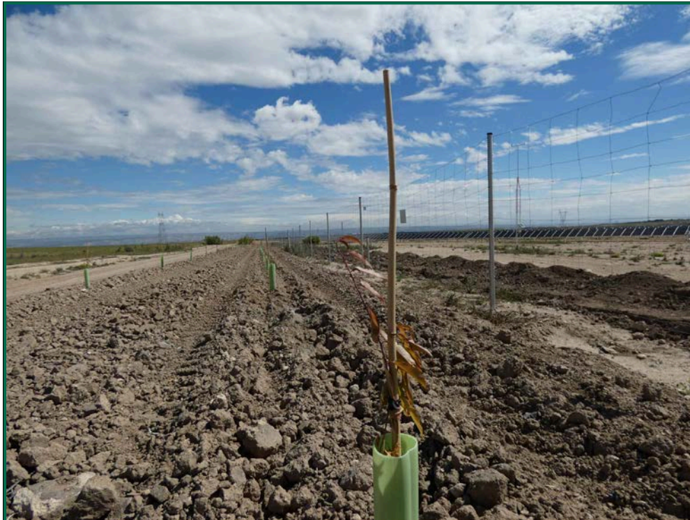
Fotografía 25. Tubo protector y tutor.