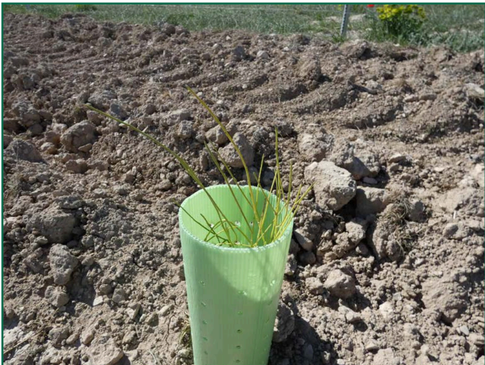
Fotografía 23. Retama.