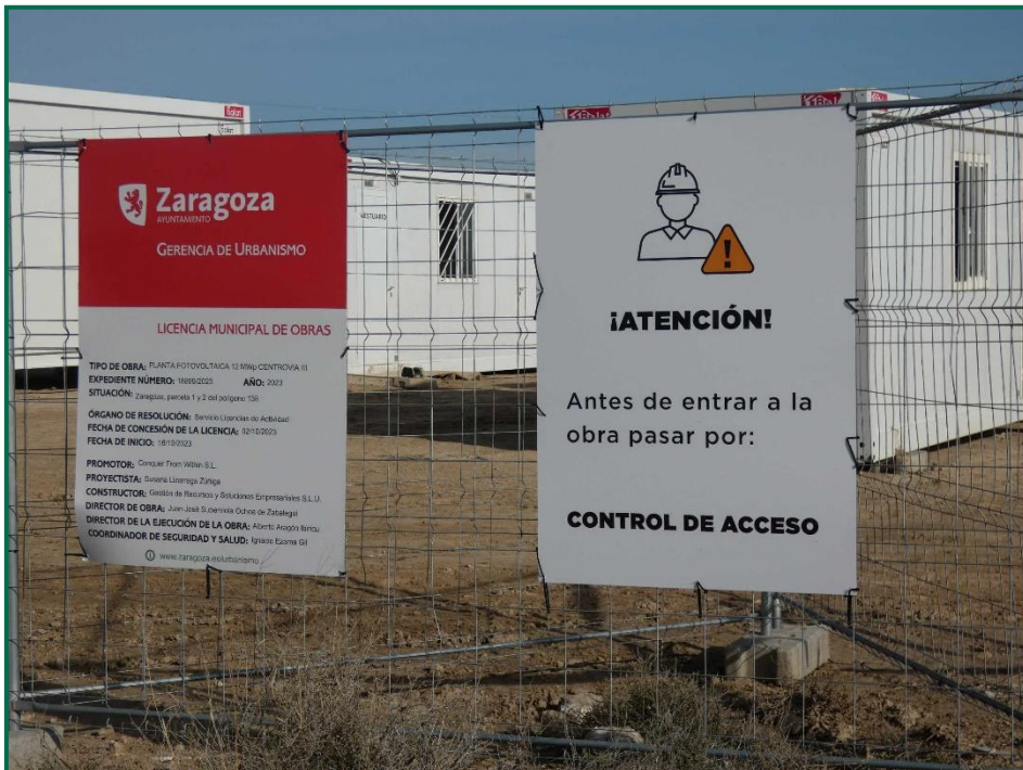
Fotografía 2. Carteles informativos.