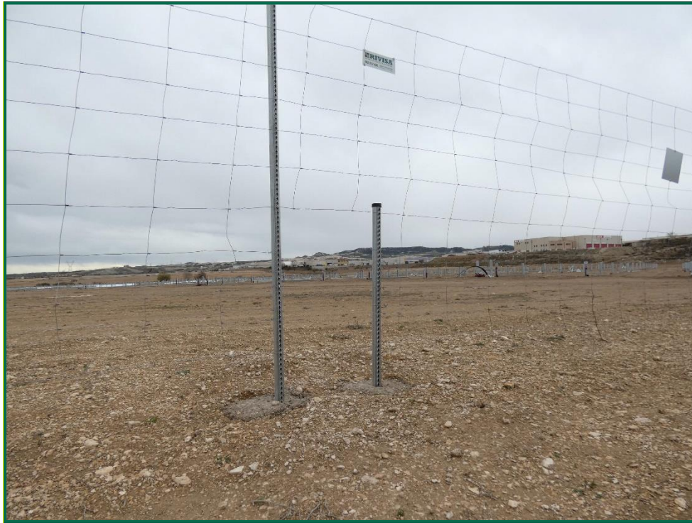
Fotografía 10. Espaciado cingético.