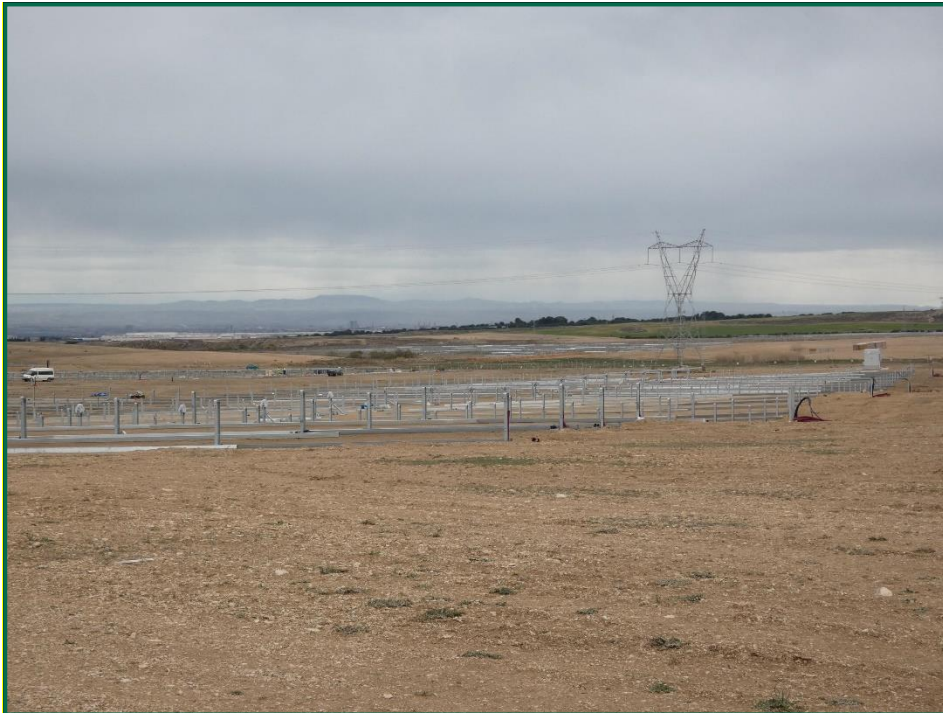
Fotografía 4. Superficie de la obra.