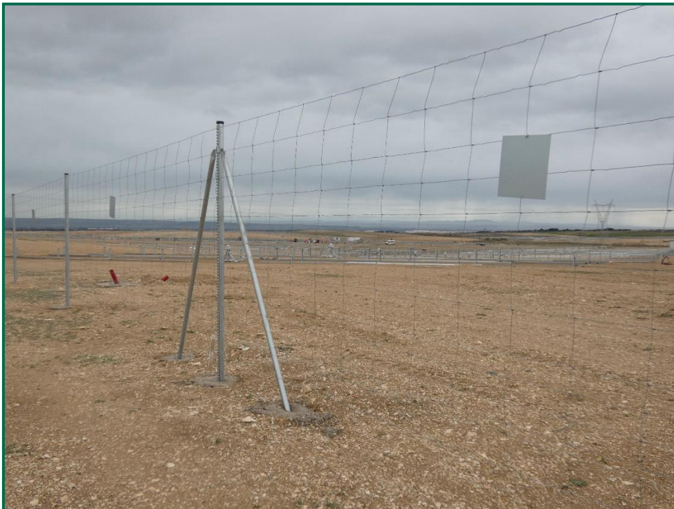
Fotografía 11. Placas anticolidión y vallado perimetral.