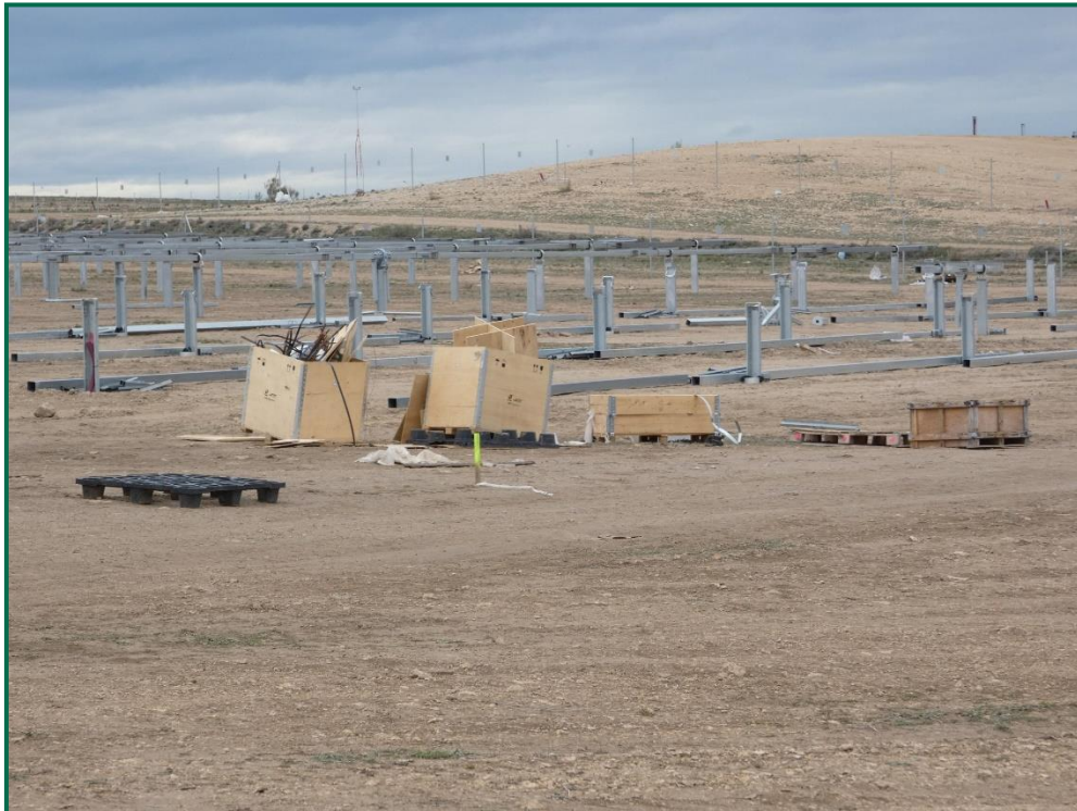
Fotografía 16. Cajas para la recolección de residuos.