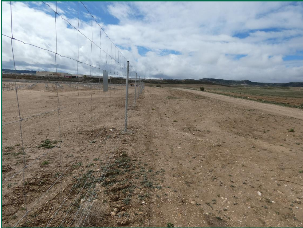
Fotografía 7. Franja vegetal.