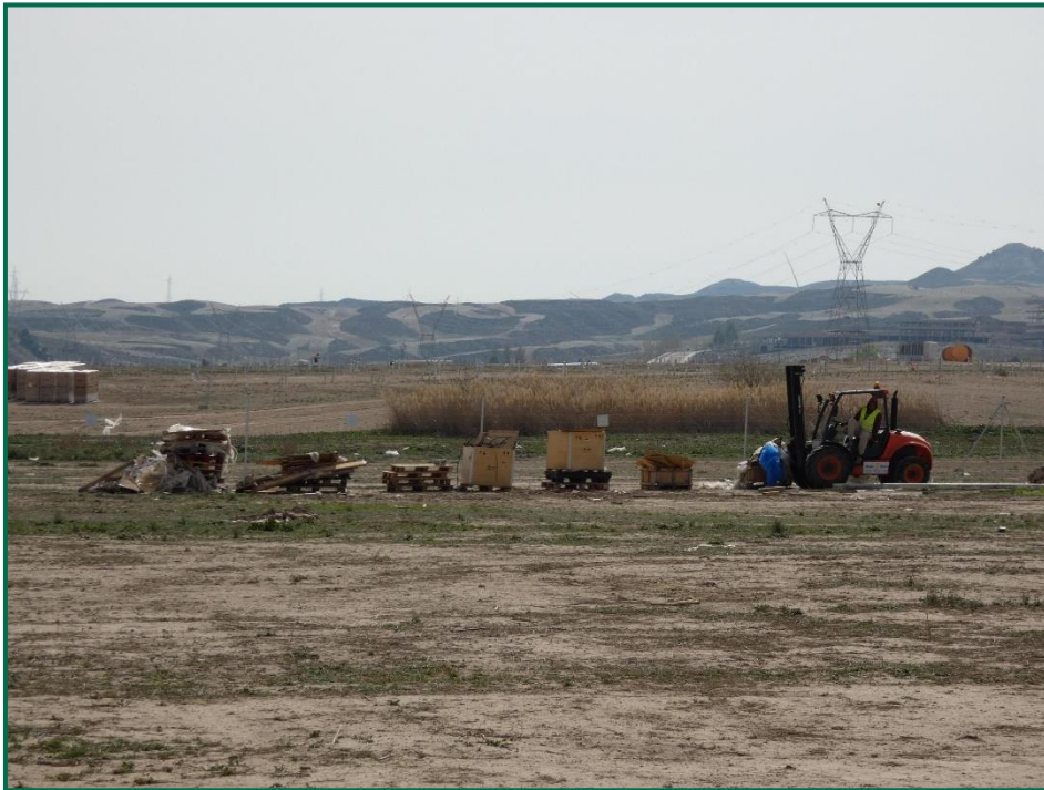
Fotografía 3. Maquinaria recogiendo residuos