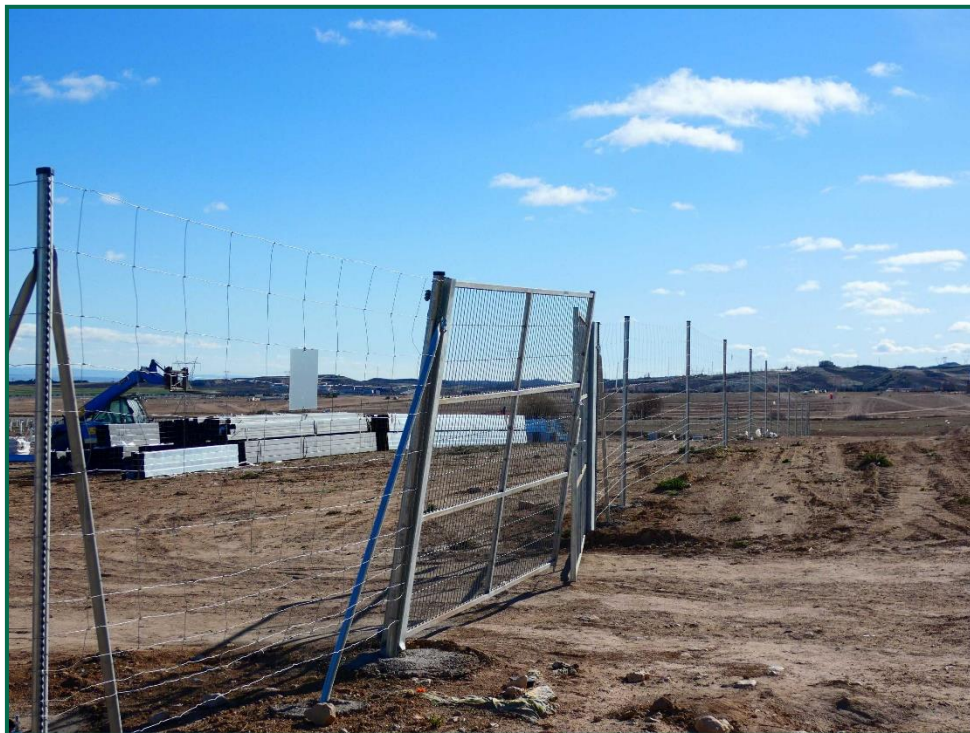
Fotografía 9. Puerta de acceso doblada por la acción del viento.

Durante este mes el vallado se ha doblado en ciertos puntos debido a los fuertes vientos que arrastran plantas rodadoras hasta que los postes del vallado ceden. Estos desperfectos se arreglarán en meses posteriores.