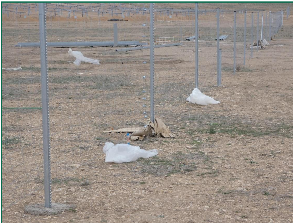
Fotografía 15. Restos de embalaje sobre el vallado.