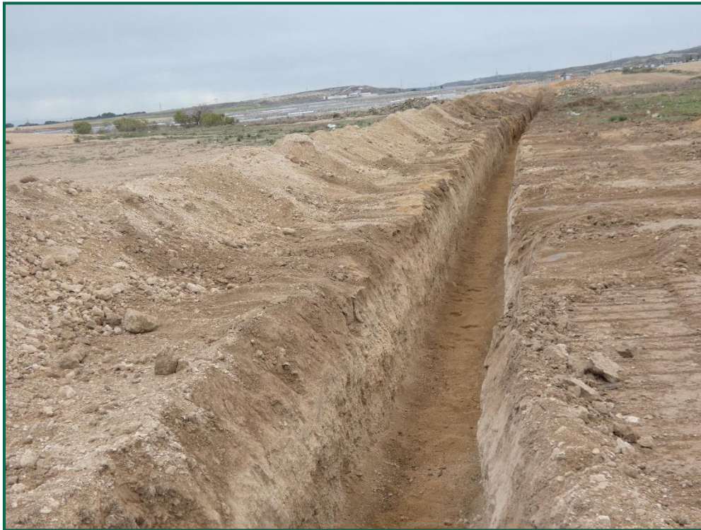
Fotografía 19. Realización de zanjas y acopios de tierra.