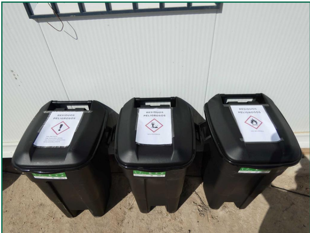
Fotografía 13. Contenedores de residuos peligrosos.