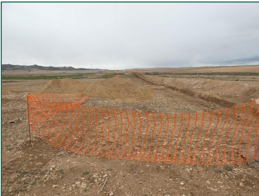
Fotografía 18. Balizamiento de la zanja.

Durante este mes se está llevando a cabo la construcción de la línea de evacuación, la cual será soterrada. Se ha procedido a balizar la vegetación natural colindante, los caminos próximos a las zanjas y los materiales que se encuentren sobre campos de cultivo. Para su construcción se han realizado zanjas, se ha colocado el cableado y posteriormente se están tapado dichas zanjas.