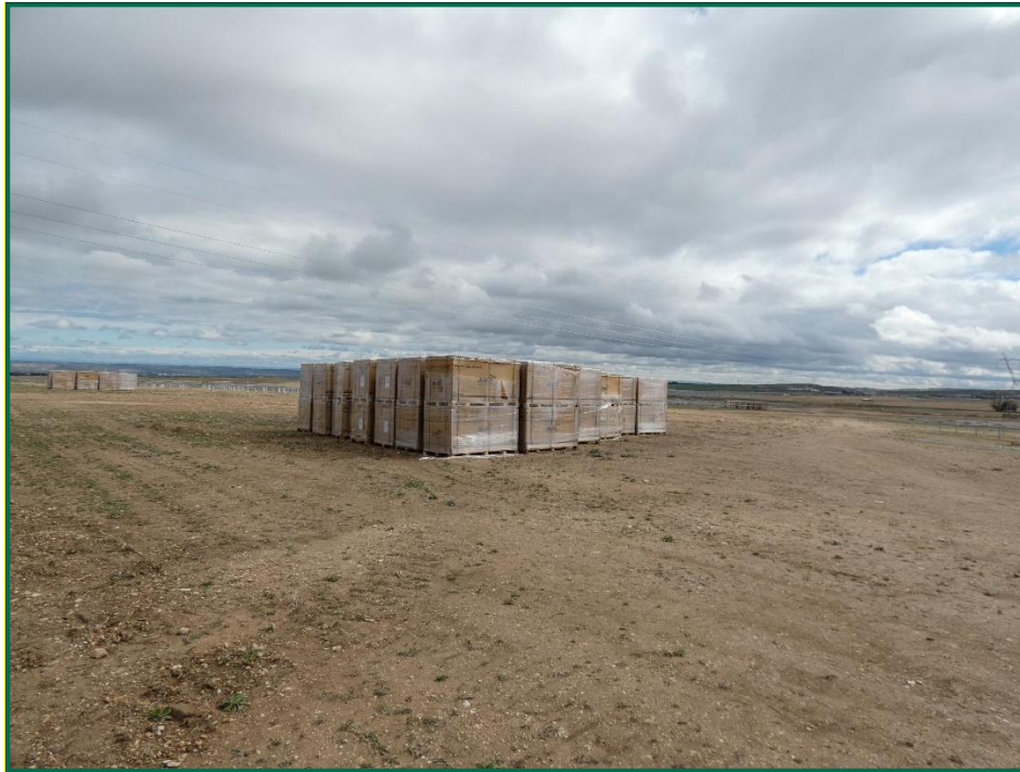
Fotografía 6. Materiales de obra.