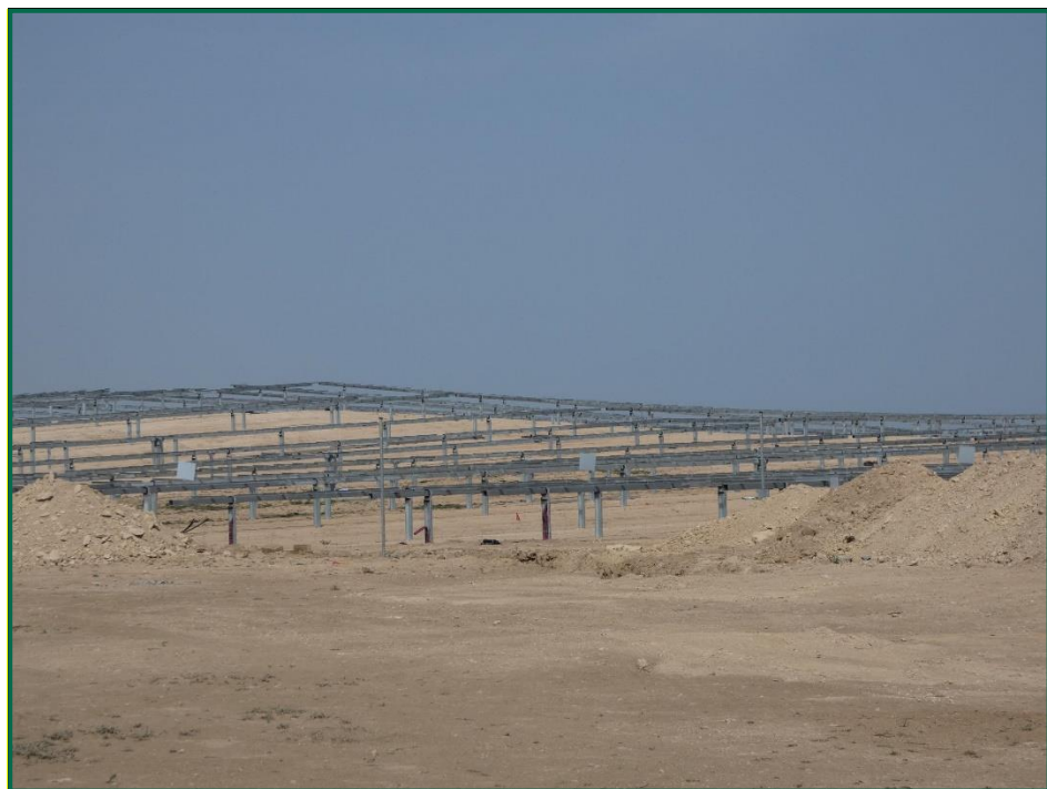
Fotografía 5. Colocación postes horizontales.