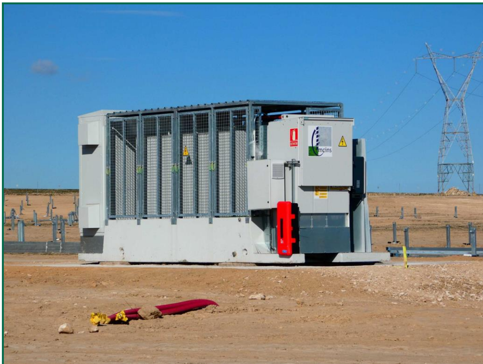
Fotografía 17. Extintor en la caseta del inversor.

Se tiene en cuenta las disposiciones contenidas sobre protección y lucha en la campaña de incendios forestales de la Comunidad Autónoma de Aragón durante el año 2023. El Gobierno de Aragón a adelantado el plan de prevención de incendios al 1 de mayo de 2023 cuando habitualmente es el 15 de junio.