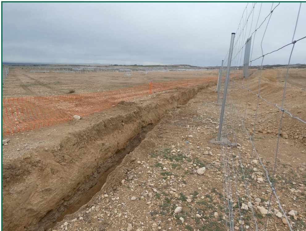
Fotografía 20. Línea de evacuación que une las distintas plantas.