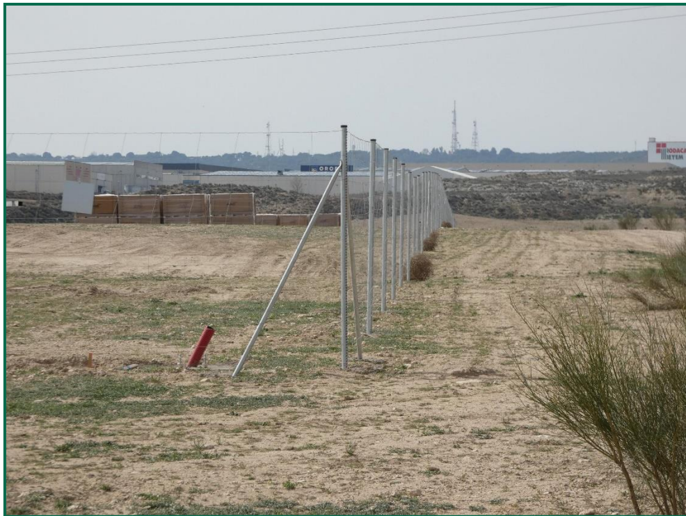
Fotografía 8. Vegetación natural y franja vegetal.