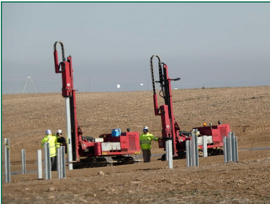
Fotografía 2. Maquinaria hincapostes.