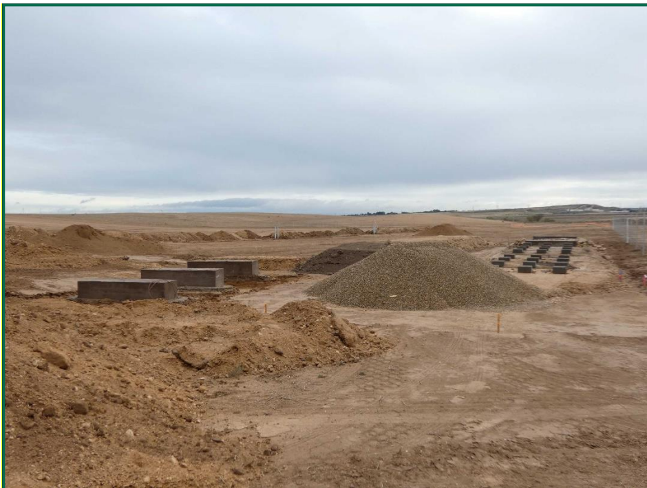
Fotografía 5. Estructuras para los inversores y casetas de gestión.