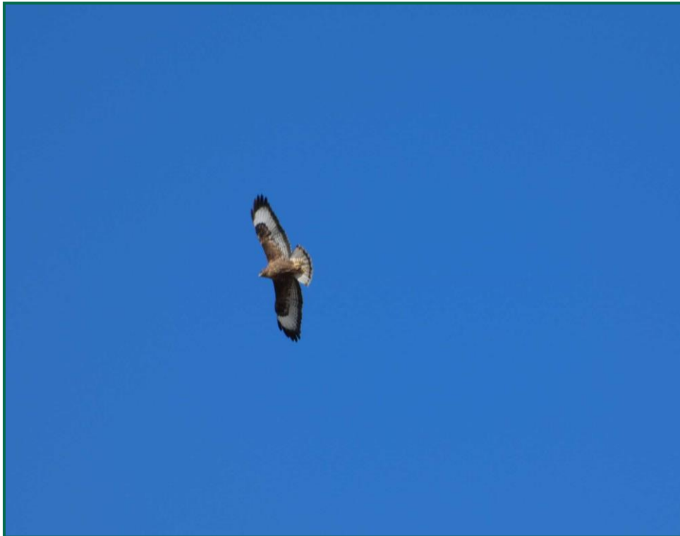
Fotografía 13. Busardo ratonero ( Buteo buteo ).