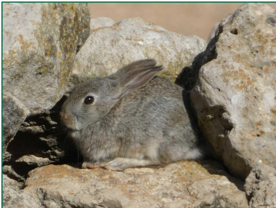
Fotografía 18. Conejo común ( Oryctolagus cuniculus ).