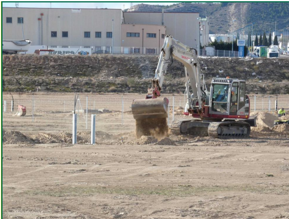
Fotografía 3. Tapado de zanjas.

Por el momento la tierra vegetal extraída ha sido escasa debido a que no ha sido necesario nivelar todo el terreno, únicamente algunas zonas y con un espesor limitado, y esta se ha ido extendiendo sobre el terreno. La tierra extraída para la construcción de balsas de limpieza se ha acopiado en caballones al igual que la tierra retirada para realizar zanjas. En las zonas donde se van a realizar plantaciones para crear una patalla vegetal no se ha realizado ningún movimiento de tierra, conservando la capa de tierra vegetal presente.