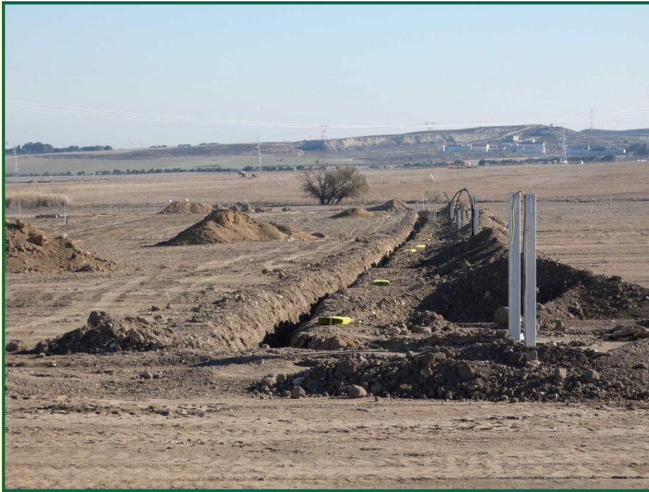
Fotografía 4. Zanjas y acopios de tierra