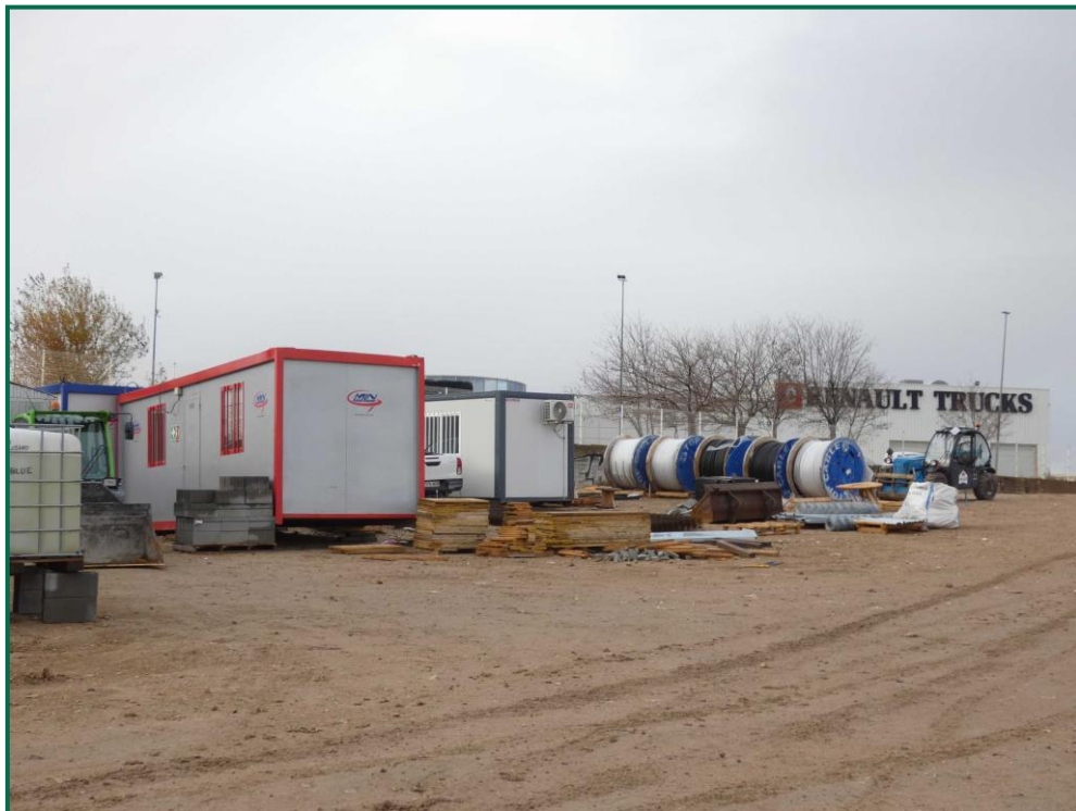
Fotografía 19. Vestuarios, servicios y materiales de obra.

Todavía no se han utilizado grupos electrógenos ni se han instalado envases de combustible, cuando se comiencen a utilizar se colocarán bandejas de contención debajo de ellos para evitar derrames por pérdidas accidentales sobre el terreno.