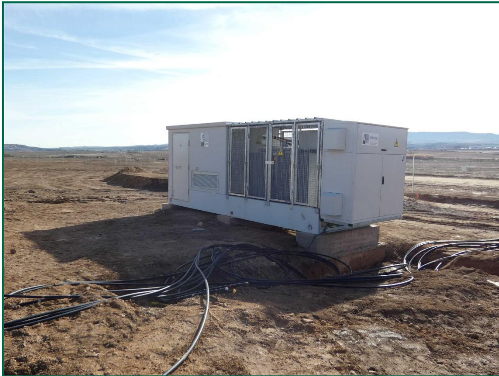
Fotografía 8. Caseta del inversor.