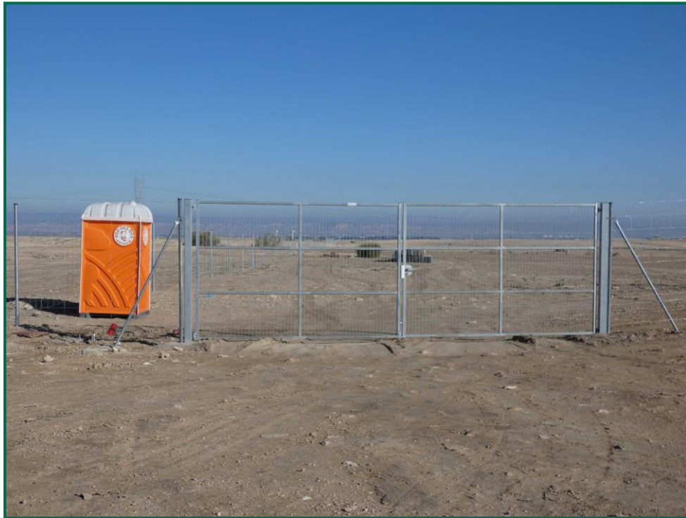
Fotografía 10. Puerta de acceso.