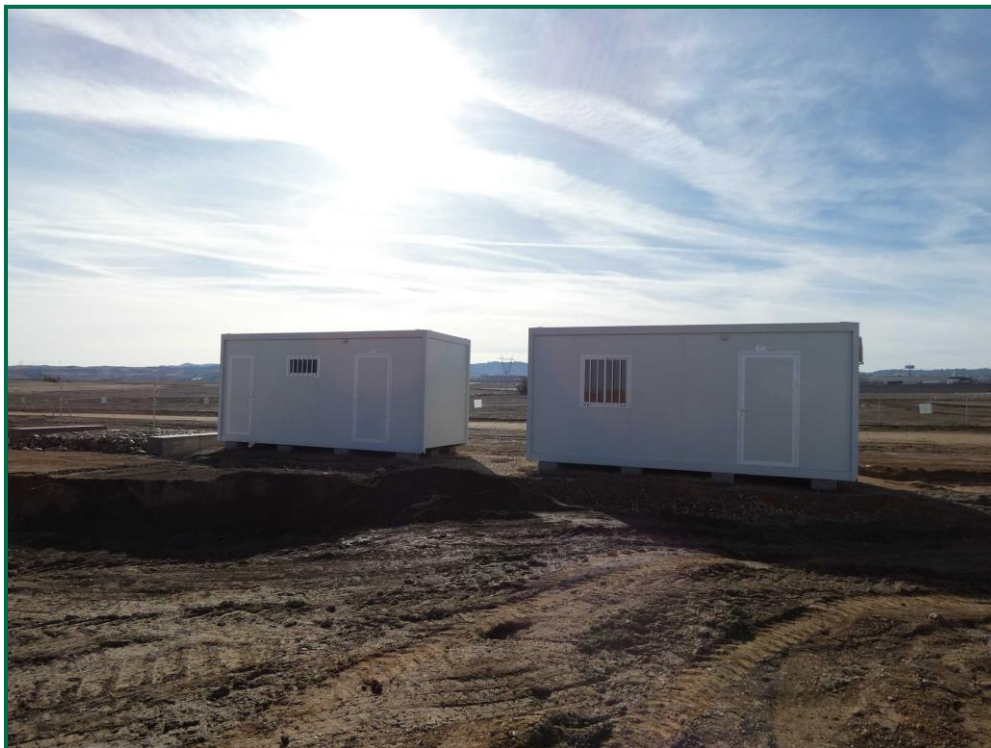
Fotografía 7. Casetas de gestión.