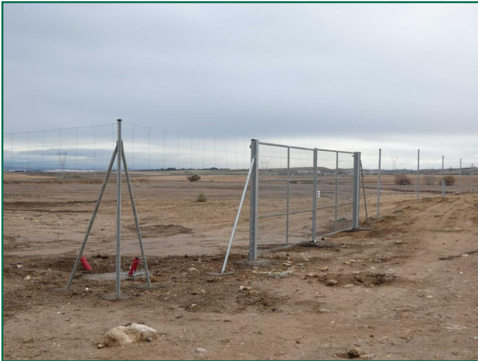
Fotografía 9. Superficie de la planta.