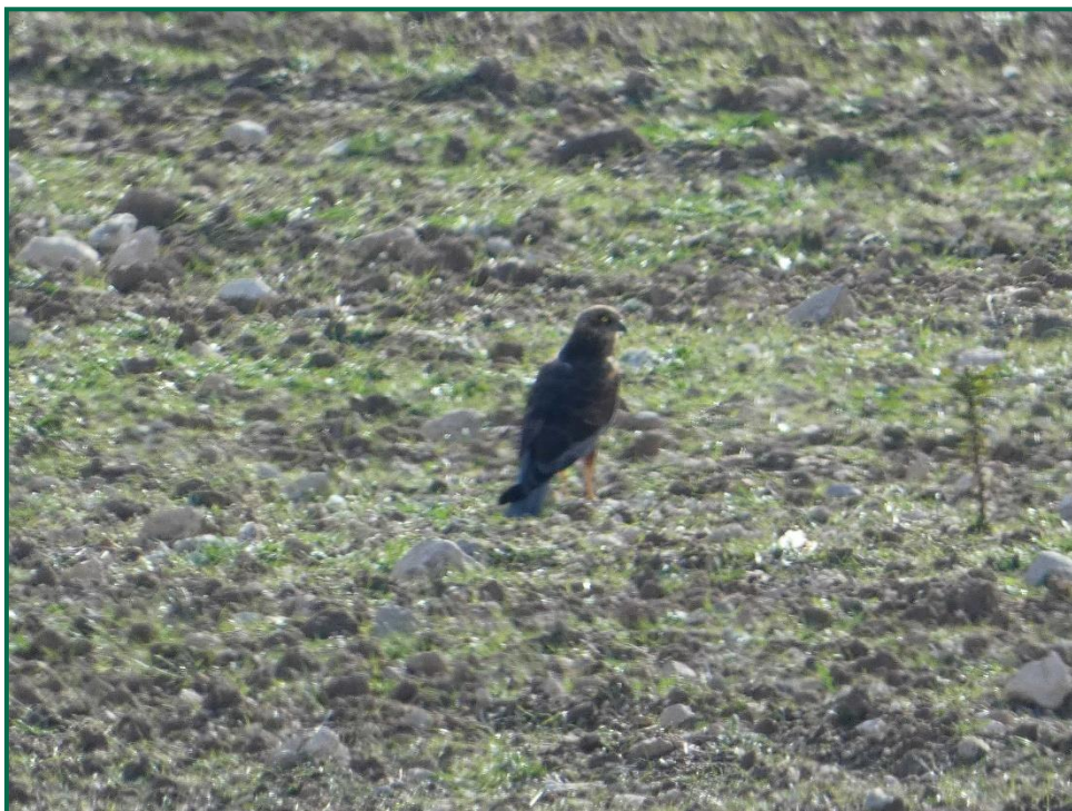
Fotografía 14. Aguilucho ratonero ( Circus aeruginosus ).