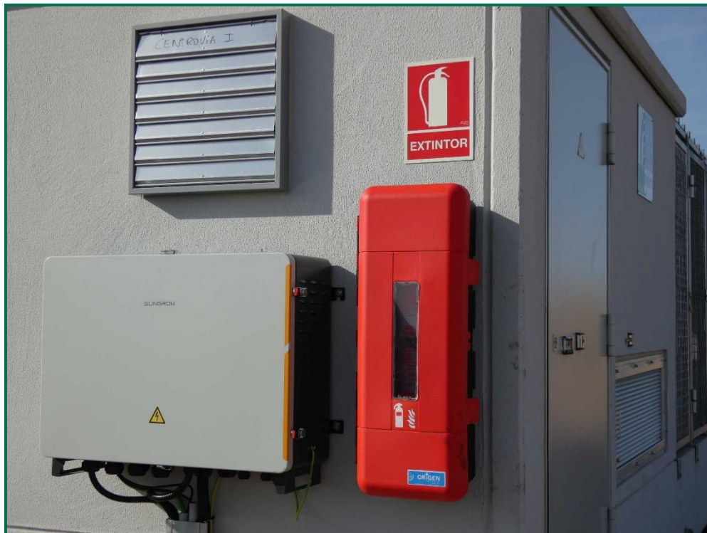
Fotografía 21. Extintor en la caseta del inversor.

Se tiene en cuenta las disposiciones contenidas sobre protección y lucha en la campaña de incendios forestales de la Comunidad Autónoma de Aragón durante el año 2023. El Gobierno de Aragón a adelantado el plan de prevención de incendios al 1 de mayo de 2023 cuando habitualmente es el 15 de junio.