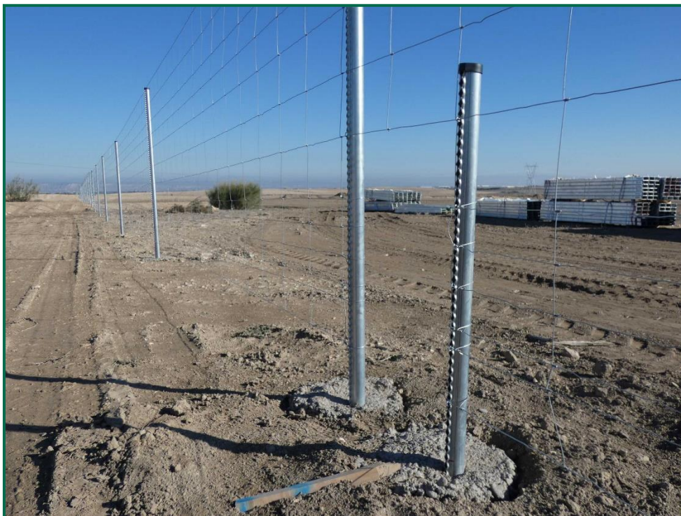
Fotografía 11. Espaciado cinético.