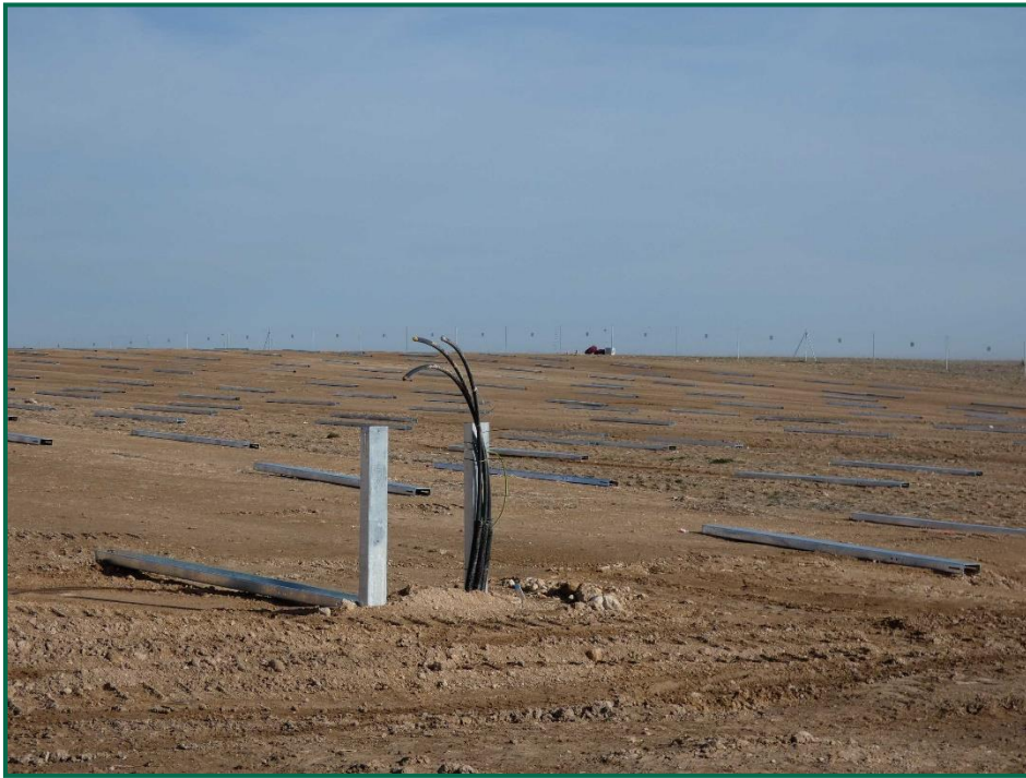
Fotografía 6. Colocación de postes verticales.