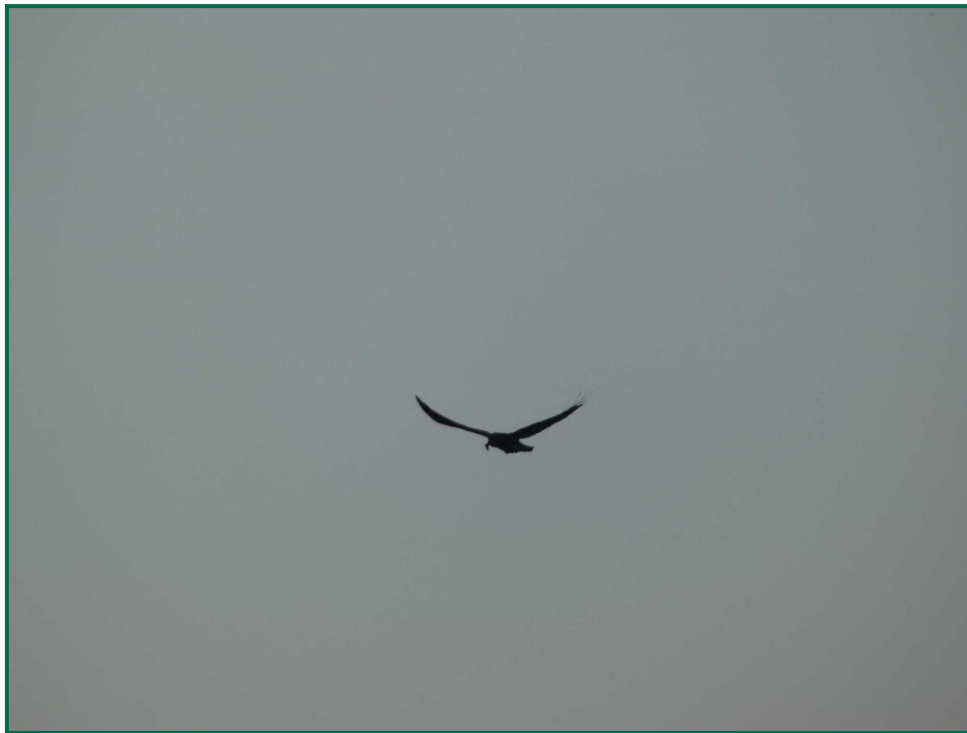
Fotografía 12. Cuervo grande ( Corvus corax ).

Se ha realizado seguimiento de avifauna durante el proceso de la obra, observándose las siguientes especies: busardo ratonero ( Buteo buteo ), corneja negra ( Corvus corone ) cuervo grande ( Corvus corax ), chova piquirroja ( Pyrrhocorax pyrrhocorax ), gavilán común ( Accipiter nisus ), aguilucho lagunero ( Circus aeruginosus ), abubilla común ( Upupa epops ), garza real ( Ardea cinerea ), gaviota patiamarilla ( Larus michaellis ) y otras especies como estornino negro ( Sturnus unicolor ) o urraca común ( Pica pica ) entre otras.