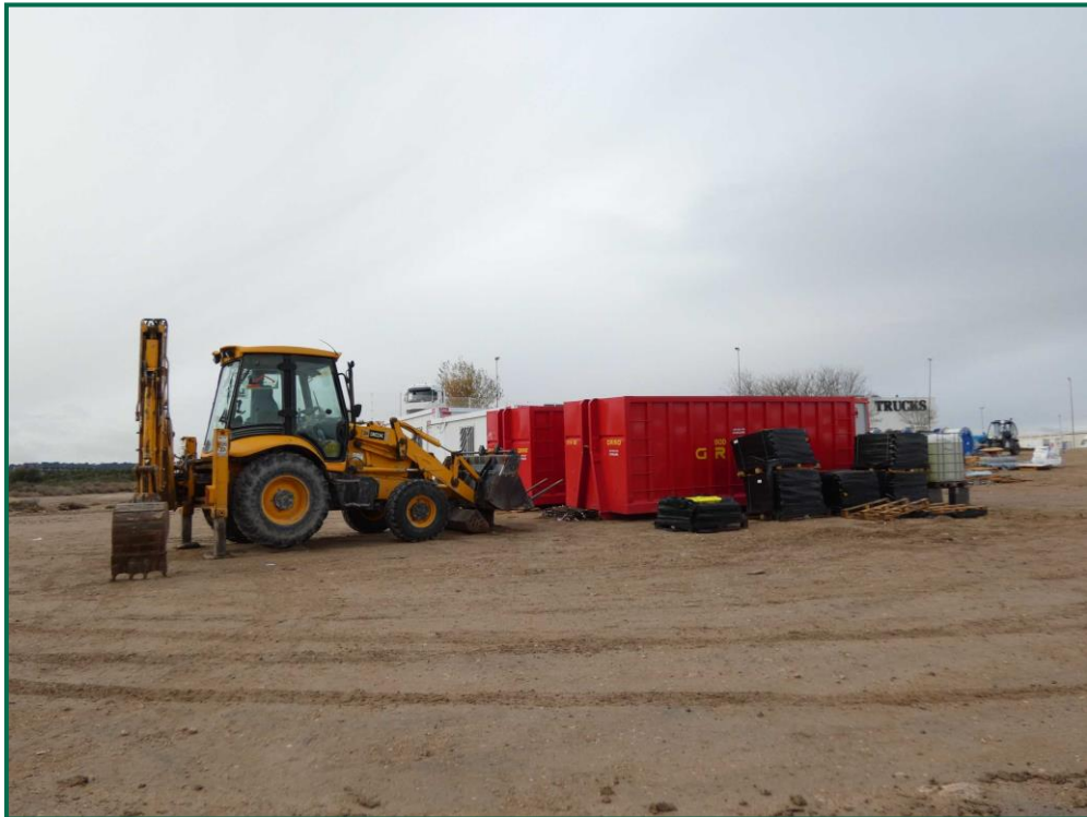
Fotografía 20. Contenedores de residuos.