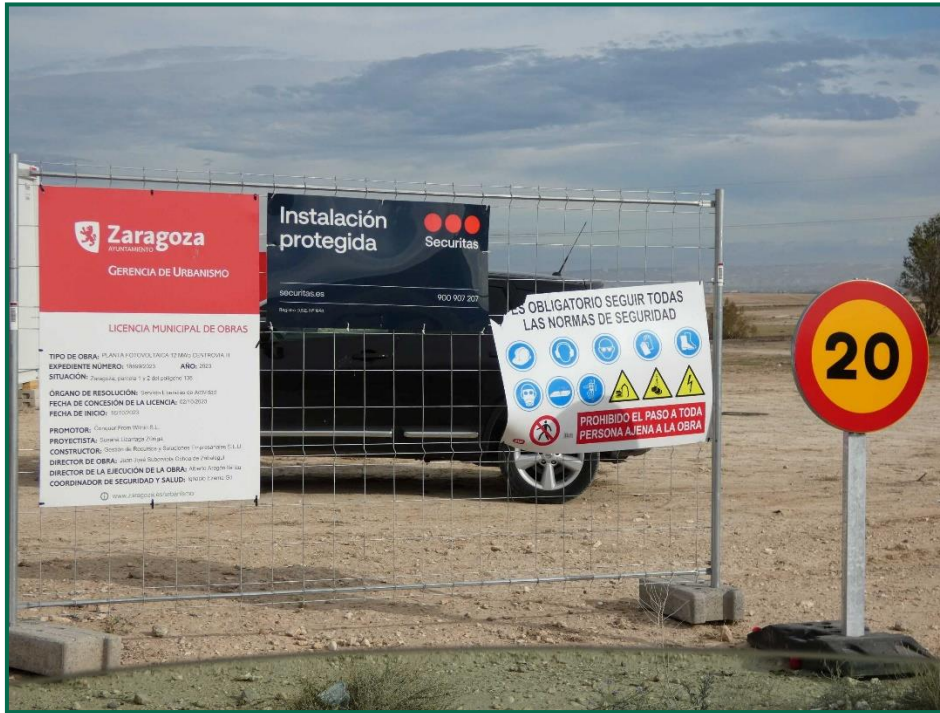
Fotografía 1. Señalización.