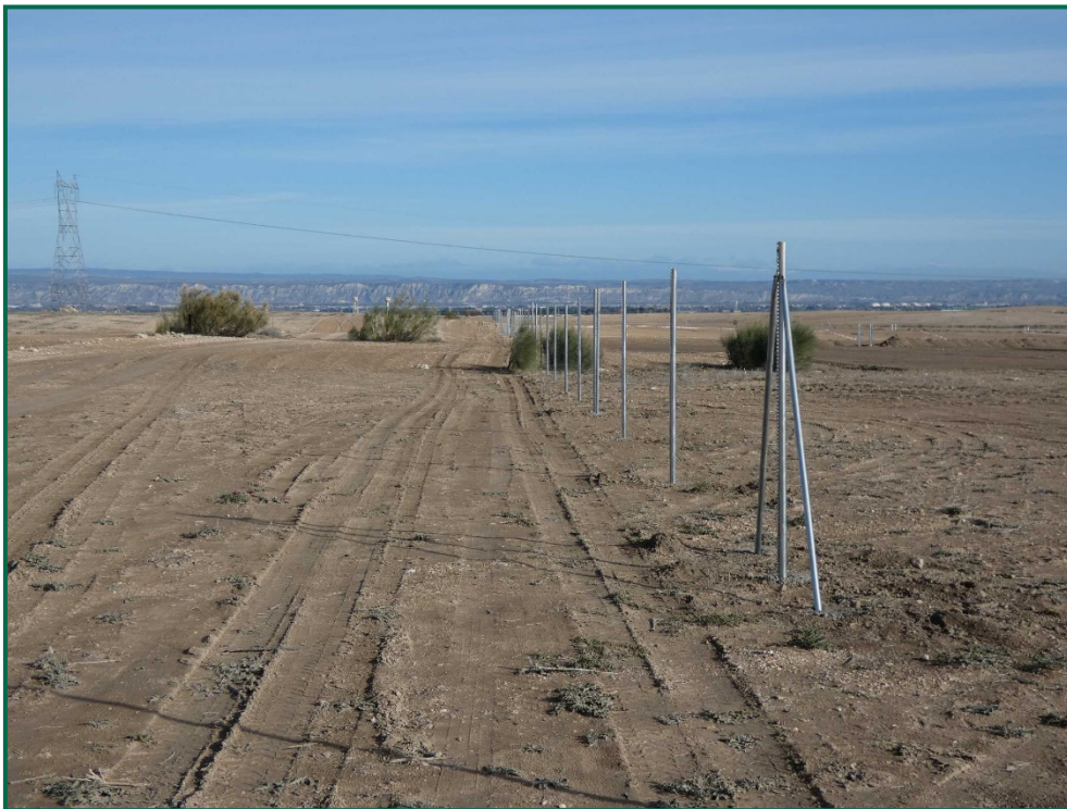
Fotografía 8. Franja vegetal.

Durante las visitas a obra se comprueba que la ocupación de zonas de vegetación se limita a lo aprobado en el proyecto. Se verifica también que la maquinaria circula únicamente por los viales habilitados para tal fin. Desde el inicio de las obras se ha planificado la ejecución de una franja vegetal de 8 m de anchura en torno al futuro vallado perimetral.