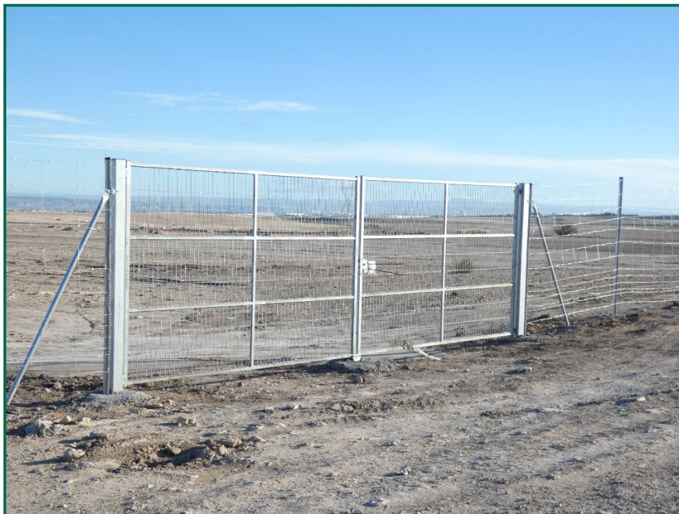
Fotografía 9. Puerta de acceso.

El vallado perimetral, se ha instalado utilizando malla cinégetica y dejando un espacio de al menos 20 cm desde el suelo, así como las placas anticolidión, que aún no se han instalado, se colocarán a diferentes alturas por el vallado.