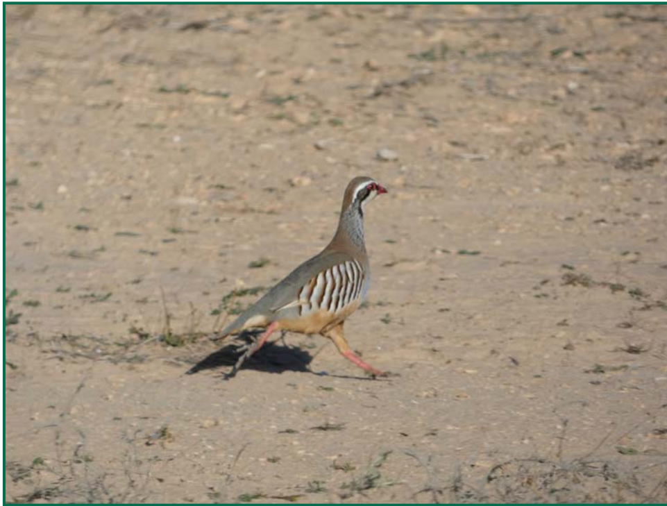
Fotografía 11. Perdiz roja ( Alectoris rufa ).