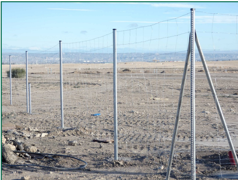
Fotografía 7. Vallado perimetral.