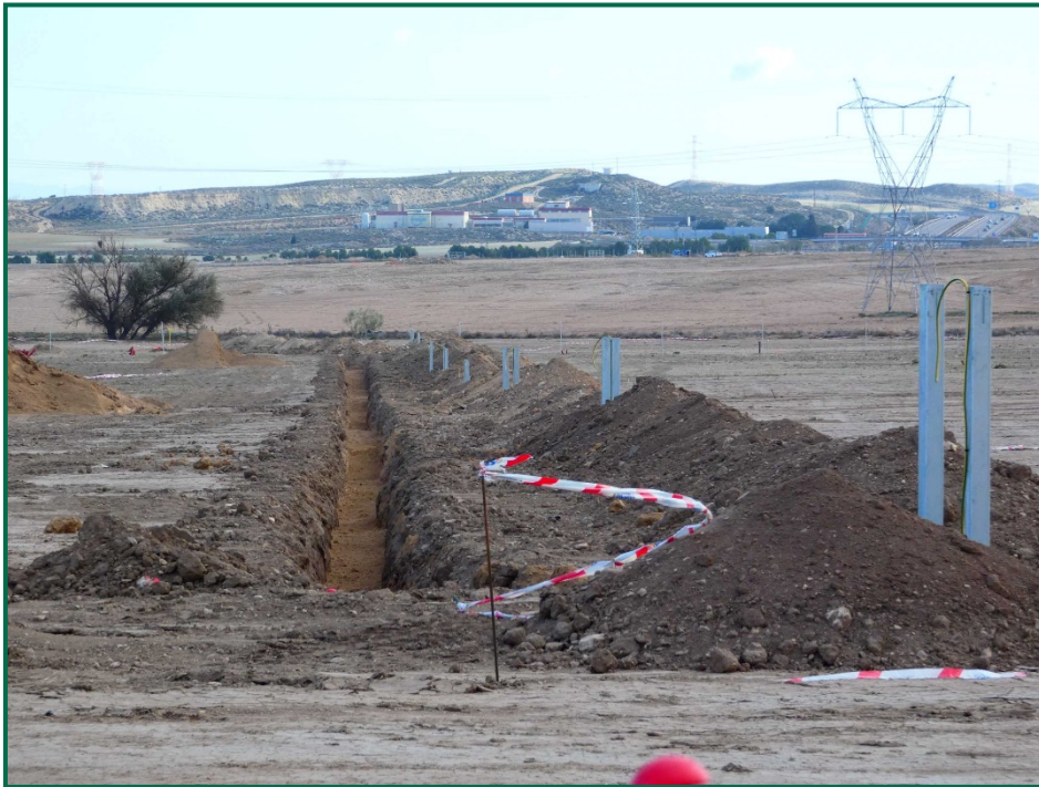
Fotografía 6. Postes y zanjas para los inversores.