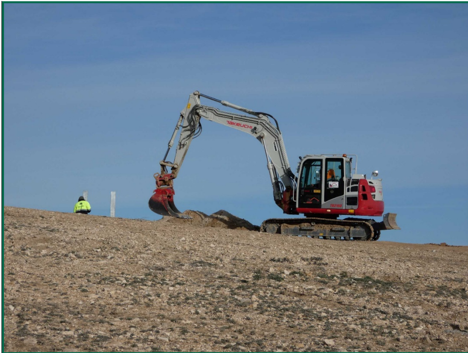
Fotografía 4. Máquina escavadora