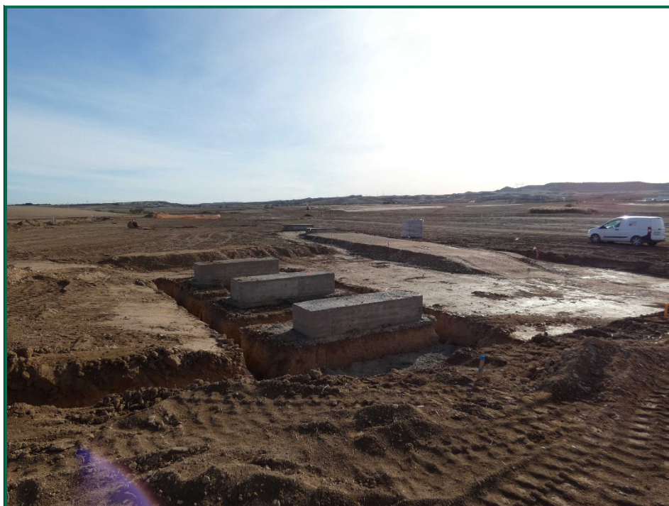
Fotografía 5. Estructuras para los inversores.