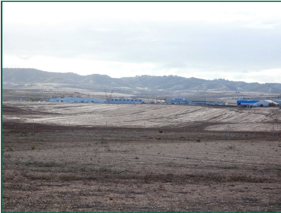
Fotografía 2. Allanado del terreno.