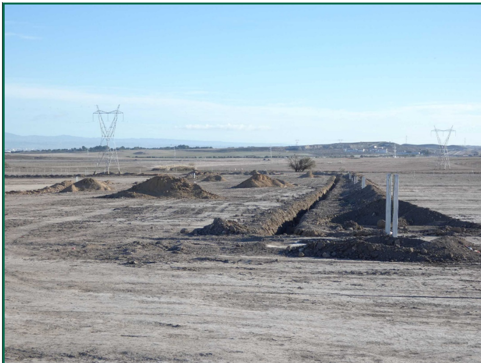
Fotografía 3. Acopios de tierra