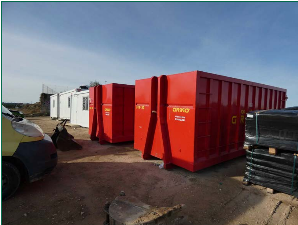
Fotografía 13. Contenedores de residuos.