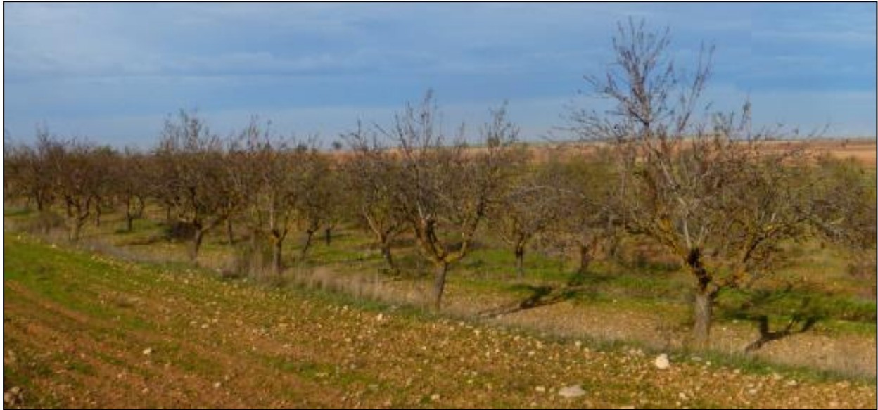
Figura 3: Ejemplo de cultivo leñoso de almendros en el entorno de la PSFV.