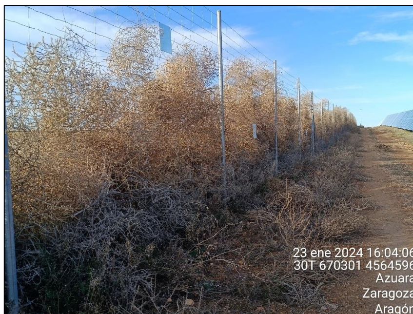
Figura 10: Vegetación rodada acumulada contra el vallado de la PSFV en su cara externa.

Por último, cabe reseñar que a lo largo del año se ha acumulado contra el vallado gran cantidad de vegetación seca rodada empujada por el viento. La acumulación se ha producido tanto por el exterior del vallado, principalmente en los tramos orientados hacia el W, como en el interior del vallado, sobre todo en los tramos orientados hacia el E y especialmente en las esquinas del perímetro. En algunas de estas esquinas la vegetación rodada ha cubierto zonas con estructuras eléctricas (cámaras, torres de medición...)