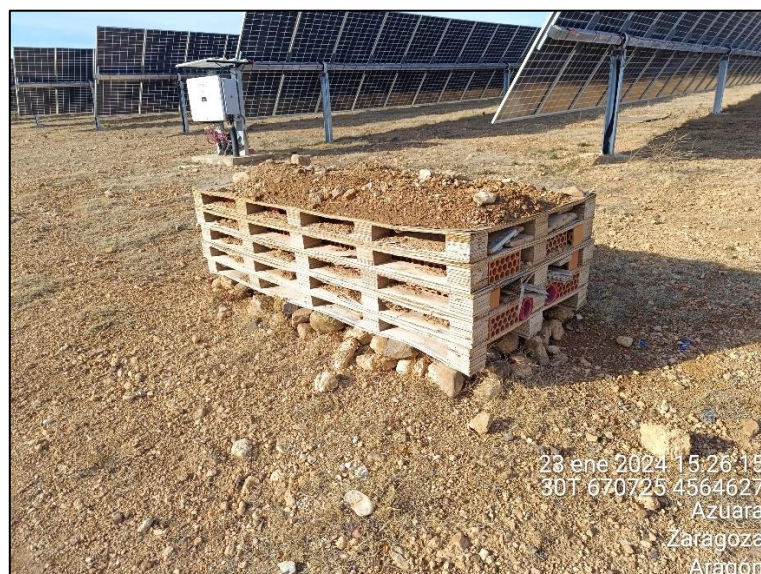
Figura 8: Ejemplo de hotel de insectos.

Los hoteles de insectos construidos en varios puntos de la planta a partir de materiales reciclados de las obras se encuentran, en general, en buen estado habiendo sido sustituidos algunos de ellos en el presente trimestre.