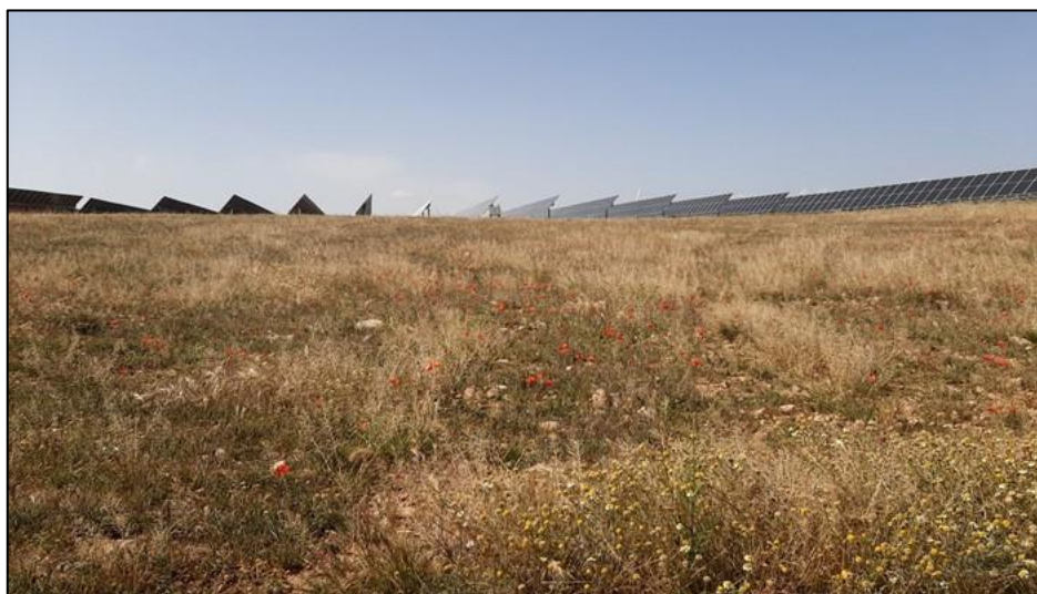
Figura 2: Revegetación por colonización natural desarrollada en la PSFV.