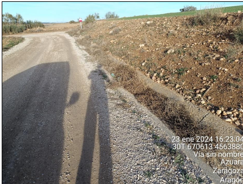
Figura 7: Canal de drenaje con cierta acumulación de vegetación rodada.