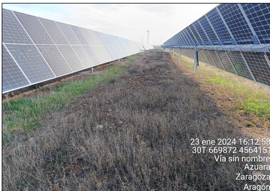
Figura 1: Revegetación por colonización natural desarrollada entre las filas de paneles.

La revegetación natural se está desarrollando de forma adecuada en todo el perímetro de la PSFV, dándose, en general, una colonización bastante rápida por las especies silvestres de la zona.