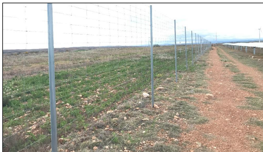
Figura 9: Tramo del vallado en el que faltan varias Placas anticolidión.

Un buen número de las placas metálicas instaladas a lo largo del vallado para evitar que la avifauna colisione con él se han descolgado total o parcialmente. Por el momento no han sido reparadas o repuestas.