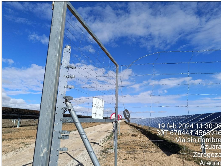
Figura 9: Empalme del vallado con un tensor suelto junto al puerta de entrada en la PSFV.

Por último, cabe reseñar que a lo largo del año se ha acumulado contra el vallado gran cantidad de vegetación seca rodada empujada por el viento. La acumulación se ha producido tanto por el exterior del vallado, principalmente en los tramos orientados hacia el W, como en el interior del vallado, sobre todo en los tramos orientados hacia el E y especialmente en las esquinas del perímetro. En algunas de estas esquinas la vegetación rodada ha cubierto zonas con estructuras eléctricas (cámaras, torres de medición...)