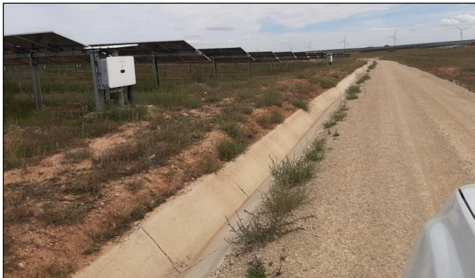
Figura 6: Canal de drenaje en buen estado en el la PSFV

La red de drenaje funciona con normalidad. En momentos puntuales las lluvias han arrastrado pequeñas cantidades de sedimentos en los canales y también en algunos tramos se ha acumulado cierta cantidad de vegetación, principalmente rodada, pero en ningún caso han dificultado su correcto funcionamiento.