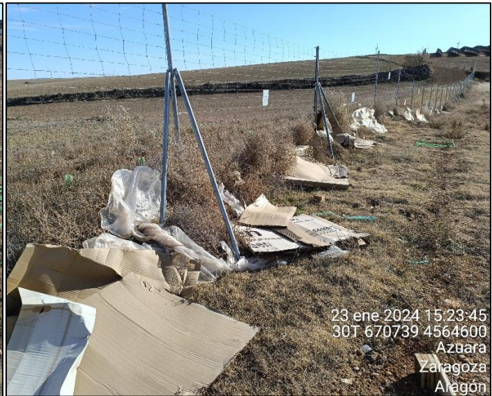
Figura 4: Residuos plásticos y de cartón dispersados por el viento y acumulados contra el vallado en el sector NE de la PSFV. Los residuos habían sido recogidos y almacenados correctamente antes de la visita de febrero.