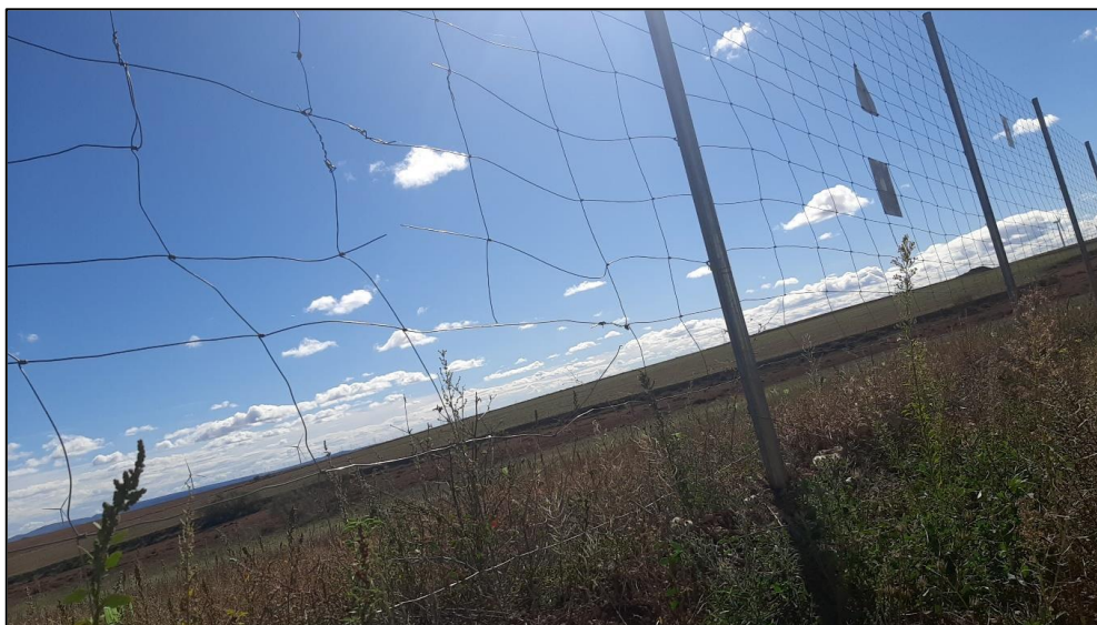
Figura 8: Tramo del vallado con pequeñas roturas.

En las visitas realizadas hasta la fecha se ha recorrido en coche todo el perímetro de vallado con el fin de comprobar su estado y posibles alteraciones en el mismo. En general el vallado perimetral se encuentra en buen estado, si bien existen algunos desperfectos como algunas pequeñas roturas o dos empalmes con los tensores rotos en la cara sur de la PSFV (uno de ellos reportado previamente y otro, junto a la puerta principal, detectado en este trimestre).