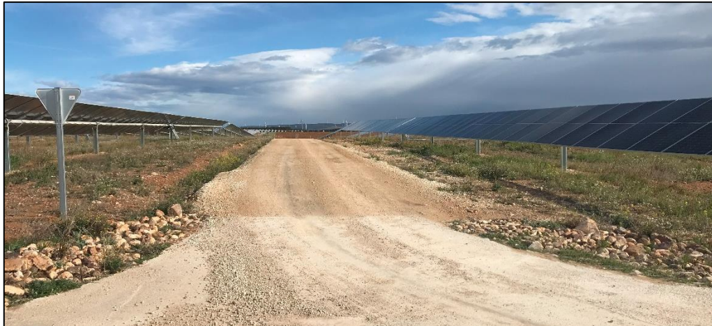
Figura 5: Vial interno de la PSFV

El estado de los viales, tanto los que discurren por el interior como el vial de acceso a la planta solar es bueno, de manera que no dificultarían o impedirían un eventual acceso rápido de los equipos de emergencias, permitiendo el acceso a toda clase de vehículos.