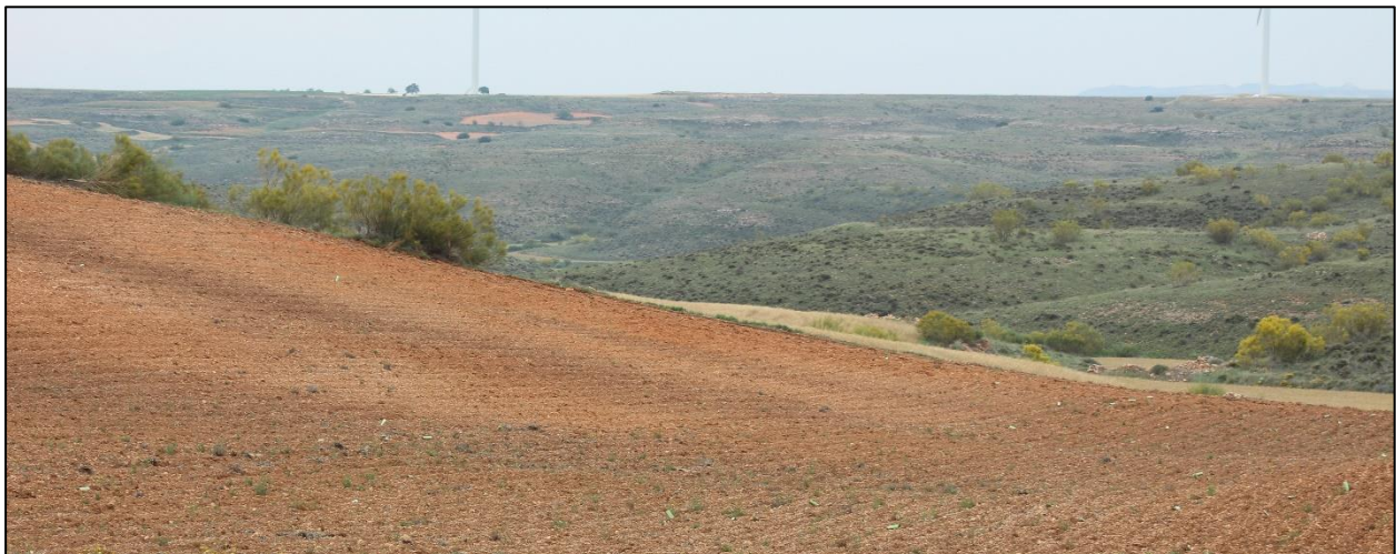
Figura 4: Ejemplo de zona con matorral mixto y un campo arado en primer plano.

Esta unidad de vegetación natural surge como consecuencia de la degradación del estrato arbóreo o la colonización de campos de cultivos abandonados por matorrales leñosos.