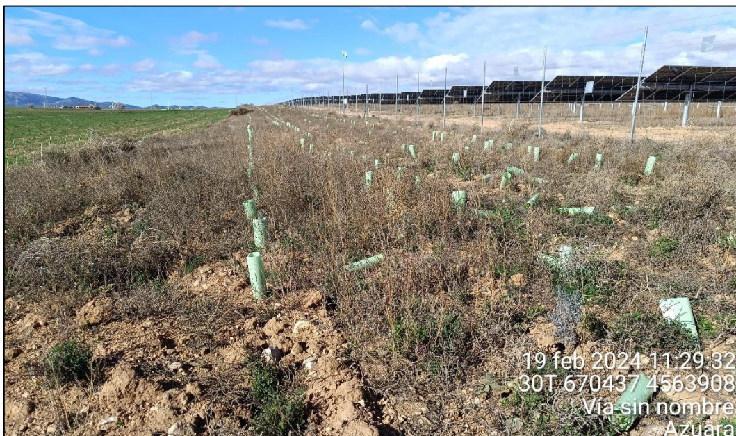
Figura 3: Colonización natural de vegetación en el espacio entre plantones

Por otra parte, la colonización por parte de la vegetación natural de los espacios entre plantones, en general, es bastante favorable y presenta una densidad alta.