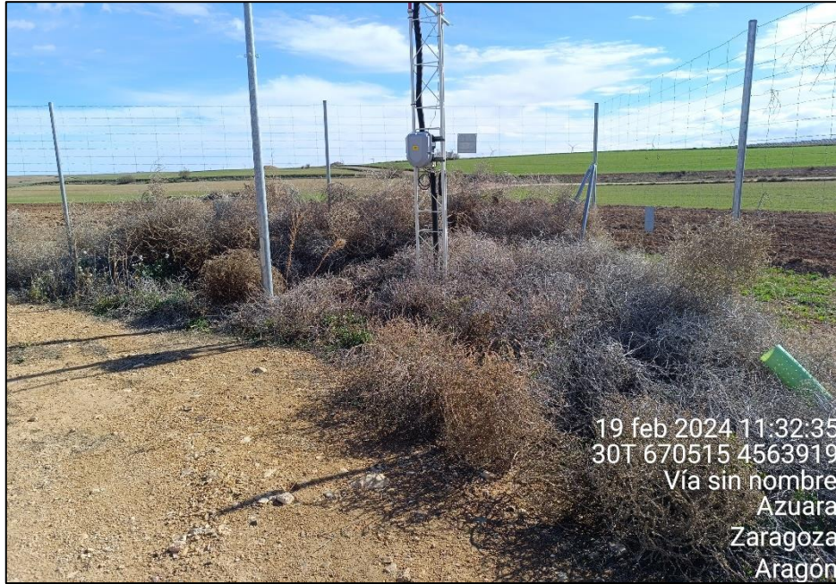
Figura 11: Vegetación rodada acumulada en una esquina dentro del perímetro vallado de la PSFV cubriendo parcialmente estructuras eléctricas.