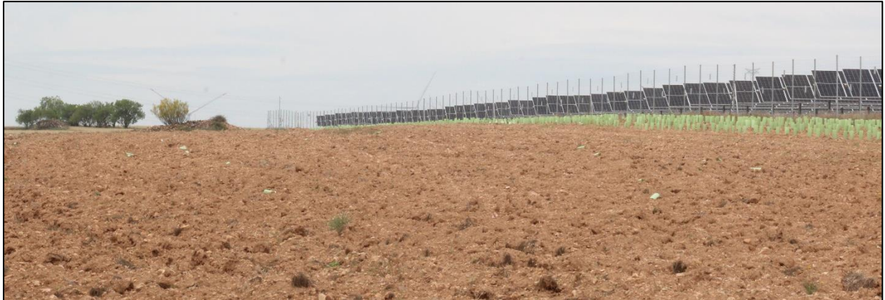
Figura 2: Ejemplo de campos arados dedicados al cultivo de cereal en secano en el entorno de la PSFV.

Existen campos de cultivo abandonados y barbechos cerealistas donde, además de en las márgenes de las parcelas y viales que las delimitan, prolifera un pastizal típico de ambientes medianamente enriquecidos en nitrógeno de especies arvenses acompañantes de estos cultivos como Papaver rhoeas , Lolium rigidum , Convolvulus arvensis , Fumaria spp. , Polygonum aviculare , Galium spp. , Cirsium arvense , Bromus spp. , Anacyclus clavatus , Rapistrum rugosum , Rumex spp. , Euphorbia serrata , Vicia sp. , Medicago sativa , Hypocoum procumbens , Capsella bursa-pastoris , Diploaxis erucooides , Malva sylvestris , Herniaria hirsuta , Chenopodium álbum , Matricaria chamomilla , y un largo etc. Se trata mayoritariamente de especies de dicotiledóneas de carácter anual y en, menor medida, especies bianuales o perennes. No obstante, las labores y el empleo de herbicidas limitan la presencia de especies vegetales arvenses a la periferia de las parcelas, márgenes de caminos, linderos, etc.