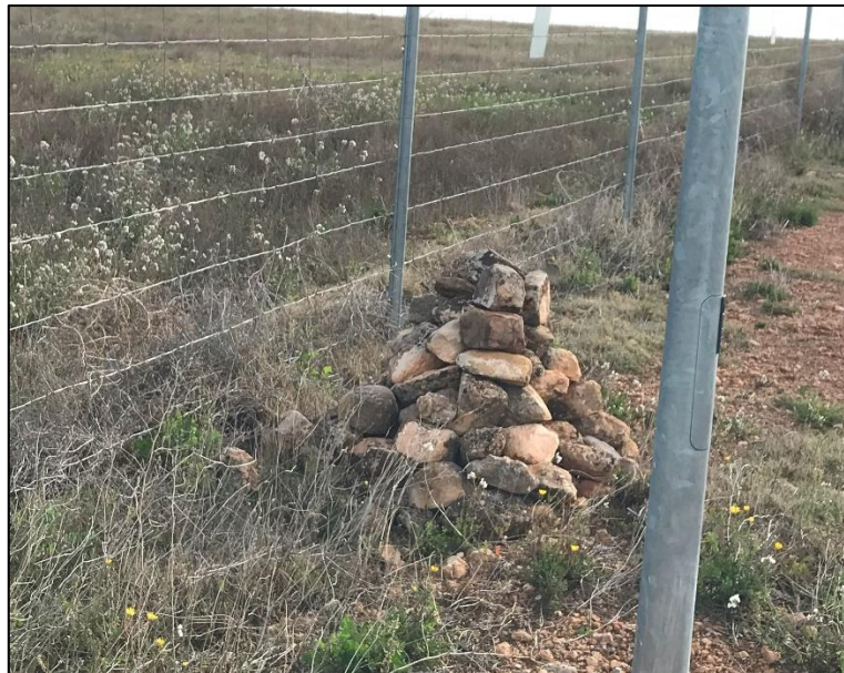
Figura 7: Ejemplo de majano instalado en el interior del perímetro de la instalación.

Los majanos instalados en el interior del perímetro con el objetivo de constituir refugios para la fauna se encuentran en general en buenas condiciones, aunque unos pocos se han derrumbado parcialmente a lo largo de los últimos meses. Durante las visitas no se ha observado actividad de fauna en ninguno de ellos.